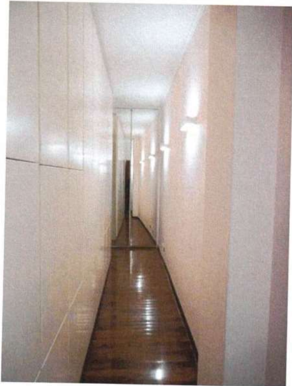
Corridoio non autorizzato Disimpegno non a Norma