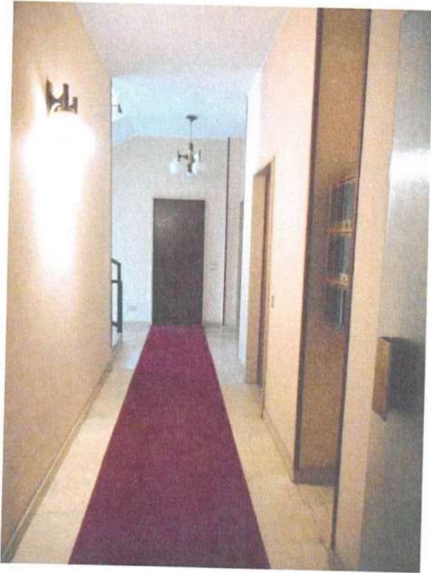
Disimpegno al piano