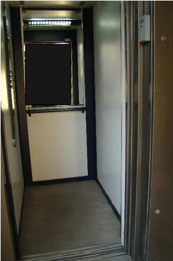
6. Dettaglio dell'ascensore.