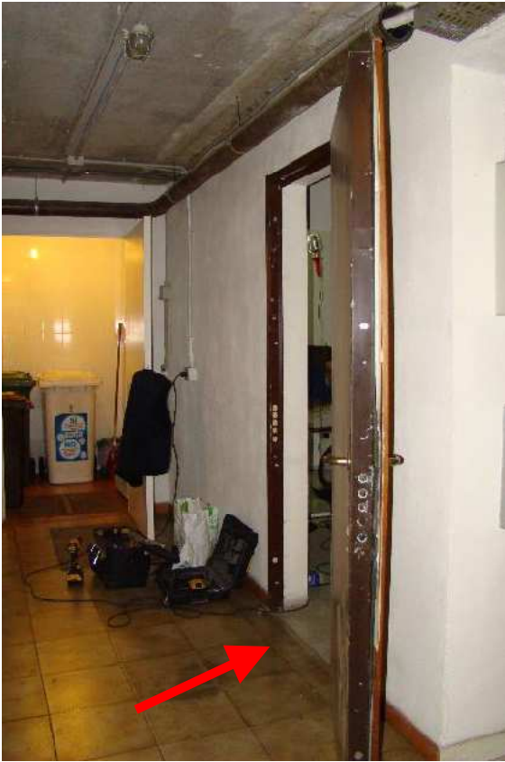
7. Indicazione della porta del locale condominiale tramite cui si accede al deposito.