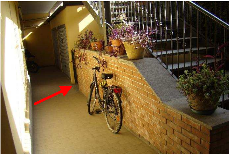
4. Indicazione dell'accesso alla scala che conduce al piano interrato.