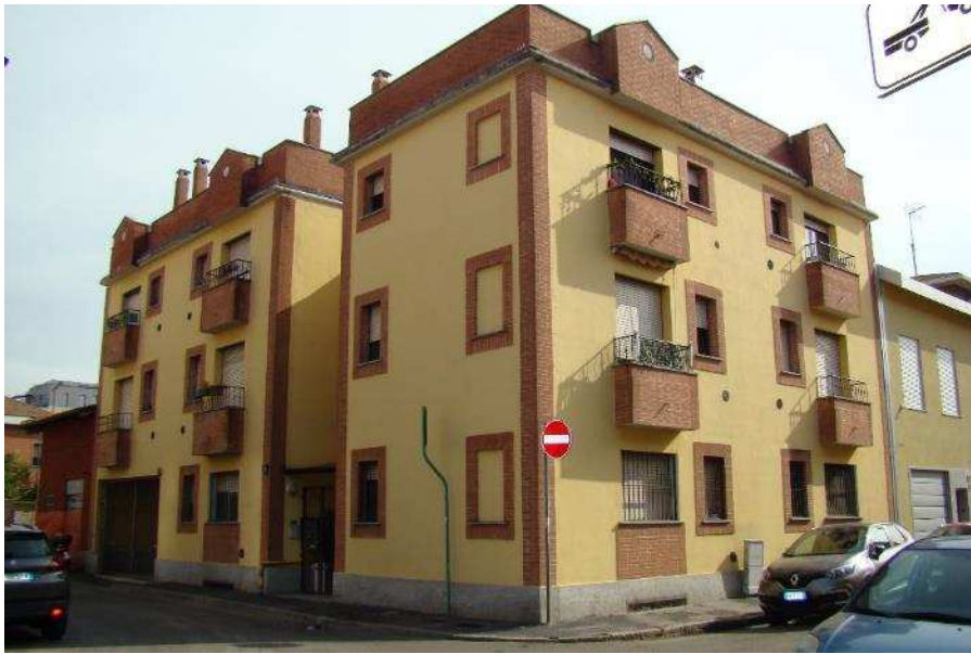
1. Rilievo fotografico del contesto. Vista su strada con indicazione dell'accesso pedonale.