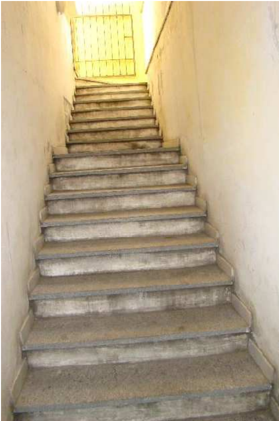
5. Dettaglio della scala.