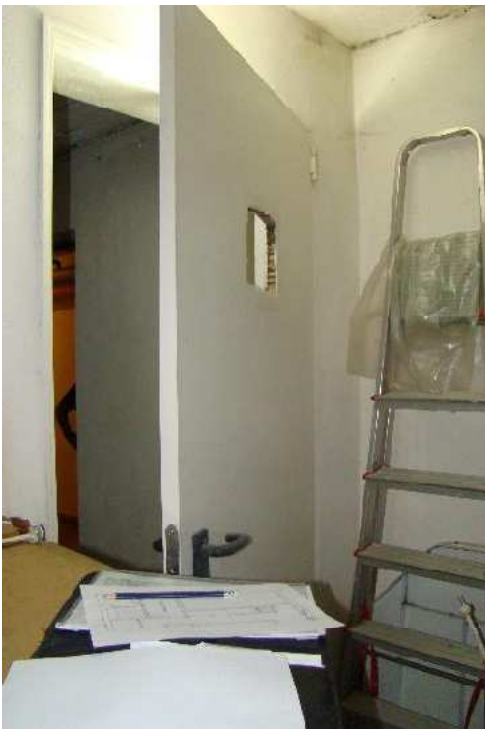
10. Vista interna verso la porta di accesso.