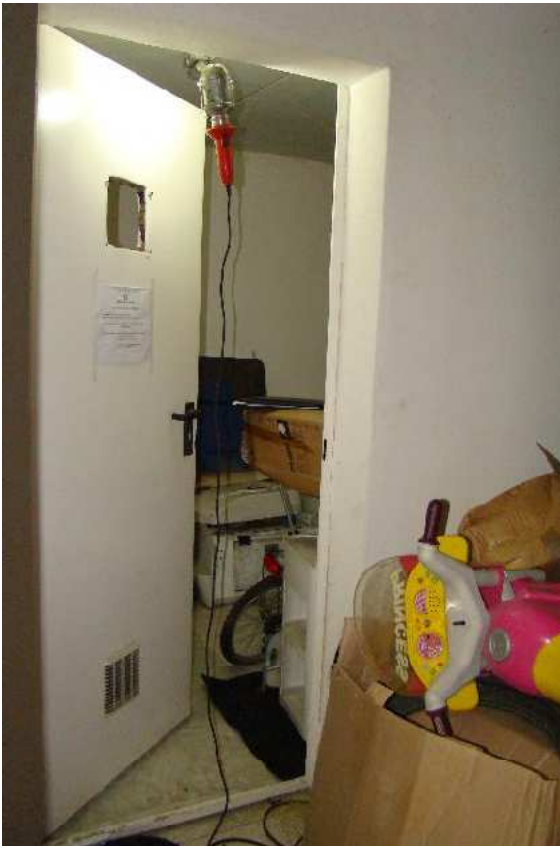
8. Dettaglio della porta di accesso al locale deposito.