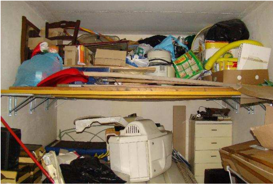
11. Dettaglio della mensola realizzata.