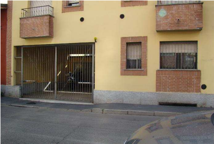
3. Dettaglio dell'ingresso carrabile.