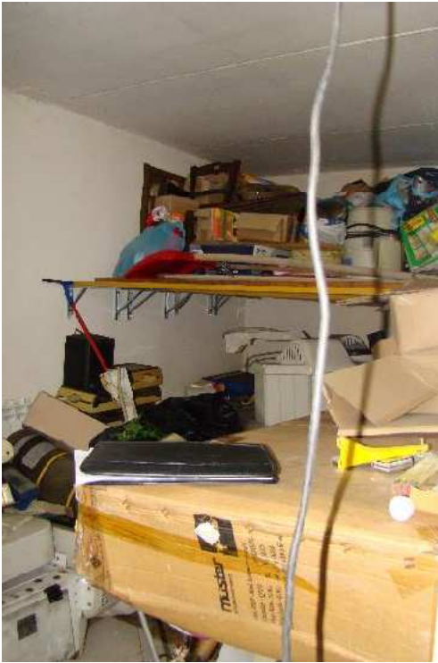
9. Vista interna del deposito.