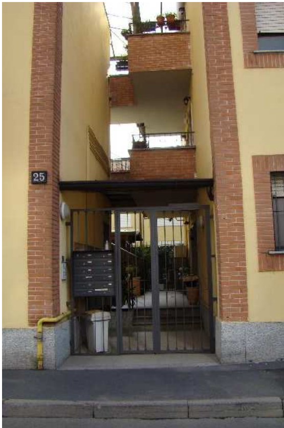
2. Dettaglio dell'ingresso pedonale.