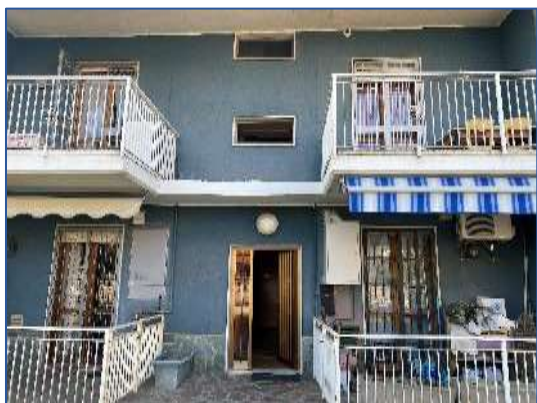
Foto 3 - immobile di via Matteotti n. 26