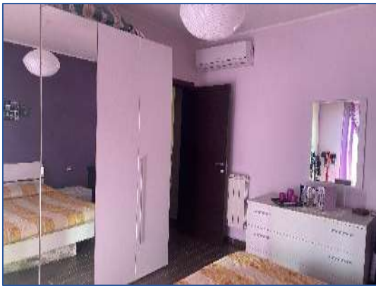
Foto 27 - camera