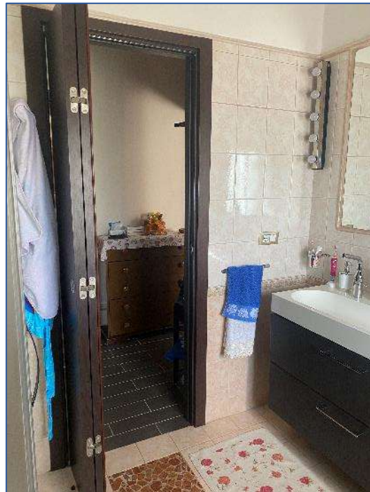
Foto 24 - bagno