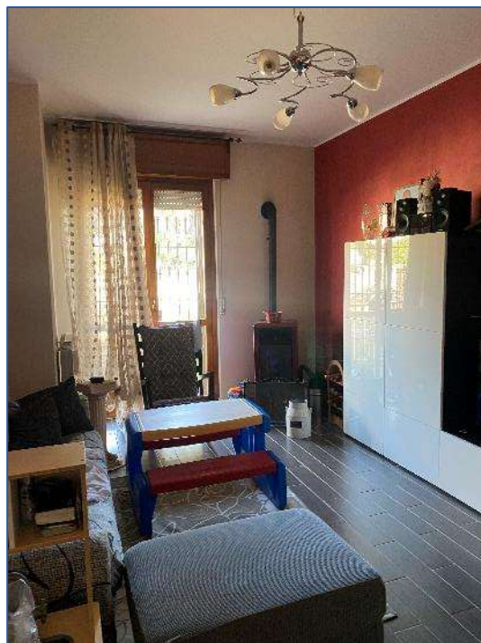
Foto 16 - soggiorno