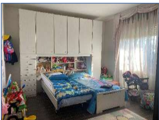
Foto 19 - camera