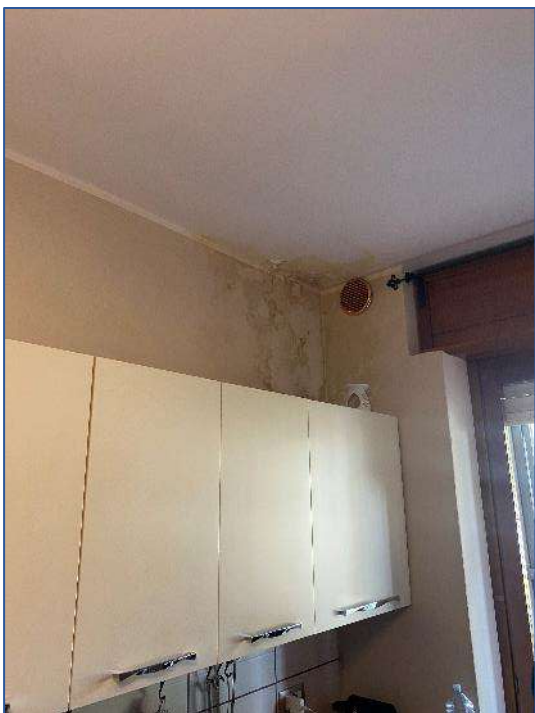
Foto 15 - dettaglio cucina