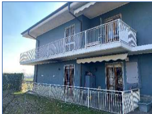
Foto 2 - immobile di via Matteotti n. 26