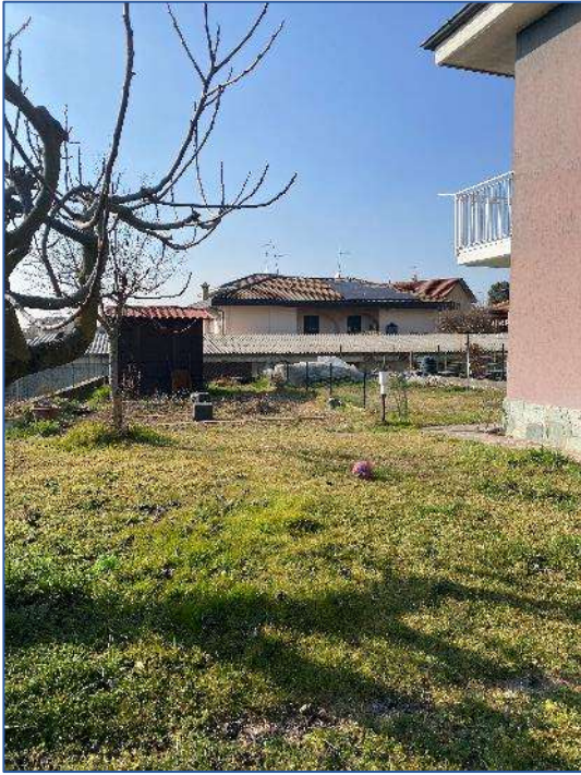
Foto 33 - area esterna di proprietà