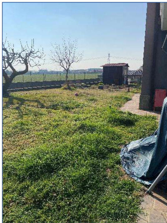
Foto 32 - area esterna di proprietà