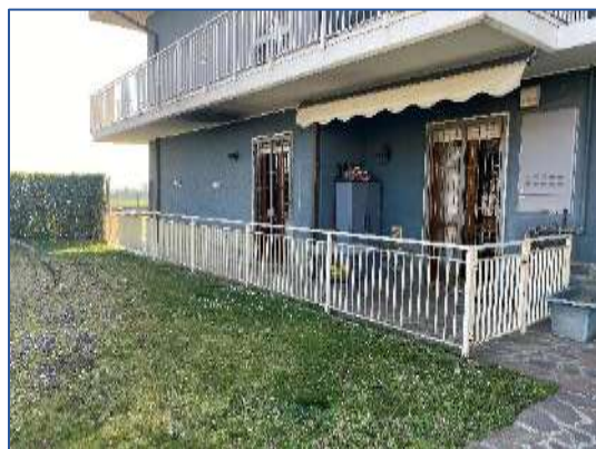
Foto 4 - immobile di via Matteotti n. 26