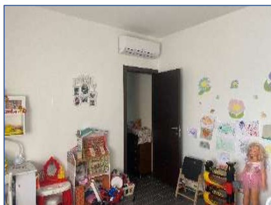
Foto 20 - camera