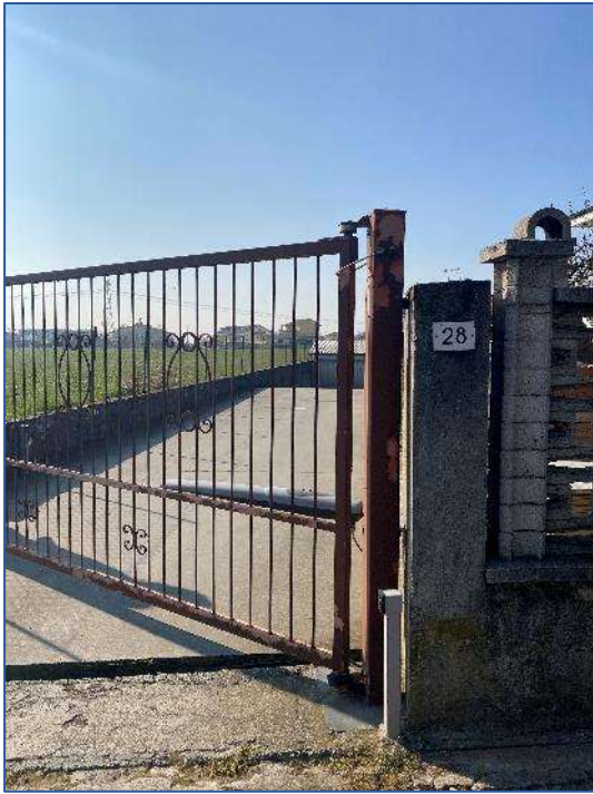
Foto 7 - accesso comune ai box - via Matteotti 28