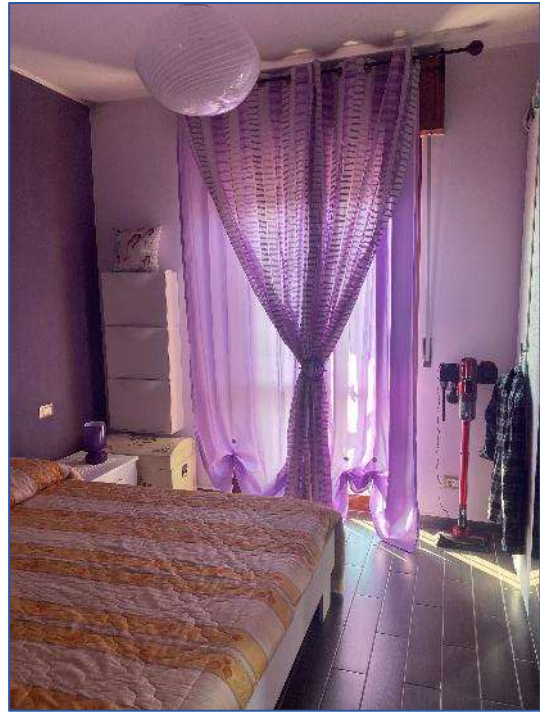
Foto 26 - camera