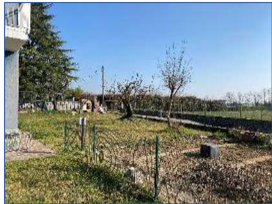
Foto 36 - area esterna di proprietà