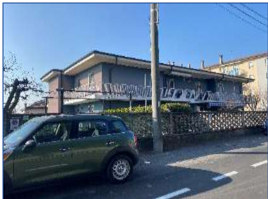
Foto 1 - immobile di via Matteotti n. 26