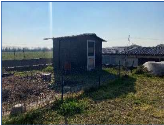
Foto 35 - area esterna di proprietà