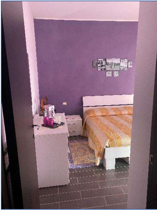
Foto 25 - camera