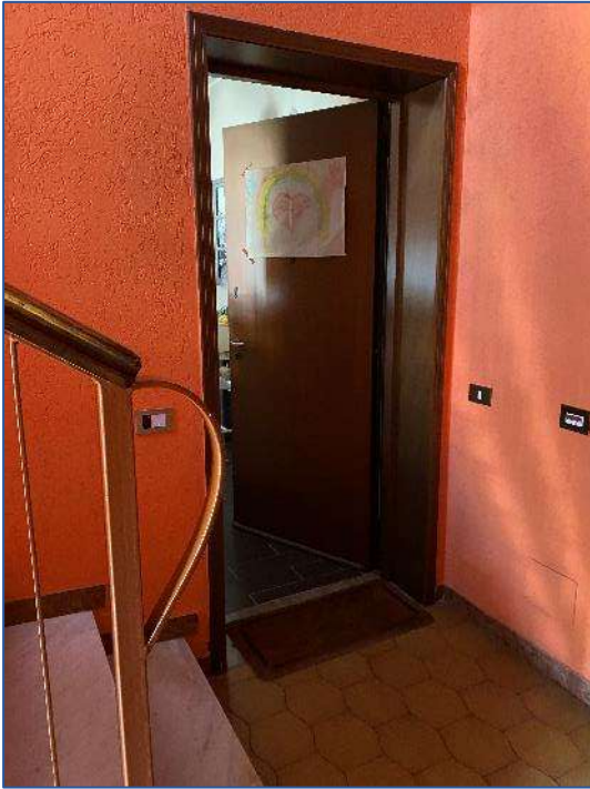
Foto 11 - ingresso appartamento