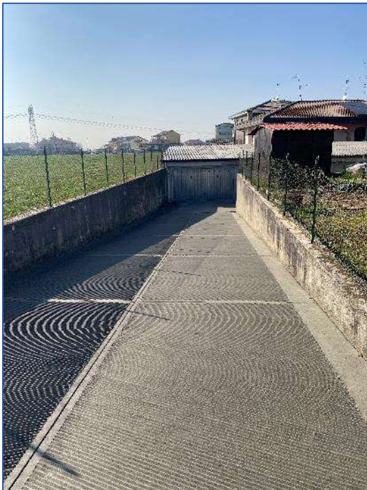
Foto 9 - rampa comune accesso box