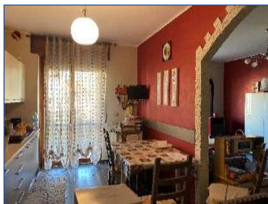
Foto 18 - soggiorno