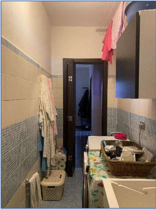
Foto 29 - bagno