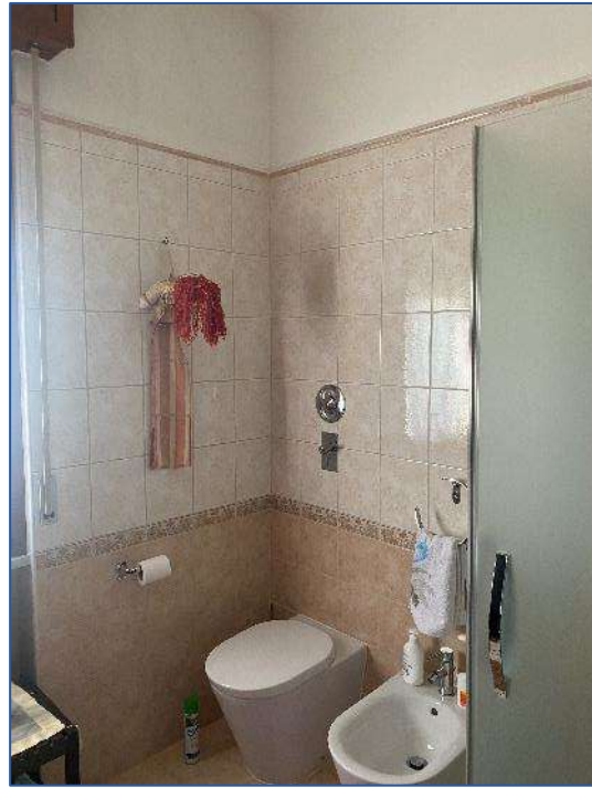
Foto 22 - bagno