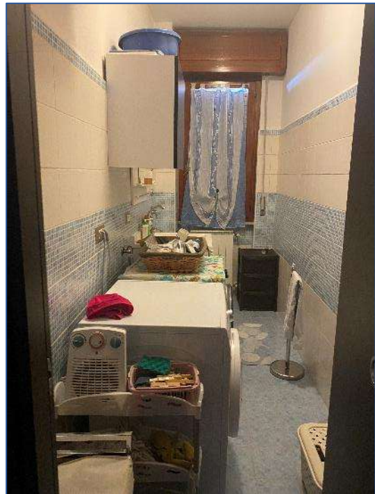
Foto 28 - bagno