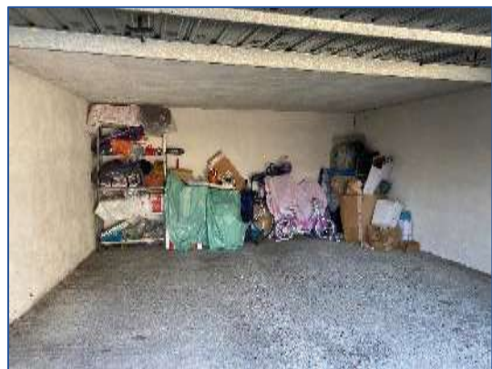
Foto 40 - box