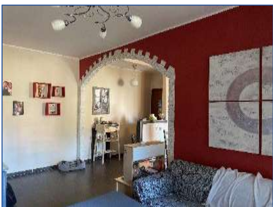
Foto 17 - soggiorno