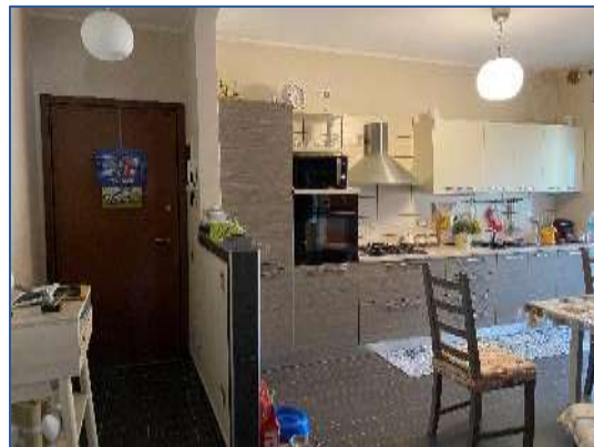
Foto 14 - cucina