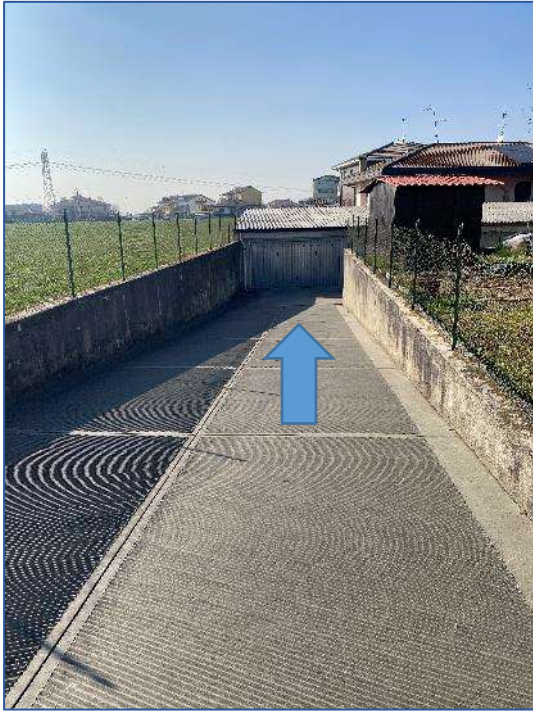
Foto 37 - accesso al box