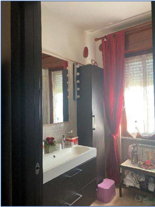
Foto 21 - bagno