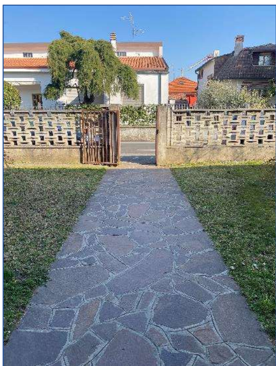
Foto 5 - spazi comuni esterni di accesso