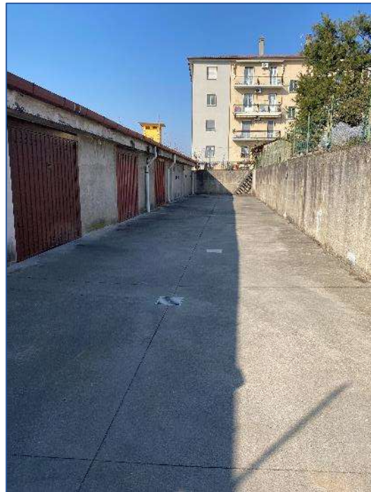
Foto 10 - spazi comuni di manovra