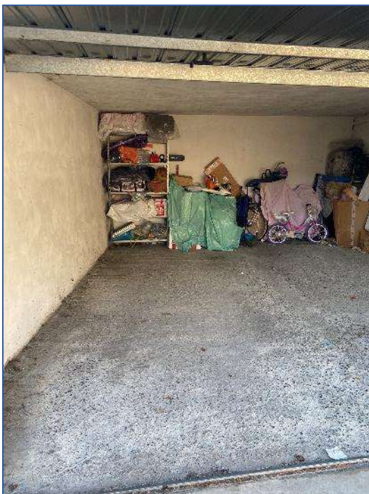
Foto 39 - box