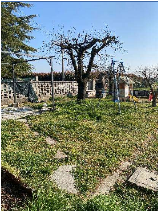
Foto 31 - area esterna di proprietà