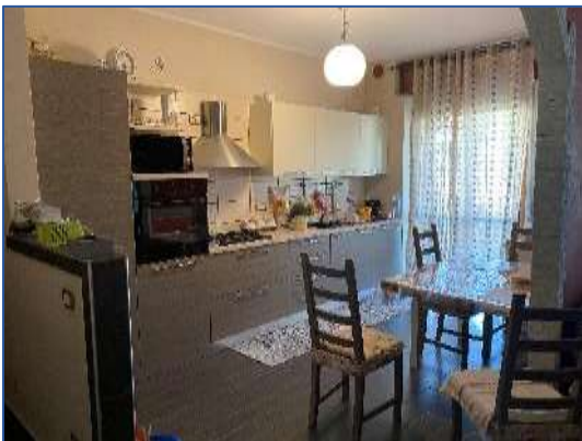
Foto 13 - cucina