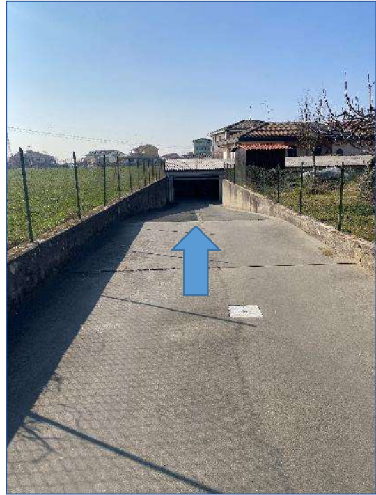
Foto 38 - accesso al box