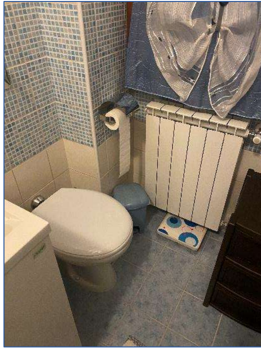
Foto 30 - bagno