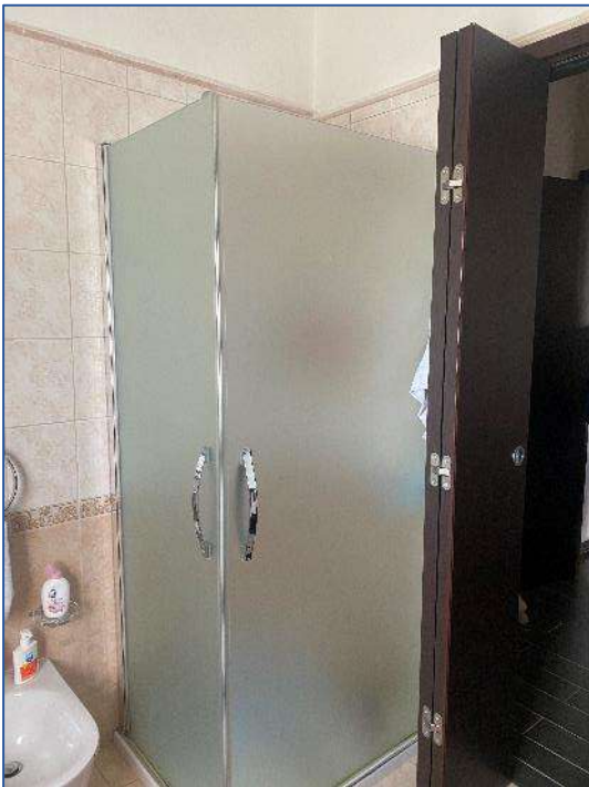
Foto 23 - bagno