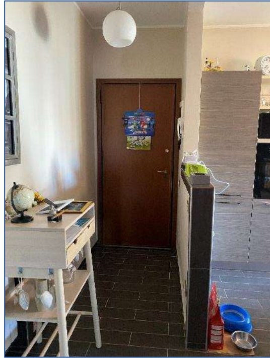
Foto 12 - ingresso appartamento