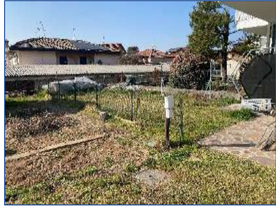
Foto 34 - area esterna di proprietà