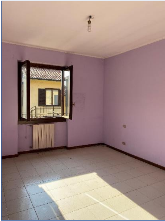
Foto 13 - camera