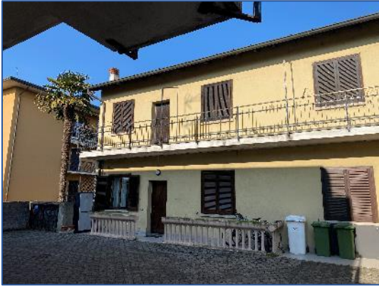
Foto 5 - spazi comuni