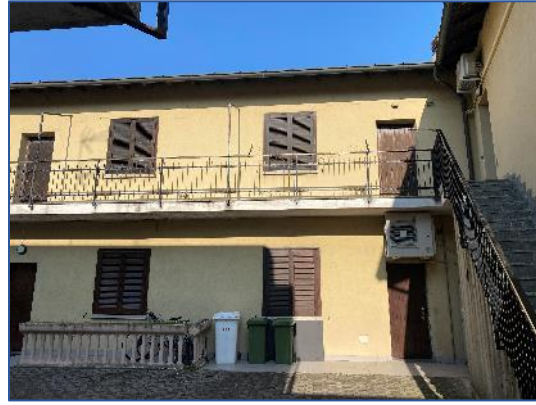
Foto 6 - spazi comuni