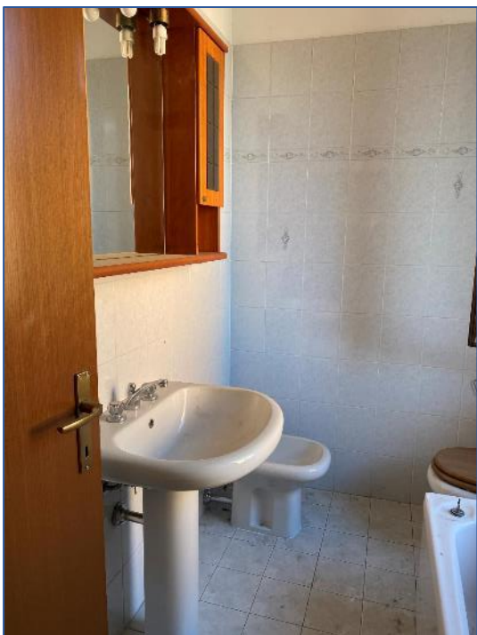
Foto 17 - bagno