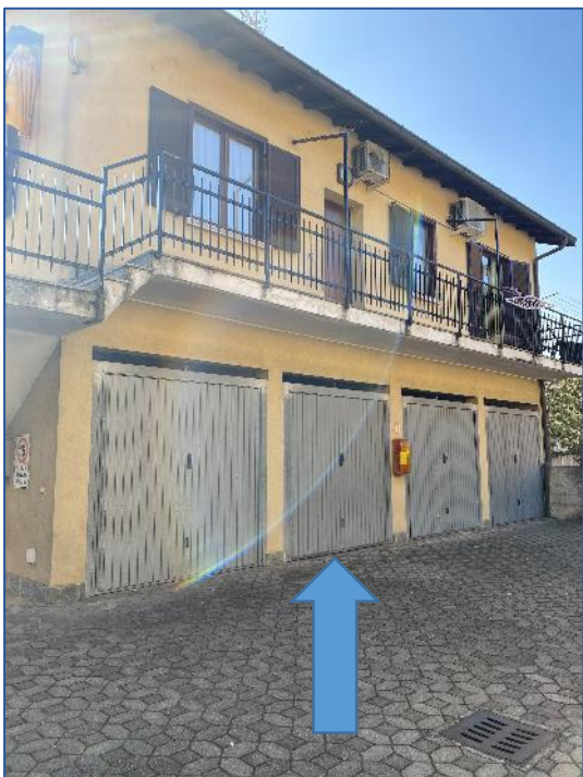
Foto 19 - ingresso box