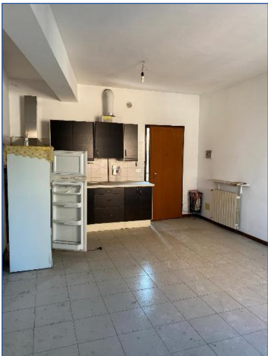
Foto 9 - ingresso su soggiorno-cucina