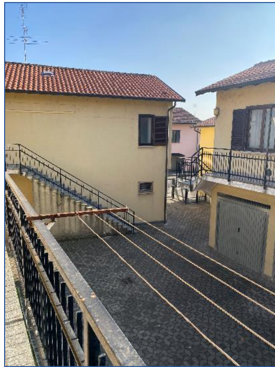
Foto 8 - corte comune