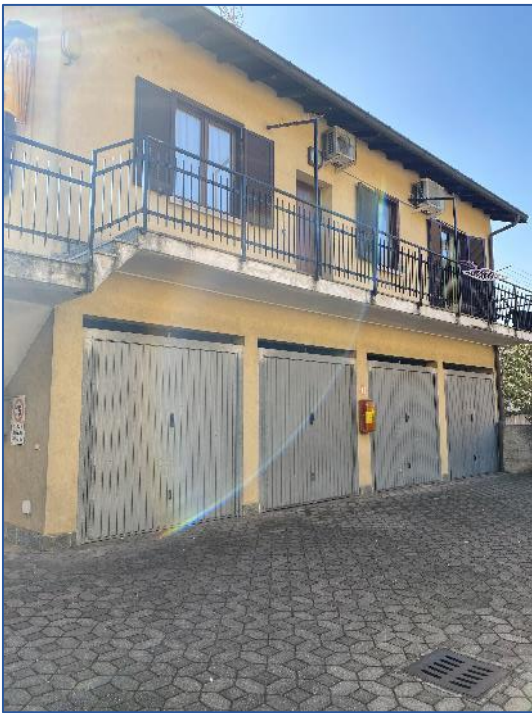
Foto 7 - corte comune