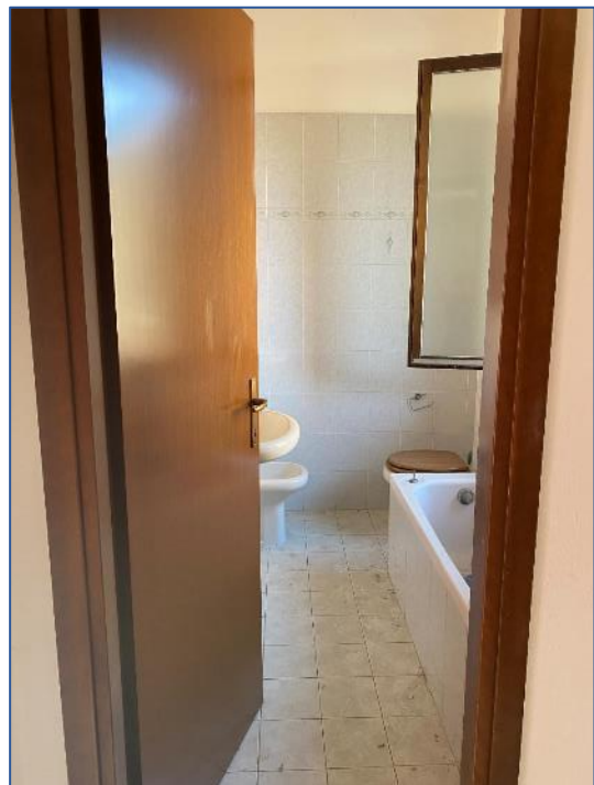
Foto 16 - bagno