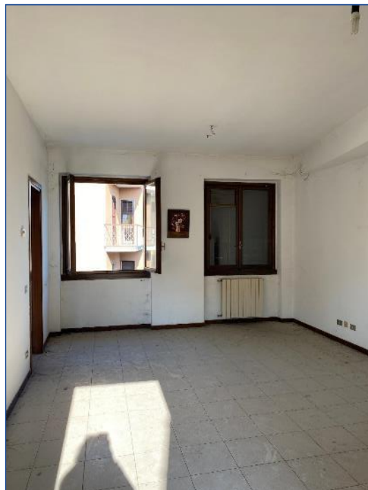
Foto 10 - soggiorno-cucina