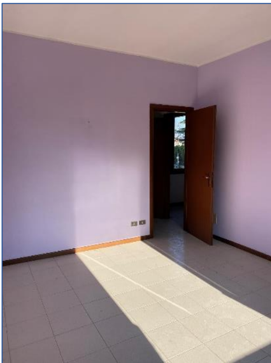
Foto 15 - camera