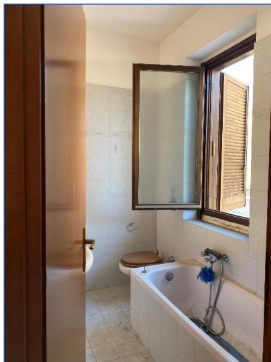
Foto 18 - bagno