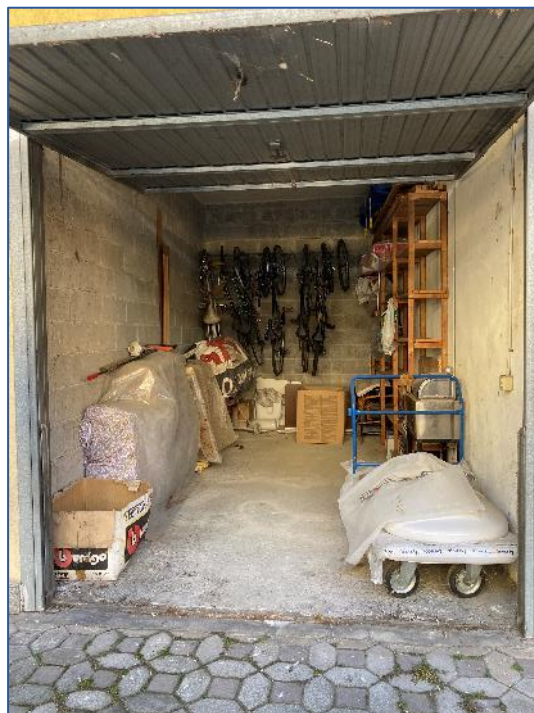
Foto 20 - box