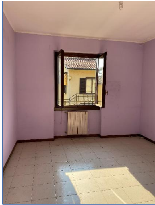
Foto 14 - camera