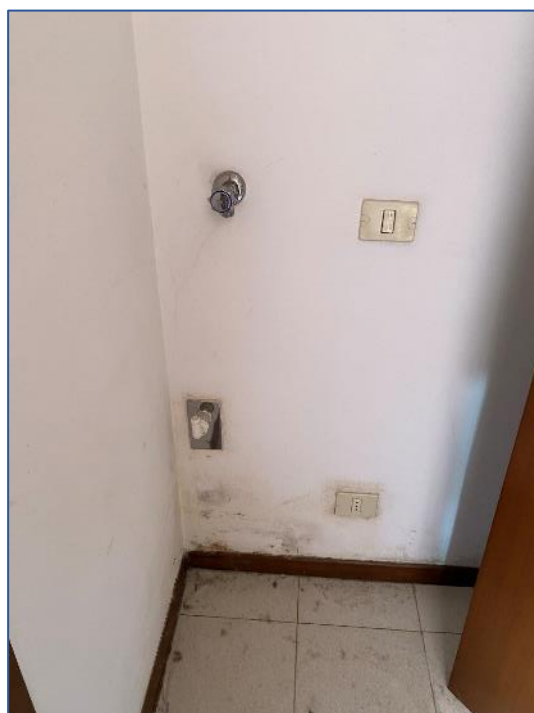
Foto 12 - disimpegno