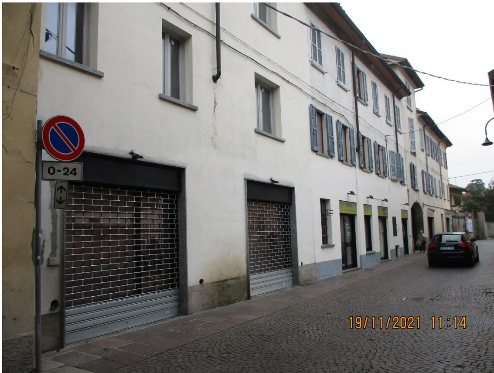
Vista della porzione di fabbricato da Via Piave con vetrine negozio