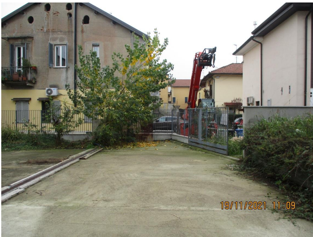
Vista del fabbricato lato cortile e cortile