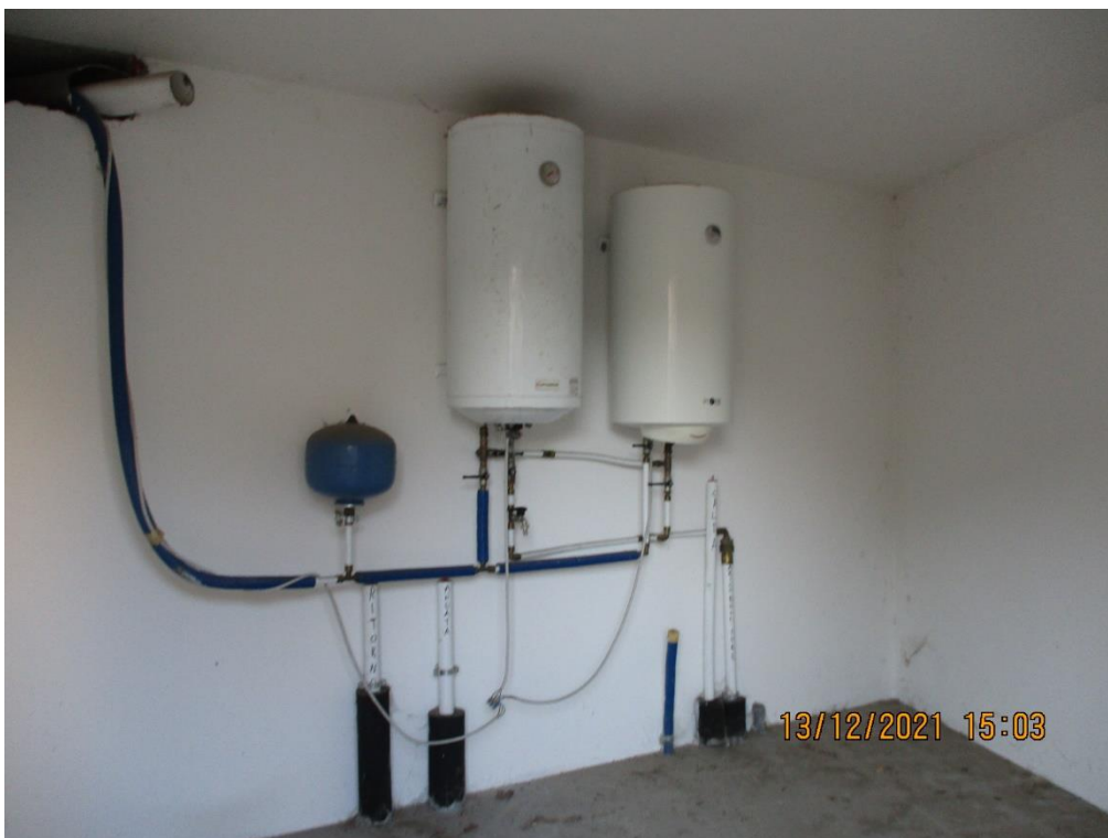
Fabbricato nel cortile interno con locali caldaia, rifiuti e cantine