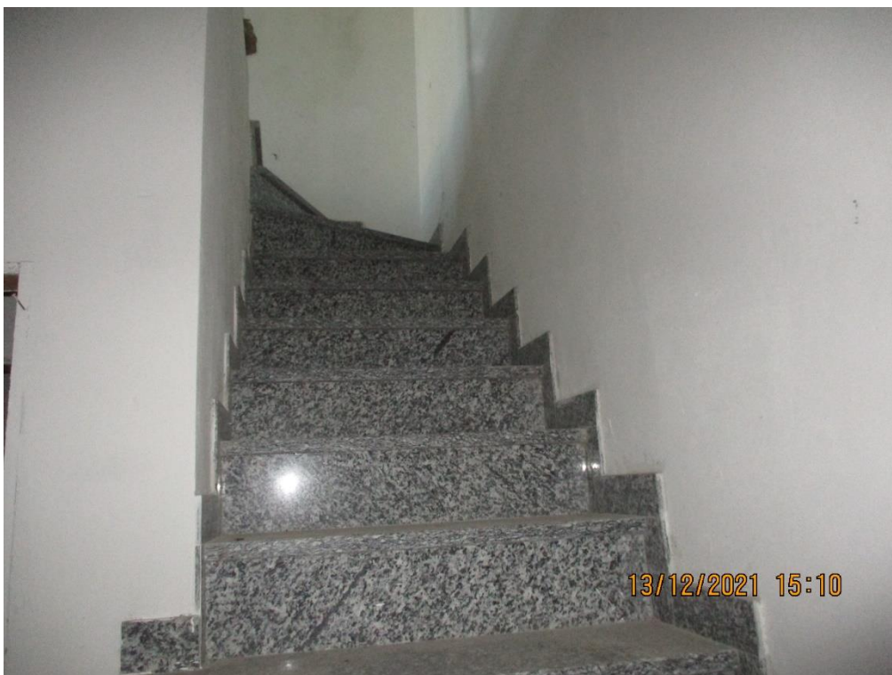
Vano scala- ascensore comune