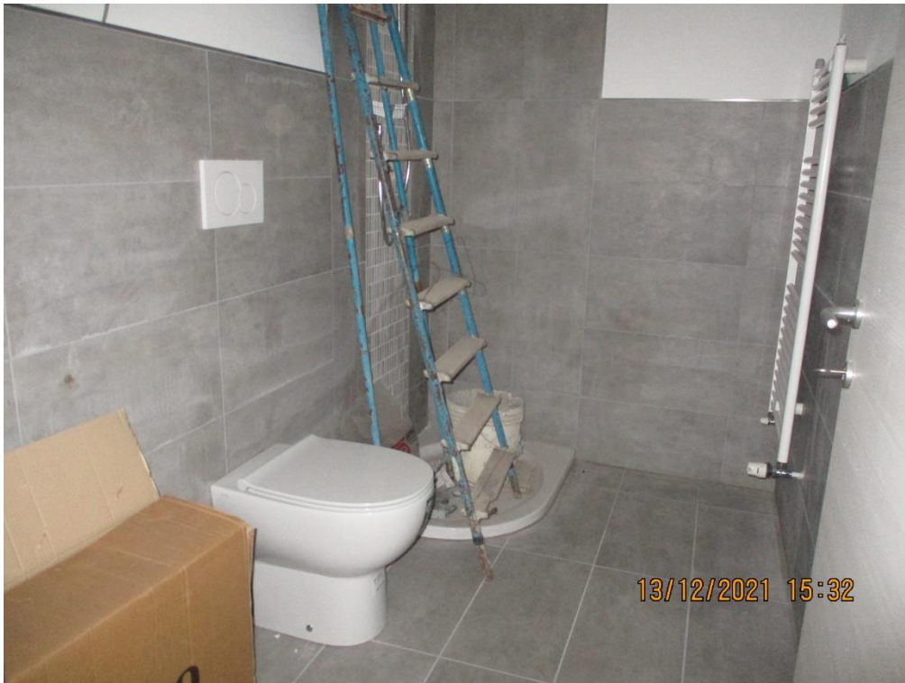
Appartamento piano terra-primò sub.721