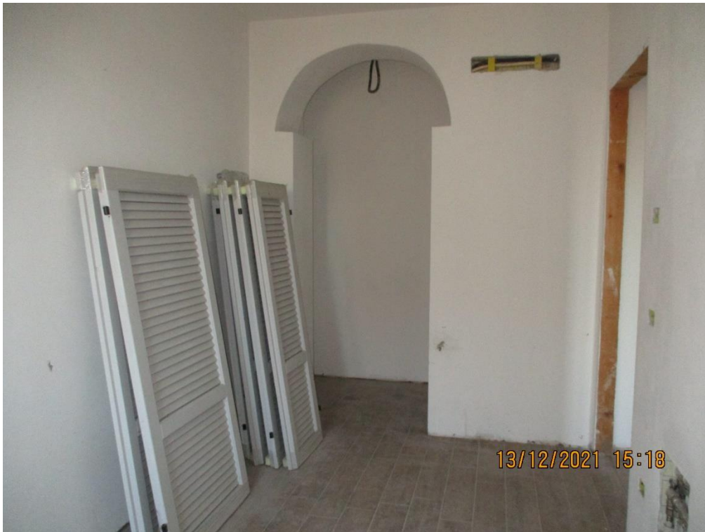
Appartamento piano 2-3-4 sottotetto sub.724