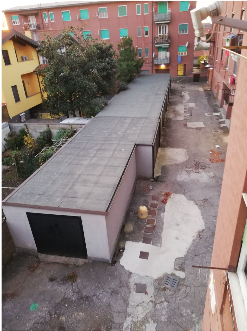
Vista posteriore fabbricato con accesso al cortile da via Stella e box, facciata anteriore con accesso al fabbricato n. civico 2