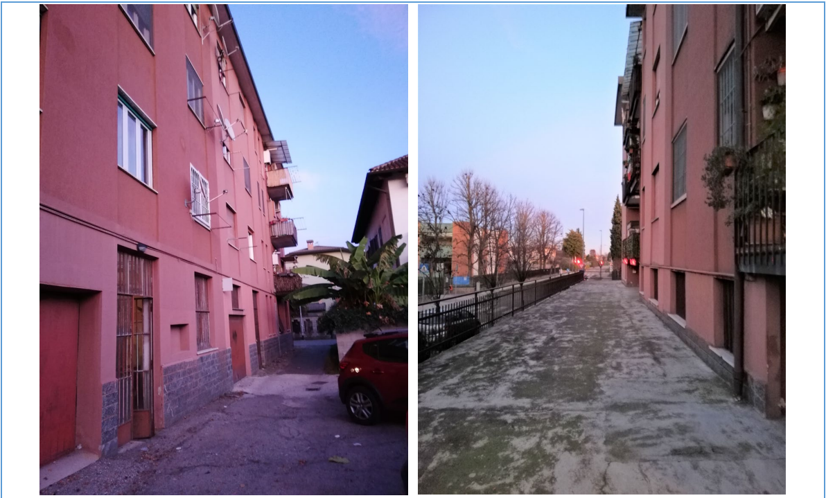
Vista posteriore fabbricato con accesso al cortile da via Stella, facciata anteriore con accesso principale via Milano