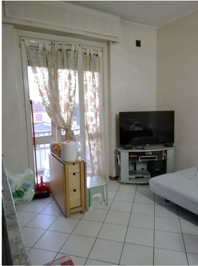
Soggiorno/cottura e camera