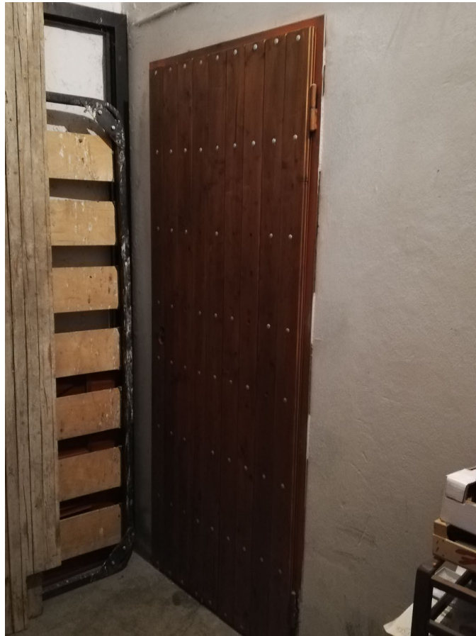
Cantina e box