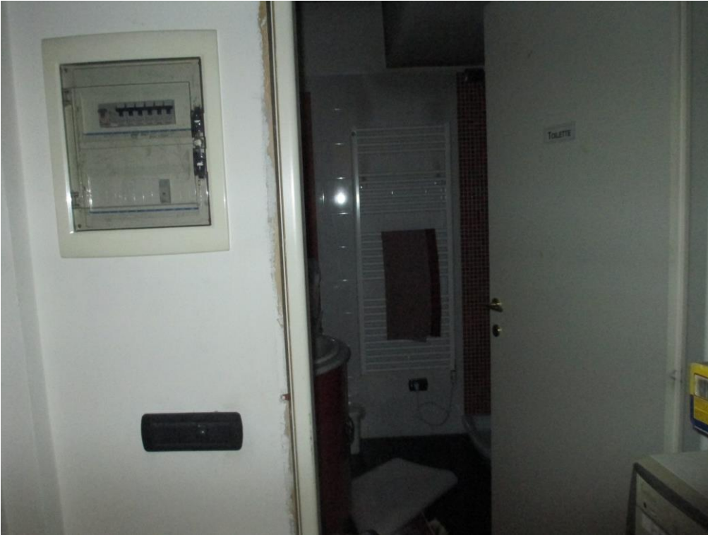
Foto 7: locale bagno – quadro elettrico comune ad entrambe le unità