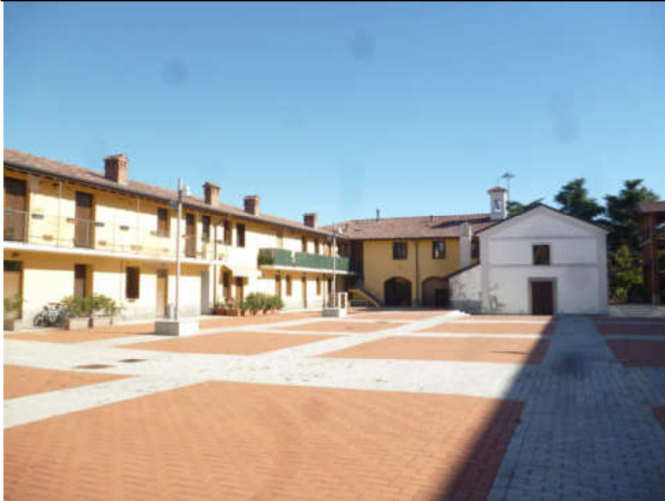
FOTO 1 – Cascina San Nabor corte interna con affaccio dei corpi NORD ed EST con Chiesa di San Nabore e San Felice