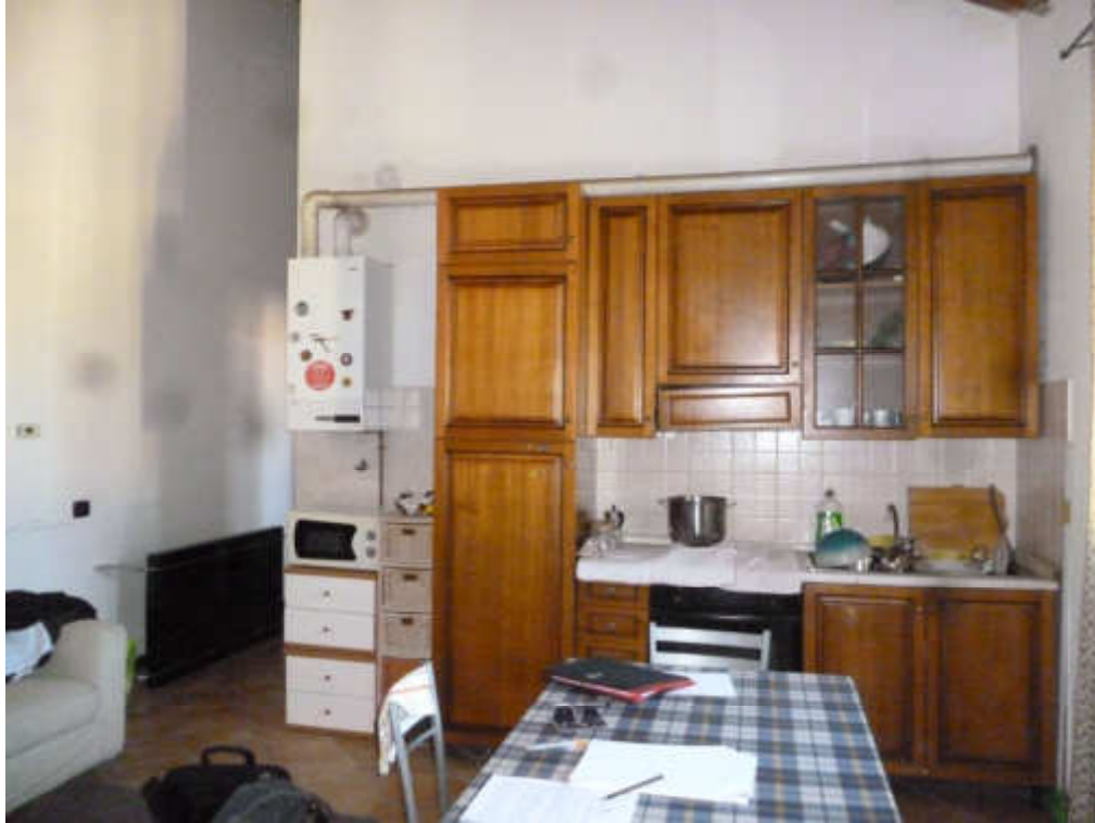
FOTO 19 – Soggiorno con angolo cottura ed accesso al corridoio mancante di muratura e porta