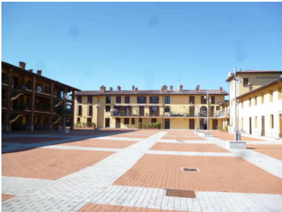
FOTO 2 – Cascina San Nabor corte interna con affaccio dei corpi SUD, OVEST e NORD