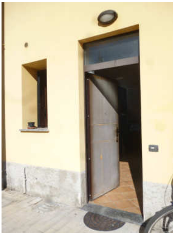
FOTO 4 – Ingresso all'unità, sita nel corpo NORD, dalla corte comune.