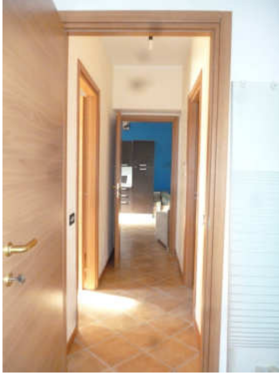
FOTO 7 – Disimpegno visto da una camera e, sullo sfondo il soggiorno.