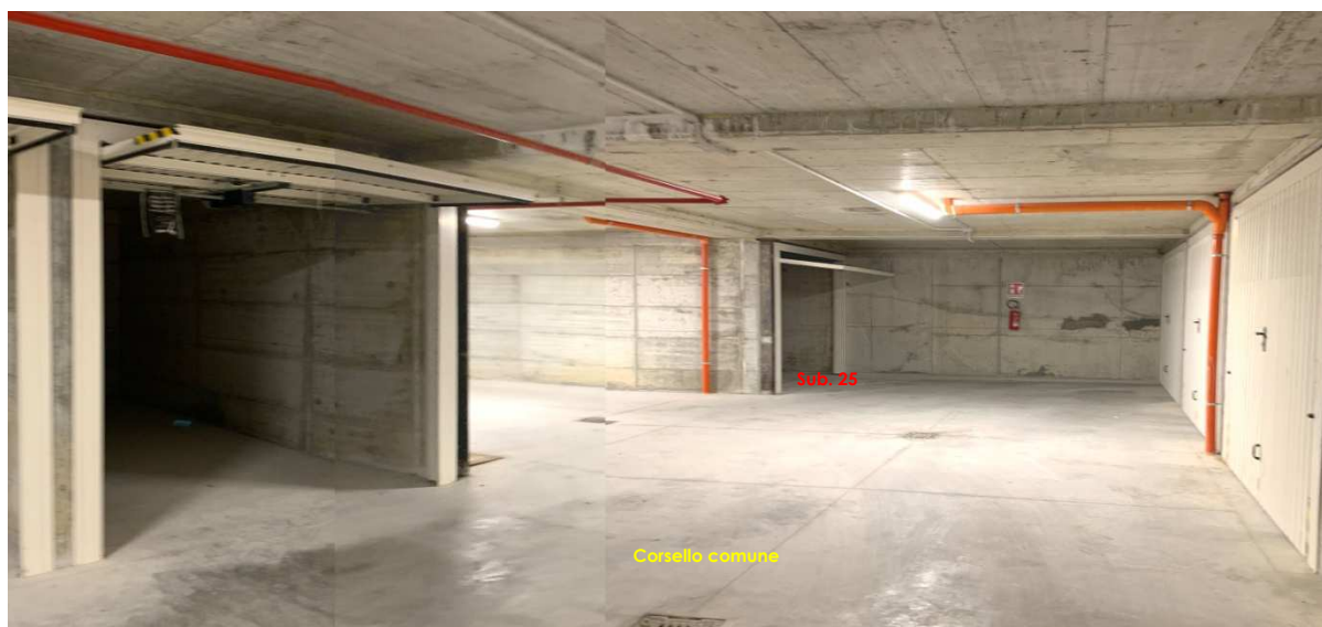
Foto nn. 11-12. Piano Secondo Interrato. Box auto (fg. n. 471 ptc. n. 413 sub. n. 25)