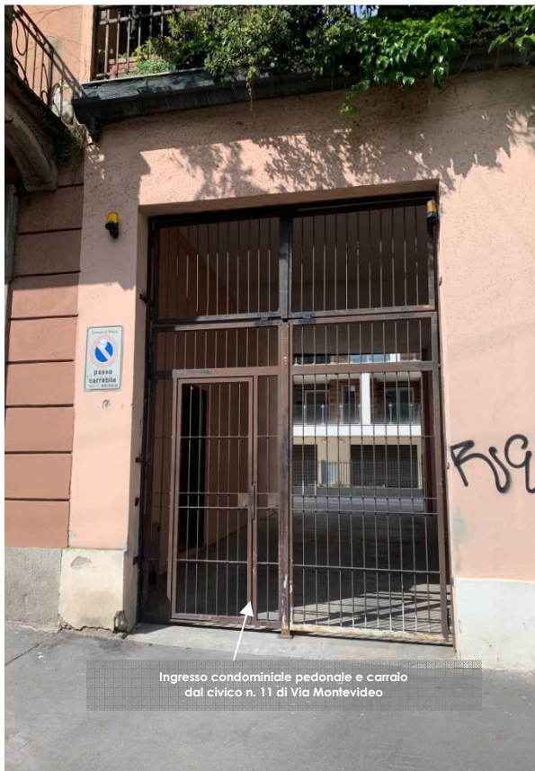
Ingresso condominiale pedonale e carroia dal civico n. 11 di Via Montevideo