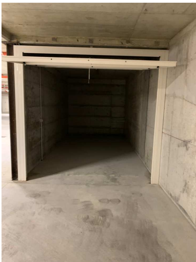
Foto nn. 13-14. Piano Secondo Interrato. Box auto pag. 4