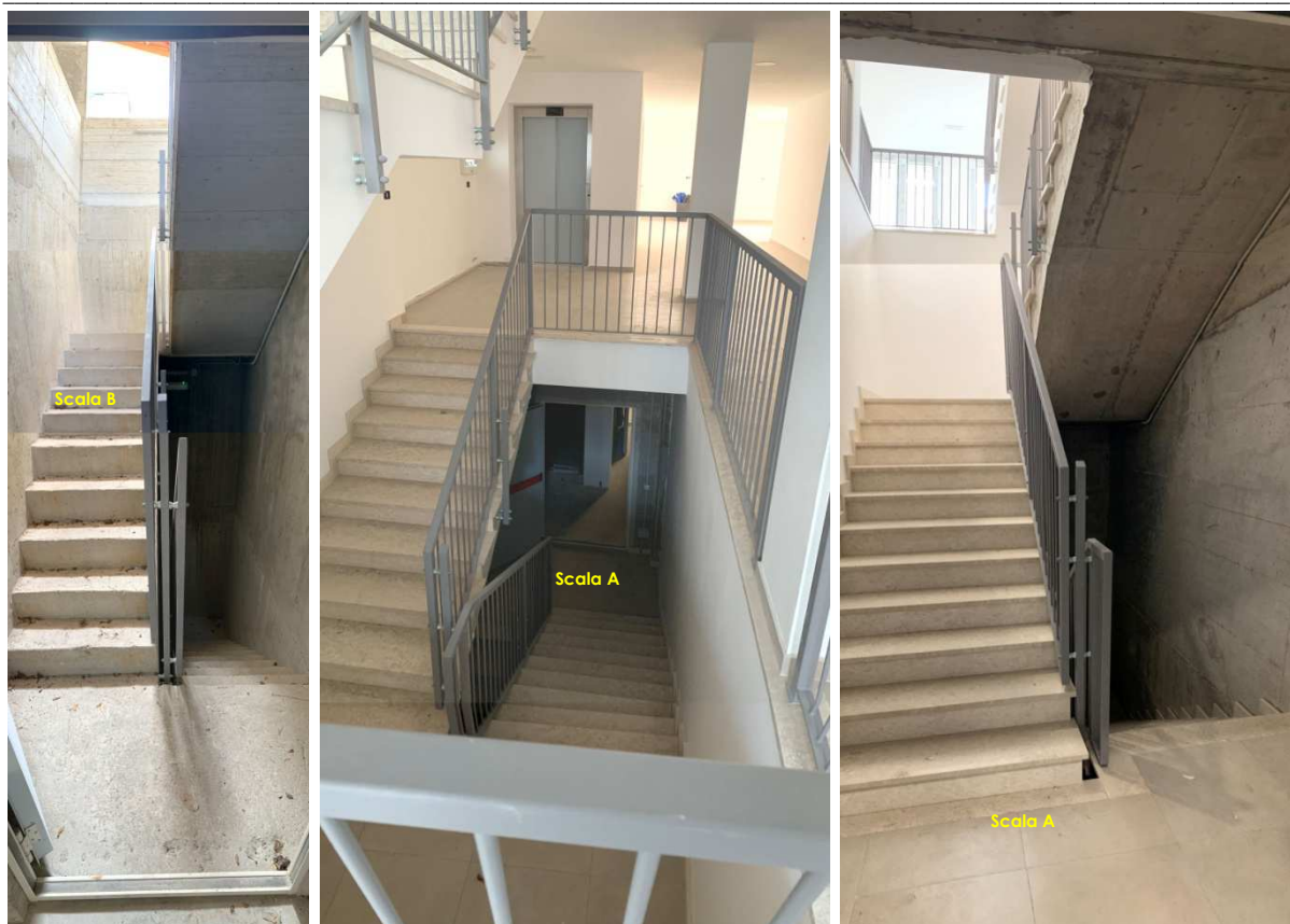
Foto nn. 8-9-10. Scale comuni (scale A e B) di collegamento ai piani interrati