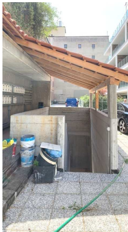
Foto nn. 4-5-6-7. Box auto al piano S1, facente parte integrante della palazzina condominiale denominata "Residenze Parco Solari". Cortile condominiale, accesso carrabile comune ai piani interrati e scala esterna (scala B) di collegamento ai piani S1-S2