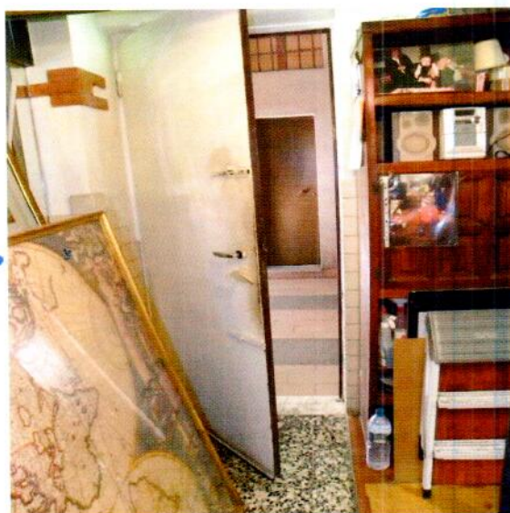
Porta d'ingresso (retro) al negozio piano terra