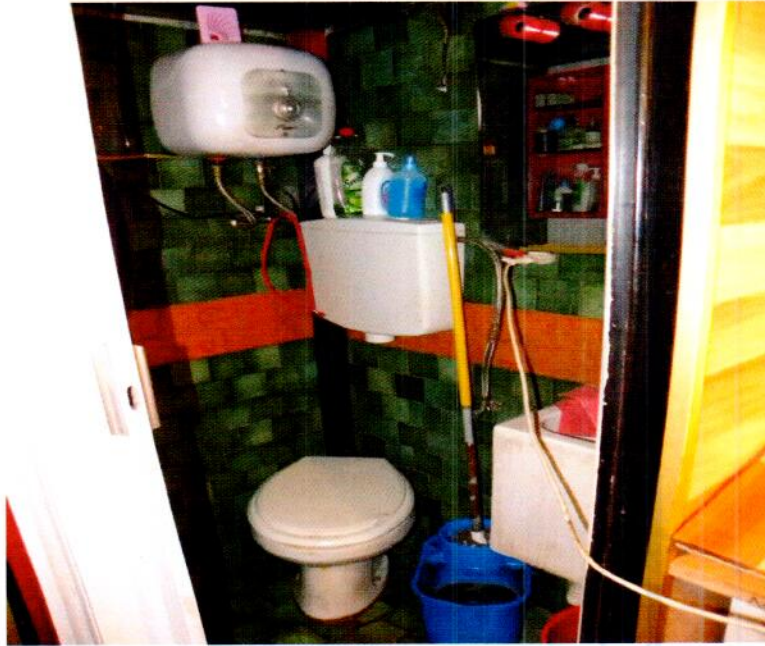
Bagno abusivo creato al piano terra del negozio