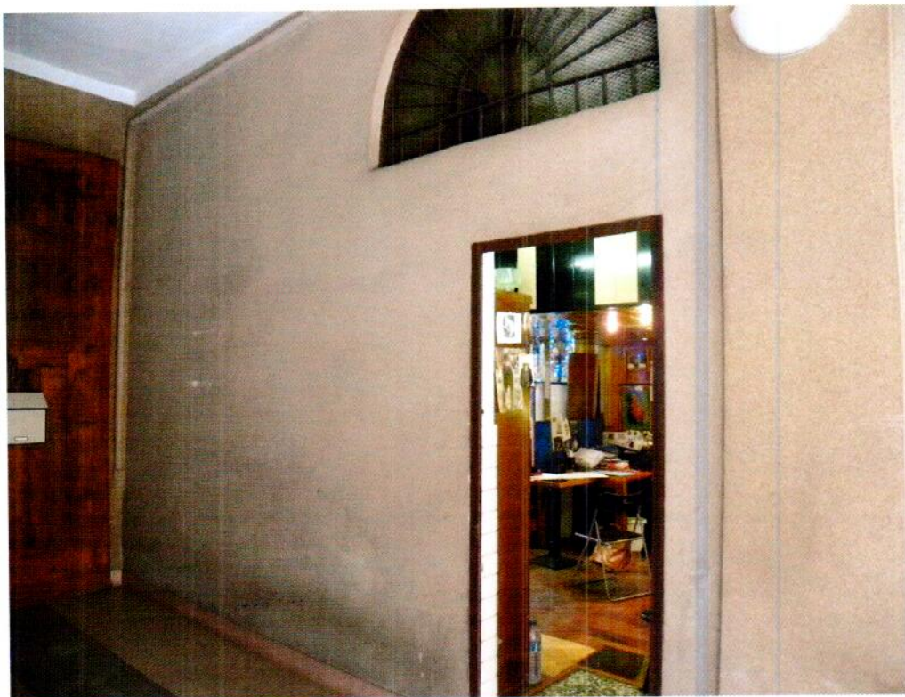
Ingresso del negozio (retro) tramite corridoio condominiale