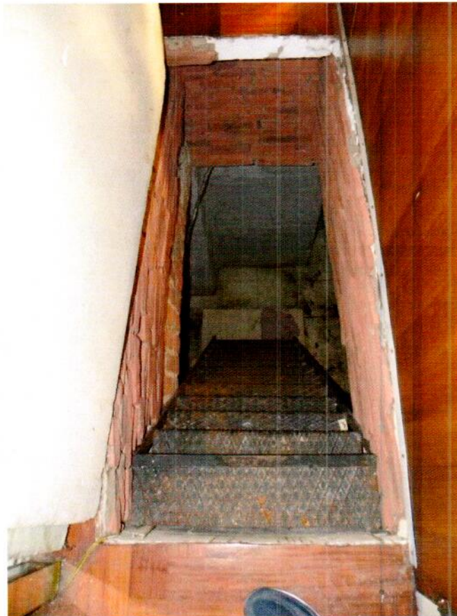
Apertura e Scala abusiva interna che porta al locale cantina/magazzino