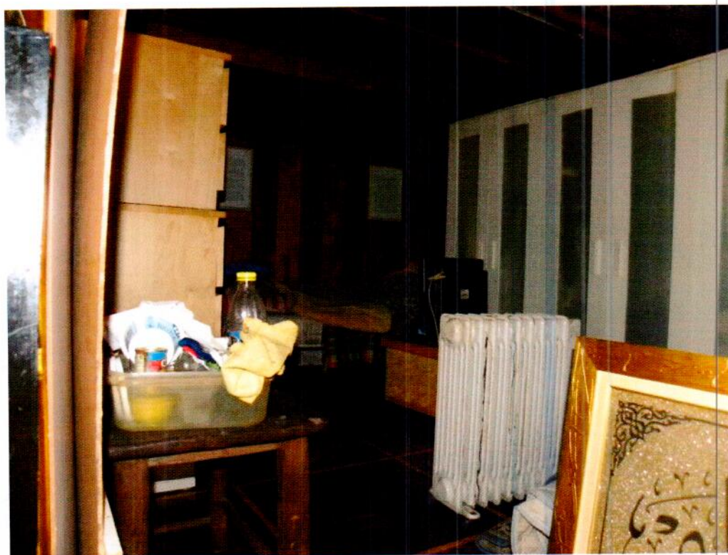
Negozio -foto 4 soppalco non dichiarato