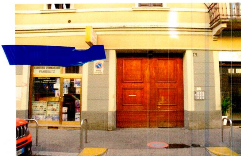
Ingresso allo stabile