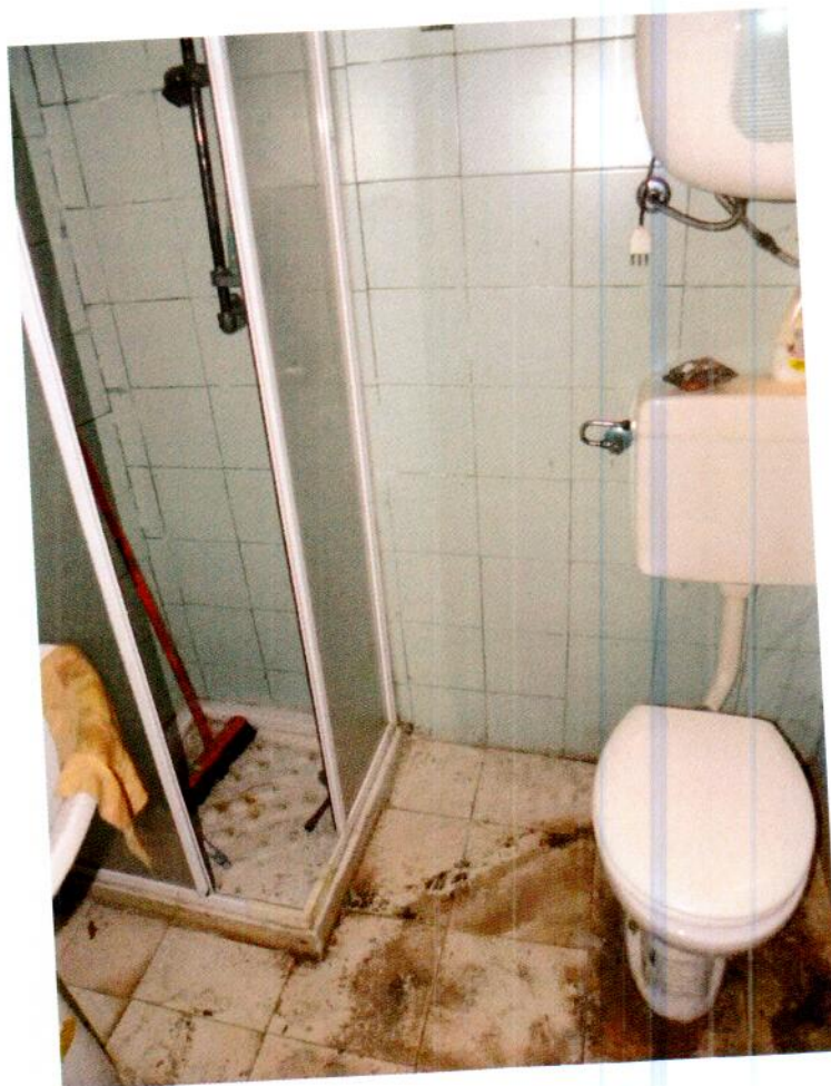
Bagno abusivo in cantina

Cel. 349/84.33.115 – mail: ing.maurizio.nobile@gmail.com Ordine degli Ingegneri della provincia di Milano n° A 24088 Alho Certificatori Energetici regione Lombardia n° 8083