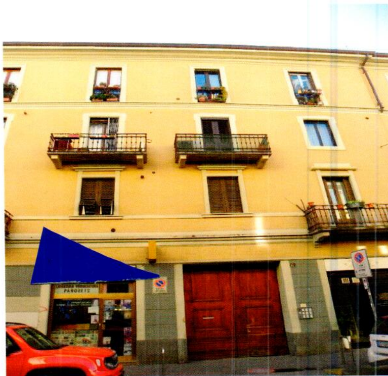
Stabile Via Paolo Frisi n.6