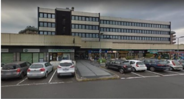
PROSPETTO VERSO VIA GANDHI