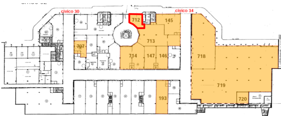
PLANIMETRIA CENTRO COMMERCIALE - PIANO S1 / localizzazione unità sub 712