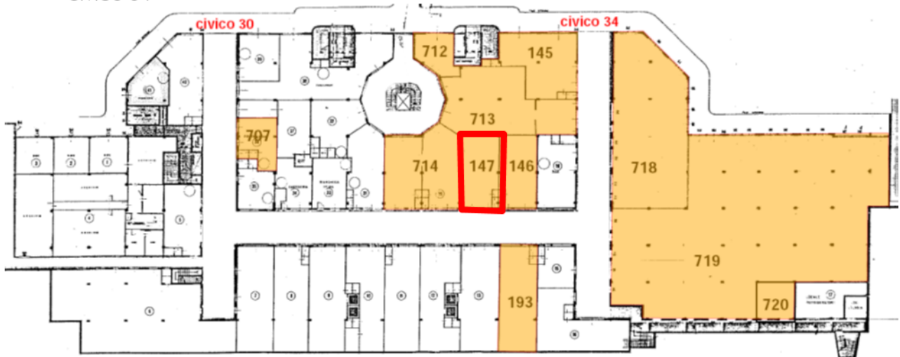
PLANIMETRIA CENTRO COMMERCIALE – PIANO S1 / localizzazione unità sub 147