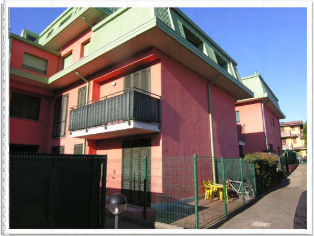
Vista esterna del giardino pensile annesso all'alloggio Sub. 45 e dell'auto rimessa Sub. 101.