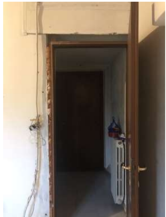
Immagini 15 e 16 e 17. Il bagno e l'antibagno.