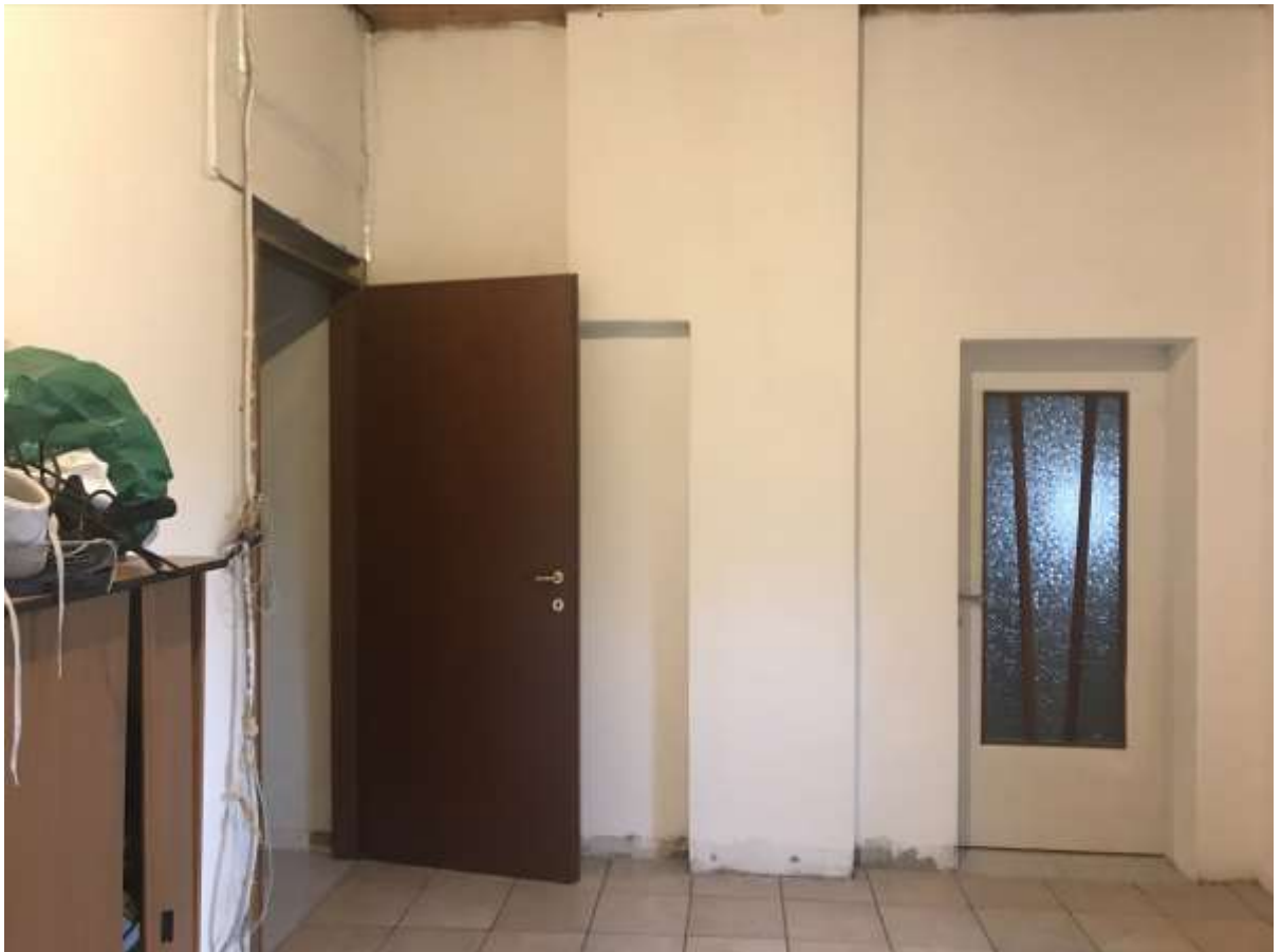
Immagini 11 e 12. Il locale passante di sbarco della scala che è collegato alla camera da letto e allo spazio antistante il bagno.