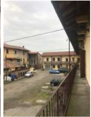
Immagini 3 e 4. Vista alla corte dal ballatoio e vista del lato opposto, aperto verso i campi.