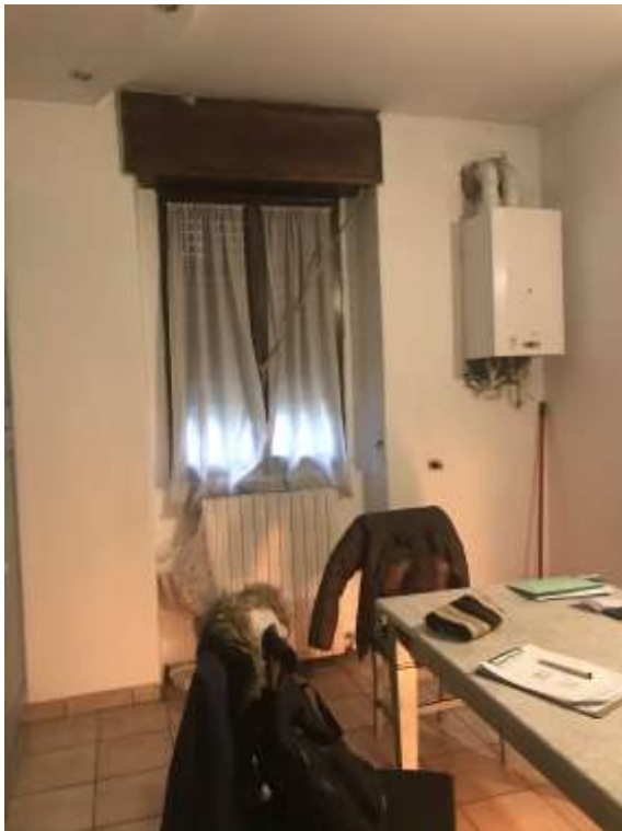
Immagini 8 e 9. L'attuale cucina.