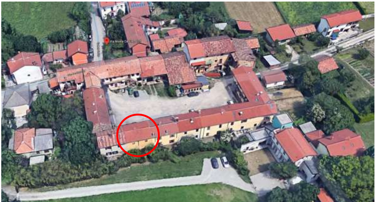
Immagine 5. Vista complessiva della corte. In evidenza, l'unità oggetto di relazione.