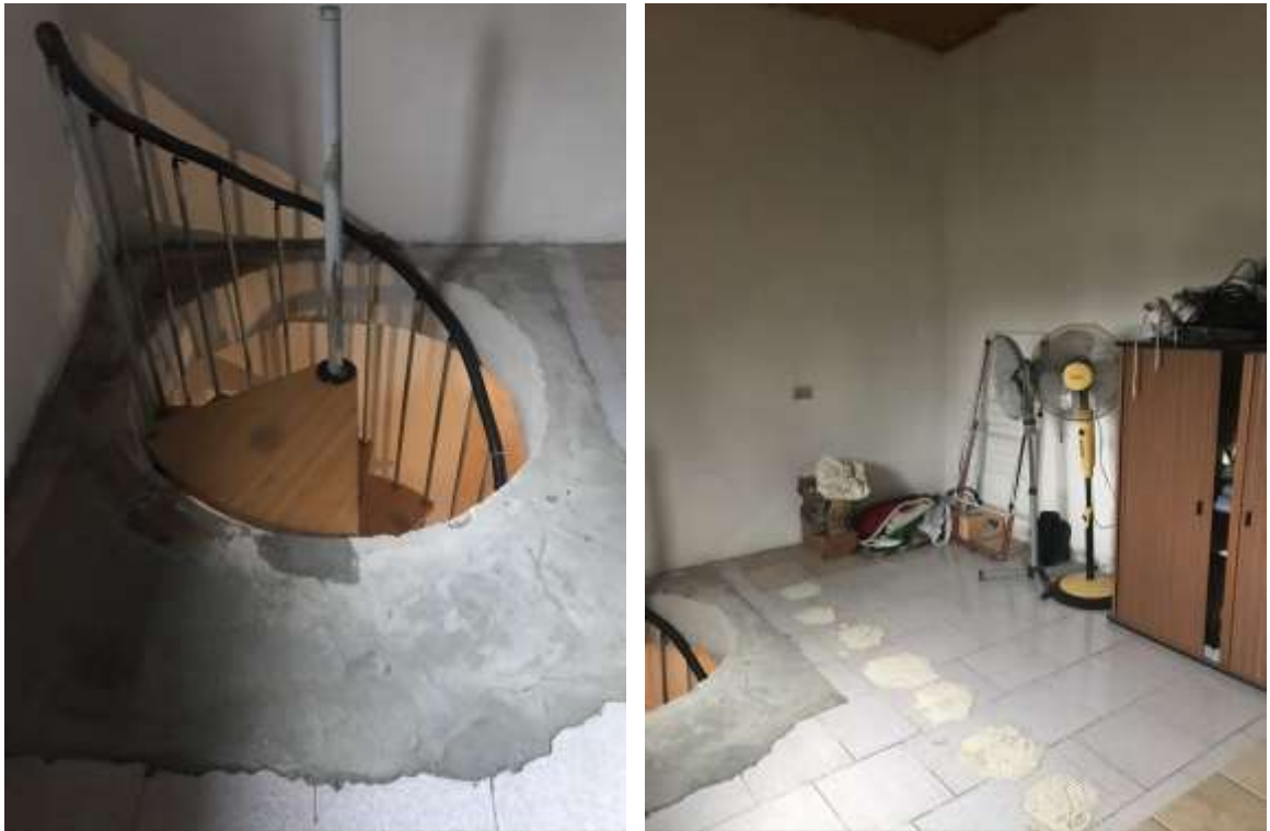
Immagine 10. Lo sbarco della scala al primo piano.