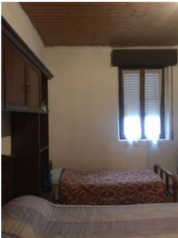
Immagini 13 e 14. La camera da letto.