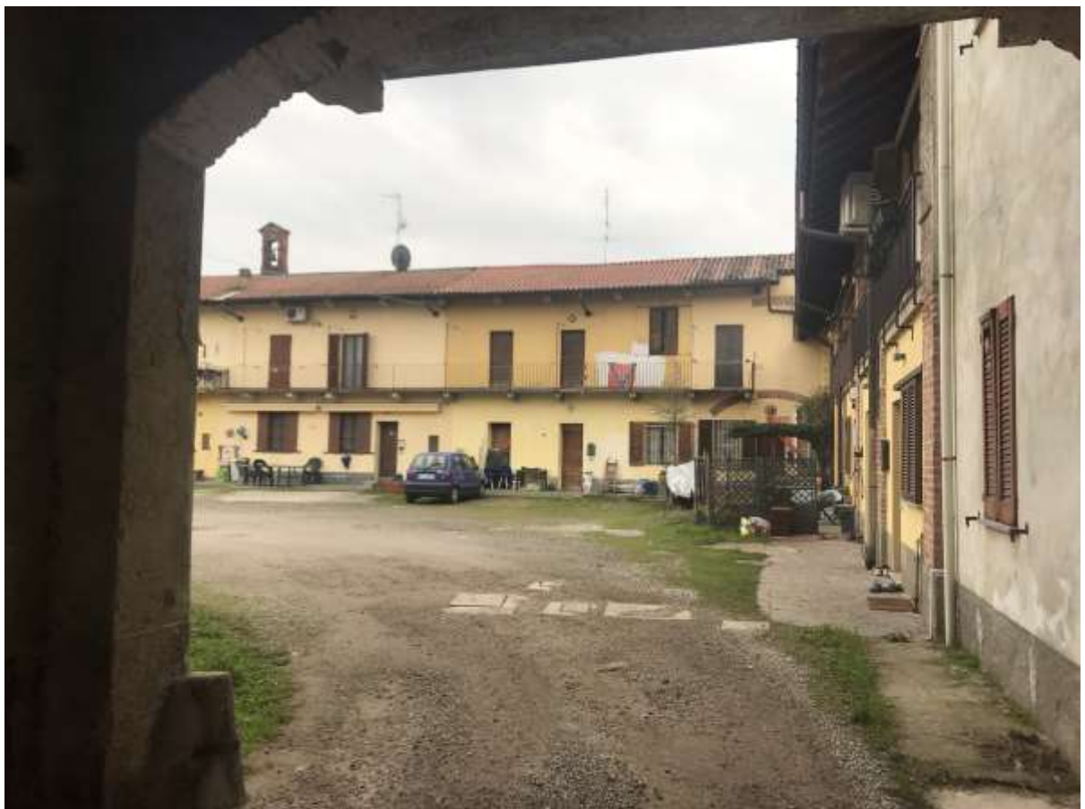
Immagine 2. Attraversando il corpo di fabbrica su strada che oggi non prevede portoni si entra nella corte. L'unità immobiliare è quella al centro dell'immagine, sui due livelli terra e primo.