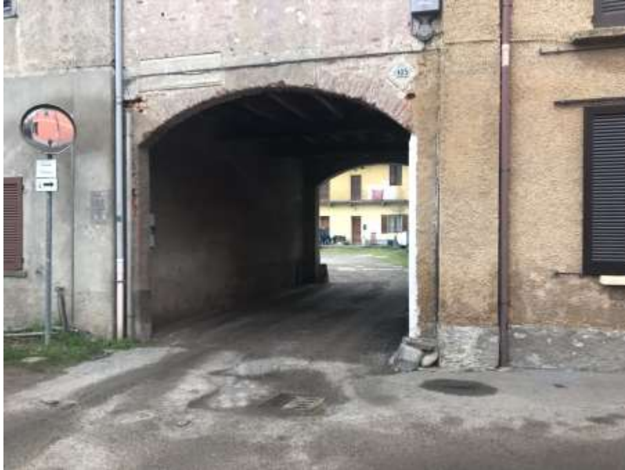
Immagine 1. Vista dell'ingresso alla corte dalla pubblica via.