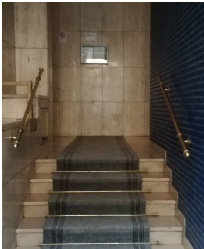
Ingresso allo stabile_Corpo scale