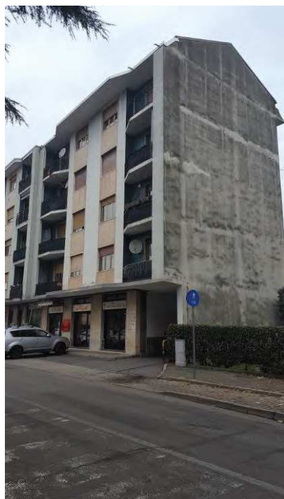
VIA G. PUCCINI, 50 - FRONTE

CESATE (MI) – VIA G. PUCCINI, 50 DATA SOPRALLUOGO 09/12/2019 APPARTAMENTO - FG. 13, PART. 238, SUB. 10