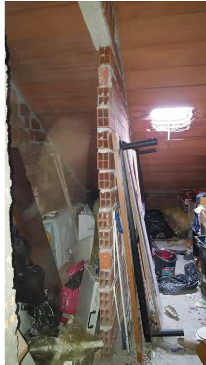
SOLAIO CON MURO ABUSIVO