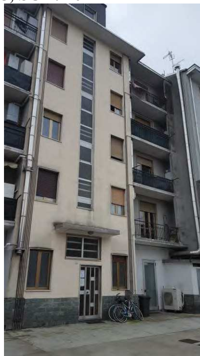
VIA G. PUCCINI, 50 - RETRO