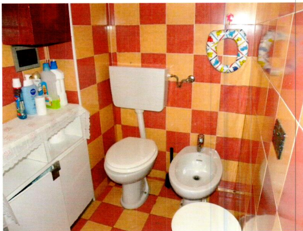
Bagno – foto 1