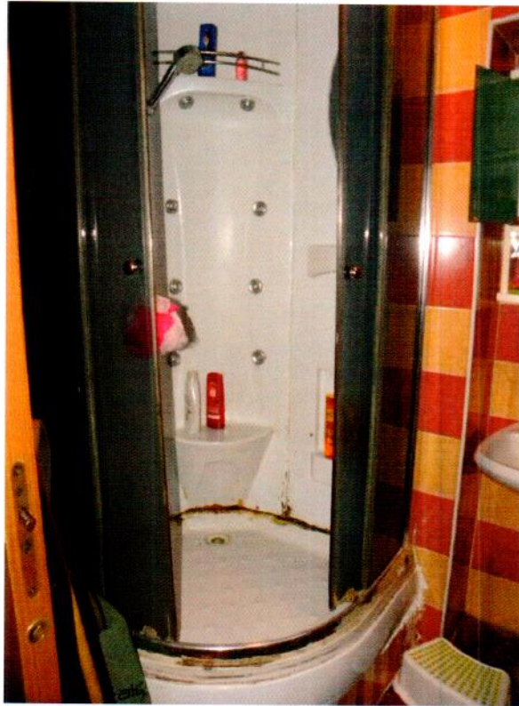
Bagno – foto 2