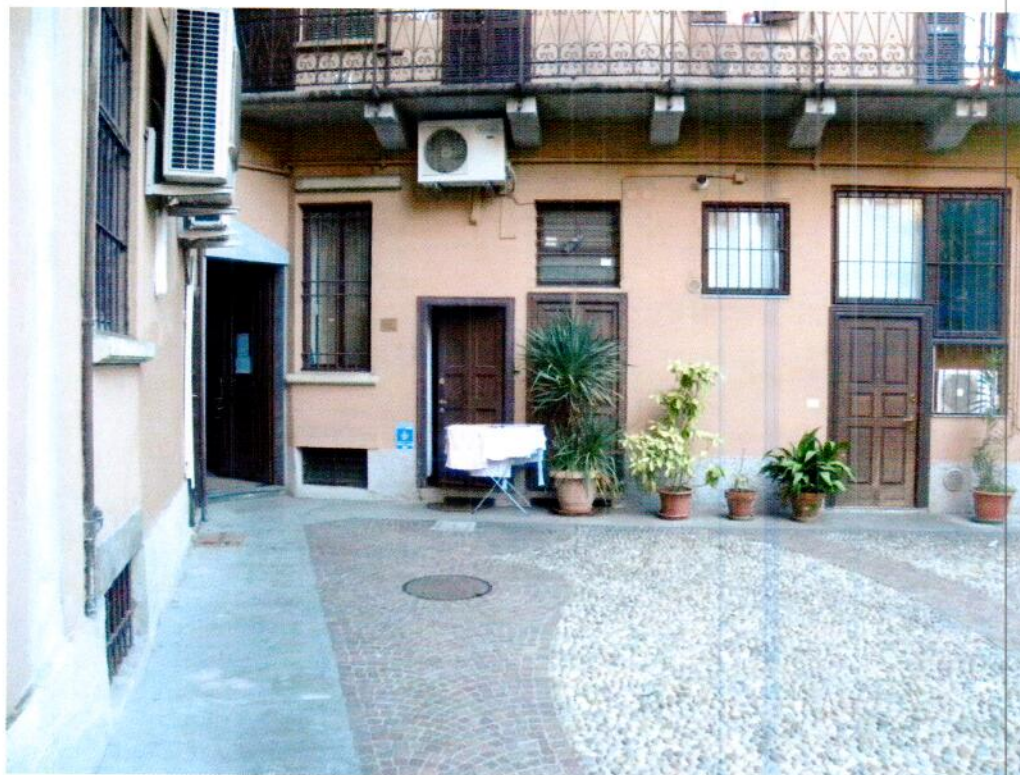
Spazi comuni condominio e Ingresso negozio (trasformato abusivamente in abitazione)