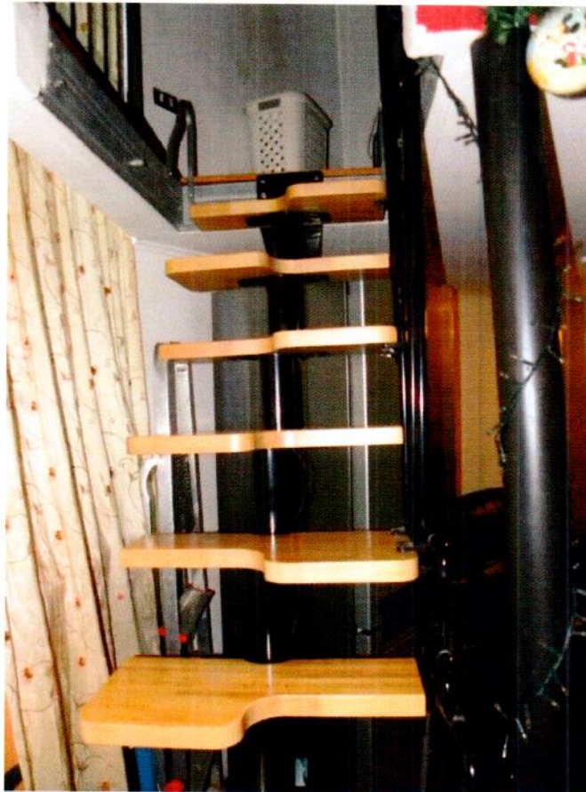
Scala di accesso al soppalco abusivo

Cel. 349/84.33.115 – mail: ing.maurizio.nobile@gmail.com Ordine degli Ingegneri della provincia di Milano n° A 24088 Albo Certificatori Energetici regione Lombardia n° 8083