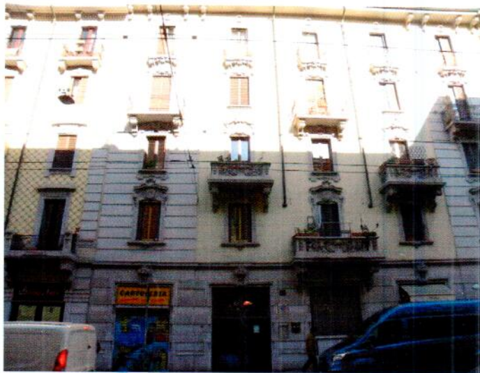
Facciata dello stabile su strada – Via Imbriani n. 30