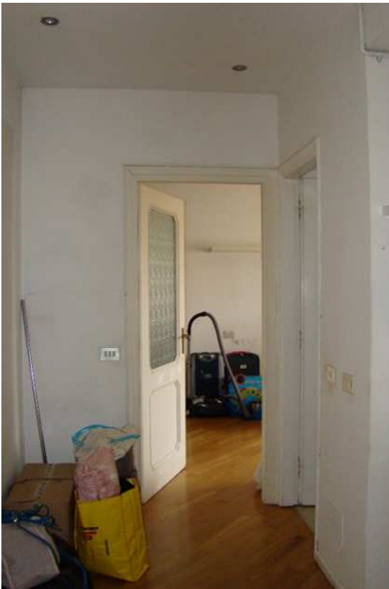
10. Vista della zona antistante la camera ed il bagno.