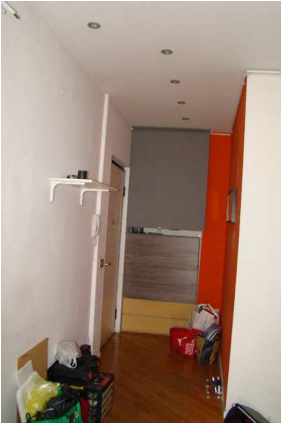
7. Vista della zona di ingresso.