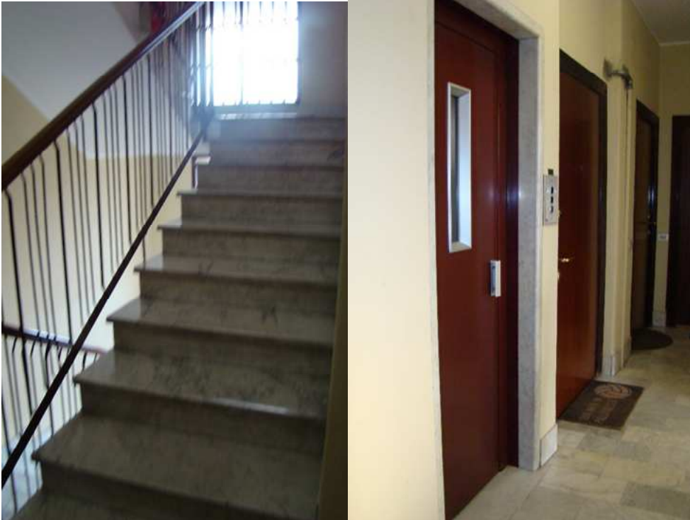
5. Dettaglio della scala e dell'ascensore condominiale.