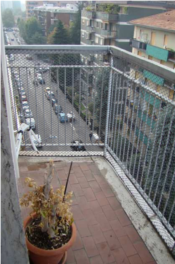
9. Vista del balcone.