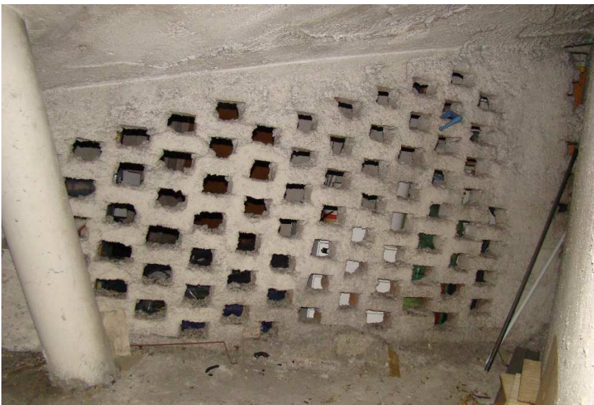
18. Dettaglio dell'interno.