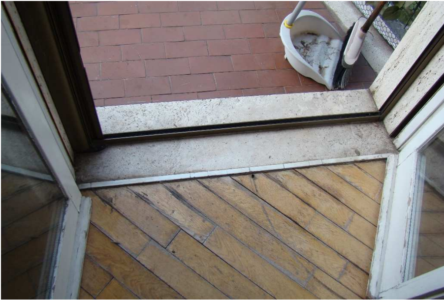
15. Dettaglio del pavimento tra la "cucina" e il balcone.