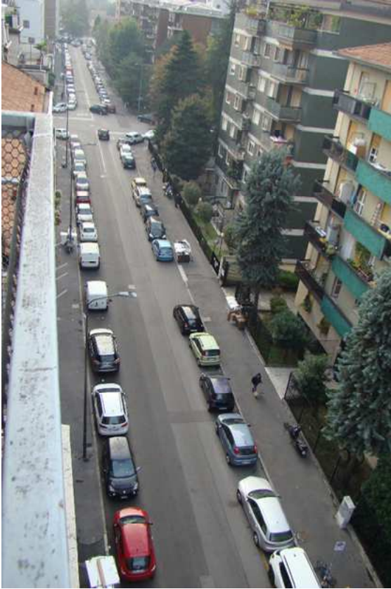
3. Rilievo fotografico del contesto. Vista della via Bisleri.