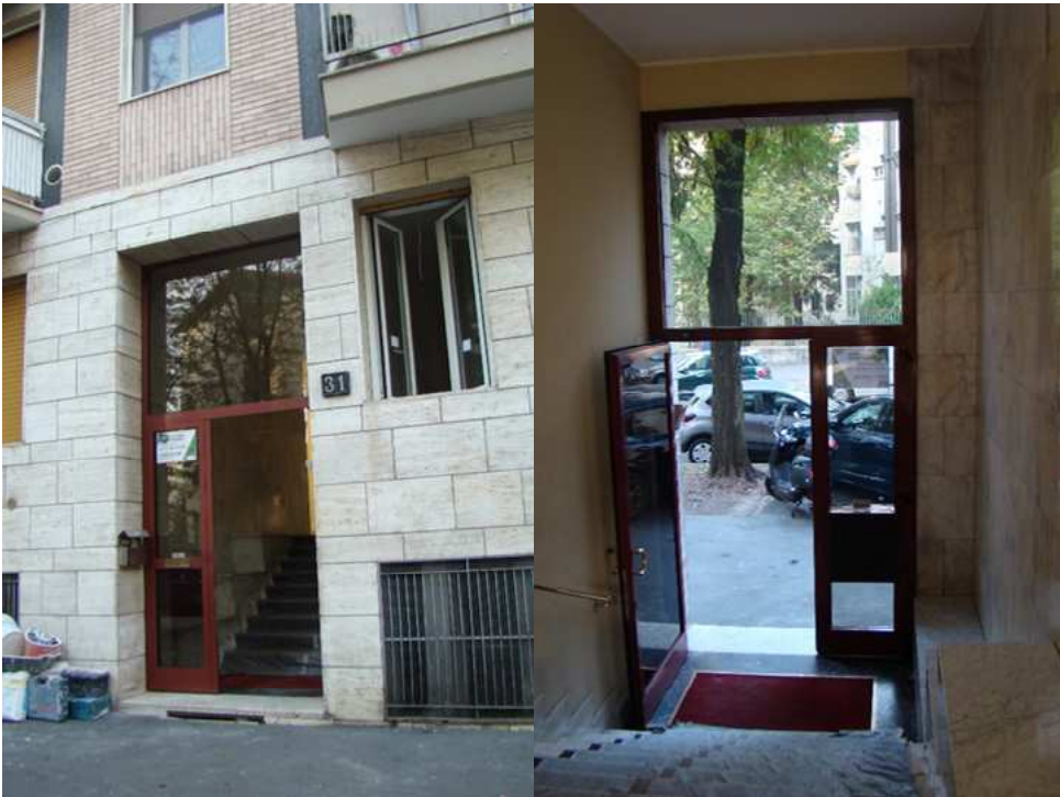
4. Dettaglio del portone di accesso su strada, dall'esterno e dall'interno.