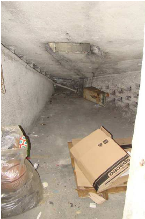
17. Vista interna del solaio.