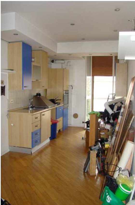
8. Vista dell'angolo cottura.