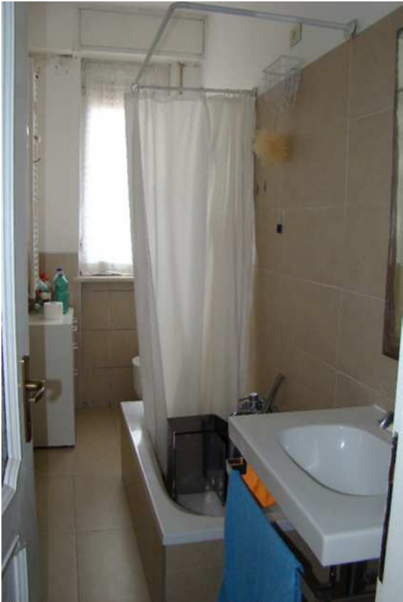
11. Vista del bagno.