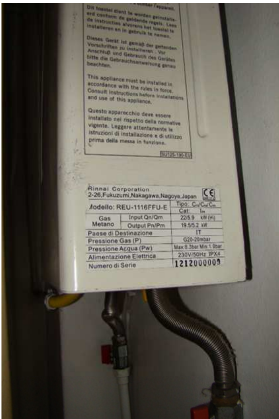
14. Dettaglio della caldaia per la produzione dell'acqua calda.