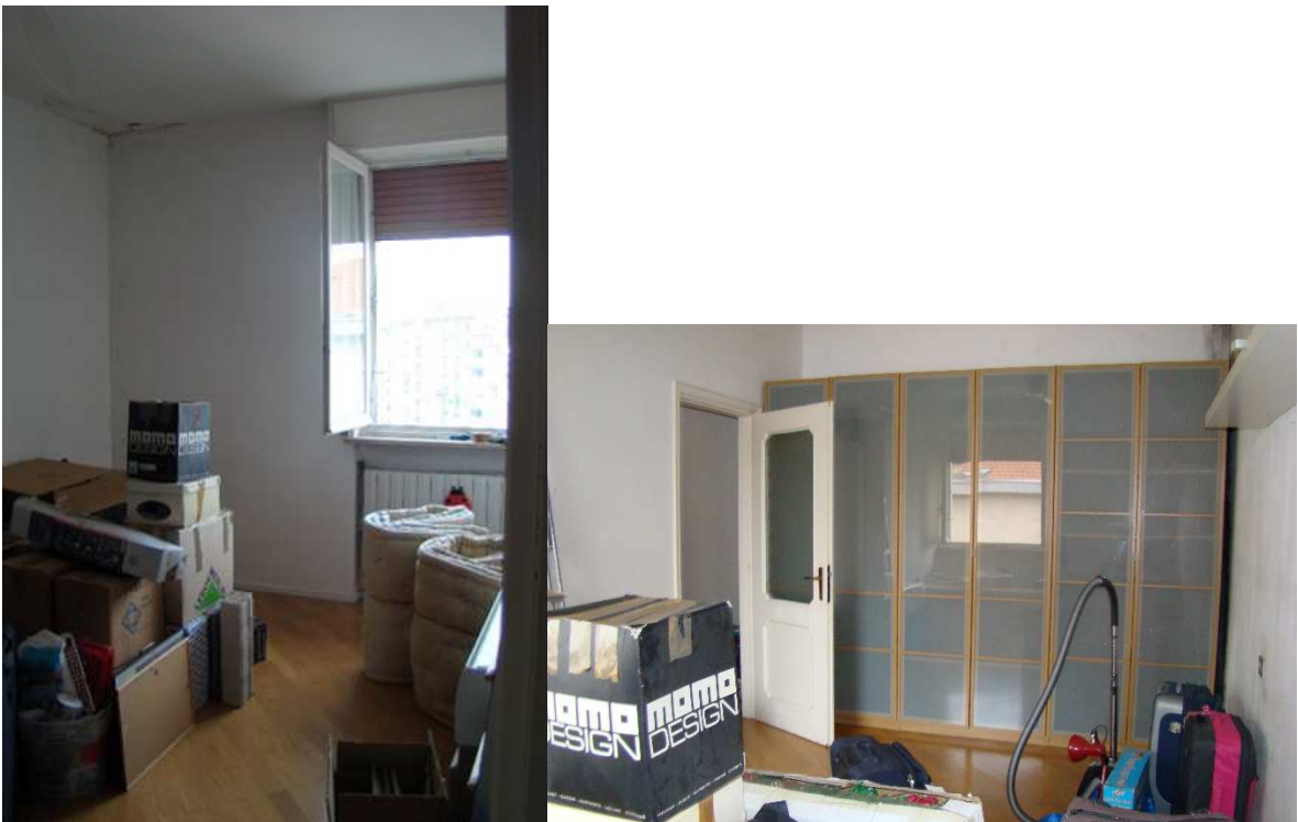
12. Viste della camera.