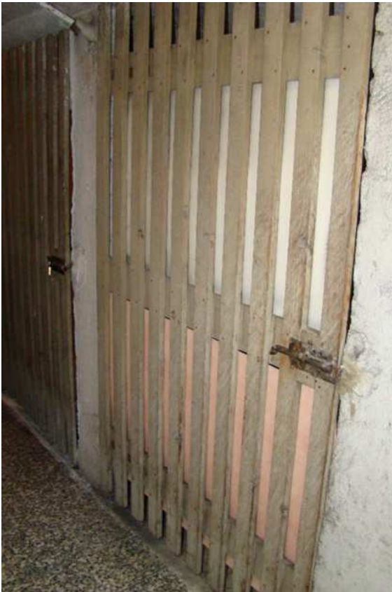
16. Individuazione del solaio di pertinenza.