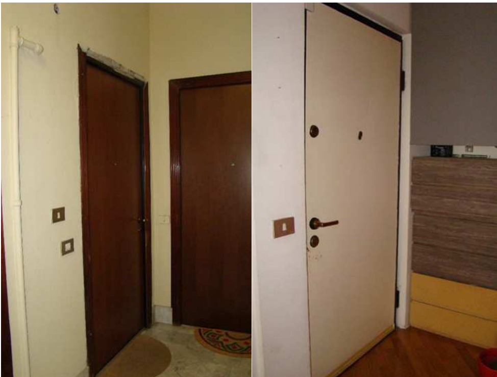
6. Dettaglio della porta di accesso all'alloggio, dal pianerottolo e dall'interno.