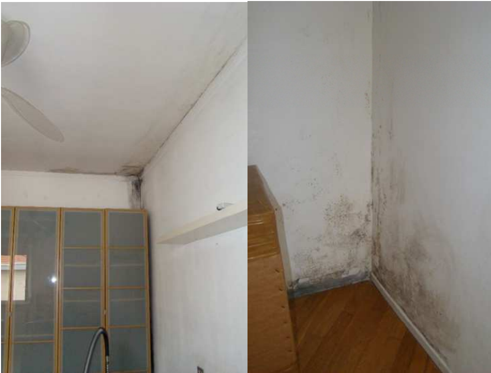
13. Dettaglio delle infiltrazioni nella camera.