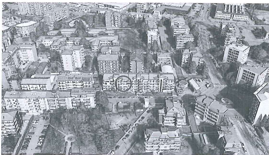
Contesto urbano (serie fotografica in appendice)

Cesano Boscone (MI) - Via della Repubblica, 25