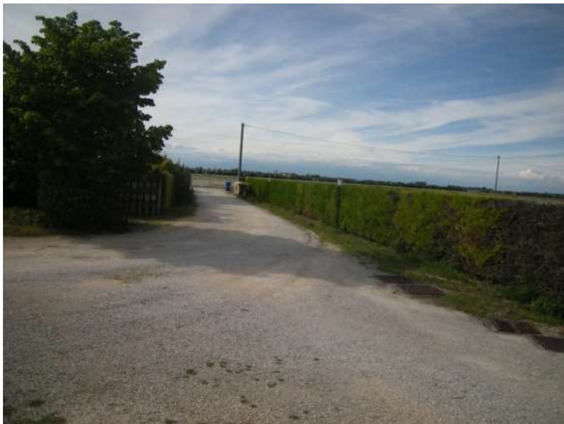
Ottava Presa (Caorle), Strada Fortuna n. 56 - L'ingresso al fabbricato.