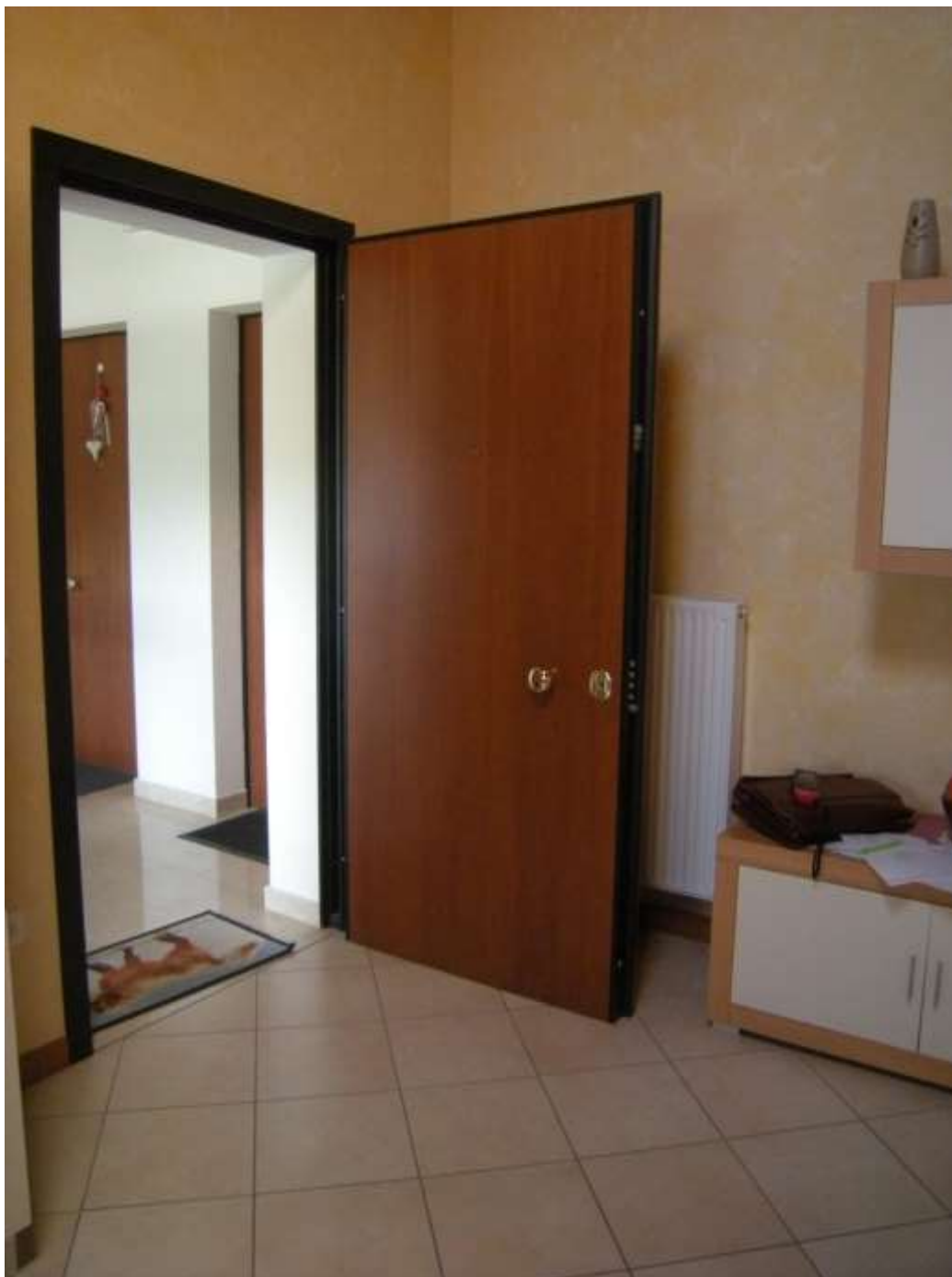
Ottava Presa (Caorle), Strada Fortuna n. 56 - Il particolare della porta d'ingresso all'appartamento.