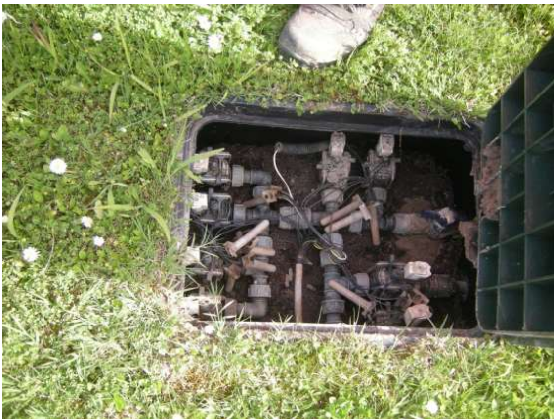
Ottava Presa (Caorle), Strada Fortuna n. 56 – Sopra pozzetto contatori acqua, sotto pozzetto irrigazione corte comune.