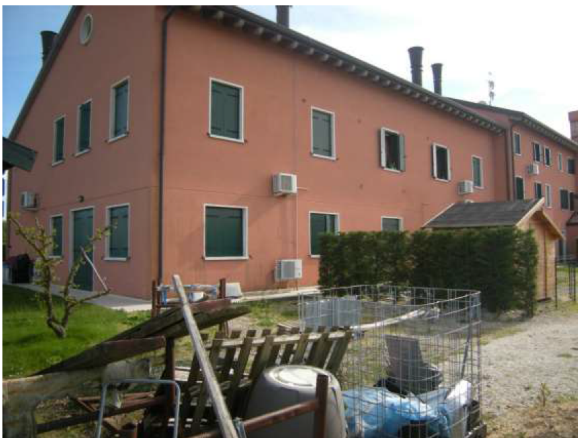
Ottava Presa (Caorle), Strada Fortuna n. 56 – Sopra i prospetti a sud-est e nord-ovest, sotto i prospetti ad nord -ovest ed a nord – est.