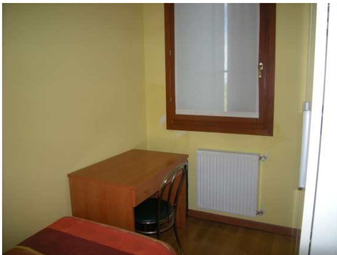
Ottava Presa (Caorle), Strada Fortuna n. 56 – Il ripostiglio.