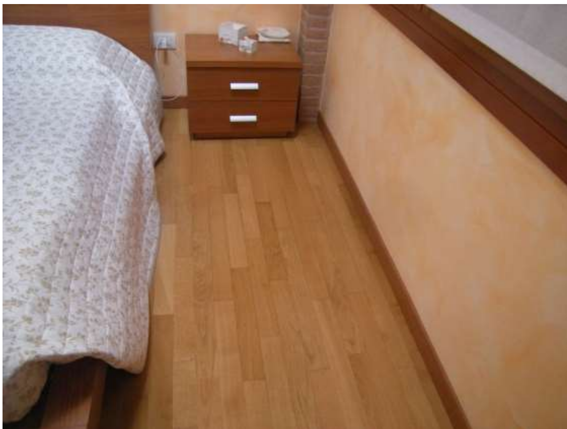
Ottava Presa (Caorle), Strada Fortuna n. 56 – Particolare della pavimentazione in parquet.