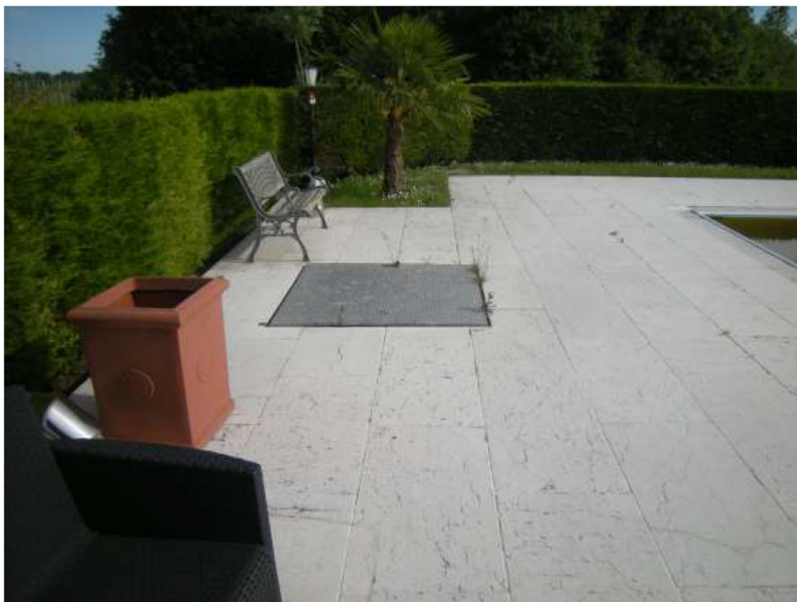
Ottava Presa (Caorle), Strada Fortuna n. 56 – Sopra il citofono esterno, sotto il pozzetto del gruppo pompe della piscina.