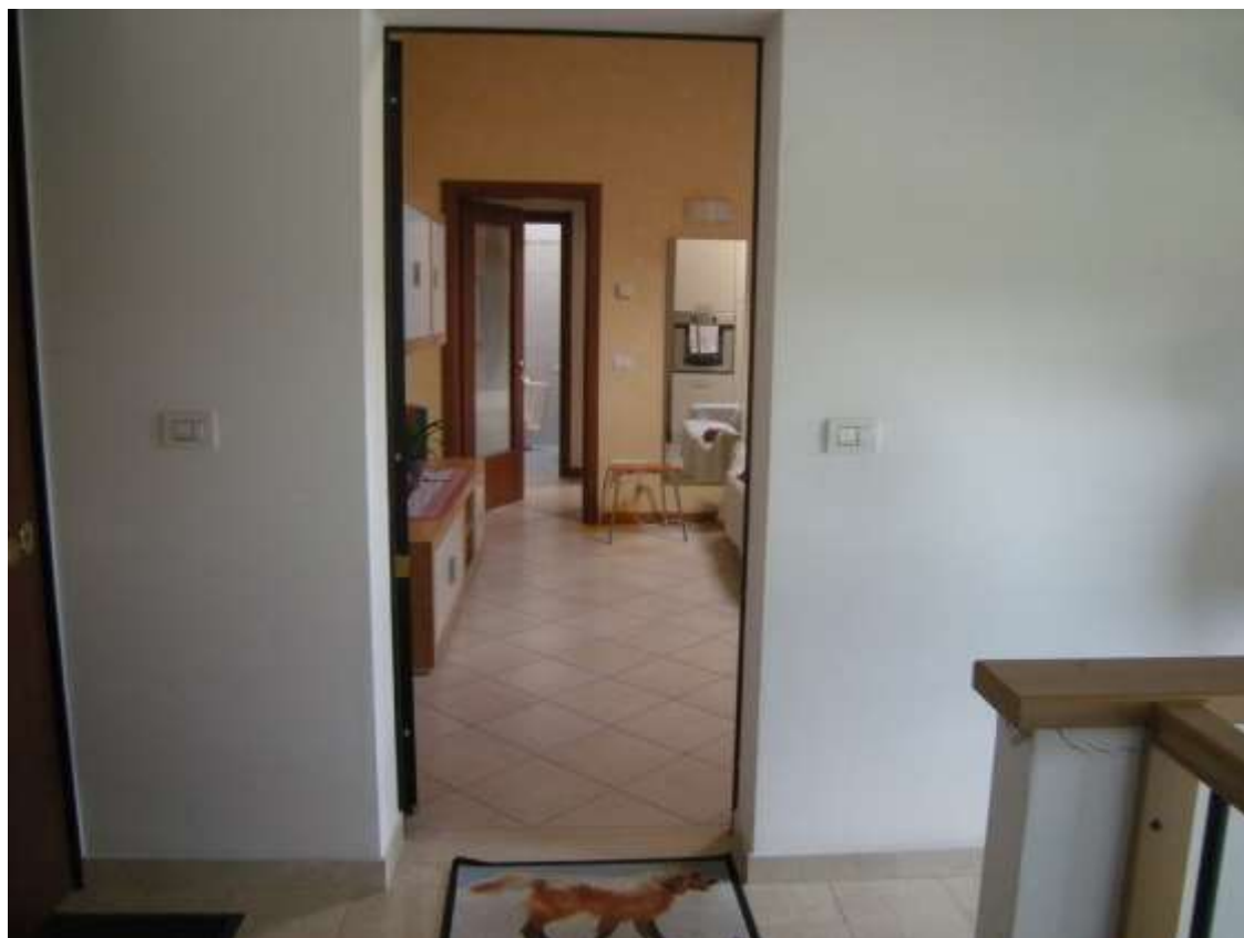
Ottava Presa (Caorle), Strada Fortuna n. 56 – Il corpo scala.