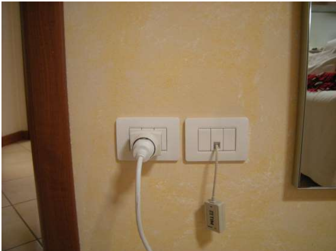
Ottava Presa (Caorle), Strada Fortuna n. 56- Sopra il quadro elettrico, sotto gli interruttori.