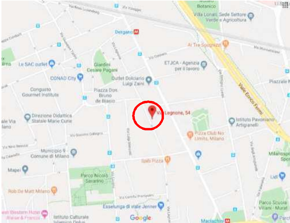
1. Vista aerea del contesto.