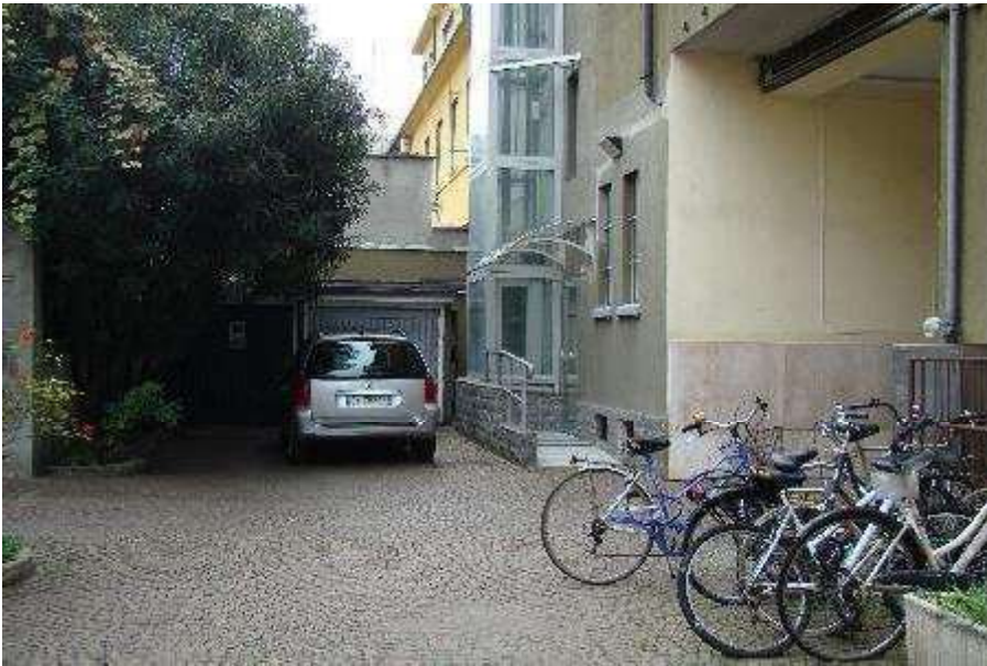
3. Vista del cortile.