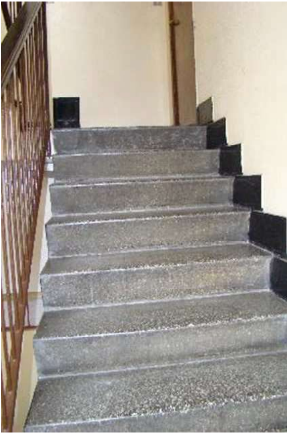
7. Vista della scala comune.