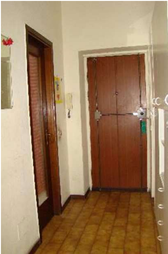
9. Vista dell'ingresso.