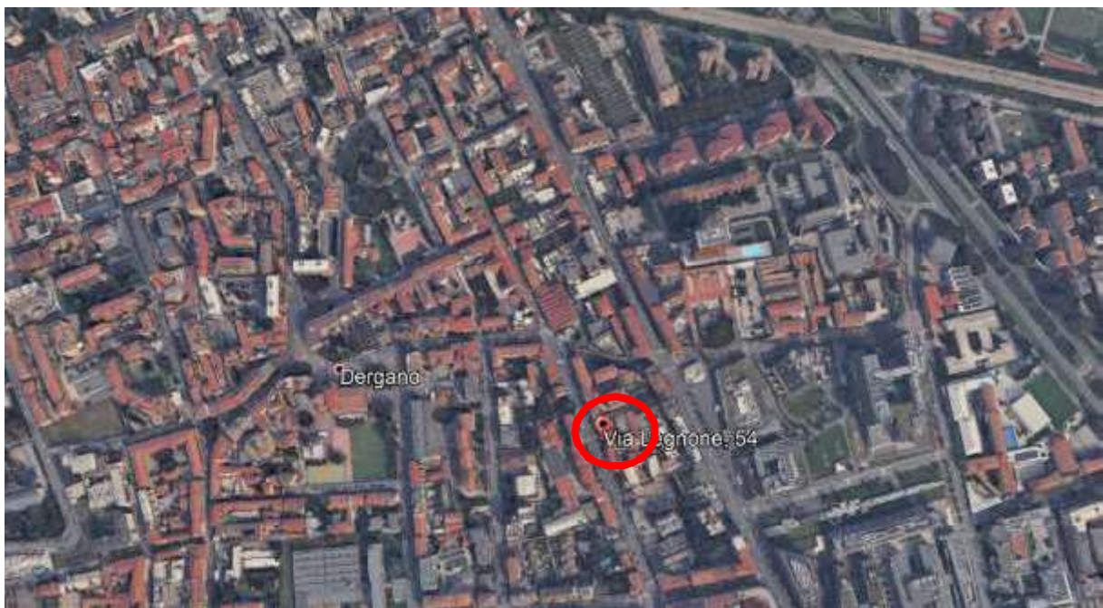
2. Vista aerea del contesto con individuazione dell'edificio.