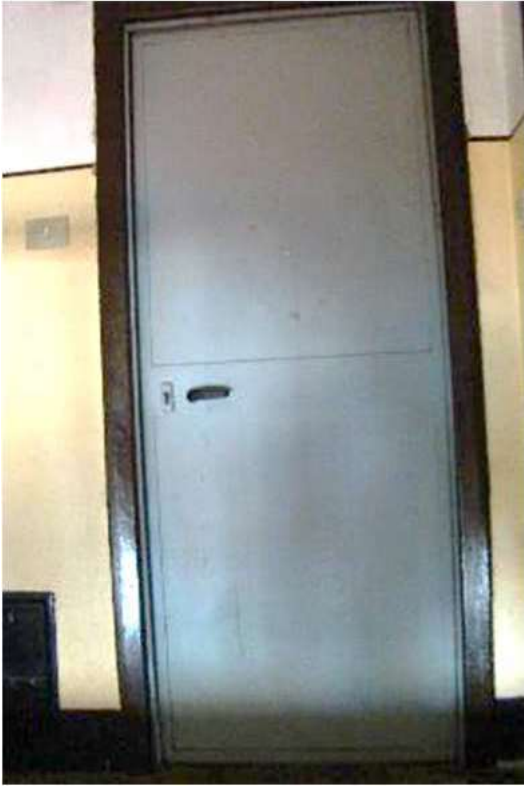
15. Vista della porta che conduce ai solai.