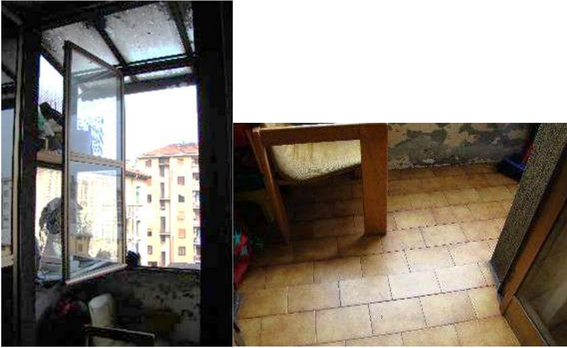
13. Dettagli della veranda.