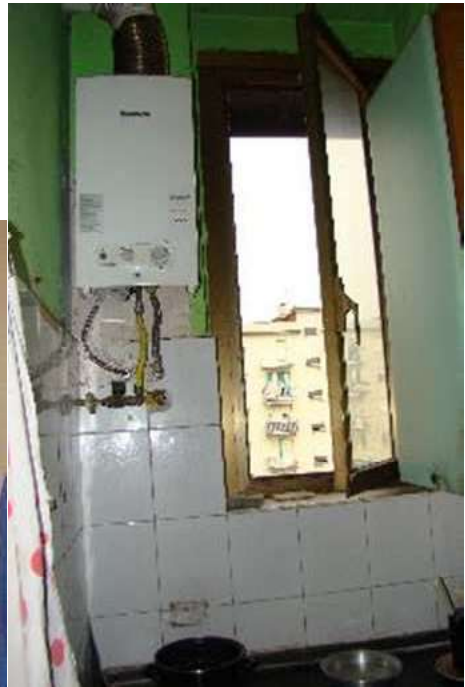
11. Viste dell'angolo cottura.