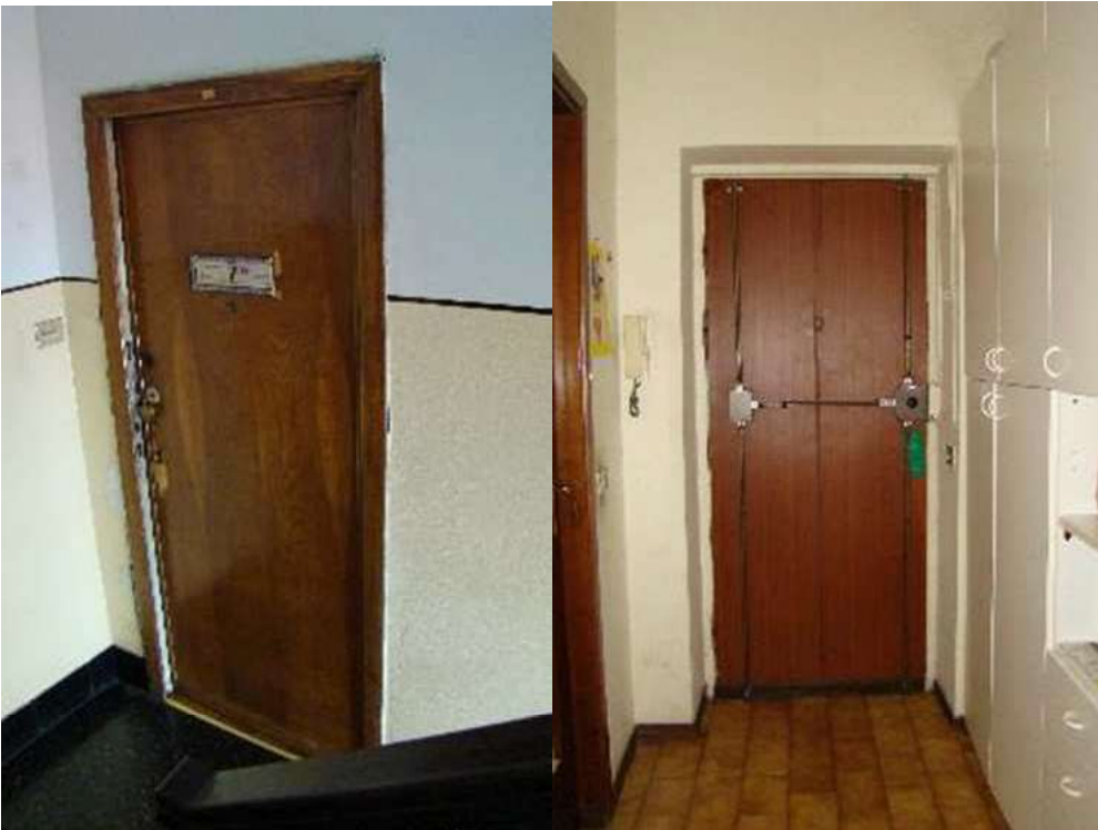
8. Vista del portoncino blindato di accesso all'appartamento, dall'androne e dall'interno.