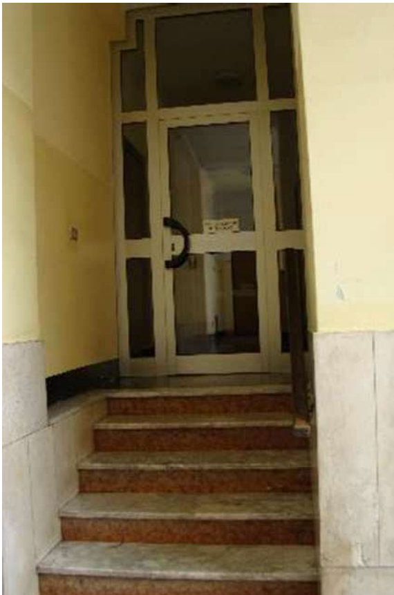
6. Vista della porta di accesso alla scala di pertinenza.