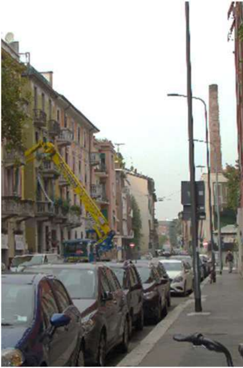
5. Rilievo fotografico del contesto.