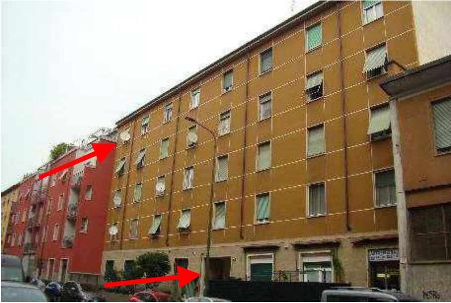
1. Vista sul fronte strada dalla via Legnone dell'androne di accesso e degli affacci dell'immobile.