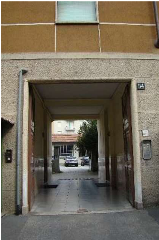
2. Dettaglio dell'androne di accesso.