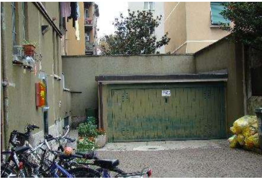
4. Vista del cortile.