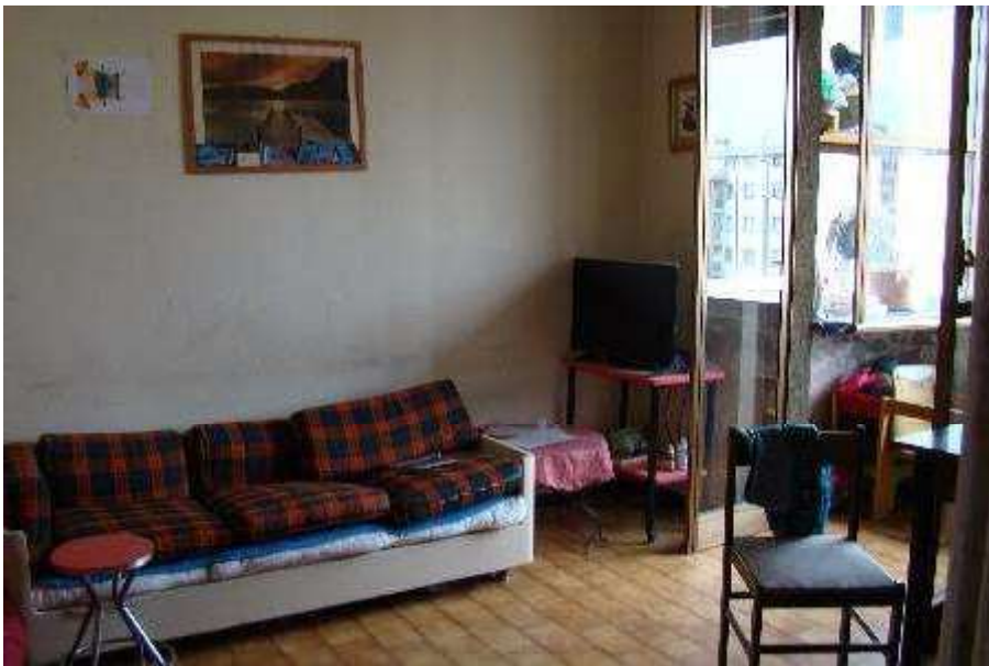
12. Vista del soggiorno.