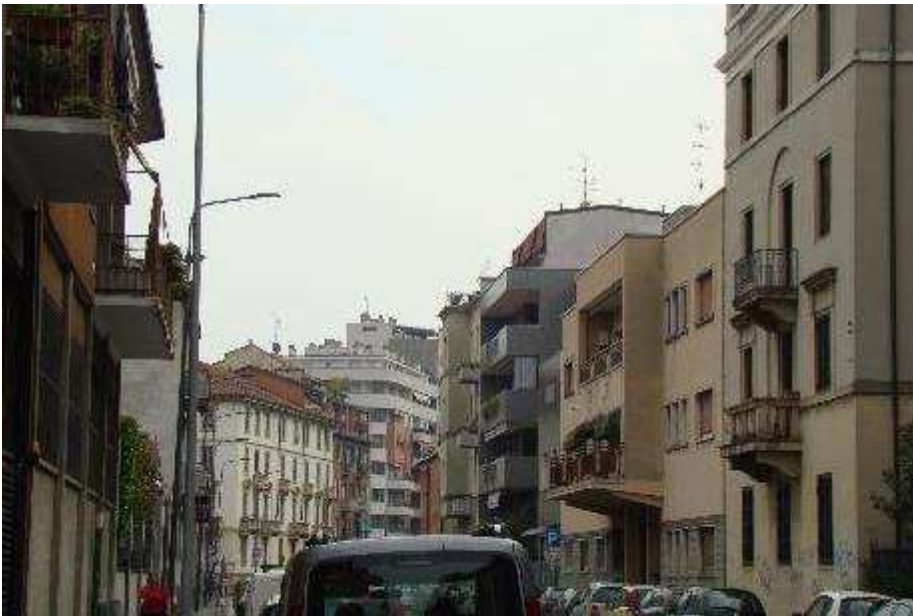
6. Rilievo fotografico del contesto.