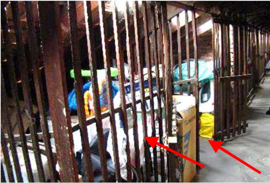
17. Indicazione dei due solai utilizzati: solo quello a destra si ritiene di spettanza dell'immobile.