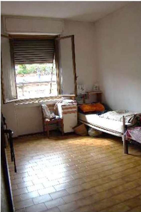
14. Vista della camera.