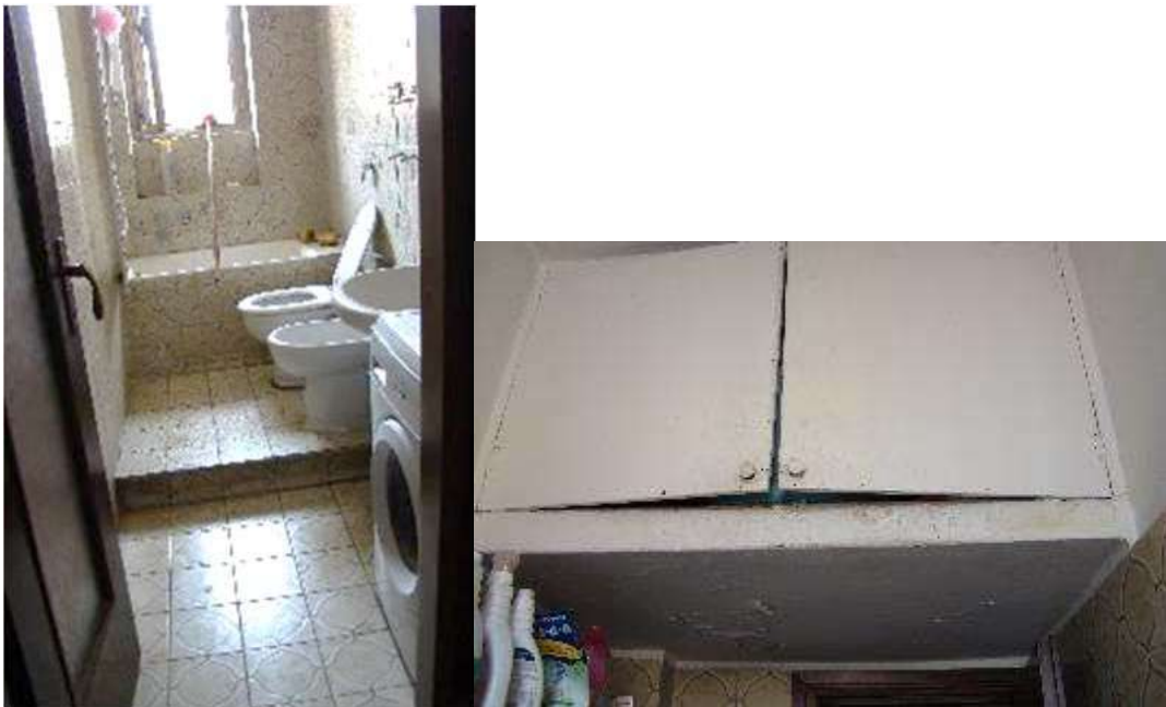
10. Vista del bagno con il ripostiglio in quota.