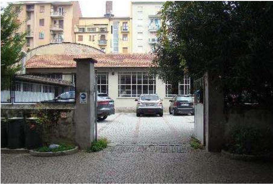
5. Vista dell'ingresso della proprietà retrostante che ha la servitù di passaggio.