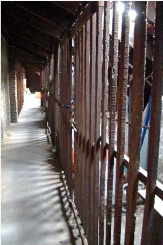
16. Viste dei solai.