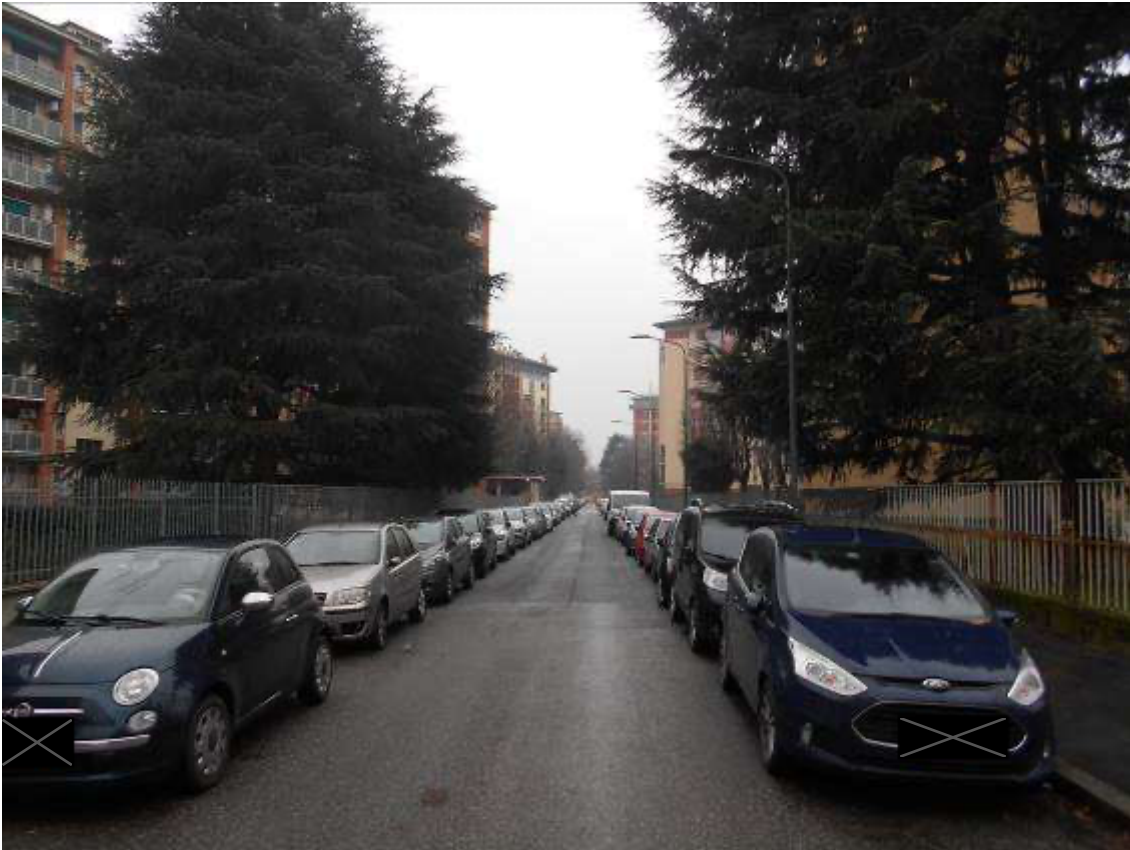
Milano Via degli Astri 26