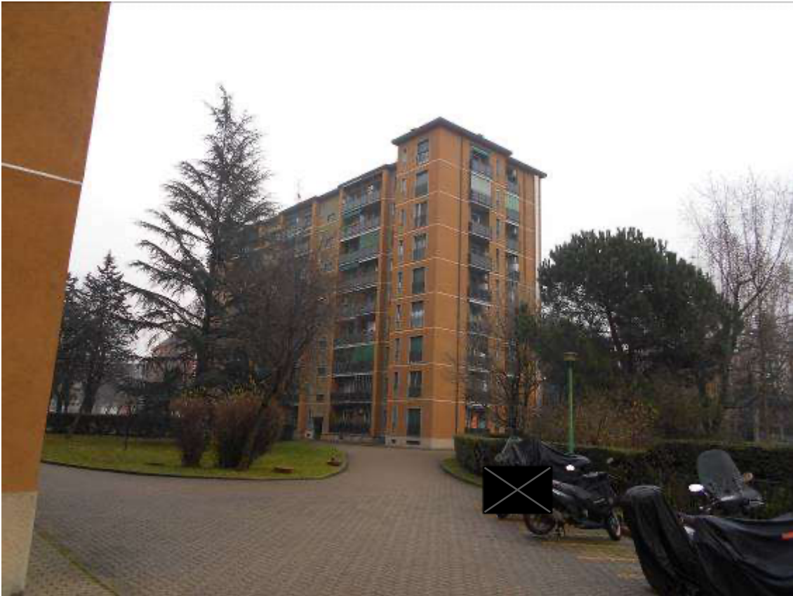
Corte comune condominiale