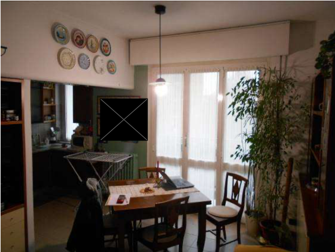
Soggiorno con angolo cottura