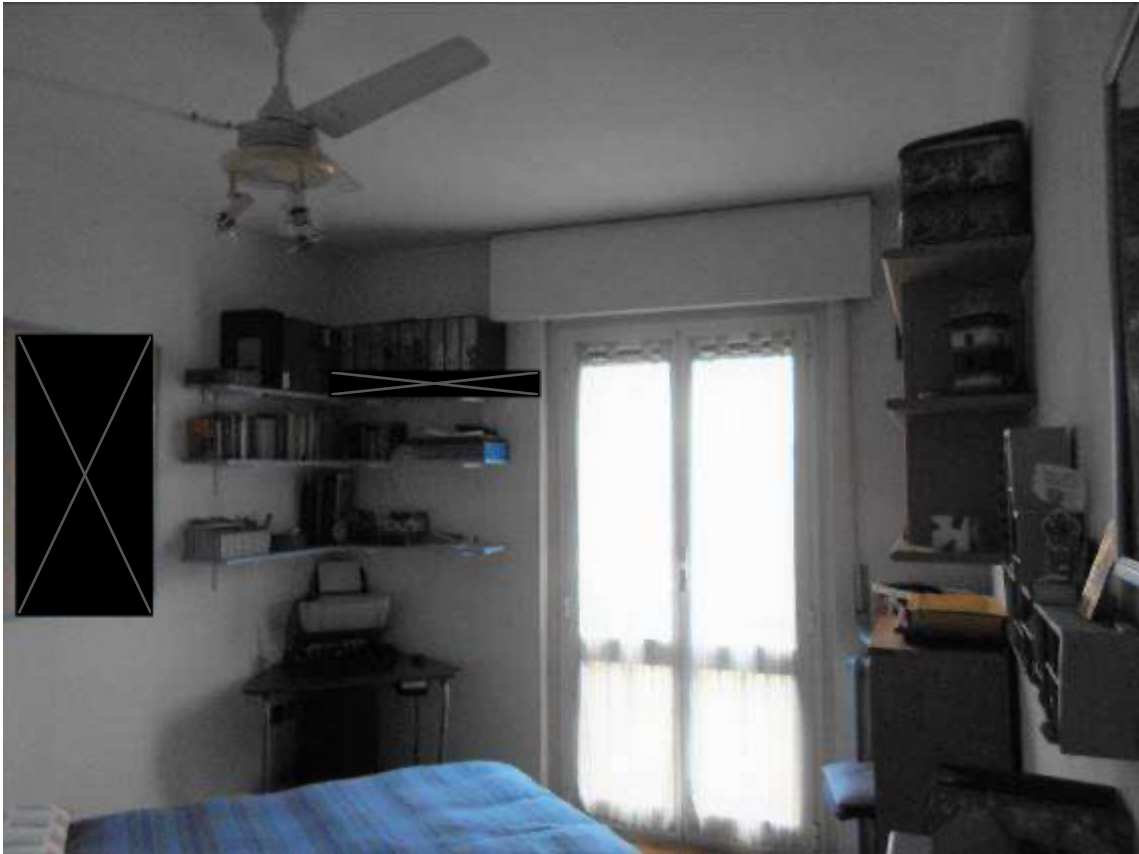
Camera con guardaroba