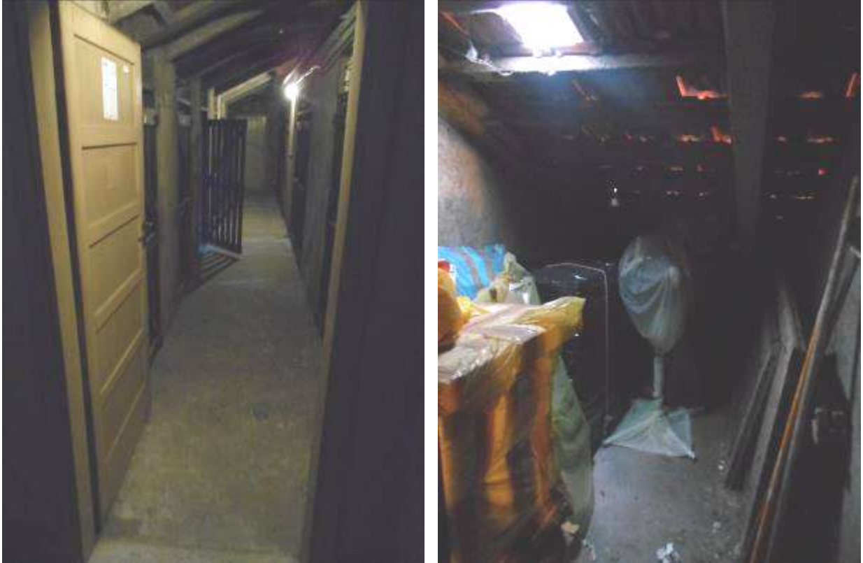
Solaio di pertinenza