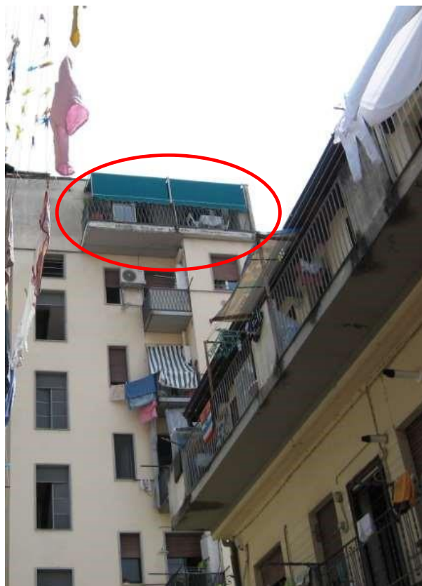
Affaccio verso il cortile interno