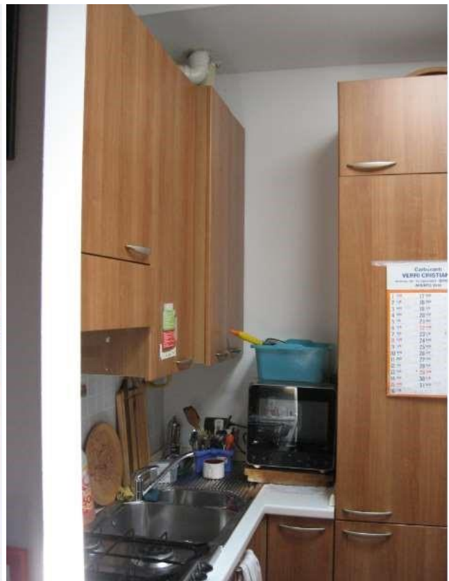
Angolo di cottura