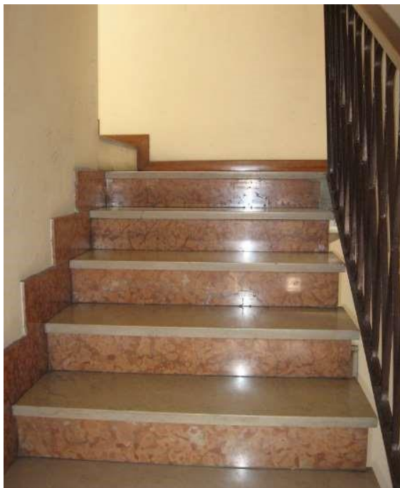
Androne e scale