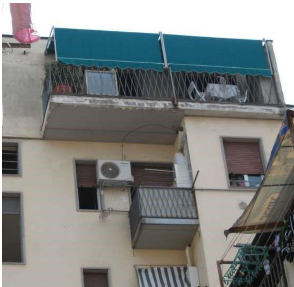
Dettaglio dei balconi