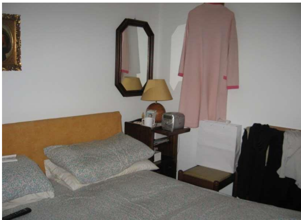
Sanza da letto