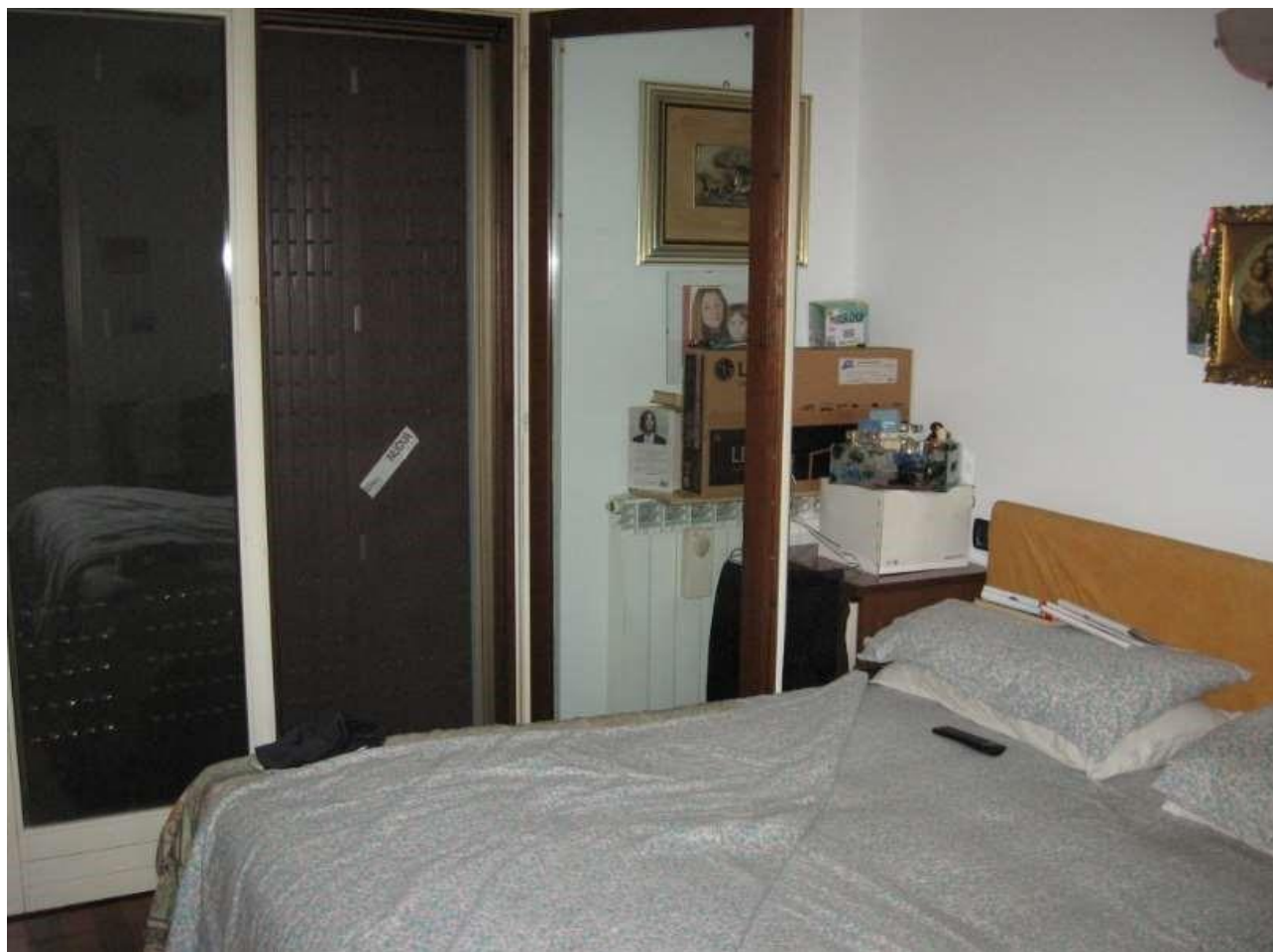
Altra vista stanza da letto