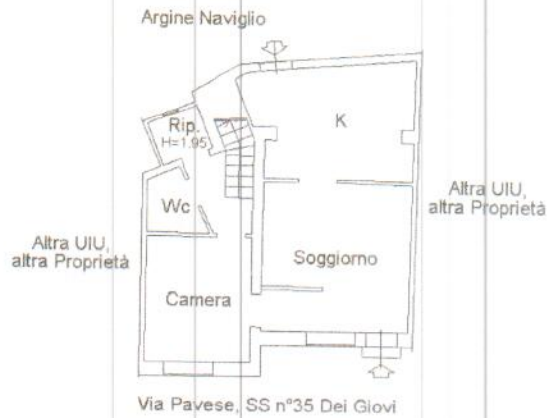
PIANTA PIANO TERRENO, H.=3.00