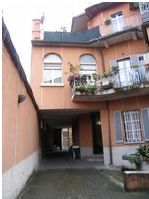
Vista ingresso su via Bassano del Grappista