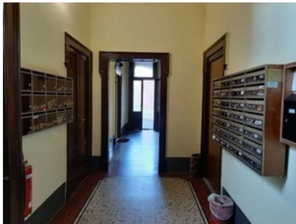
Androne di ingresso e vano scala dell'edificio su via Bassano del Grappa