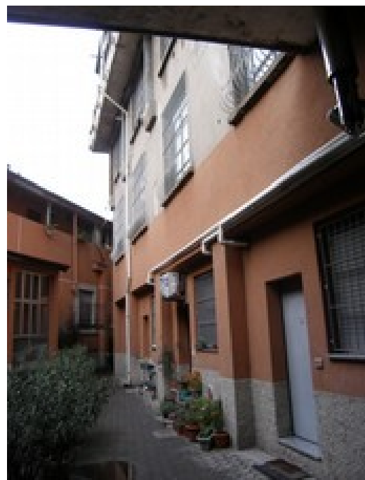
Vista cortile interno