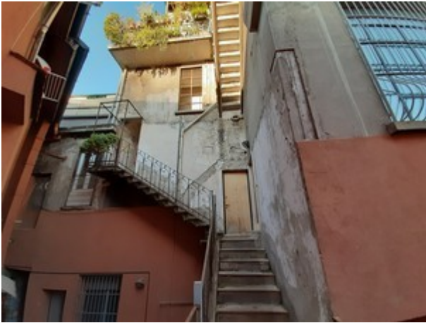
Scala di accesso su fronte Nord Ovest