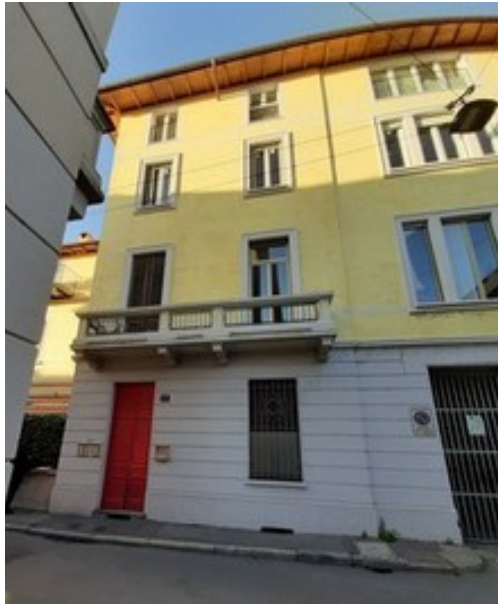
Edificio su via Bassano del Grappa di accesso al lotto interno