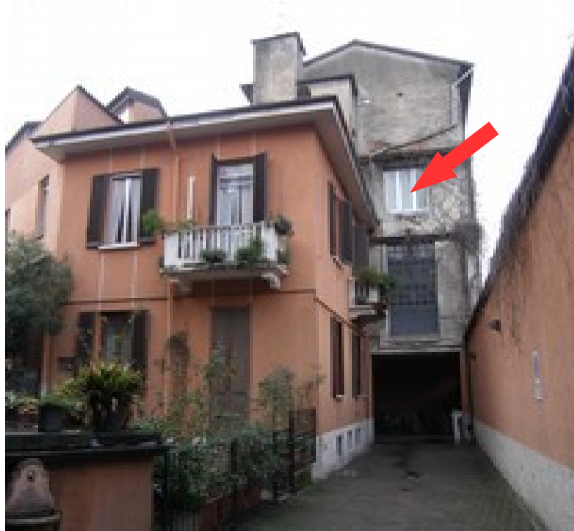
Vista edificio da ingresso su via Bassano del Grappa

RILIEVO FOTOGRAFICO via Bassano del Grappa15-17 – Milano