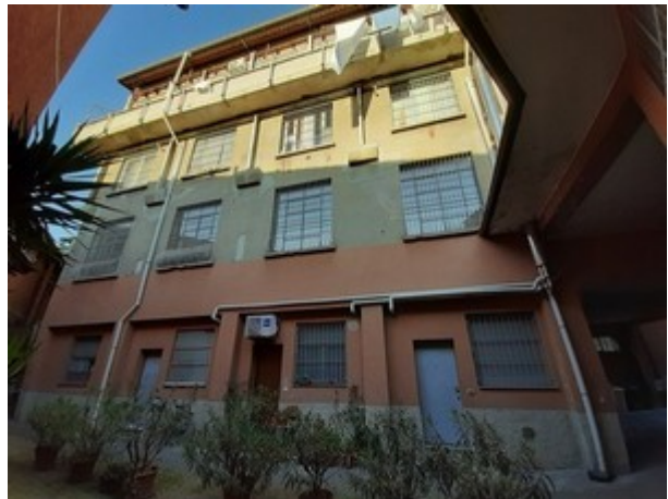
Fronte Sud Ovest