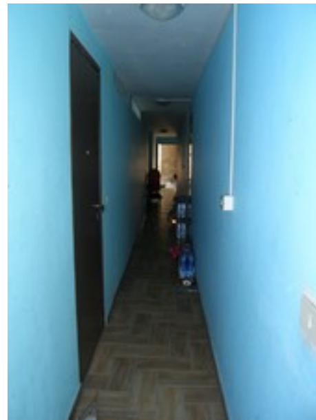
Vista pianerottolo e porta ingresso appartamento