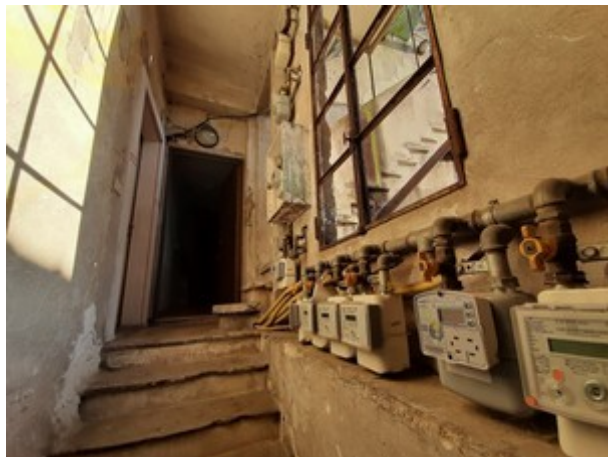
Vista accesso al piano primo e pianerottolo