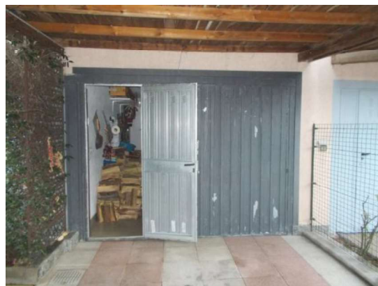
6. Porta ricavata nella bascula