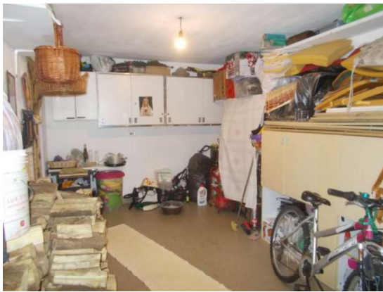
9. Interno del box