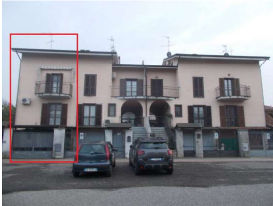
1. Facciata esterna dalla via Picasso