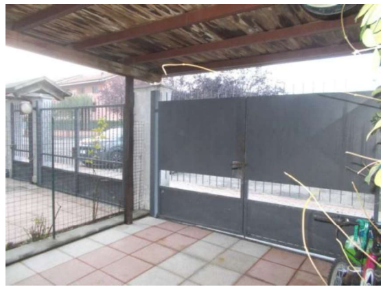
4. Ingresso carraio (dall'interno)