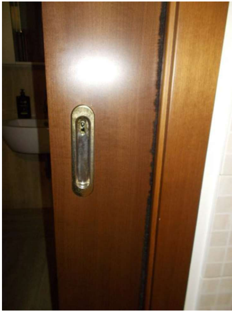
15. Porta scorrevole di accesso al bagno