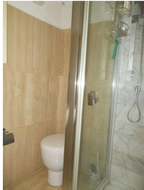
22. Interno del bagno