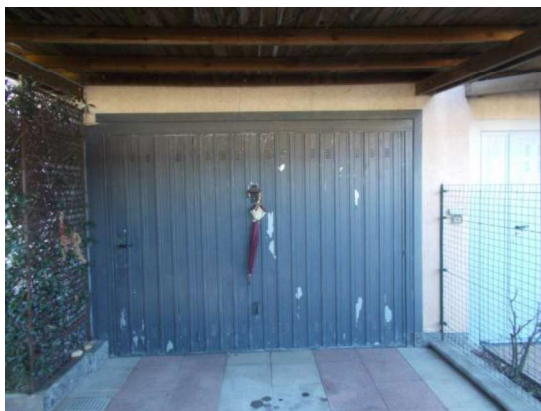
5. Bascula in metallo di accesso al box