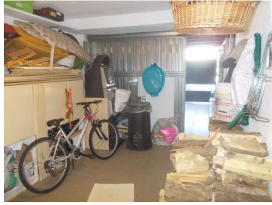
8. Interno del box