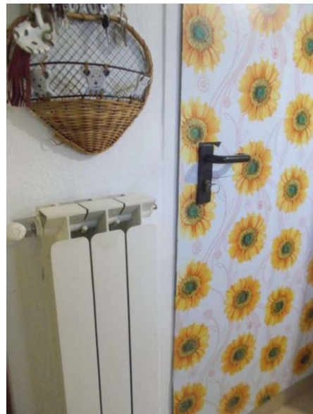
12. Porta metallica tra il box e lavanderia