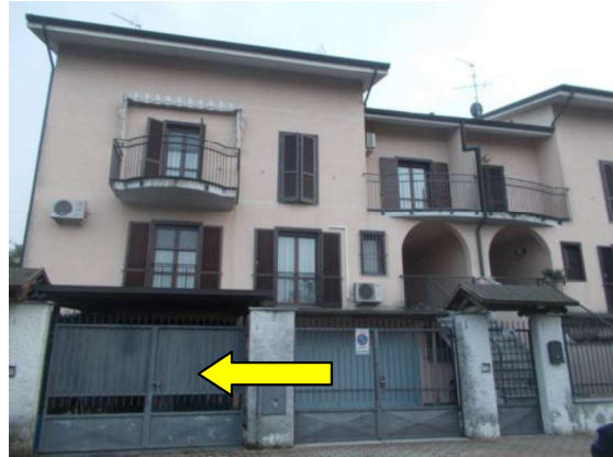
2. Ingresso carraio dalla strada