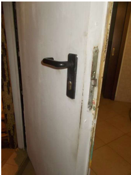
11. Porta metallica tra il box e lavanderia