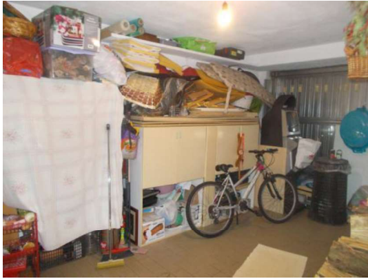
7. Box (utilizzato come magazzino)