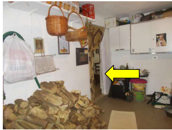
10. Box (passaggio verso lavanderia)