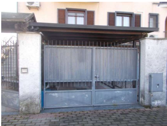
3. Ingresso carraio (dall'esterno)