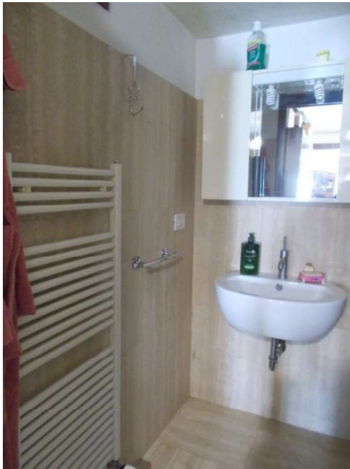
21. Interno del bagno