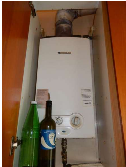
FOTO 22: Interno dell'unità pignorata – Dettaglio della porta della camera che affaccia sul cortile comune, con evidenza dei danneggiamenti sulla superficie del pannello esterno. FOTO 23: Interno dell'unità pignorata – Vista di dettaglio dello scaldacqua a gas posto in cucina.