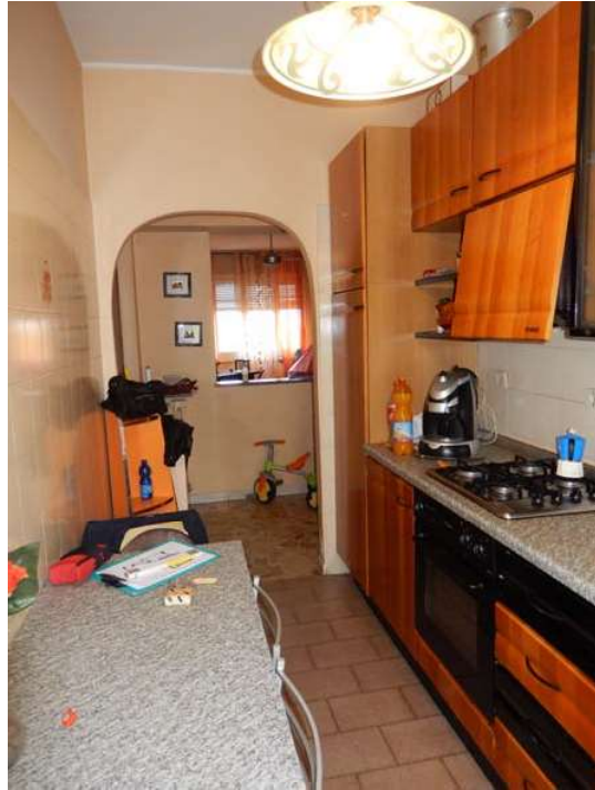
FOTO 12 e 13: Interno dell'unità pignorata – Scorci della cucina.