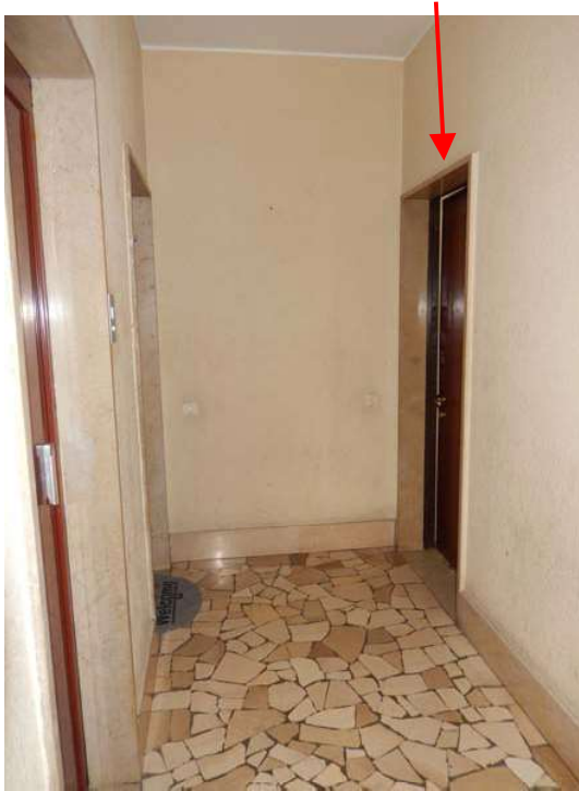
FOTO 6: Ulteriore scorcio dell'androne comune, con vista sulla scala A ove è sita l'unità in esame.