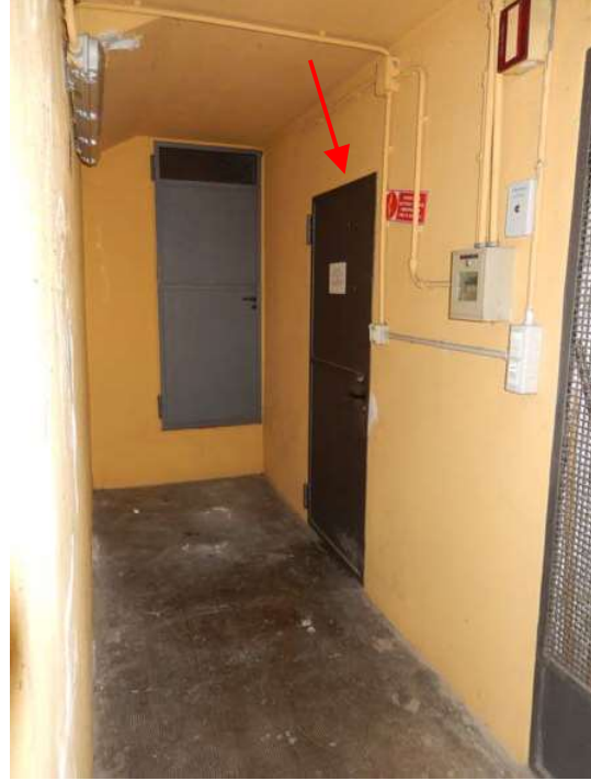
FOTO 24: Cantina dell'unità pignorata – Scorcio della scalinata, con accesso dal cortile comune, che conduce all'ingresso delle cantine.