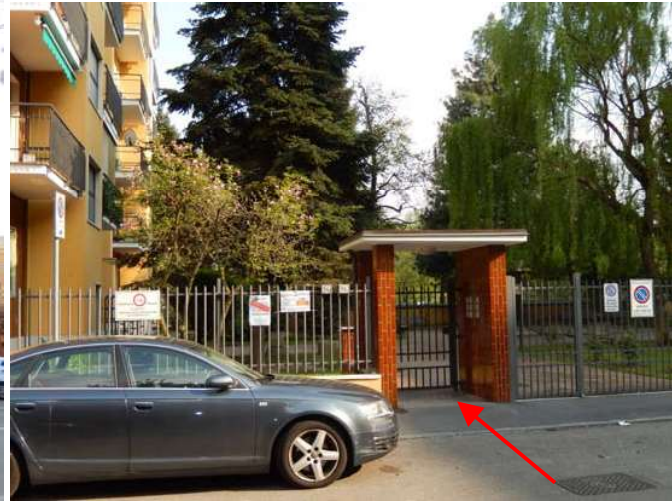
FOTO 1: Vista, da Via Di Vittorio, del fabbricato in cui è sita l'unità pignorata (il cui affaccio sulla strada è evidenziato col poligono rosso).