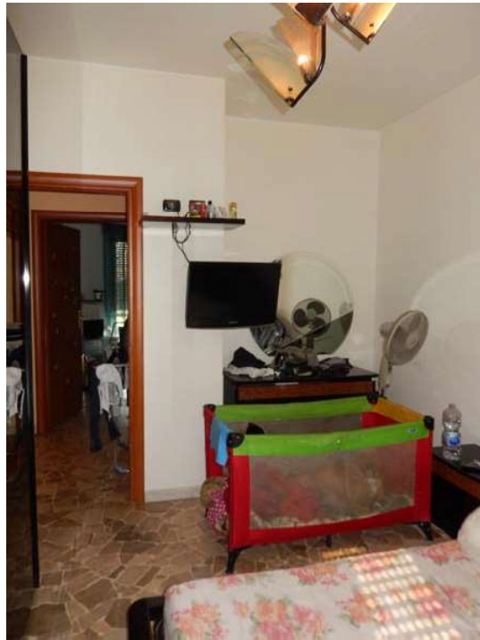
FOTO 18 e 19: Interno dell'unità pignorata – Scorci della camera che affaccia sul cortile comune.