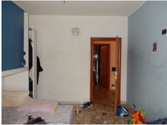
FOTO 16 e 17: Interno dell'unità pignorata – Scorci della camera che affaccia sulla Via Di Vittorio.