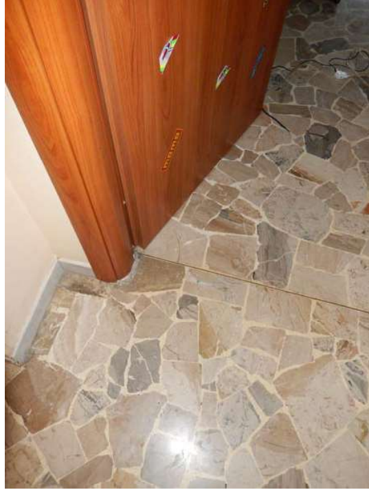
FOTO 20: Interno/esterno dell'unità pignorata – Dettaglio dei serramenti, dotati di vetrocamera. FOTO 21: Interno dell'unità pignorata – Dettaglio dei pavimenti.