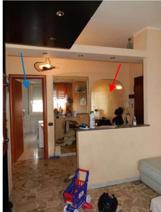
FOTO 9: Interno dell'unità pignorata – Ulteriore scorcio dell'area all'ingresso, verso la zona notte. FOTO 10: Interno dell'unità pignorata – Ulteriore scorcio (dal soggiorno) dell'area all'ingresso, con vista verso la cucina (senza porta, indicata dalla freccia rossa) ed il bagno (freccia blu). La porzione bassa del muro è ciò che rimane dalla demolizione della parete che divideva il soggiorno dall'originario corridoio. Non è stata reperita traccia di una pratica edilizia in accompagnamento a tale intervento di modifica.