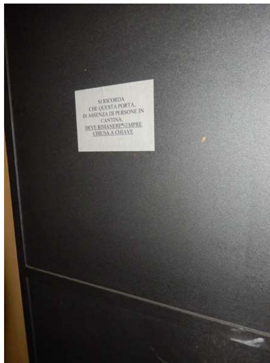
FOTO 26: Cantina dell'unità pignorata – Dettaglio della porta d'ingresso alle cantine, chiusa a chiave come da indicazioni dell'Amministrazione condominiale riportate sull'esterno dell'infisso.