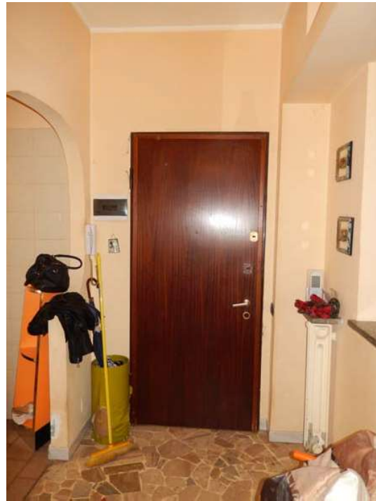
FOTO 7: Vista della porta d'ingresso all'unità pignorata, dal disimpegno comune al piano.