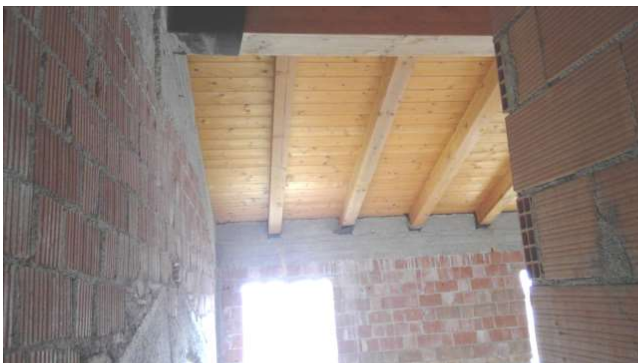
Foto n. 18 – Comune di Travesio (PN) – frazione Toppo - “Corte Dal Nodâr”- Lotto 1 – Foglio 8, Unità 4 – Piano secondo – Veduta parziale della camera posta a ovest.