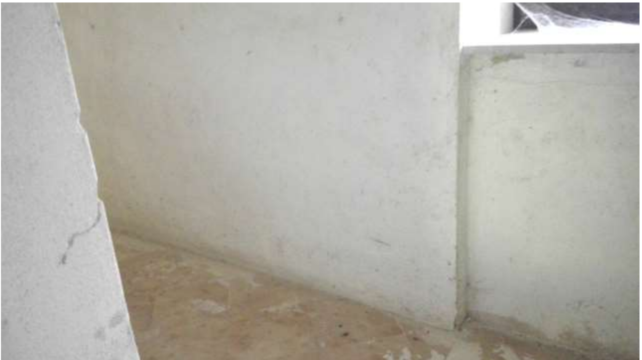
Foto n. 10 – Comune di Travesio (PN) – frazione Toppo - "Corte Dal Nodâr"- Lotto 1 – Foglio 8, Unità 1 – Piano primo – Veduta di porzione del corridoio che dà accesso a tutte le stanze del piano.