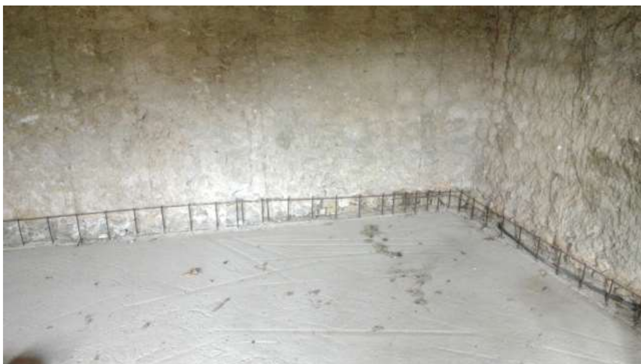
Foto n.4 – Comune di Travesio (PN) – frazione Toppo - “Corte Dal Nodâr”- Lotto 1 – Foglio 8, Unità 2 – Piano terra – Porzione del vano al grezzo destinato a soggiorno.