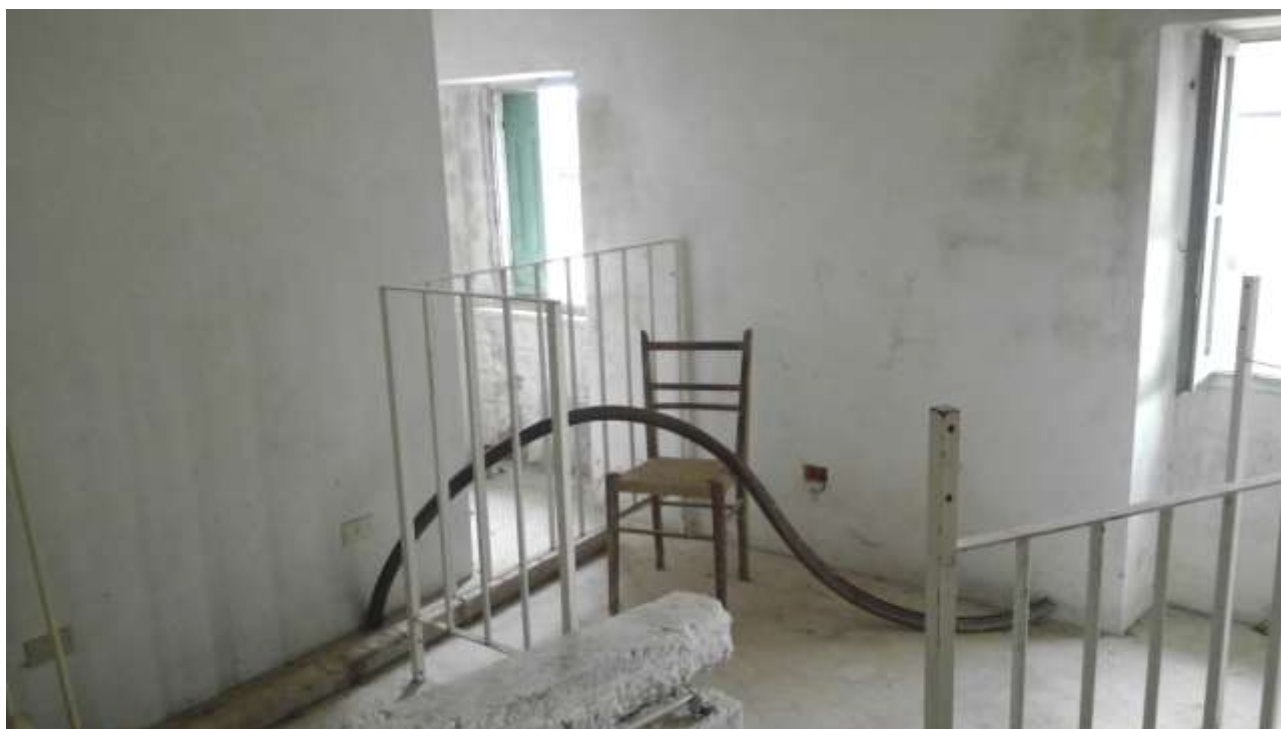
Foto n. 12 – Comune di Travesio (PN) – frazione Toppo - "Corte Dal Nodâr"- Lotto 1 – Foglio 8, Unità 1 – Piano primo – Veduta interna di porzione della camera di cui alla foto precedente.