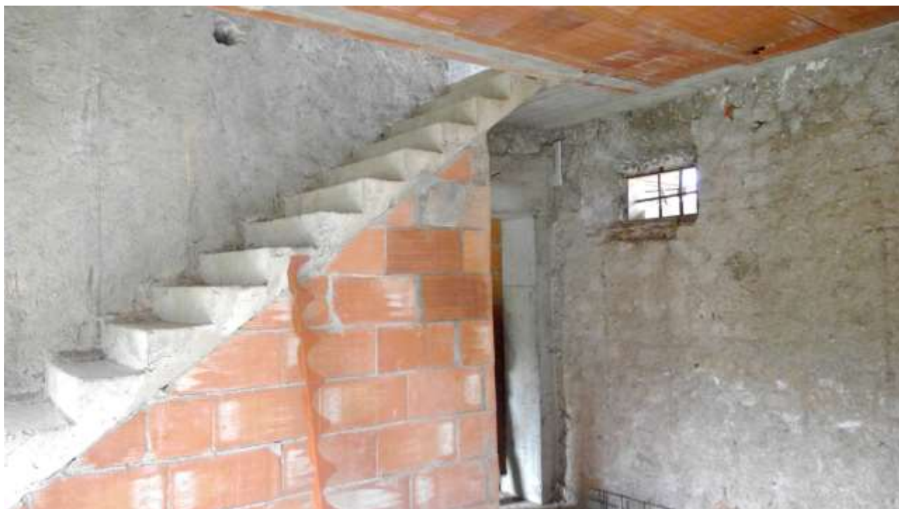
Foto n. 9 – Comune di Travesio (PN) – frazione Toppo - "Corte Dal Nodâr"- Lotto 1 – Foglio 8, Unità 2 – Piano terra – Veduta delle scale che portano al primo piano; sullo sfondo l'accesso a camera e bagno.