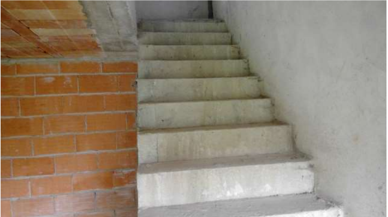
Foto n. 9 – Comune di Travesio (PN) – frazione Toppo - "Corte Dal Nodâr"- Lotto 1 – Foglio 8, Unità 1 – Piano terra – Particolare delle scale che, dal soggiorno, permettono l'accesso al primo piano.