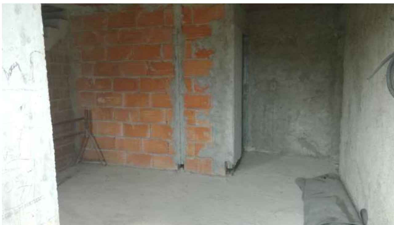
Foto n. 6 – Comune di Travesio (PN) – frazione Toppo - "Corte Dal Nodâr"- Lotto 1 – Foglio 8, Unità 4 – Piano primo – Accesso principale al soggiorno, posto al primo piano.