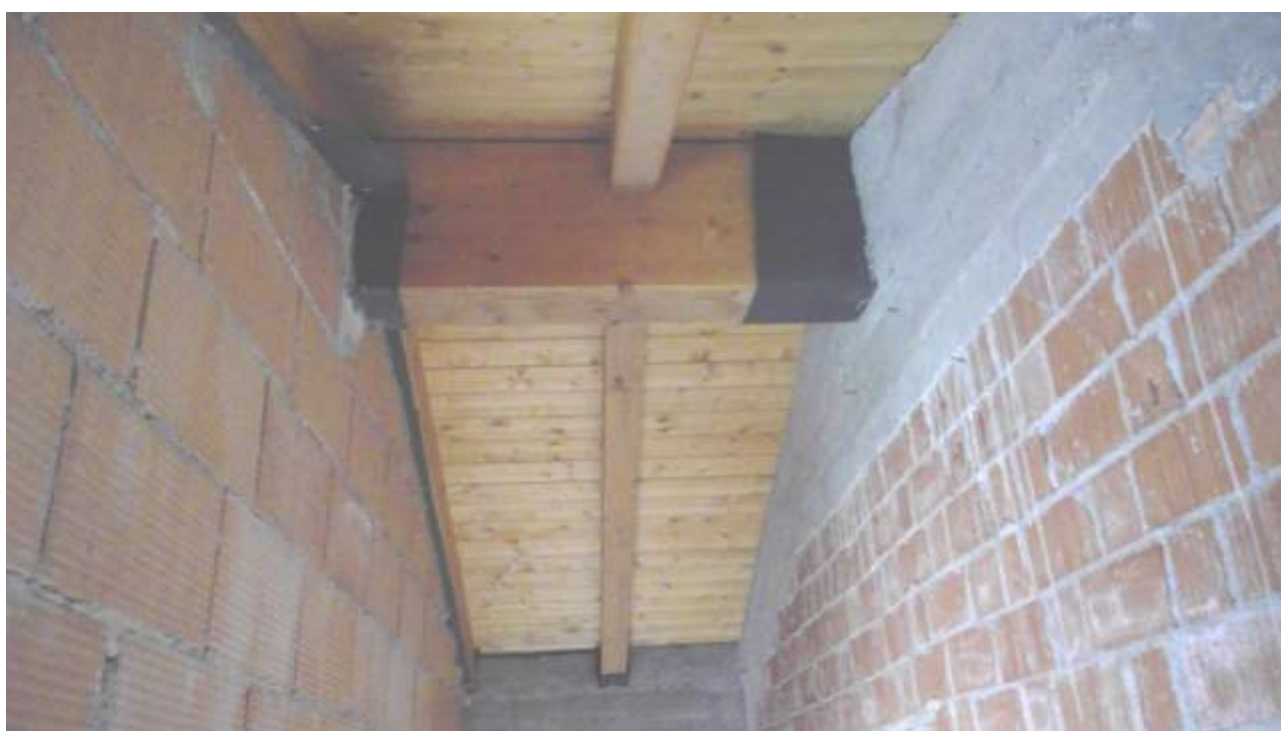
Foto n.16 – Comune di Travesio (PN) – frazione Toppo - “Corte Dal Nodâr”- Lotto 1 – Foglio 8, Unità 4 – Piano secondo – Particolare della struttura portante della copertura al secondo piano.