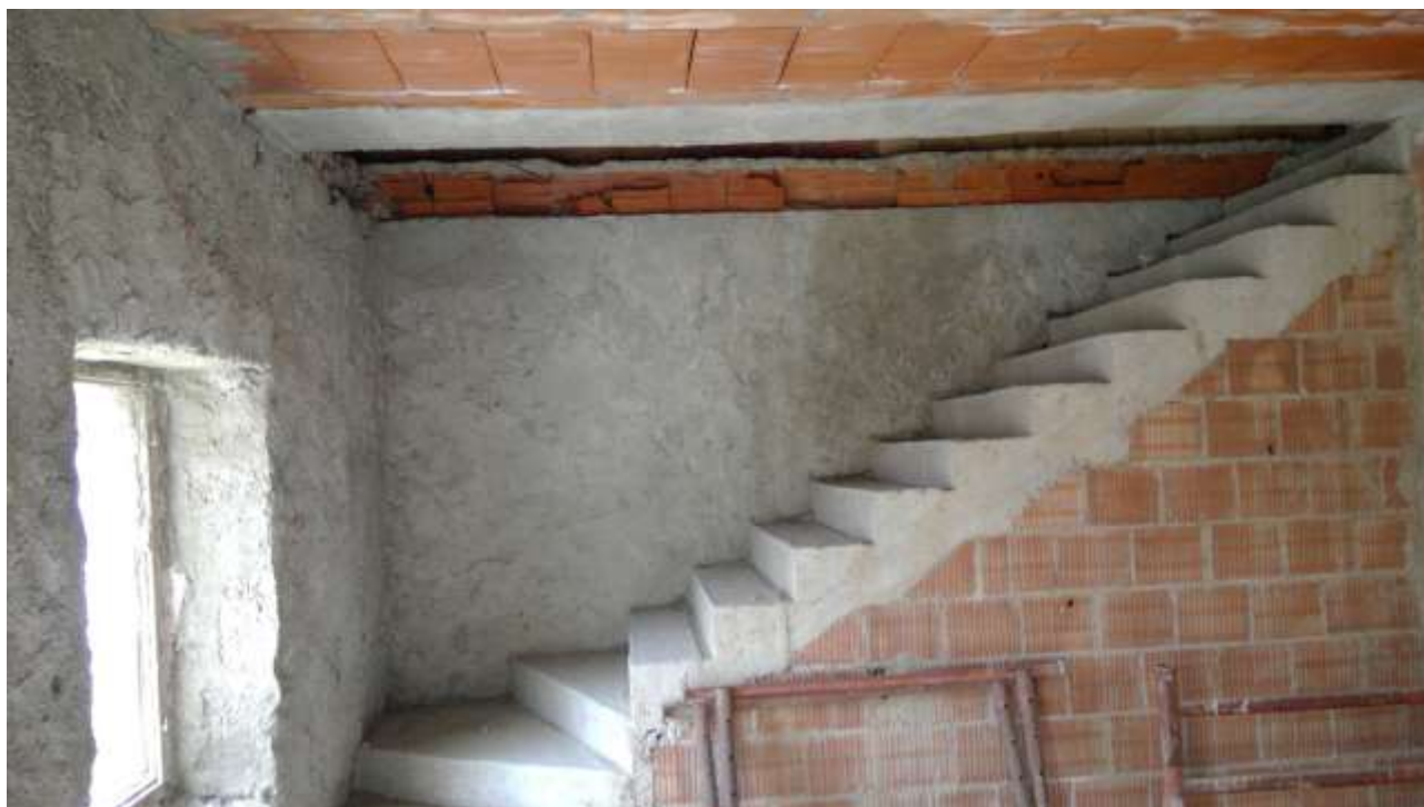
Foto n. 7 – Comune di Travesio (PN) – frazione Toppo - “Corte Dal Nodâr”- Lotto 1 – Foglio 8, Unità 4 – Piano primo – Veduta, dal soggiorno, delle scale di accesso al secondo piano.