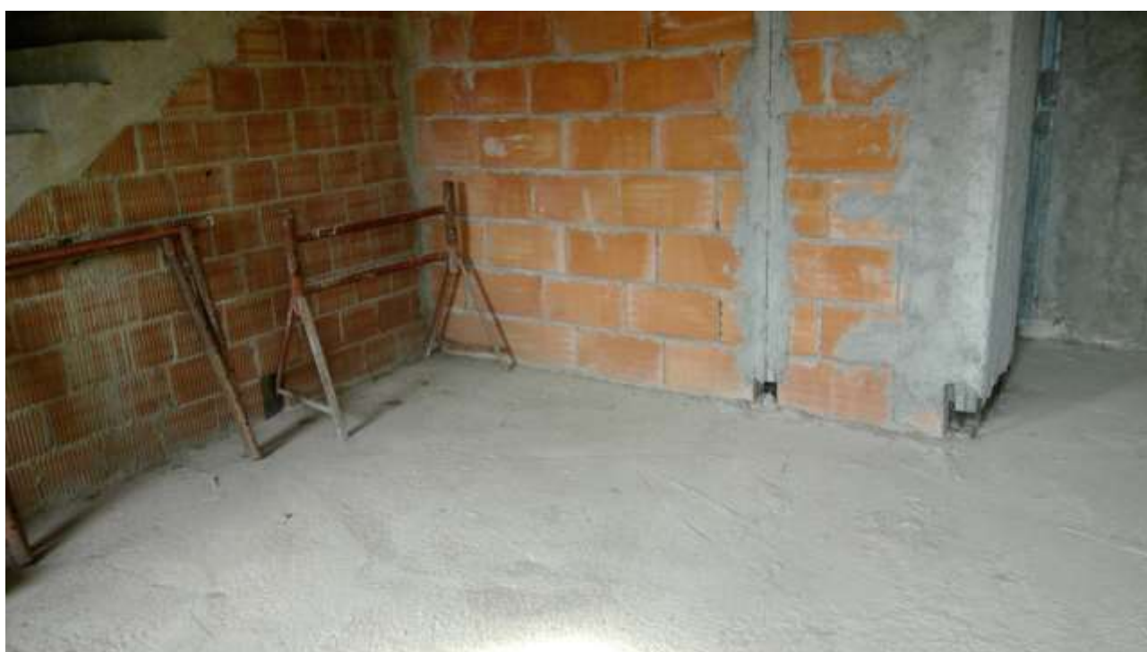
Foto n. 8 – Comune di Travesio (PN) – frazione Toppo - “Corte Dal Nodâr”- Lotto 1 – Foglio 8, Unità 4 – Piano primo – Veduta di porzione del soggiorno.