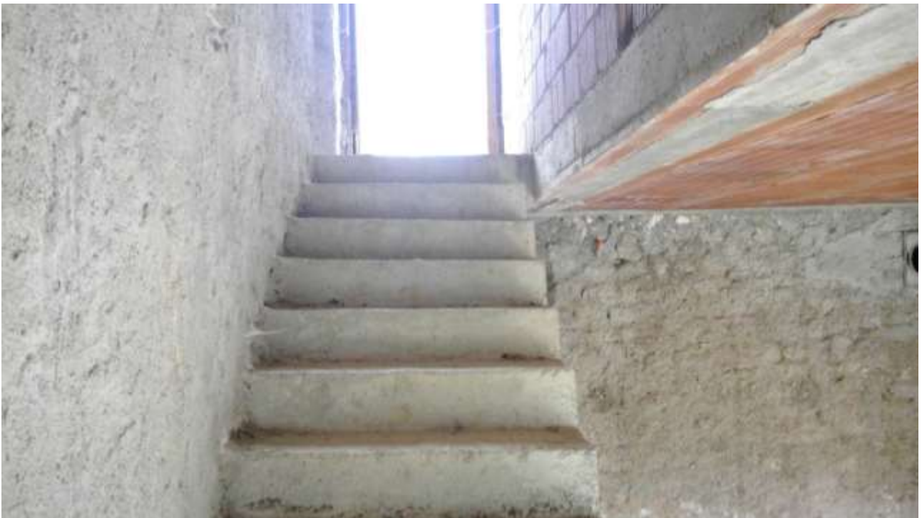
Foto n. 14 – Comune di Travesio (PN) – frazione Toppo - "Corte Dal Nodâr"- Lotto 1 – Foglio 8, Unità 2 – Piano terra – Veduta scale di accesso dal soggiorno al primo piano.