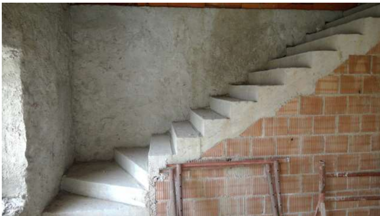
Foto n.14 – Comune di Travesio (PN) – frazione Toppo - “Corte Dal Nodâ”- Lotto 1 – Foglio 8, Unità 4 – Piano primo – Particolare delle scale che, dal soggiorno, permettono l’accesso al secondo piano.