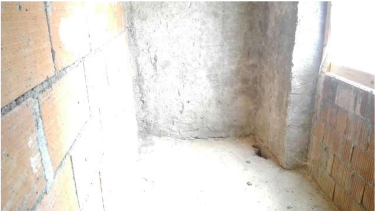
Foto n. 18 – Comune di Travesio (PN) – frazione Toppo - "Corte Dal Nodâr"- Lotto 1 – Foglio 8, Unità 2 – Piano primo – Veduta interna del bagno con affaccio su Via dei Masi.