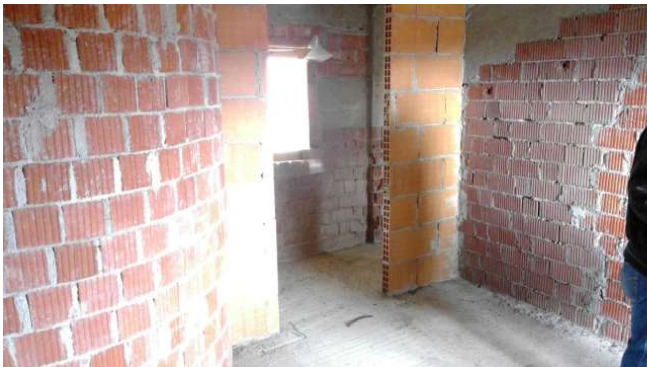
Foto n. 21 – Comune di Travesio (PN) – frazione Toppo - "Corte Dal Nodâr"- Lotto 1 – Foglio 8, Unità 1 – Piano secondo – Veduta del vano destinato a prima camera, posta a destra del corridoio d'accesso.