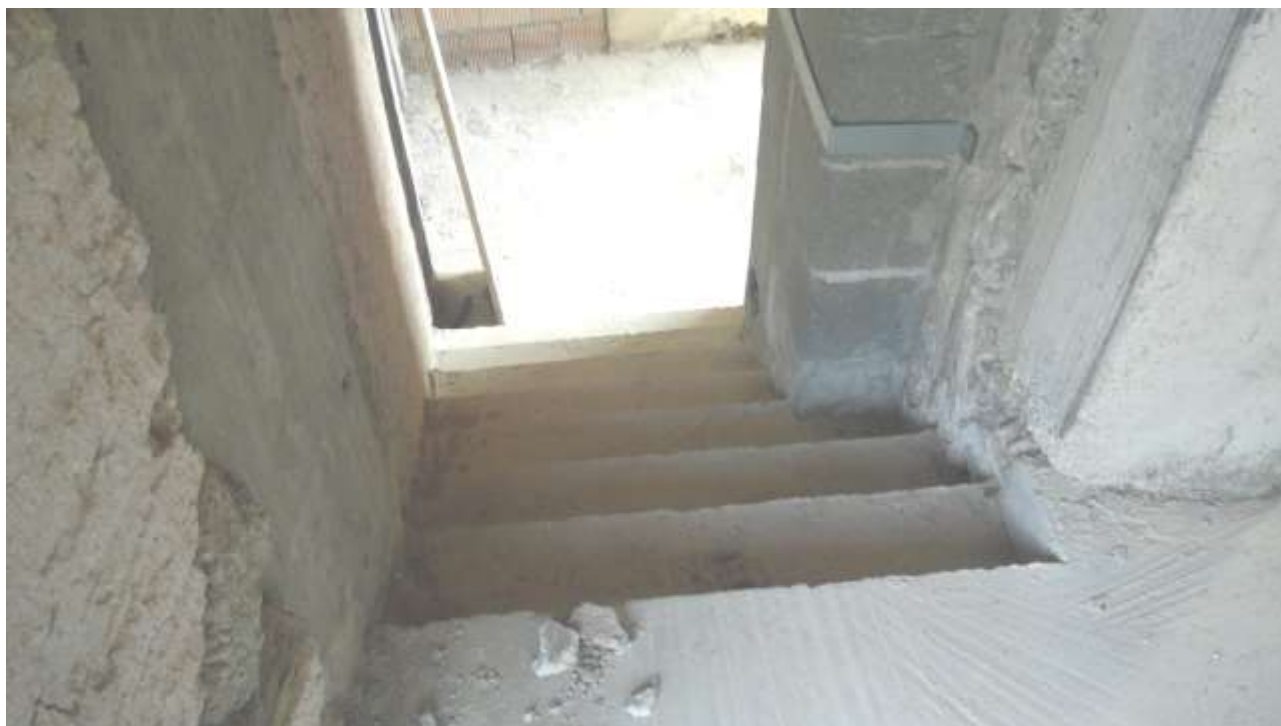
Foto n. 13 – Comune di Travesio (PN) – frazione Toppo - “Corte Dal Nodâ”- Lotto 1 – Foglio 8, Unità 4 – Piano primo – Particolare delle scale d’ingresso alla cucina dal terrazzo esterno, in comune con l’unità 3.