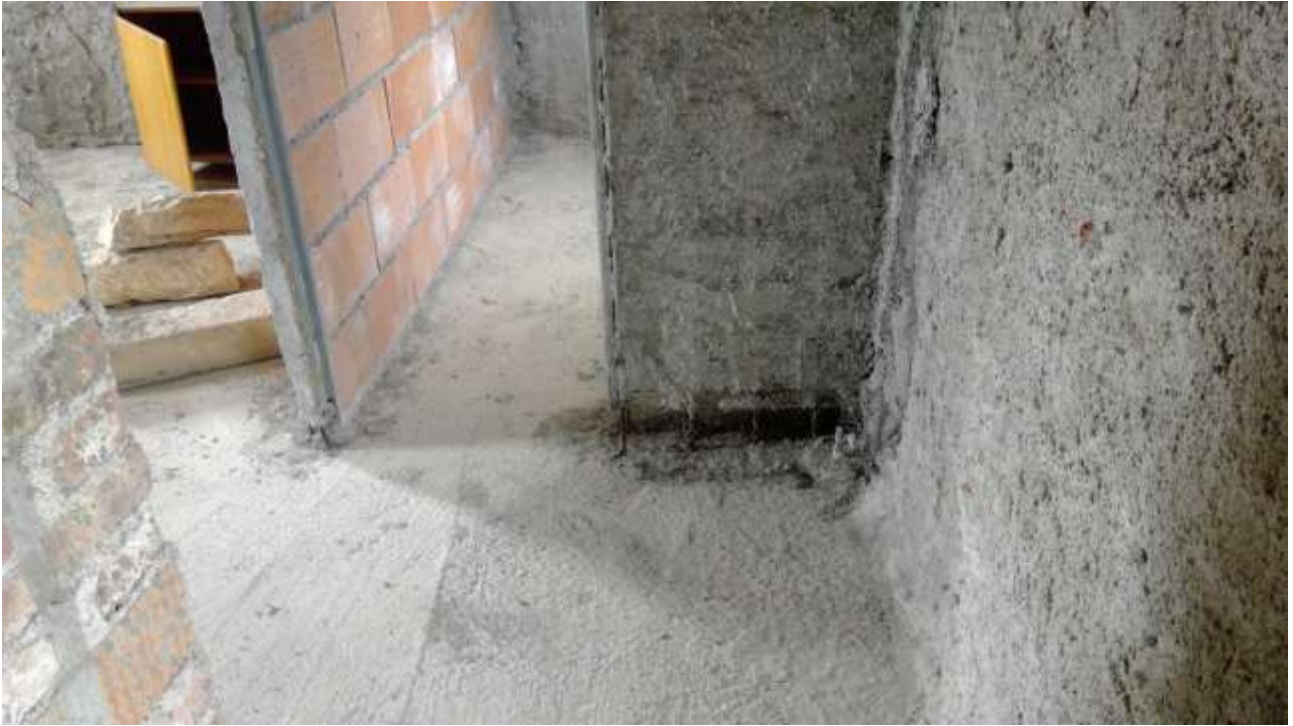
Foto n. 15 – Comune di Travesio (PN) – frazione Toppo - "Corte Dal Nodâr"- Lotto 1 – Foglio 8, Unità 2 – Piano primo – Accesso, dalle scale, a camera e bagno.