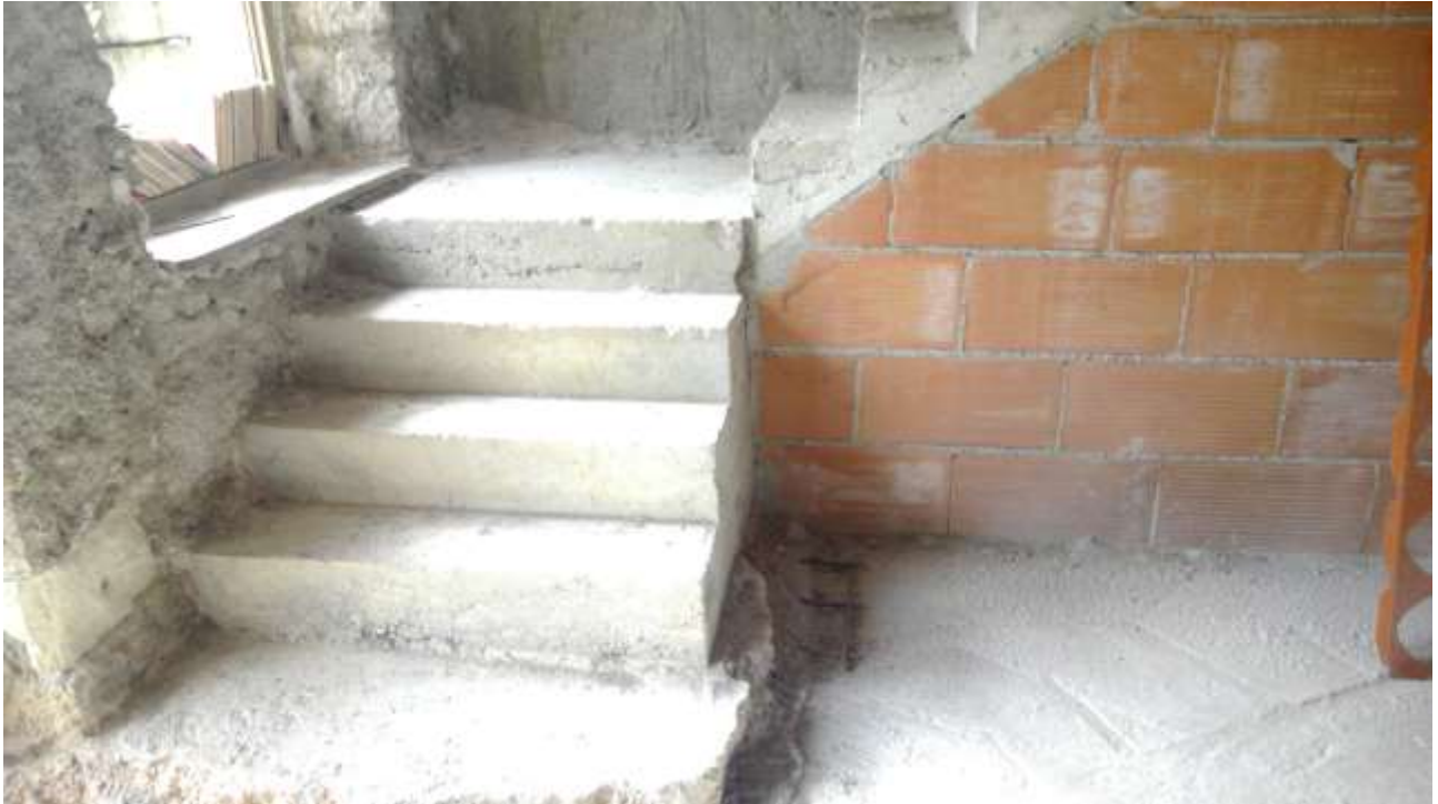
Foto n. 5 – Comune di Travesio (PN) – frazione Toppo - "Corte Dal Nodâr"- Lotto 1 – Foglio 8, Unità 2 – Piano terra – Porzione del soggiorno con particolare delle scale di accesso al primo piano.