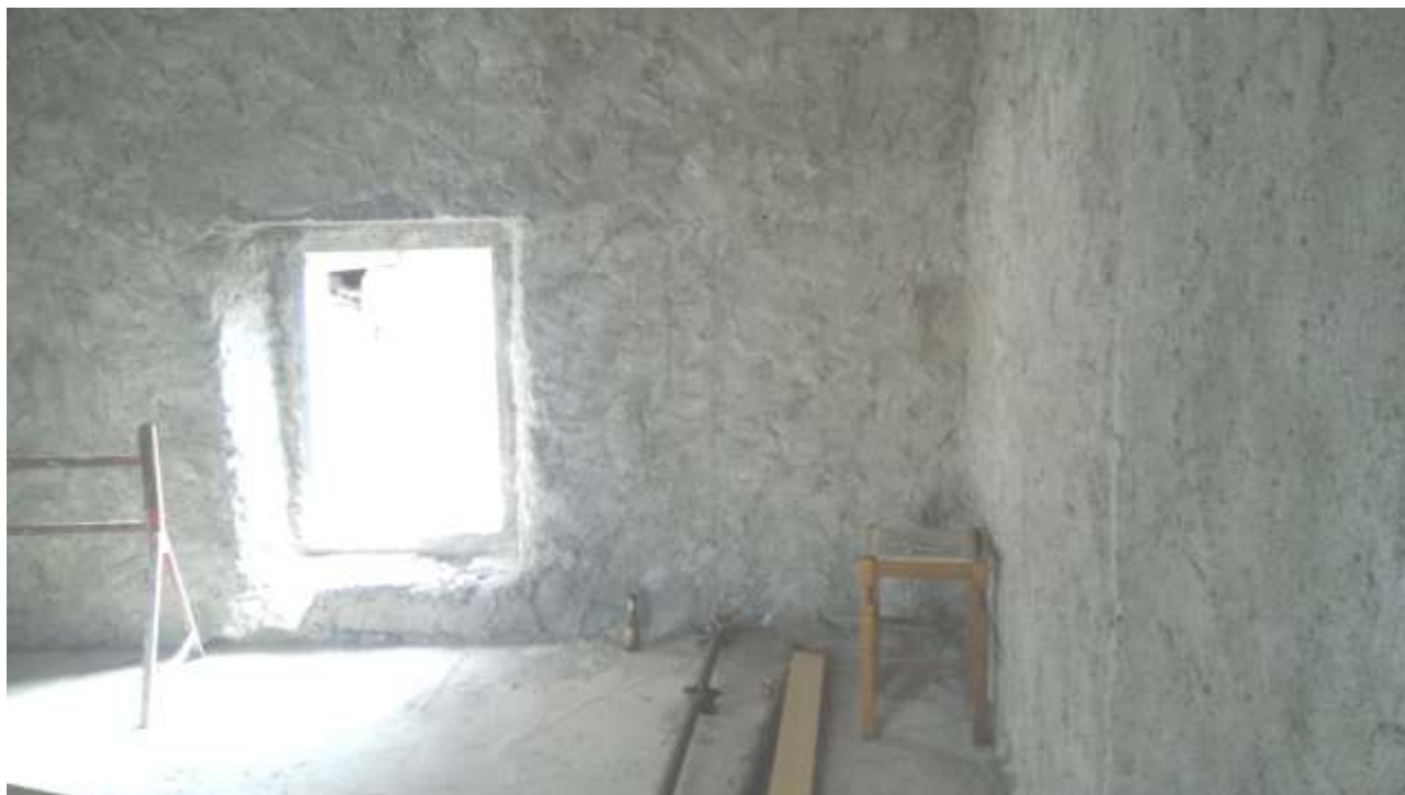
Foto n. 12 – Comune di Travesio (PN) – frazione Toppo - "Corte Dal Nodâr"- Lotto 1 – Foglio 8, Unità 4 – Piano primo – Veduta interna di porzione del vano destinato a cucina.