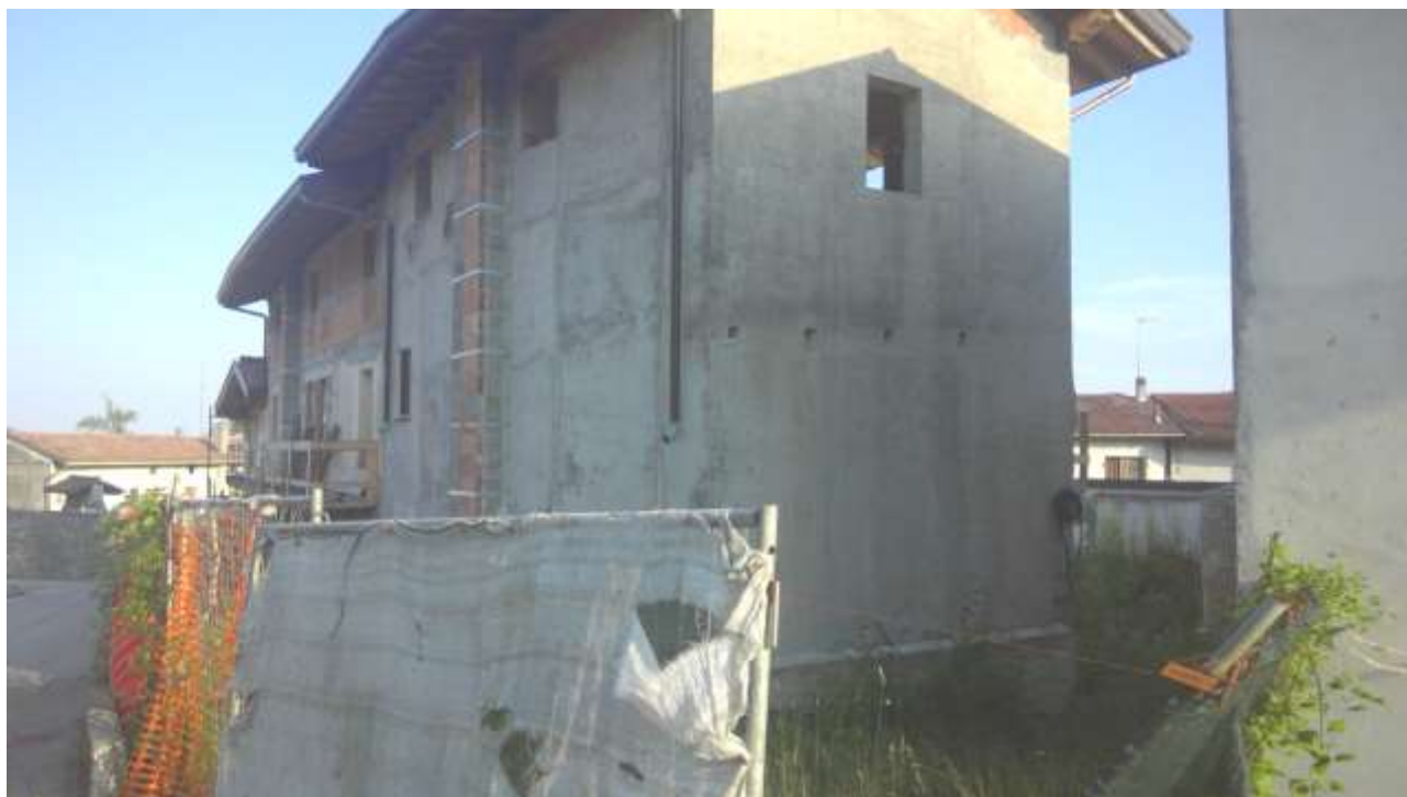
Foto n. 1 – Comune di Travesio (PN) – frazione Toppo - "Corte Dal Nodâr"- Lotto 1 – Foglio 8, Unità 1 – Esterni – Veduta generale dell'immobile pignorato con accesso dalla strada Via dei Masi.