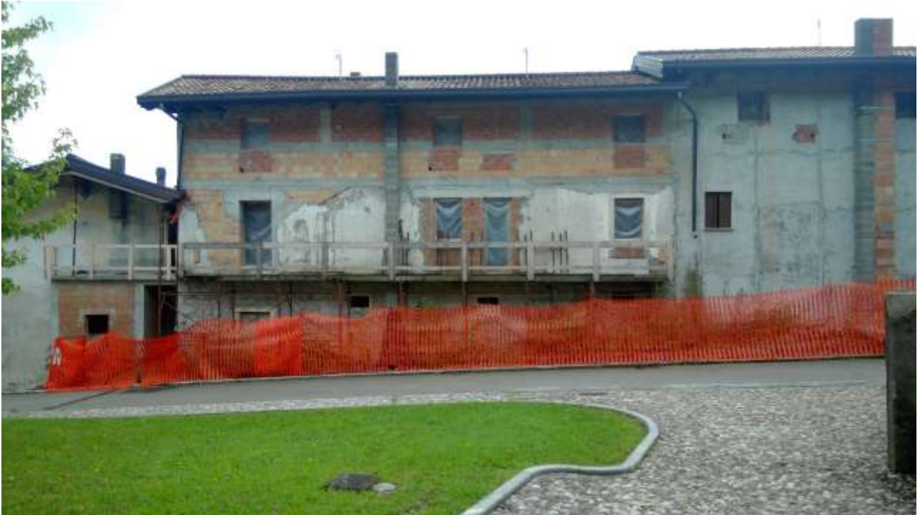
Foto n. 1 – Comune di Travesio (PN), Via dei Masi – frazione Toppo - “Corte Dal Nodâr”- Lotto 1 – Foglio 8 – Veduta generale dell’immobile pignorato; l’unità 4 è collocata nella porzione sinistra, sul primo e secondo piano.