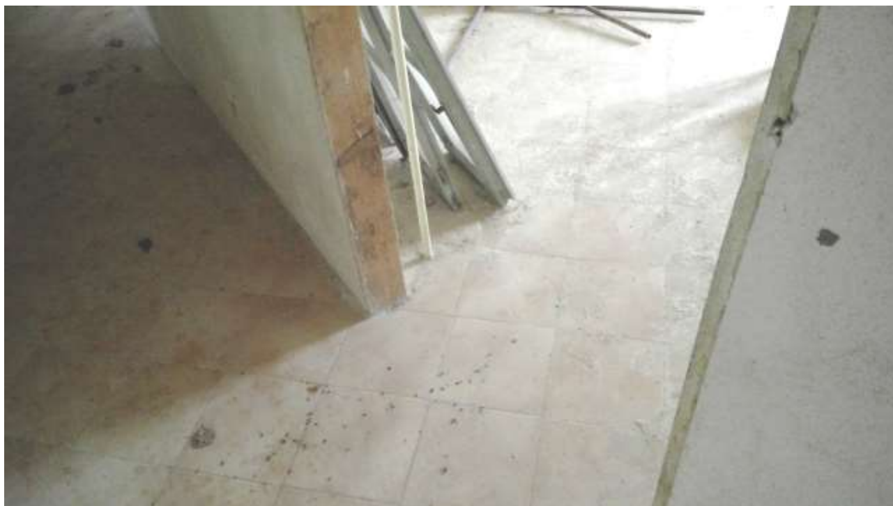
Foto n. 11 – Comune di Travesio (PN) – frazione Toppo - "Corte Dal Nodâr"- Lotto 1 – Foglio 8, Unità 1 – Piano primo – Veduta di porzione della camera, posta a sinistra del corridoio d'accesso.