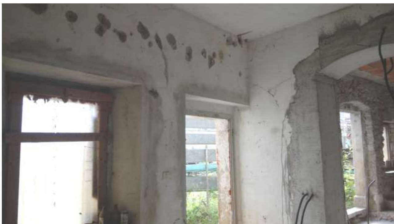
Foto n. 8 – Comune di Travesio (PN) – frazione Toppo - "Corte Dal Nodâr"- Lotto 1 – Foglio 8, Unità 2 – Piano terra – Veduta, dal vano destinato a cucina, del secondo ingresso esterno.