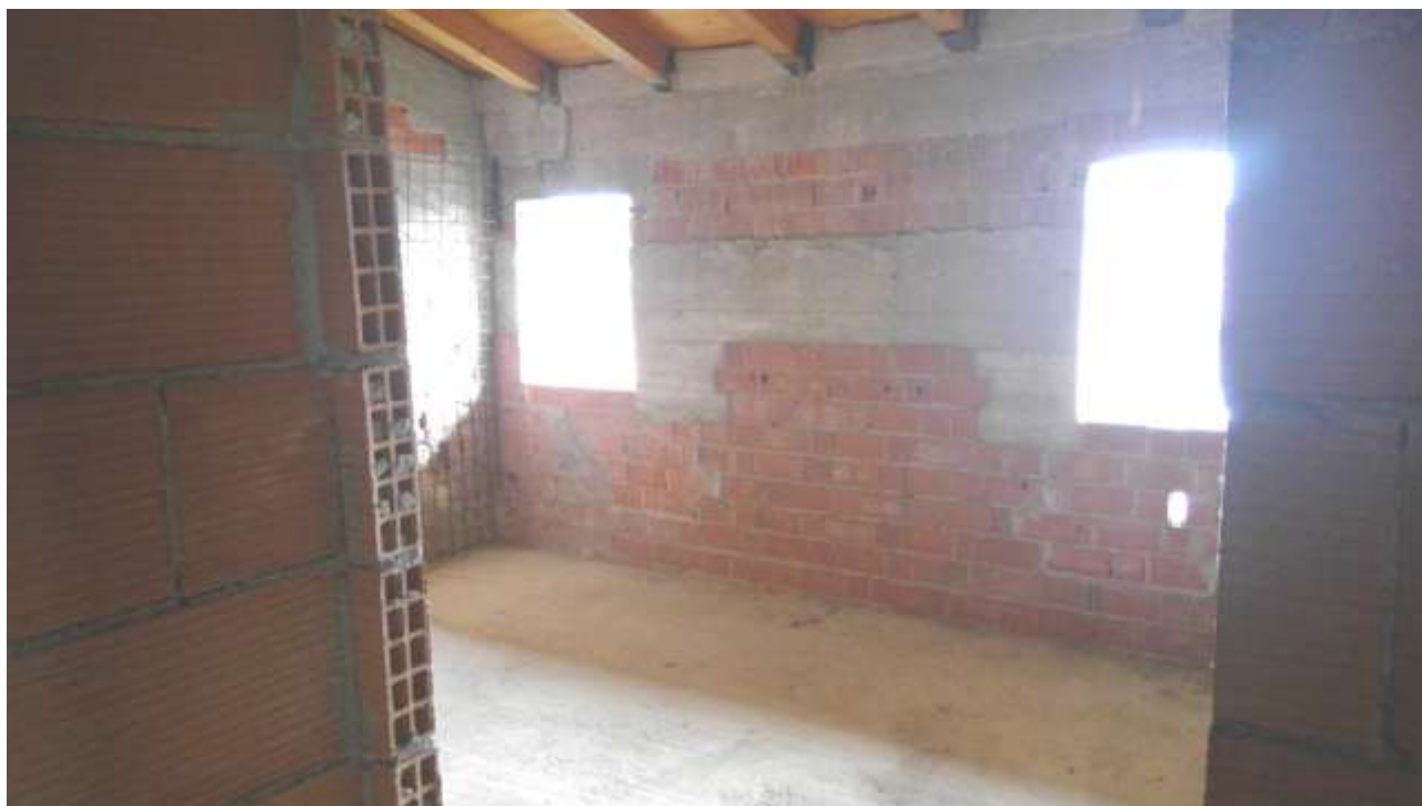
Foto n. 25 – Comune di Travesio (PN) – frazione Toppo - "Corte Dal Nodâr"- Lotto 1 – Foglio 8, Unità 1 – Piano secondo – Veduta generale della seconda camera dal corridoio comune al bagno.