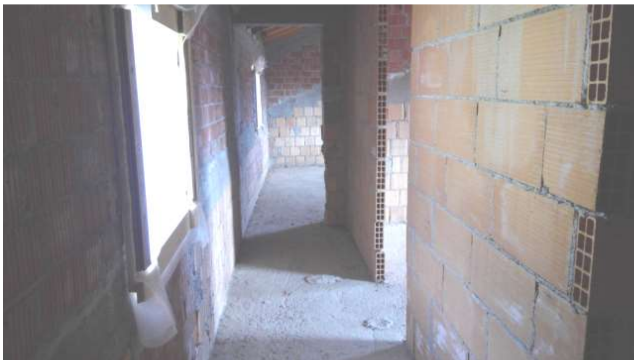
Foto n. 20 – Comune di Travesio (PN) – frazione Toppo - “Corte Dal Nodâ”- Lotto 1 – Foglio 8, Unità 4 – Piano secondo – Veduta del corridoio che porta alle due camere poste ad est.