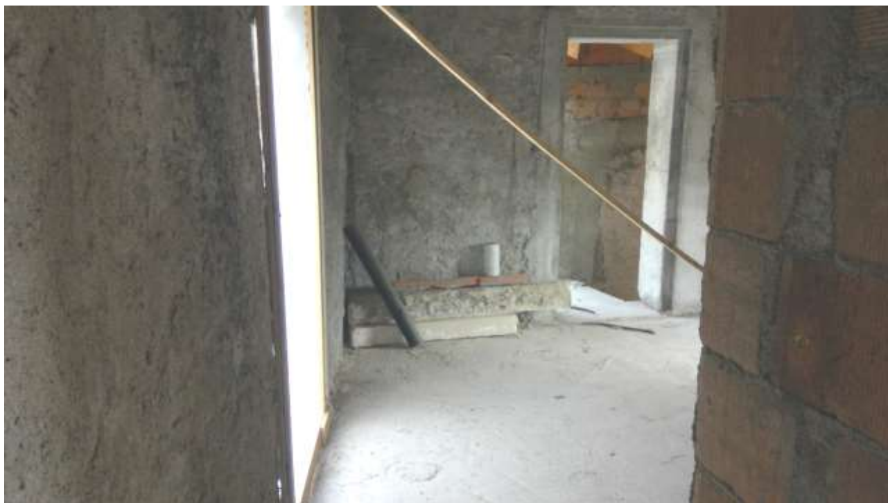
Foto n. 11 – Comune di Travesio (PN) – frazione Toppo - "Corte Dal Nodâr"- Lotto 1 – Foglio 8, Unità 4 – Piano primo – Accesso al vano uso cucina dal soggiorno; a sinistra la porta d'accesso al terrazzo, sullo sfondo quella che porta al terrazzo e alle scale in comune con l'U3.