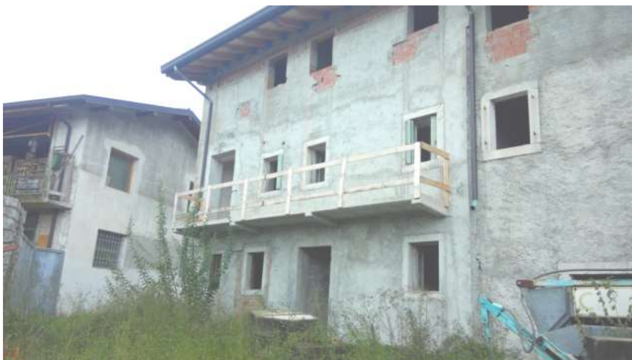
Foto n. 2 – Comune di Travesio (PN) – frazione Toppo - "Corte Dal Nodâr"- Lotto 1 – Foglio 8, Unità 1 – Esterni – Veduta generale dell'immobile pignorato visto dalla corte interna.