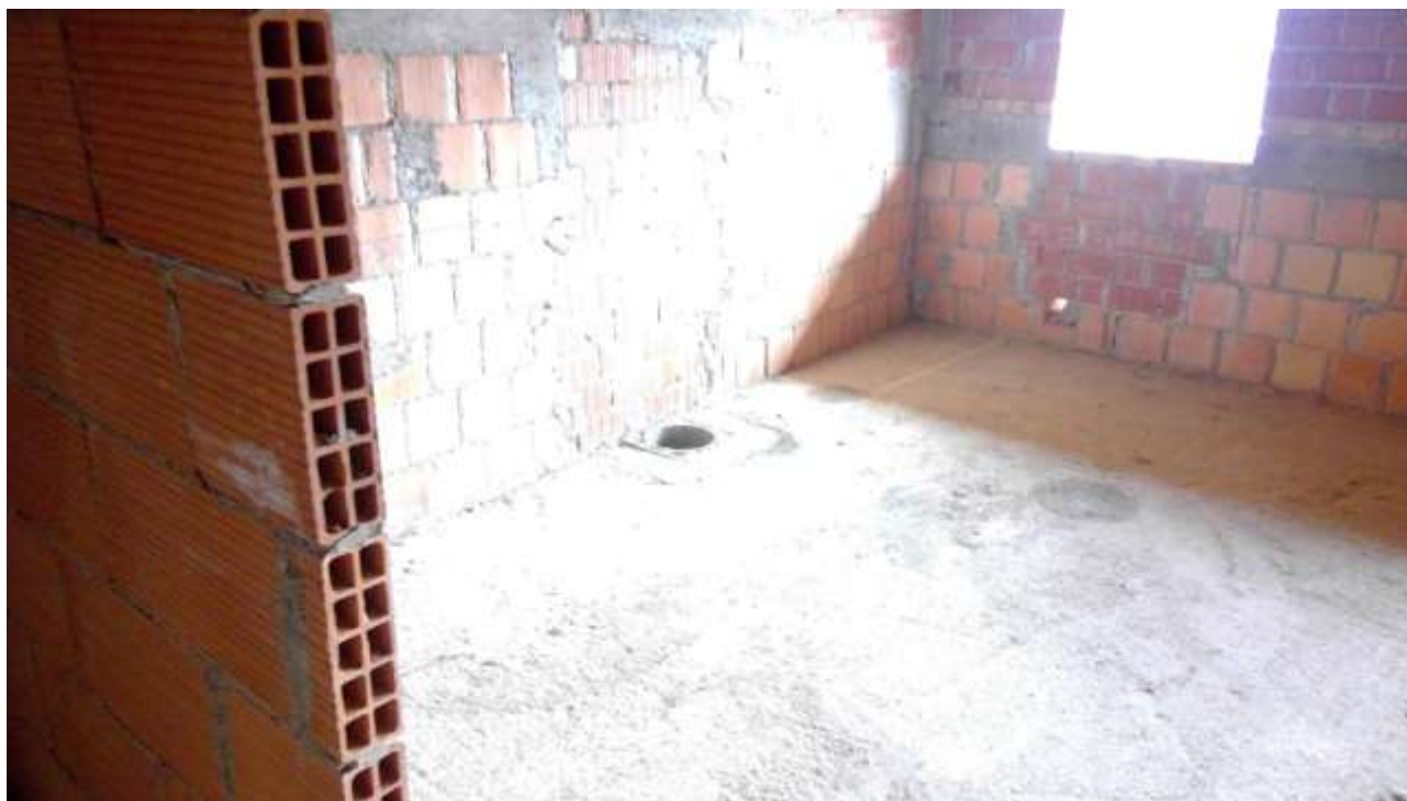
Foto n. 21 – Comune di Travesio (PN) – frazione Toppo - “Corte Dal Nodâr”- Lotto 1 – Foglio 8, Unità 4 – Piano secondo – Veduta parziale della prima camera ad est.