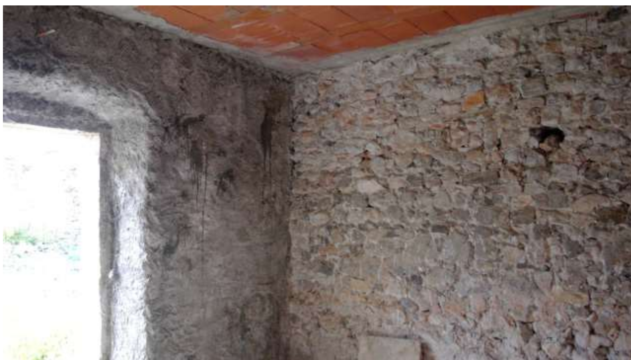
Foto n. 12 – Comune di Travesio (PN) – frazione Toppo - "Corte Dal Nodâr"- Lotto 1 – Foglio 8, Unità 2 – Piano terra – Particolare del vano uso camera con apertura su corte comune.