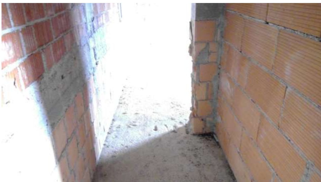
Foto n. 22 – Comune di Travesio (PN) – frazione Toppo - “Corte Dal Nodâr”- Lotto 1 – Foglio 8, Unità 4 – Piano secondo – corridoio d’accesso alla seconda camera.