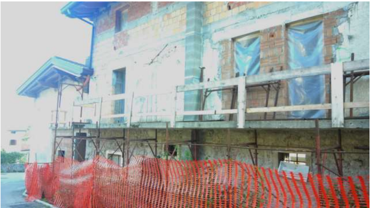
Foto n. 2 – Comune di Travesio (PN) – frazione Toppo - “Corte Dal Nodâr”- Lotto 1 – Foglio 8, Unità 4 – Esterni – Veduta, da Via dei Masi, della facciata nord della U4.