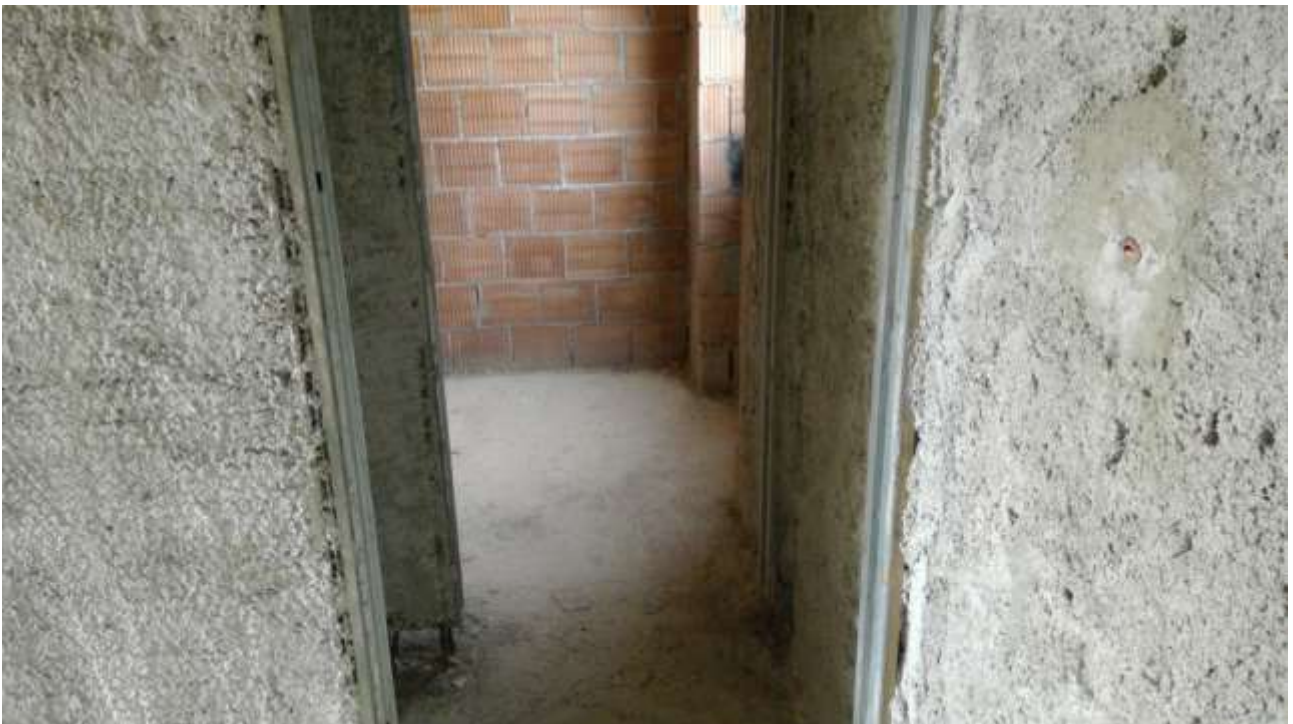
Foto n. 10 – Comune di Travesio (PN) – frazione Toppo - “Corte Dal Nodâr”- Lotto 1 – Foglio 8, Unità 4 – Piano primo – Ingresso ai vani uso antibagno e bagno.