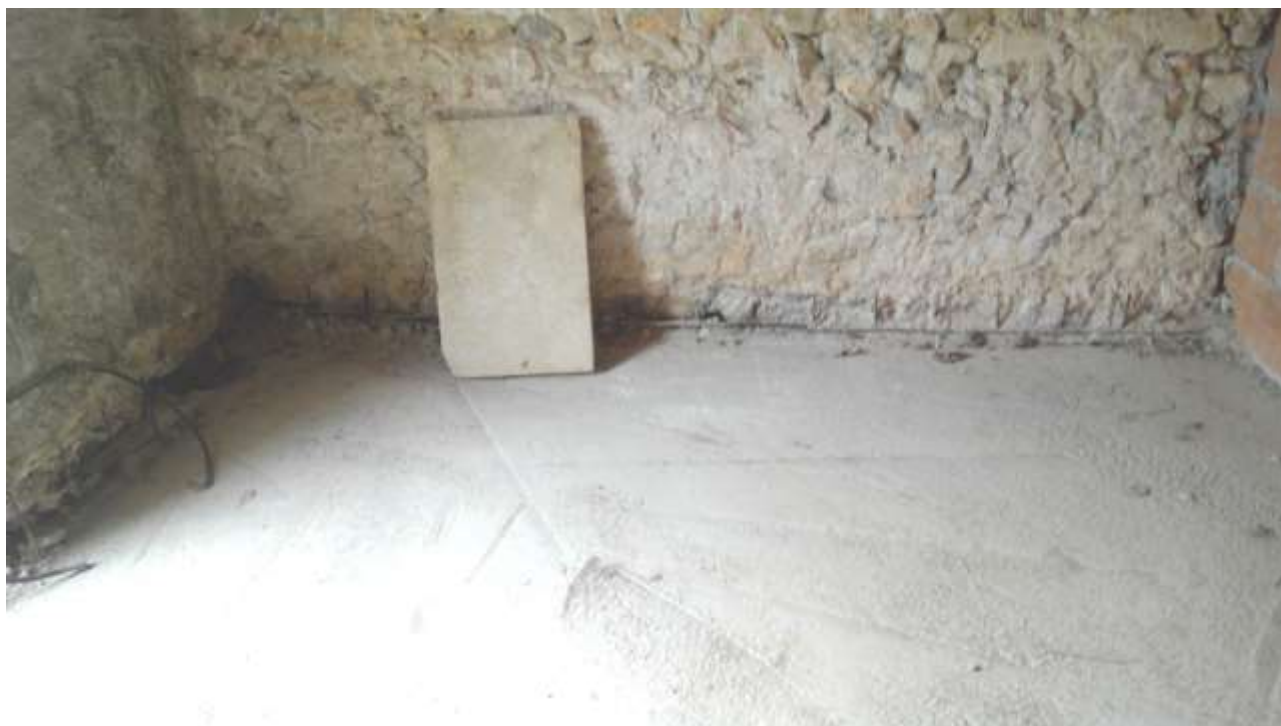
Foto n. 11 – Comune di Travesio (PN) – frazione Toppo - "Corte Dal Nodâr"- Lotto 1 – Foglio 8, Unità 2 – Piano terra – Veduta del vano al grezzo destinato a camera.