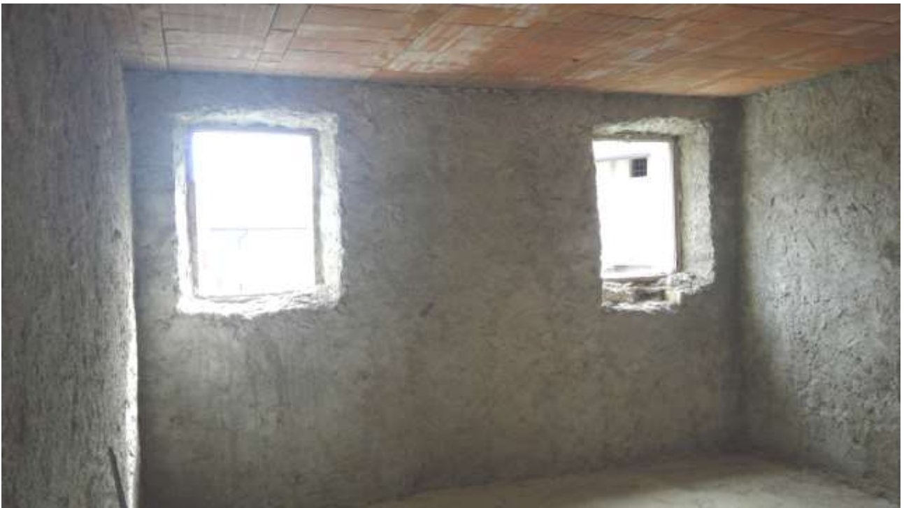
Foto n. 16 – Comune di Travesio (PN) – frazione Toppo - "Corte Dal Nodâr"- Lotto 1 – Foglio 8, Unità 2 – Piano primo – Veduta interna del vano destinato a camera con affaccio su corte comune.