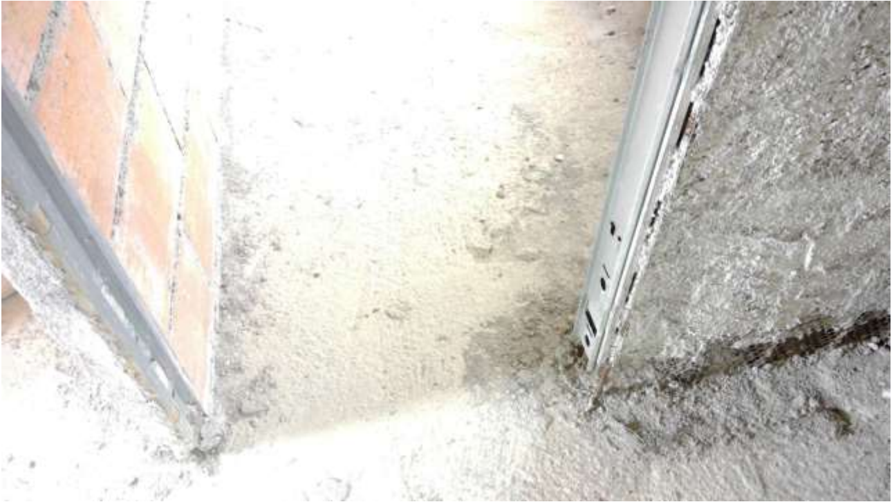
Foto n. 17 – Comune di Travesio (PN) – frazione Toppo - "Corte Dal Nodâr"- Lotto 1 – Foglio 8, Unità 2 – Piano primo – Ingresso al bagno posto lateralmente alla camera.