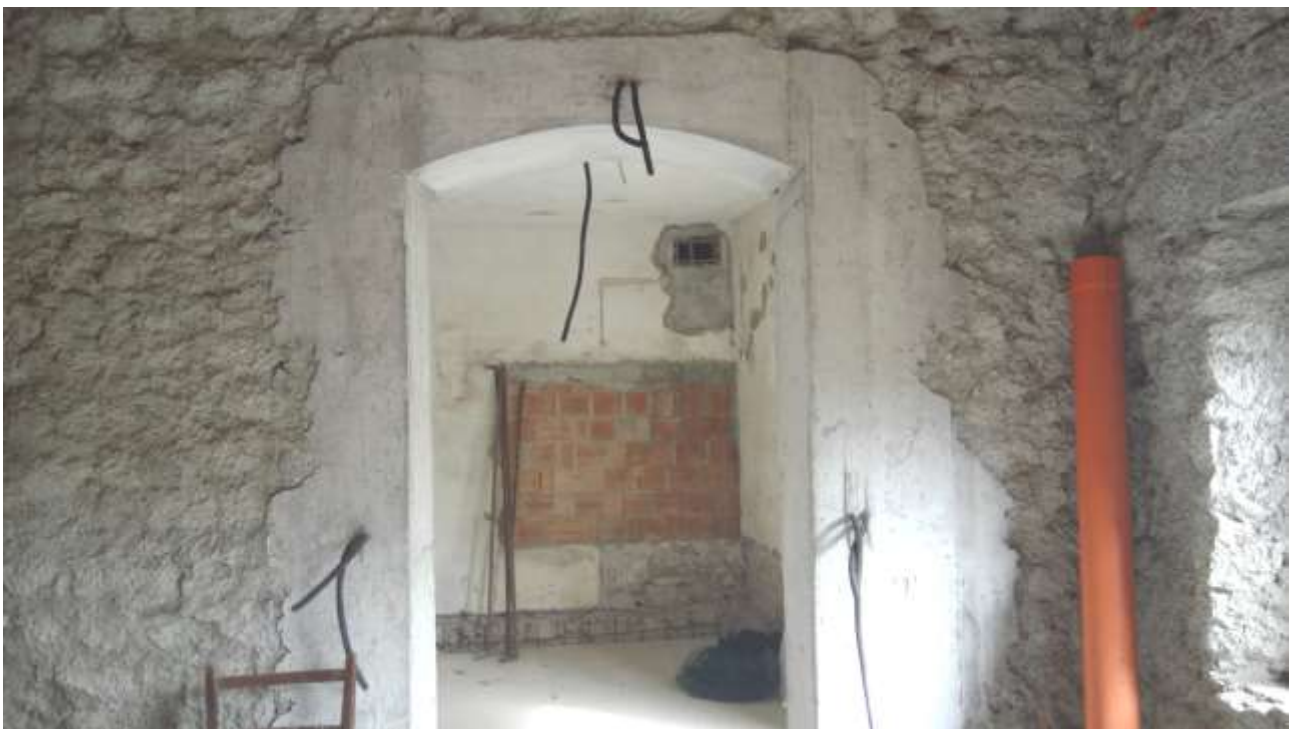
Foto n. 6 – Comune di Travesio (PN) – frazione Toppo - "Corte Dal Nodâr"- Lotto 1 – Foglio 8, Unità 2 – Piano terra – Veduta dell'ingresso alla cucina posta a destra del soggiorno.