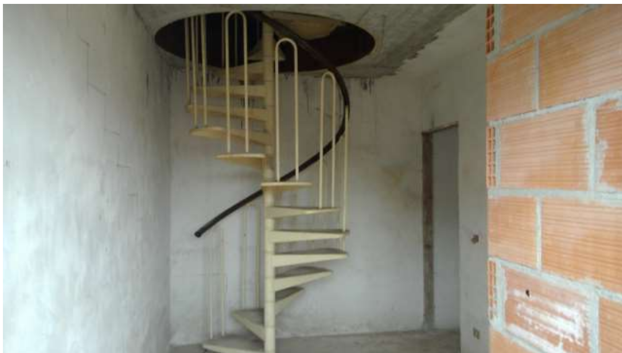
Foto n. 17 – Comune di Travesio (PN) – frazione Toppo - "Corte Dal Nodâr"- Lotto 1 – Foglio 8, Unità 1 – Piano primo – Scala a chiocciola interna che dà accesso al secondo piano.