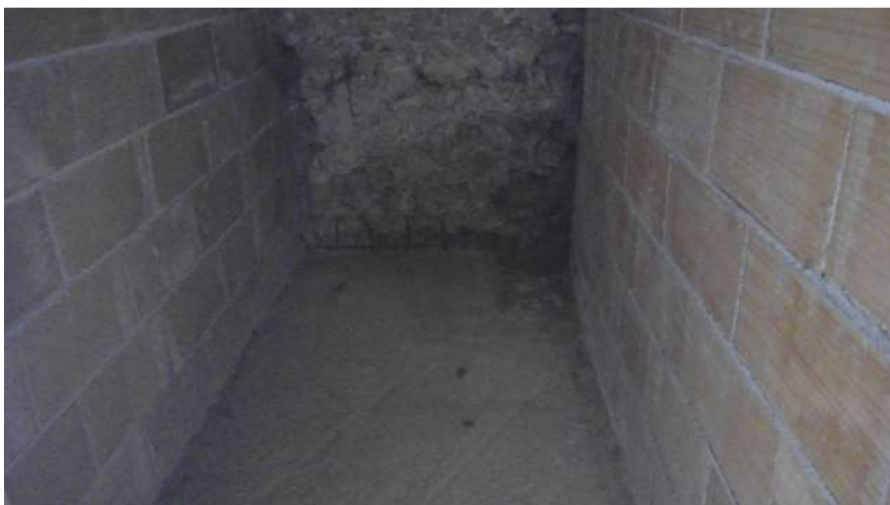
Foto n. 10 – Comune di Travesio (PN) – frazione Toppo - "Corte Dal Nodâr"- Lotto 1 – Foglio 8, Unità 2 – Piano terra – Particolare del sottoscala.