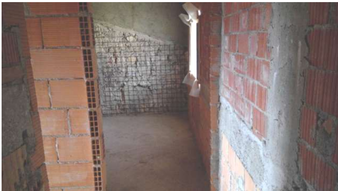
Foto n. 17 – Comune di Travesio (PN) – frazione Toppo - “Corte Dal Nodâr”- Lotto 1 – Foglio 8, Unità 4 – Piano secondo – Veduta frontale dell’ingresso al bagno.