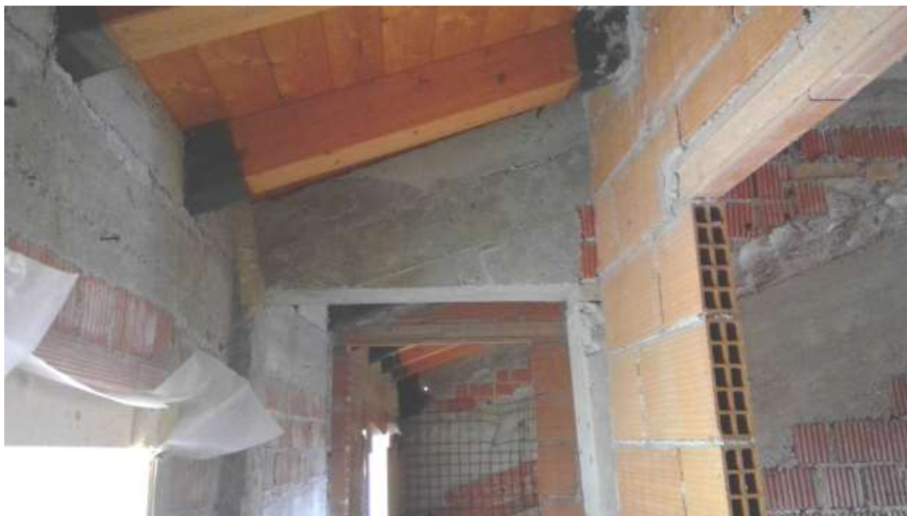
Foto n. 23 – Comune di Travesio (PN) – frazione Toppo - "Corte Dal Nodâr"- Lotto 1 – Foglio 8, Unità 1 – Piano secondo – Corridoio di accesso alla seconda camera e al bagno.