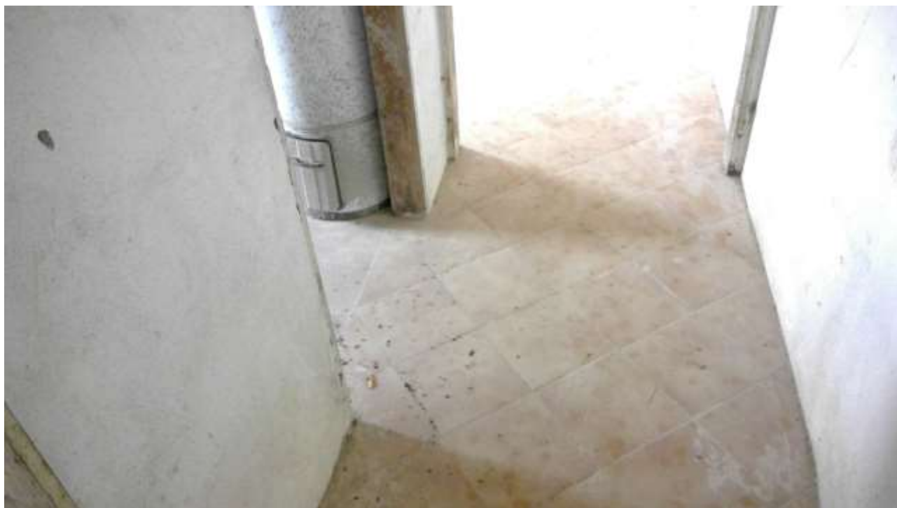
Foto n. 13 – Comune di Travesio (PN) – frazione Toppo - "Corte Dal Nodâr"- Lotto 1 – Foglio 8, Unità 1 – Piano primo – Veduta del corridoio di accesso al bagno.