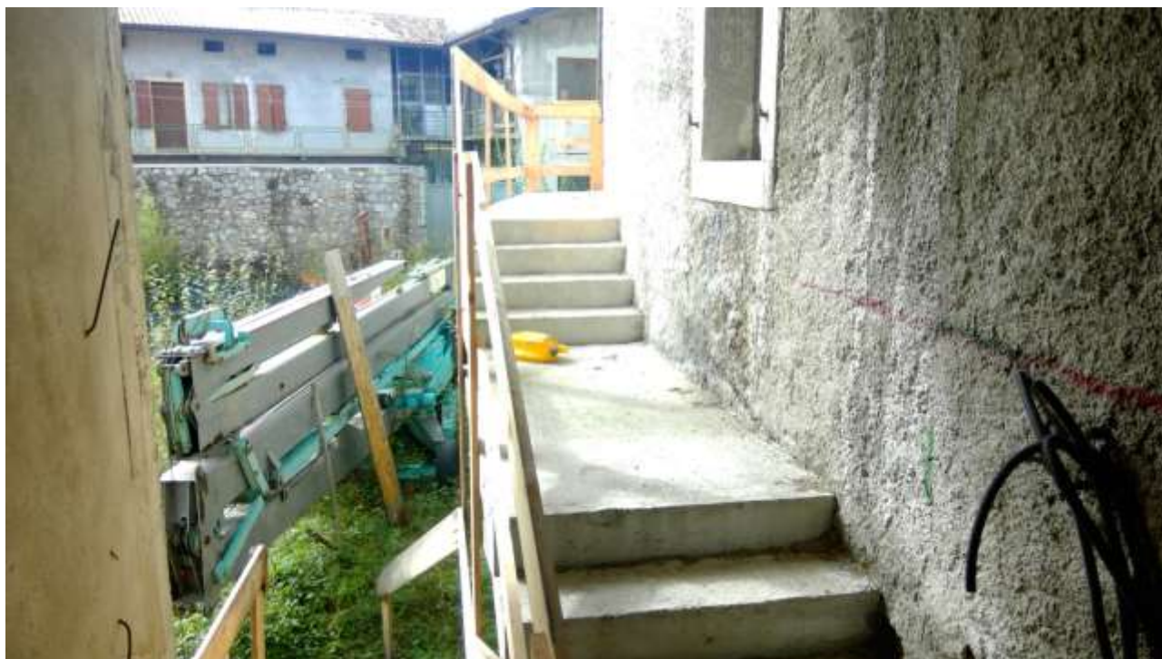
Foto n. 5 – Comune di Travesio (PN) – frazione Toppo - "Corte Dal Nodâr"- Lotto 1 – Foglio 8, Unità 4 – Esterni – Veduta delle scale di accesso esclusivo all' unità 4.