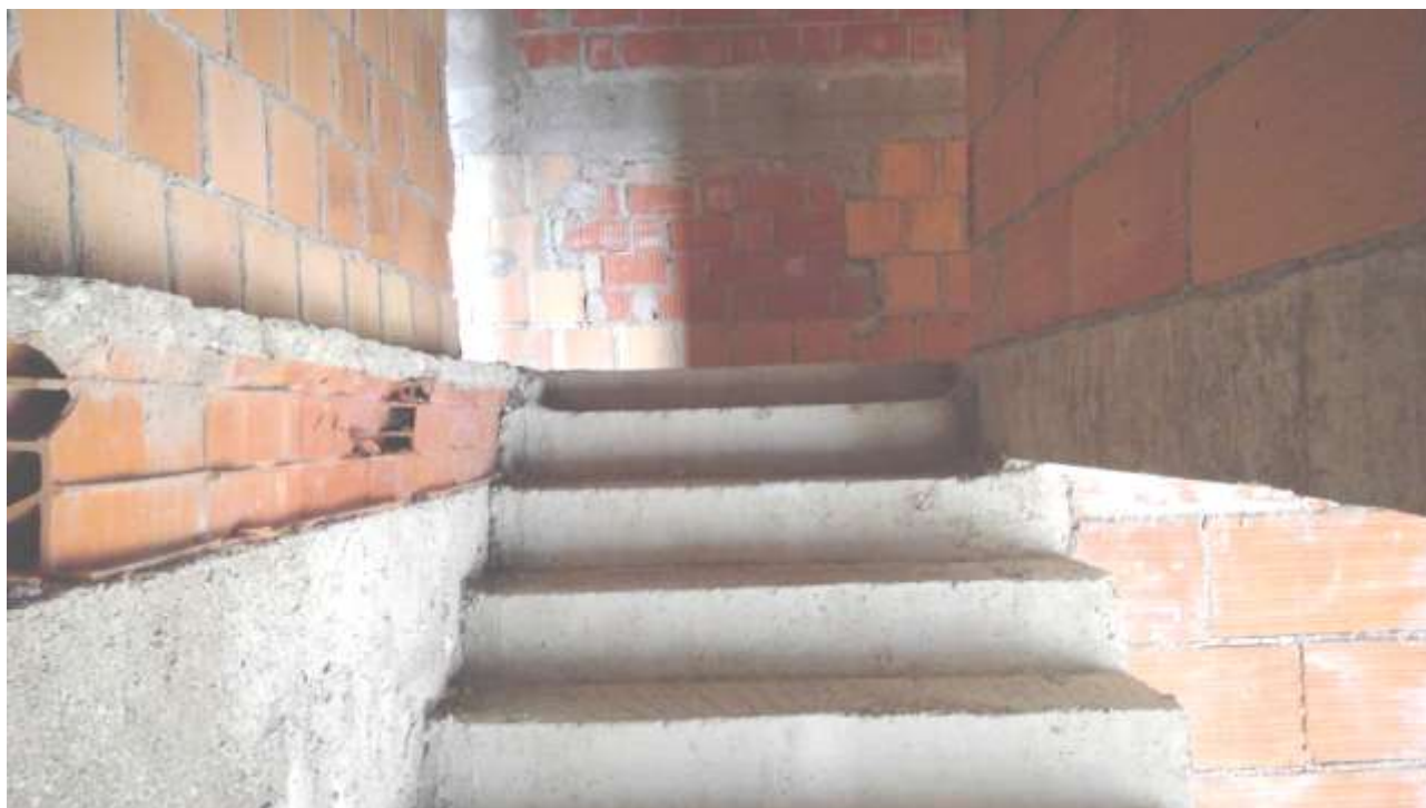
Foto n.15 – Comune di Travesio (PN) – frazione Toppo - “Corte Dal Nodâr”- Lotto 1 – Foglio 8, Unità 4 – Piano secondo – Particolare della porzione terminale delle scale d’accesso al corridoio del secondo piano.