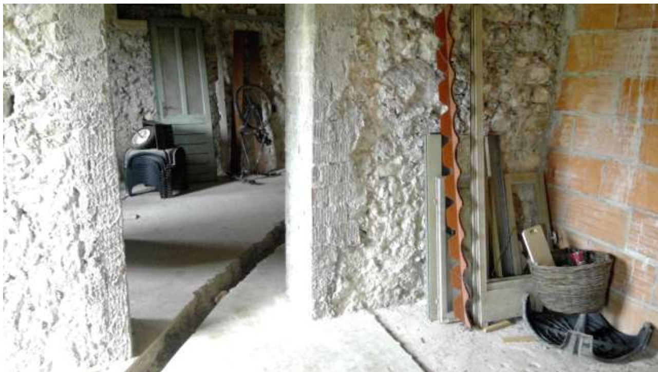
Foto n. 6 – Comune di Travesio (PN) – frazione Toppo - "Corte Dal Nodâr"- Lotto 1 – Foglio 8, Unità 1 – Piano terra – Veduta dell'accesso al vano predisposto a cucina.