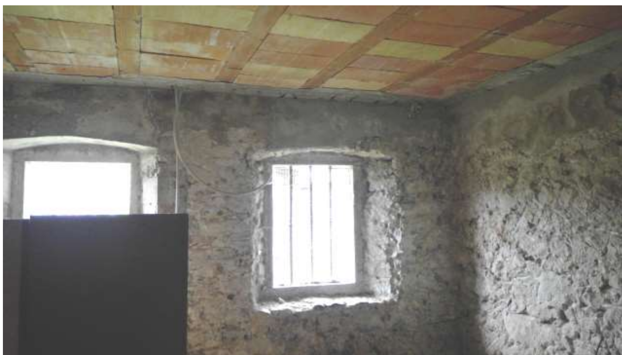
Foto n.8 – Comune di Travesio (PN) – frazione Toppo - "Corte Dal Nodâr"- Lotto 1 – Foglio 8, Unità 1 – Piano terra – Particolare della collocazione delle finestre.