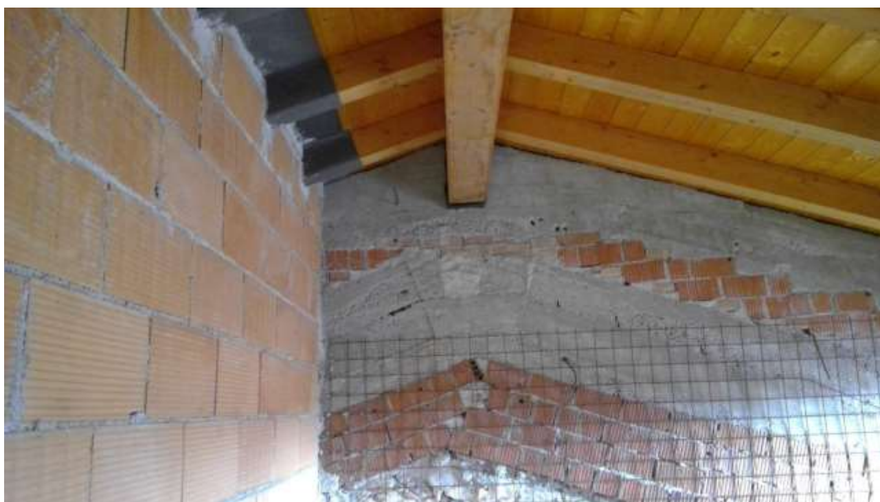
Foto n. 26 – Comune di Travesio (PN) – frazione Toppo - "Corte Dal Nodâr"- Lotto 1 – Foglio 8, Unità 1 – Piano secondo – Particolare del sottotetto nella seconda camera.