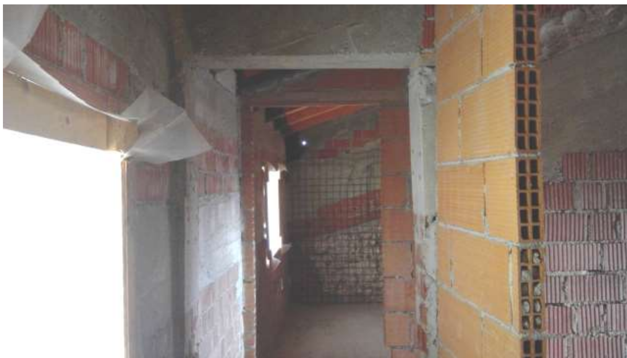
Foto n. 20 – Comune di Travesio (PN) – frazione Toppo - "Corte Dal Nodâr"- Lotto 1 – Foglio 8, Unità 1 – Piano secondo – Veduta del corridoio dall' accesso della scala a chiocciola.