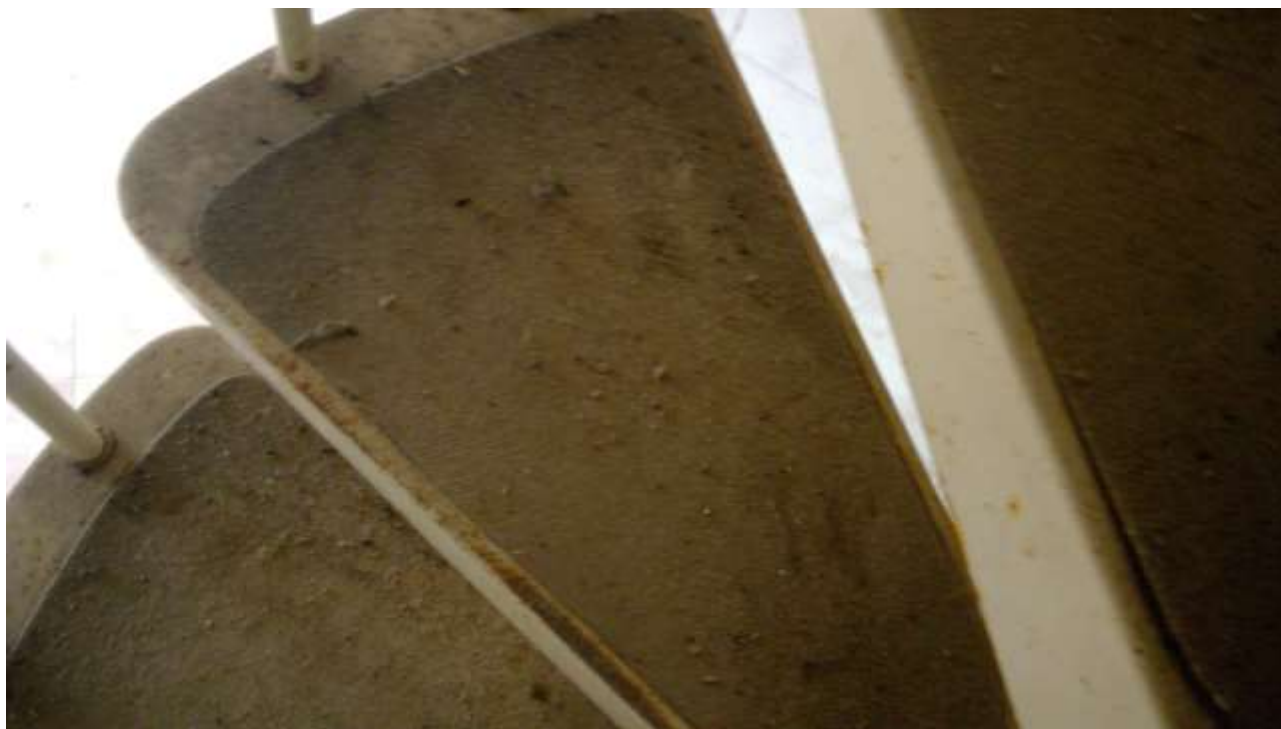
Foto n. 19 – Comune di Travesio (PN) – frazione Toppo - "Corte Dal Nodâr"- Lotto 1 – Foglio 8, Unità 1 – Piano secondo – Particolare delle scale a chiocciola che collegano primo e secondo piano.