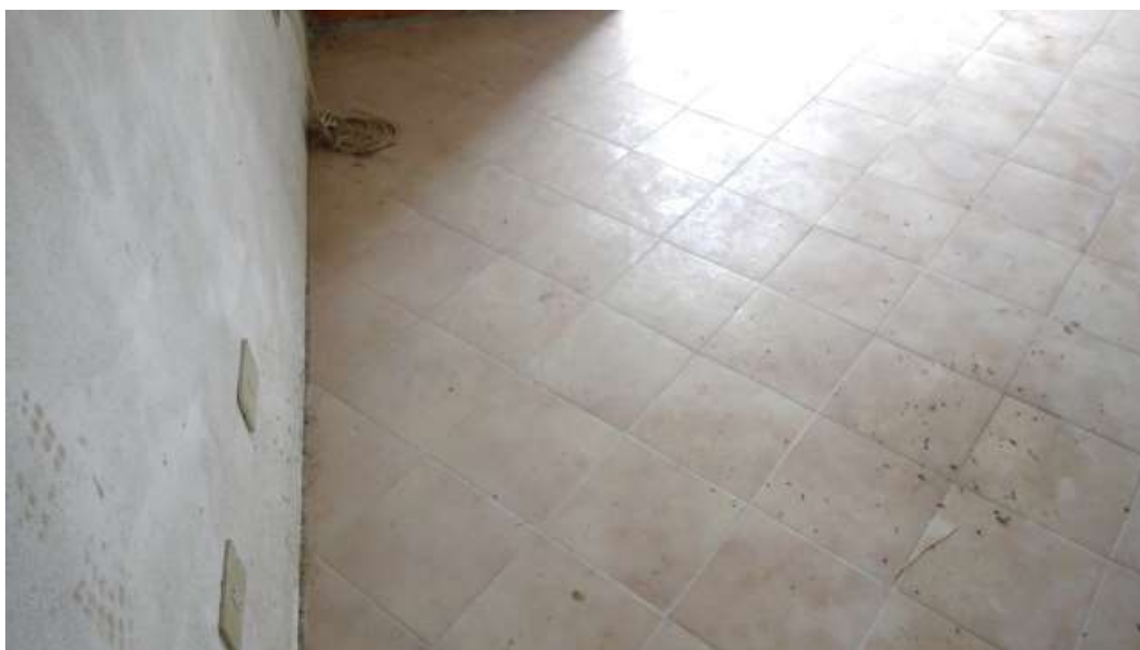
Foto n. 16 – Comune di Travesio (PN) – frazione Toppo - "Corte Dal Nodâr"- Lotto 1 – Foglio 8, Unità 1 – Piano primo – Veduta interna del vano rip. stieria dal corridoio.