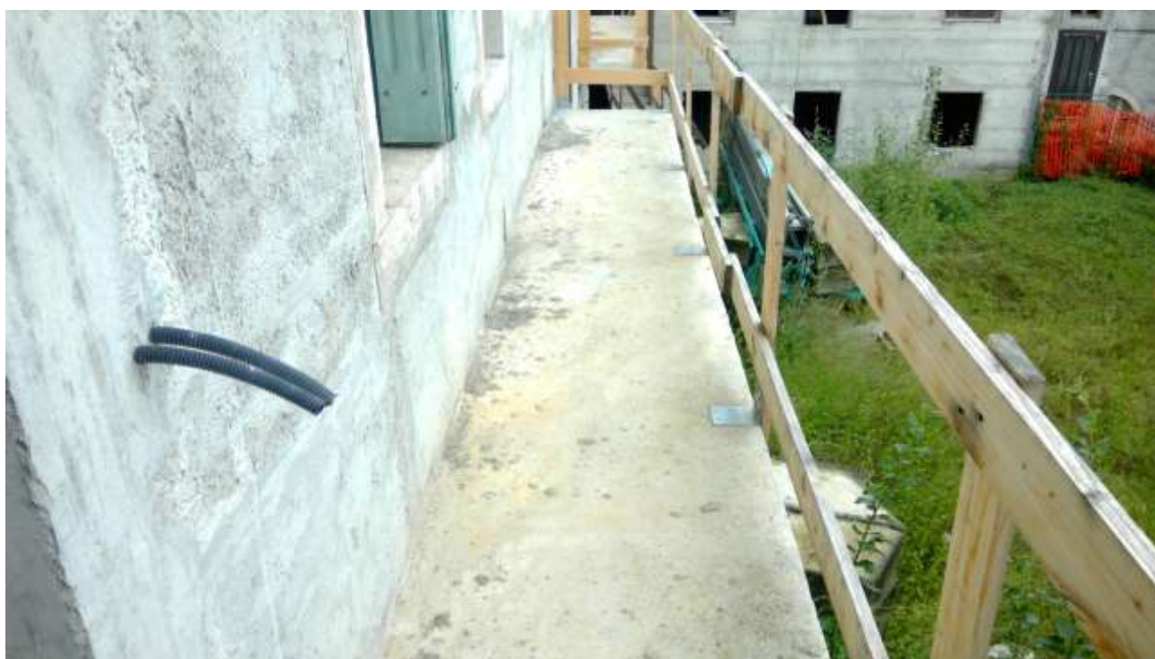
Foto n. 18 – Comune di Travesio (PN) – frazione Toppo - "Corte Dal Nodâr"- Lotto 1 – Foglio 8, Unità 1 – Piano primo – Veduta del terrazzo con affaccio alla corte comune.