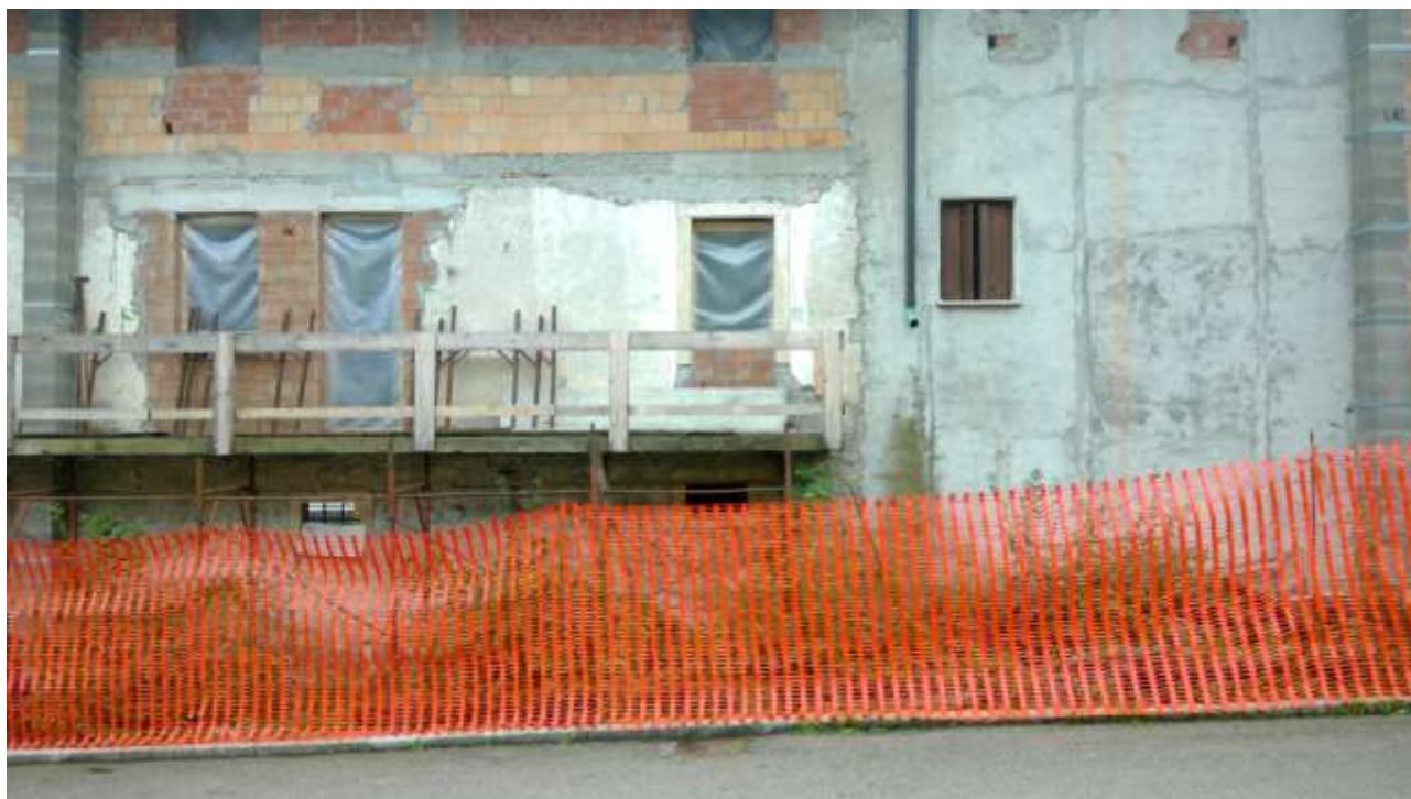
Foto n. 1 – Comune di Travesio (PN) – frazione Toppo - "Corte Dal Nodâr"- Lotto 1 – Foglio 8, Unità 2 – Esterni – Veduta dell'immobile pignorato da Via dei Masi.