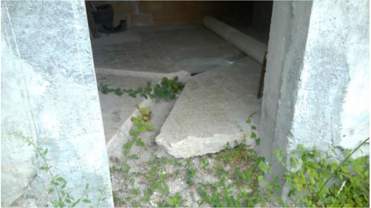
Foto n. 3 – Comune di Travesio (PN) – frazione Toppo - "Corte Dal Nodâr"- Lotto 1 – Foglio 8, Unità 1 – Piano terra – Veduta dell'accesso principale al soggiorno dal piano terra.