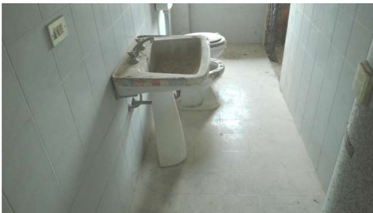
Foto n. 14 – Comune di Travesio (PN) – frazione Toppo - "Corte Dal Nodâr"- Lotto 1 – Foglio 8, Unità 1 – Piano primo – Veduta interna del bagno.