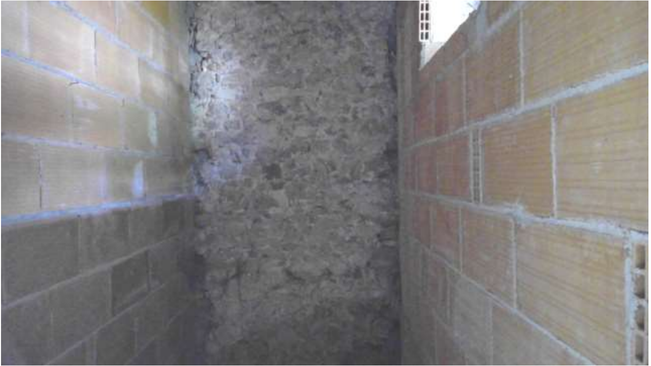
Foto n. 13 – Comune di Travesio (PN) – frazione Toppo - "Corte Dal Nodâr"- Lotto 1 – Foglio 8, Unità 2 – Piano terra – Particolare del vano uso bagno posto accanto alla camera.