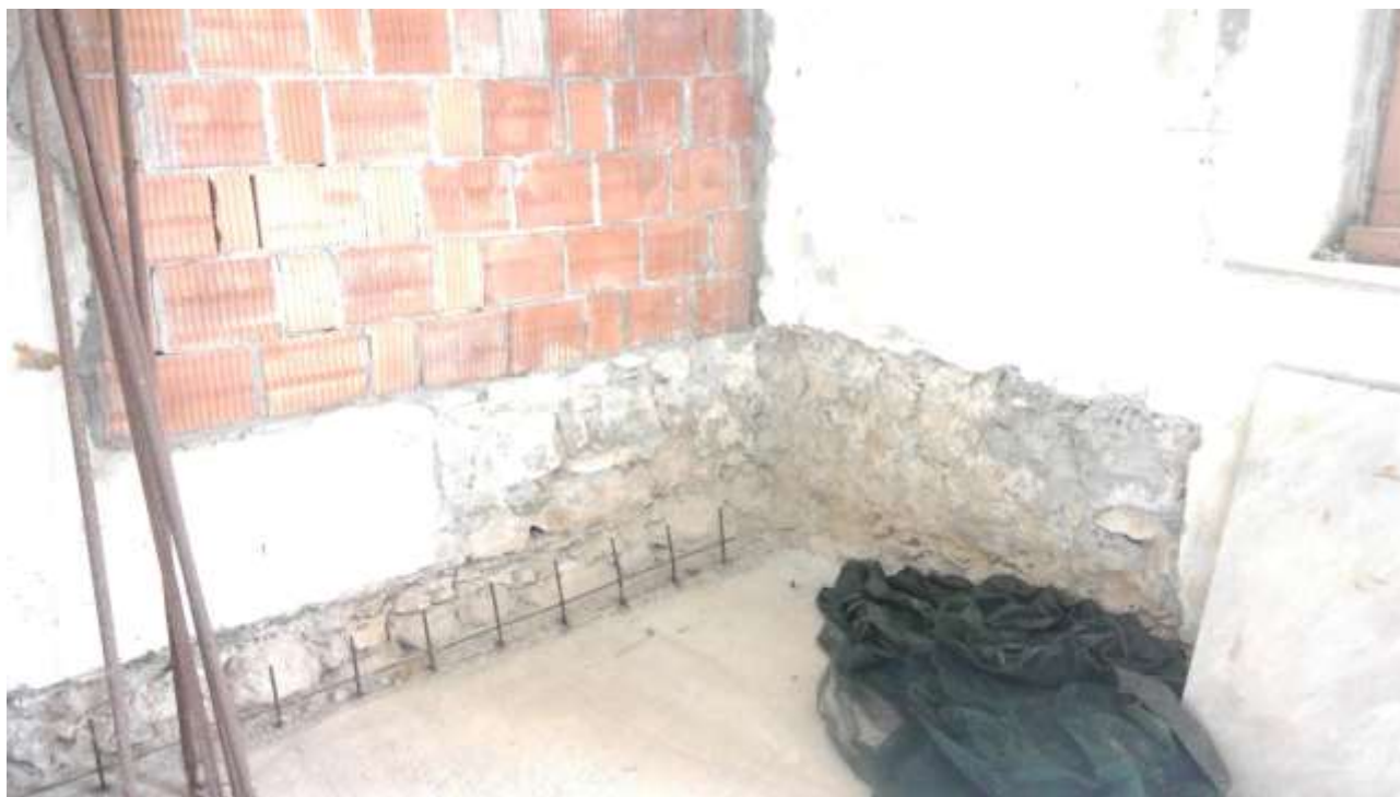
Foto n. 7 – Comune di Travesio (PN) – frazione Toppo - "Corte Dal Nodâr"- Lotto 1 – Foglio 8, Unità 2 – Piano terra – Porzione del vano al grezzo destinato a cucina.