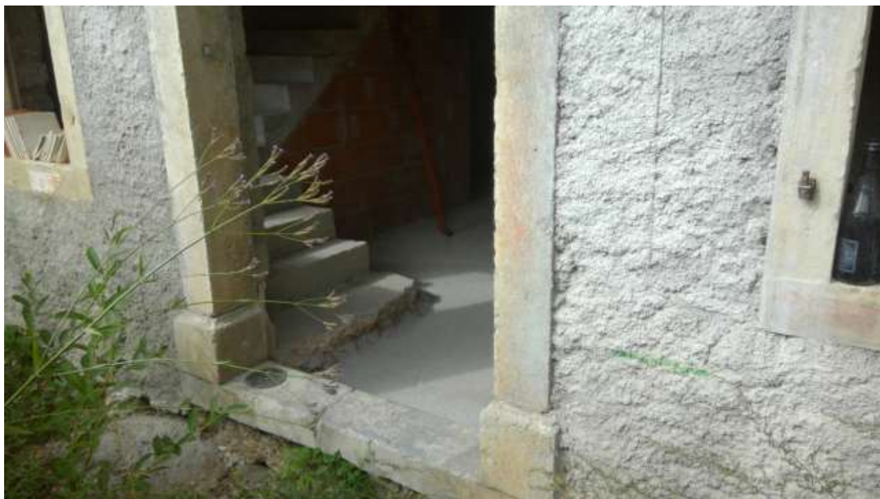
Foto n. 3 – Comune di Travesio (PN) – frazione Toppo - “Corte Dal Nodâr”- Lotto 1 – Foglio 8, Unità 2 – Piano terra – Accesso principale al soggiorno dal piano terra.