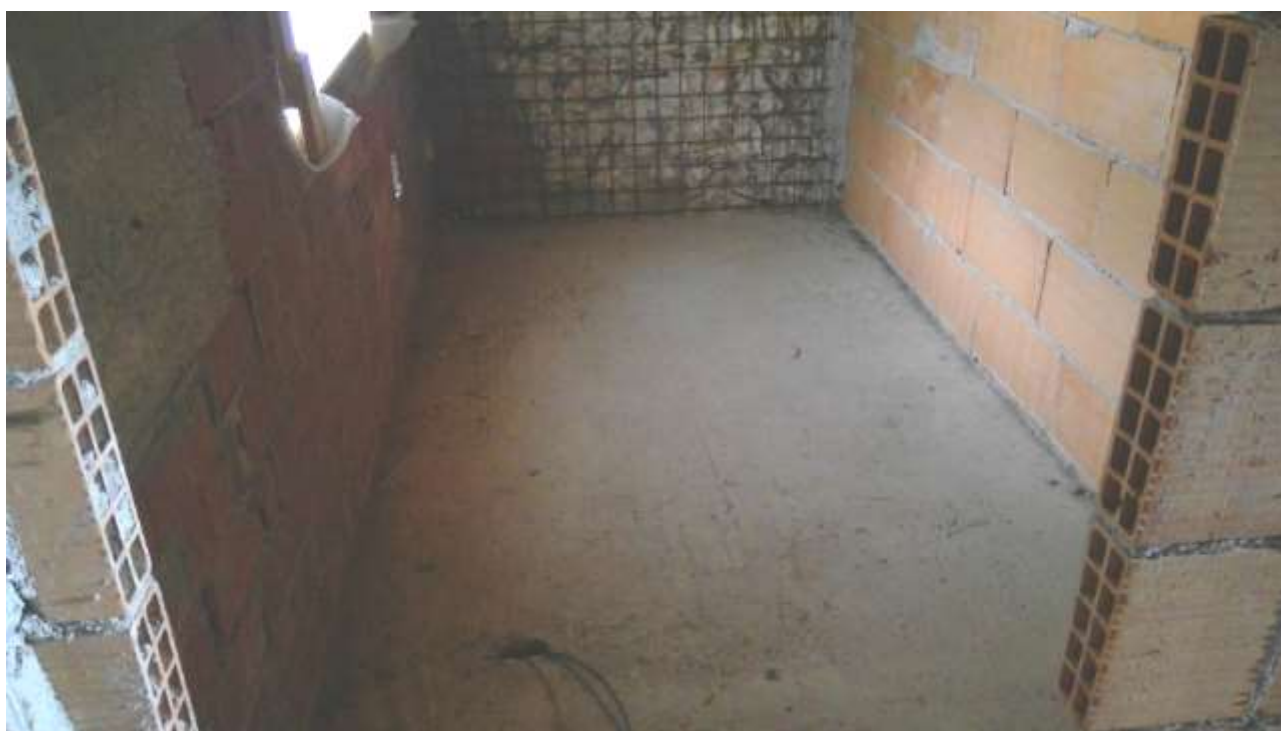
Foto n. 24 – Comune di Travesio (PN) – frazione Toppo - "Corte Dal Nodâr"- Lotto 1 – Foglio 8, Unità 1 – Piano secondo – Veduta del vano uso bagno dal corridoio comune alla seconda camera.