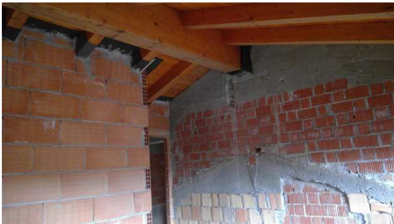
Foto n. 19 – Comune di Travesio (PN) – frazione Toppo - “Corte Dal Nodâ”- Lotto 1 – Foglio 8, Unità 4 – Piano secondo – Veduta interna della stessa camera, con particolare della sopraelevazione.