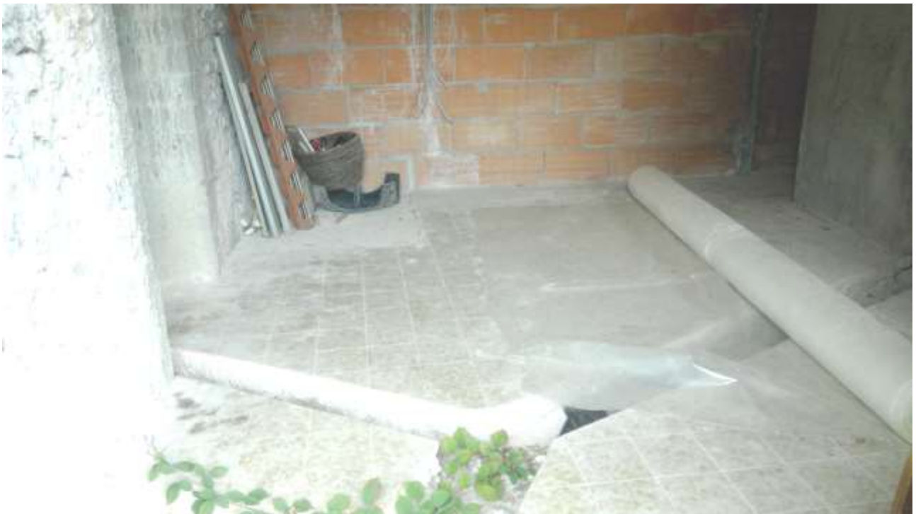
Foto n. 4 – Comune di Travesio (PN) – frazione Toppo - "Corte Dal Nodâr"- Lotto 1 – Foglio 8, Unità 1 – Piano terra – Veduta di porzione del vano destinato a soggiorno con particolare della pavimentazione e muri