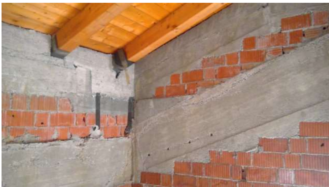
Foto n. 22 – Comune di Travesio (PN) – frazione Toppo - "Corte Dal Nodâr"- Lotto 1 – Foglio 8, Unità 1 – Piano secondo – Particolare del tetto rialzato per tutte le stanze della mansarda.