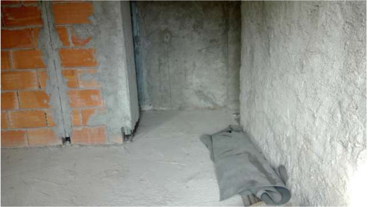
Foto n. 9 – Comune di Travesio (PN) – frazione Toppo - “Corte Dal Nodâr”- Lotto 1 – Foglio 8, Unità 4 – Piano primo – Veduta dal soggiorno del corridoio di accesso alla cucina e al bagno.