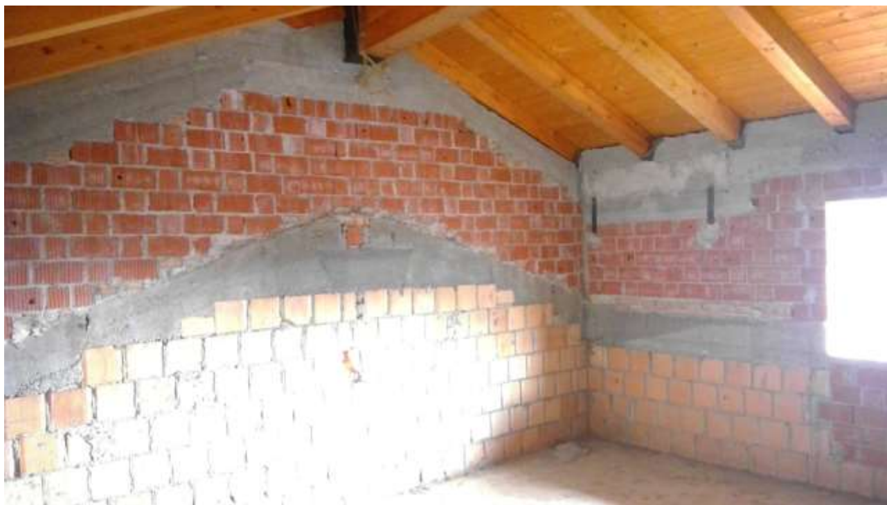
Foto n. 23 – Comune di Travesio (PN) – frazione Toppo - “Corte Dal Nodâr”- Lotto 1 – Foglio 8, Unità 4 – Piano secondo – Veduta di parte della seconda camera.