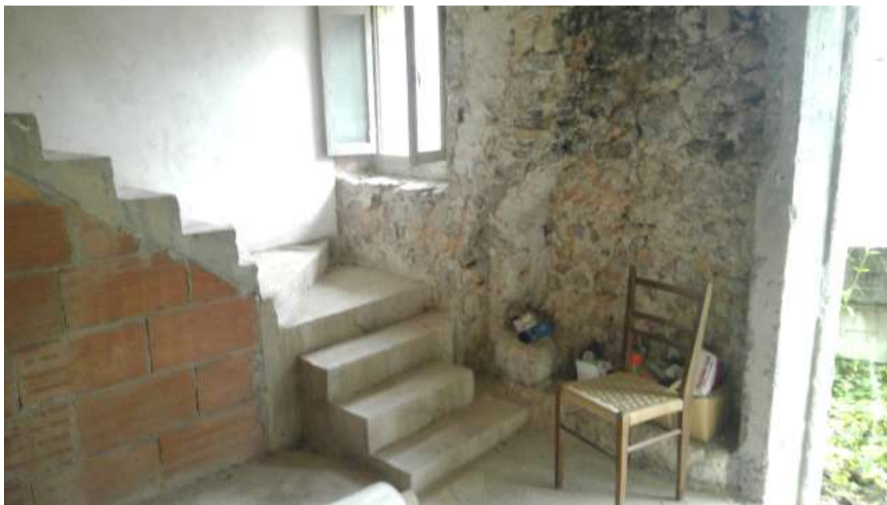
Foto n. 5 – Comune di Travesio (PN) – frazione Toppo - "Corte Dal Nodâr"- Lotto 1 – Foglio 8, Unità 1 – Piano terra – Veduta di porzione nord-ovest del soggiorno con particolare delle scale di accesso al primo piano.