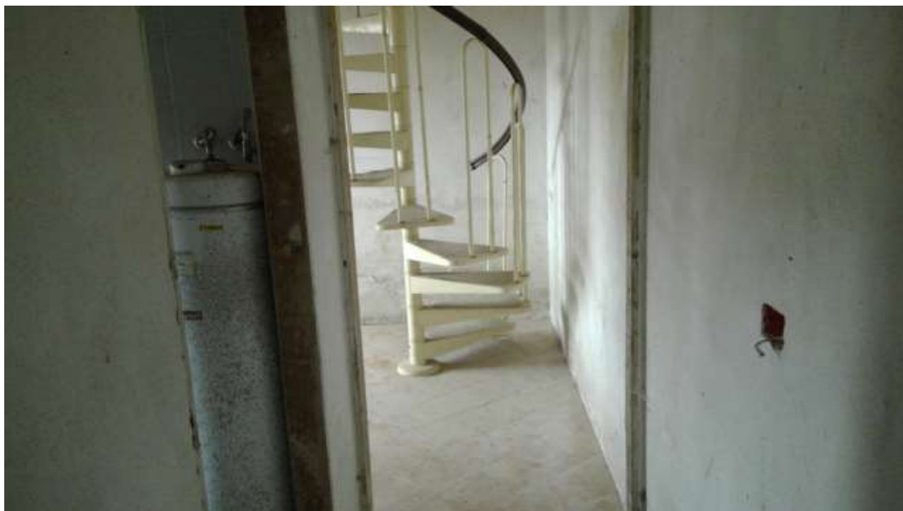
Foto n. 15 – Comune di Travesio (PN) – frazione Toppo - "Corte Dal Nodâr"- Lotto 1 – Foglio 8, Unità 1 – Piano primo – Accesso al vano rip. stieria dal corridoio.