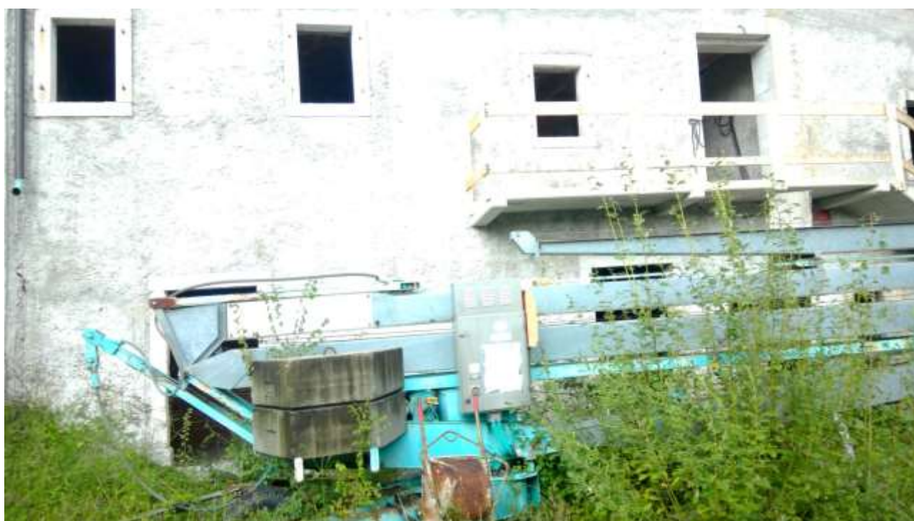
Foto n. 2 – Comune di Travesio (PN) – frazione Toppo - "Corte Dal Nodâr"- Lotto 1 – Foglio 8, Unità 2 – Esterni – Veduta generale dell'immobile pignorato dalla corte interna.