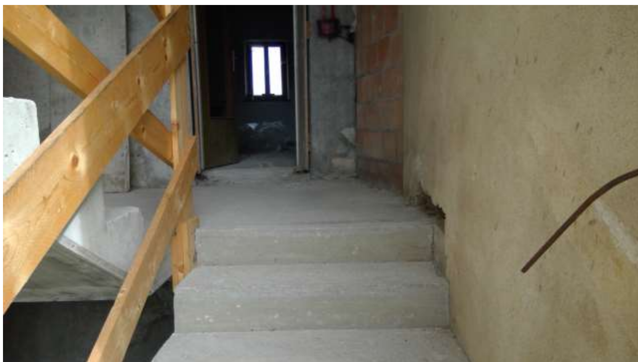
Foto n. 4 – Comune di Travesio (PN) – frazione Toppo - “Corte Dal Nodâr”- Lotto 1 – Foglio 8, Unità 4 – Esterni – Veduta del pianerottolo a uso comune per l’accesso alla U4 e alla U3.