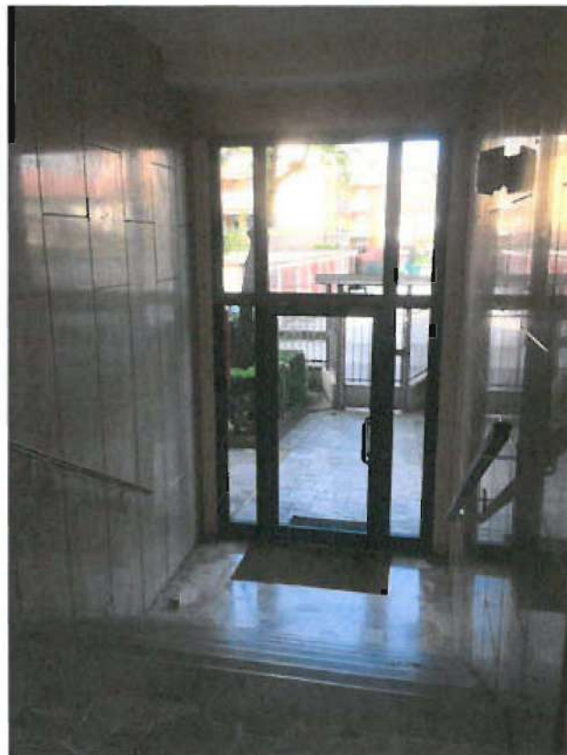
ATRIO COMUNE PIANO TERRENO