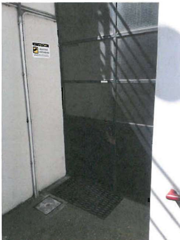
INGRESSO PIANO INTERRATO CANTINE