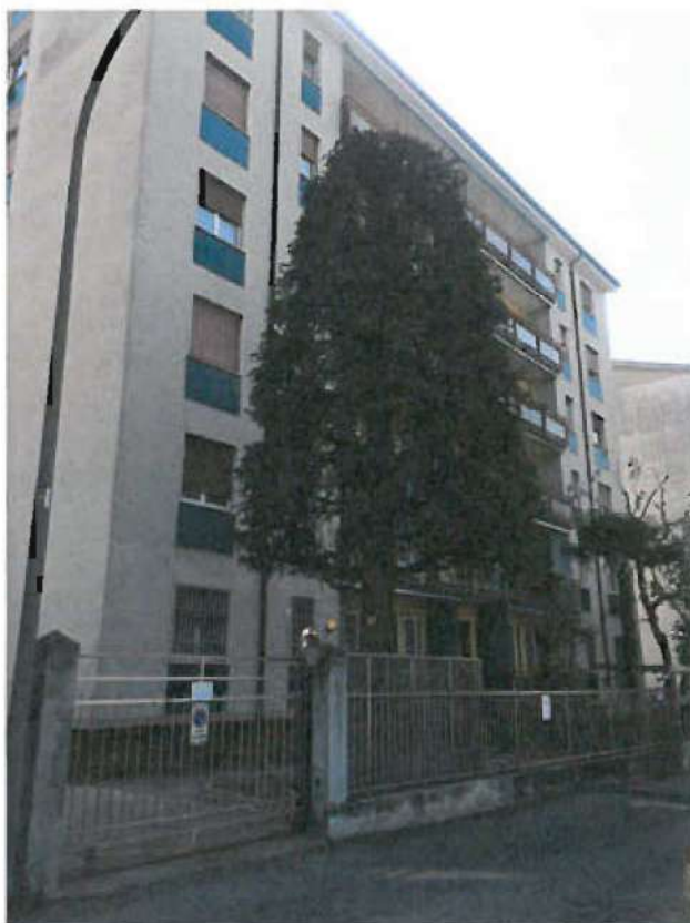
PROSPETTO OVEST FABBRICATO