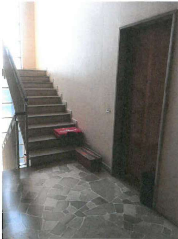
INGRESSO UNITA' IMMOBILIARE