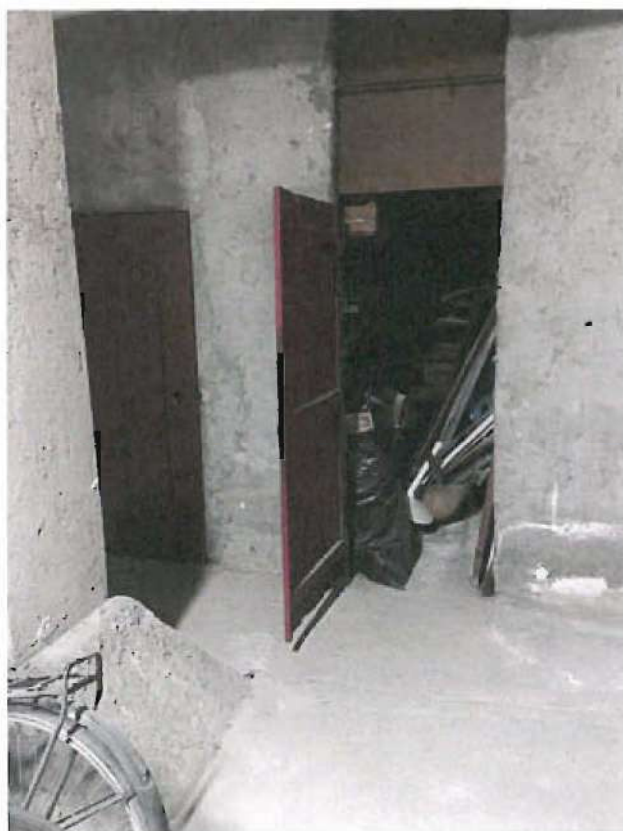
CANTINA DI MQ. 4