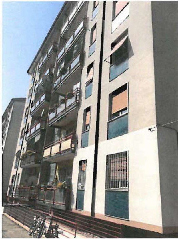
PROSPETTO EST FABBRICATO