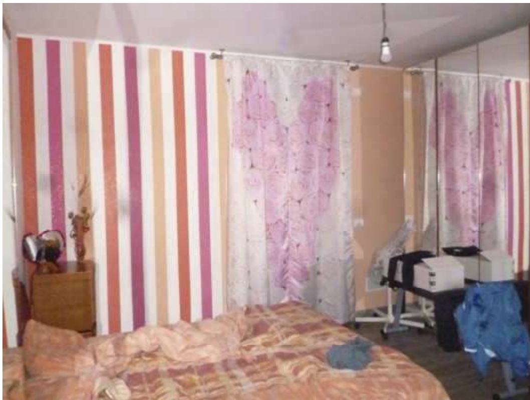
FOTO 8 - Camera da letto