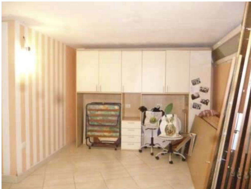
FOTO 18 - Box (!) Sub. 24. Al posto della basculante un tamponamento con finestrella