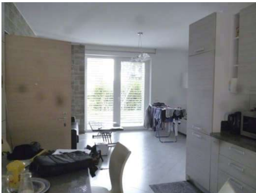
FOTO 6 - Soggiorno