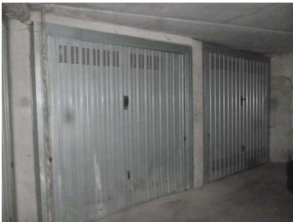
FOTO 16 - Box Sub. 24 a sinistra e Box Sub. 25 a destra. La basculante del Sub. 24 è bloccata dal tamponamento interno.