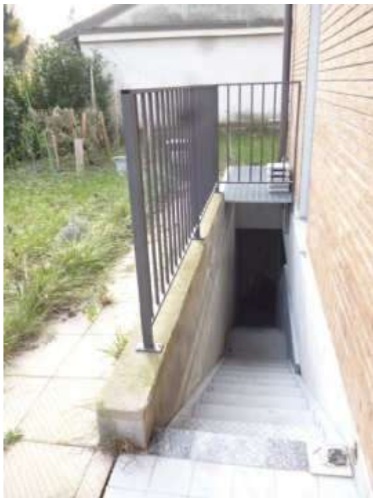
FOTO 12 - Scala di accesso al vano cantina dal giardino di pertinenza