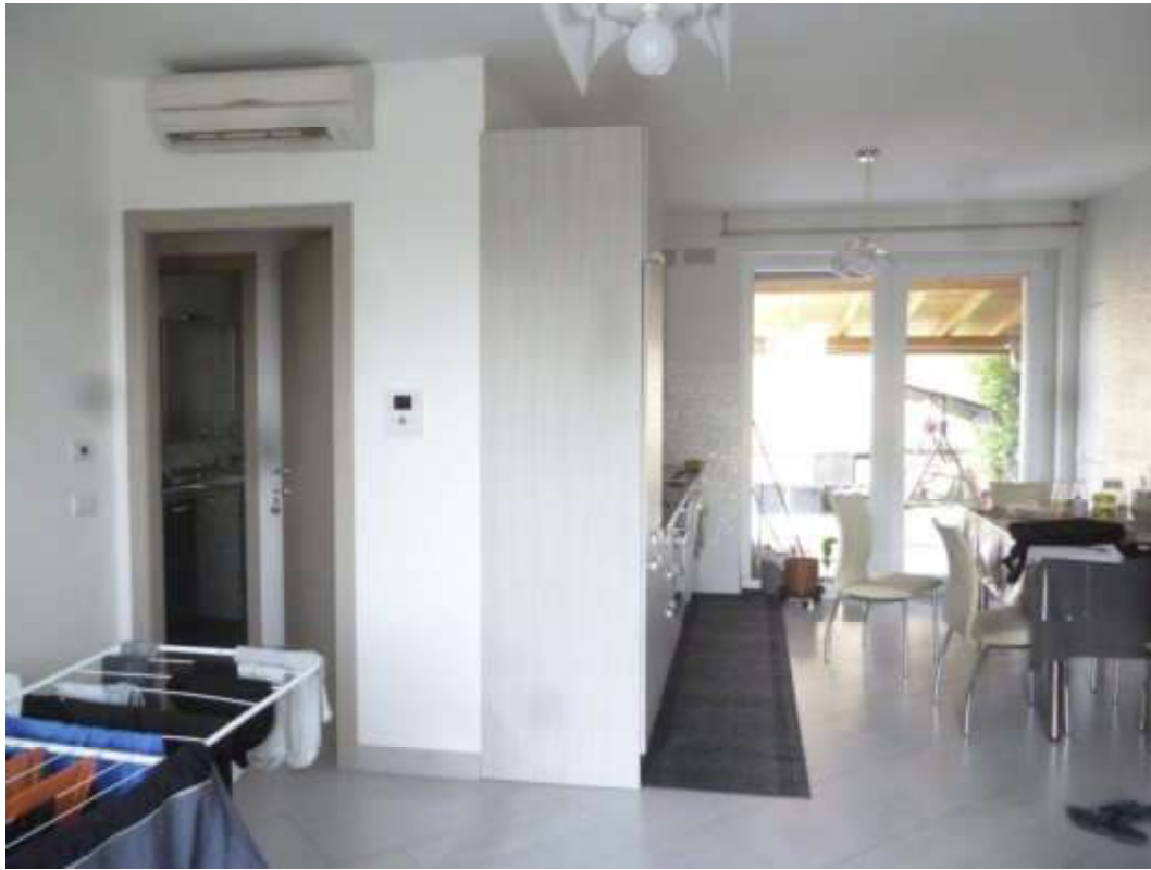
FOTO 7 - Cucina e soggiorno