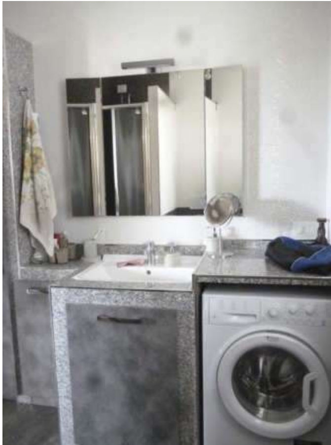
FOTO 11 - Bagno con doccia