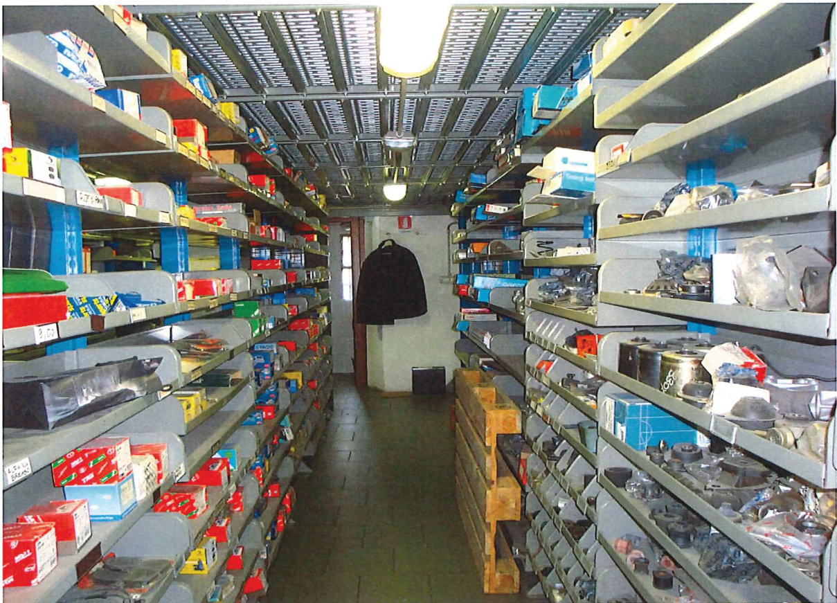
R.G.E. 865/2019 G. E. Dott.ssa M. Galioto Milano, Via Pinturicchio n.° 9, piano T-S1, Foglio 317, mapp. 194, sub. 703 Prospetti interni: il retro del negozio , scaffali al piano terra