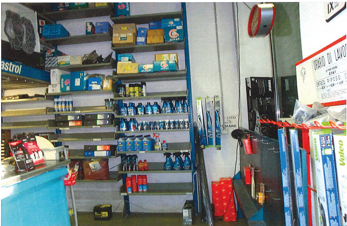
R.G.E. 865/2019 G. E. Dott.ssa M. Galioto Milano, Via Pinturicchio n.° 9, piano T, Foglio 317, mapp. 194, sub. 703 Prospetti interni: il retro del negozio e la zona d'ingresso