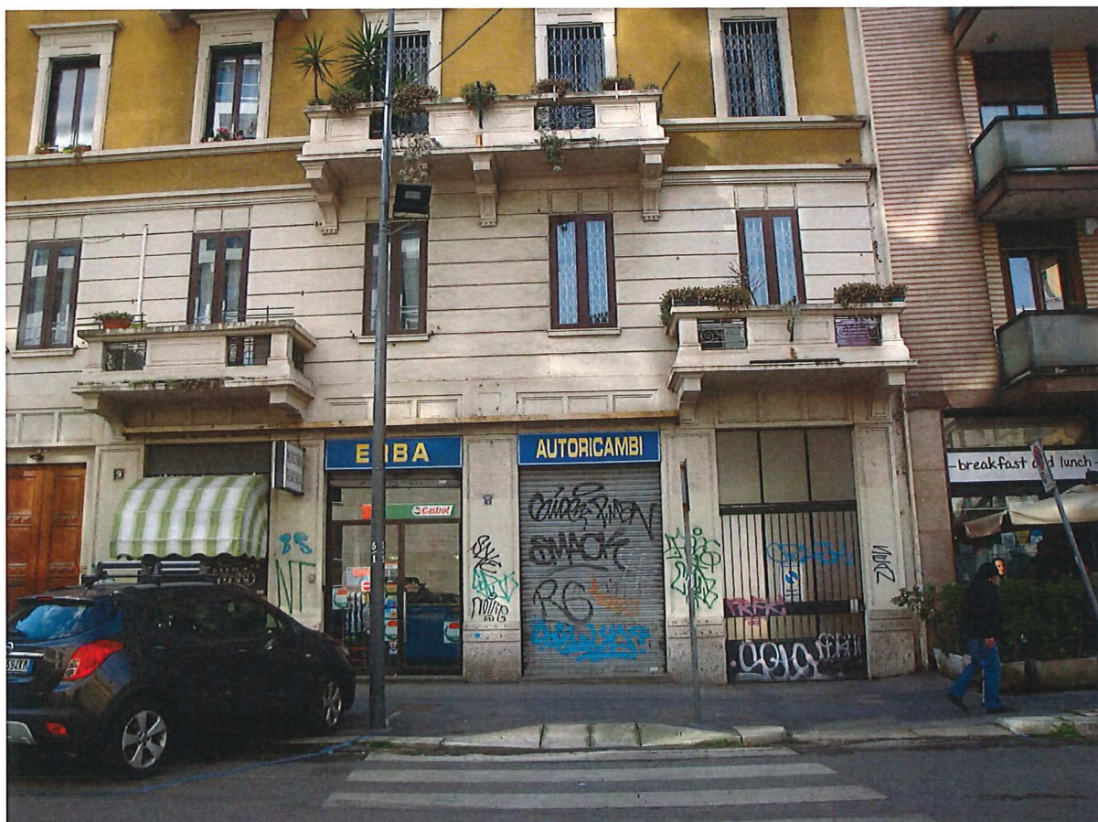
R.G.E. 865/2019 G. E. Dott.ssa M. Galioto Milano, Via Pinturicchio n.° 9, piano T-S1, Foglio 317, mapp. 194, sub. 703 Prospetti esterni: il prospetto sulla Via Pinturicchio