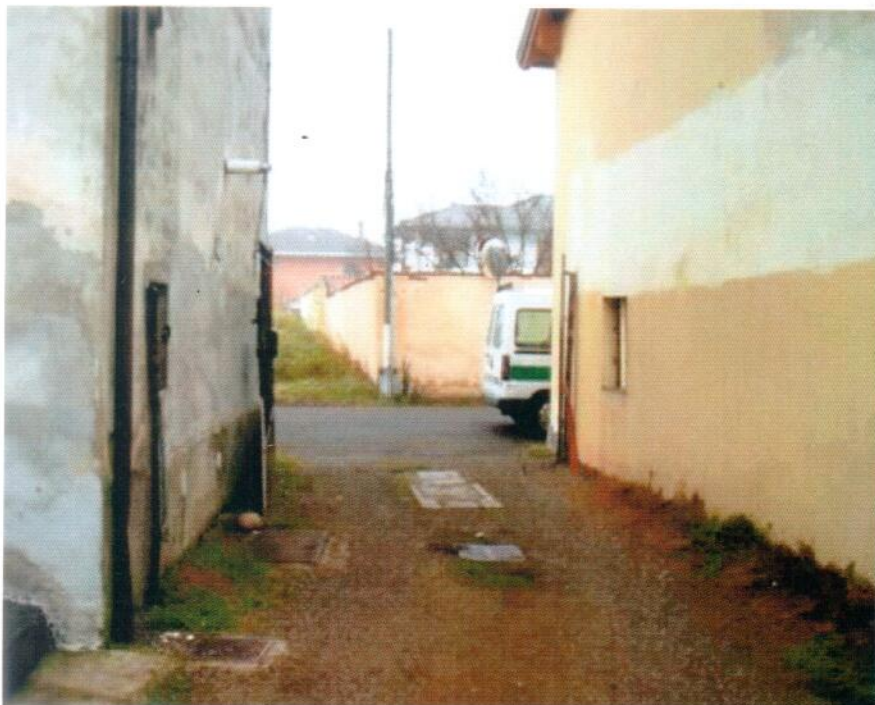
Foto n. 4 : vista verso Ovest - accesso al cortile comune da Via Arluno