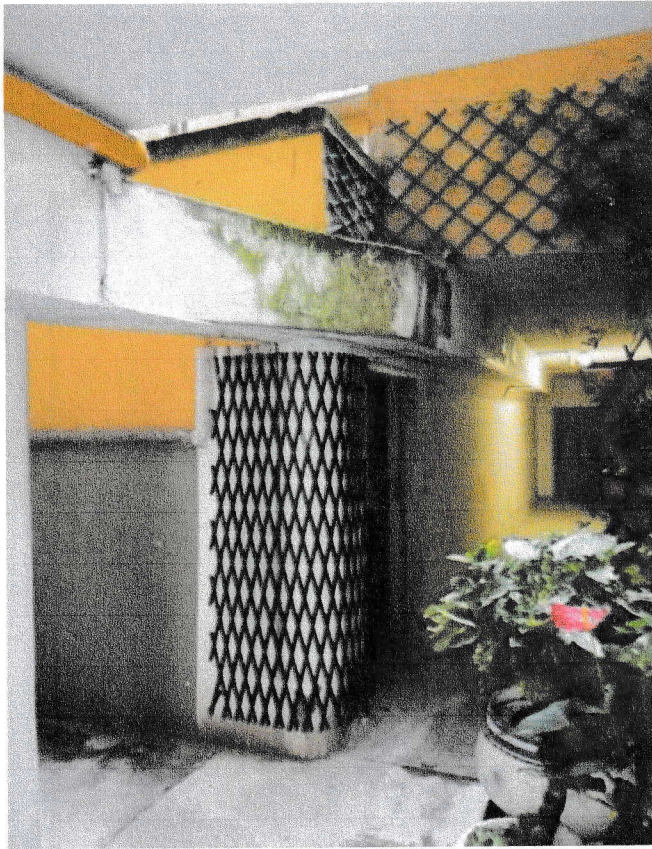
Passaggio carrabile interno al condominio e ingresso al laboratorio