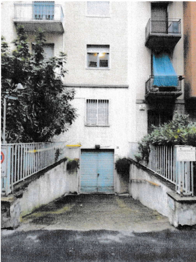
Rampa carrabile di accesso al piano seminterrato