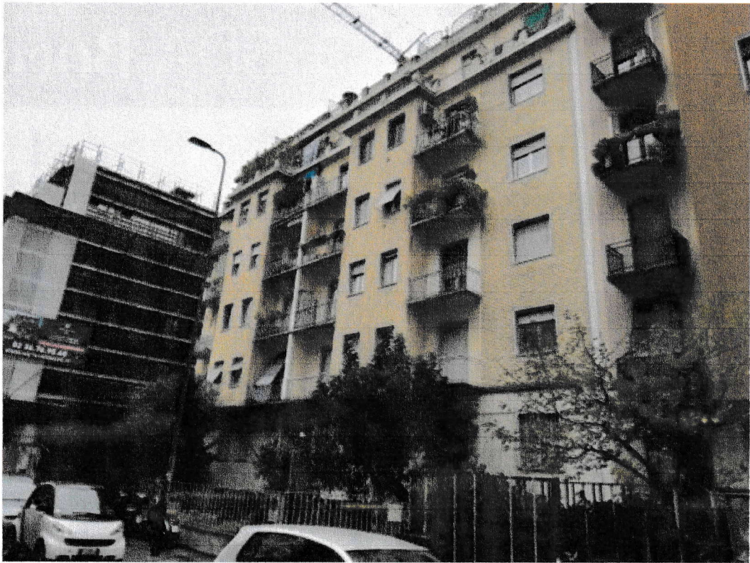
Veduta dell'immobile da via Metauro