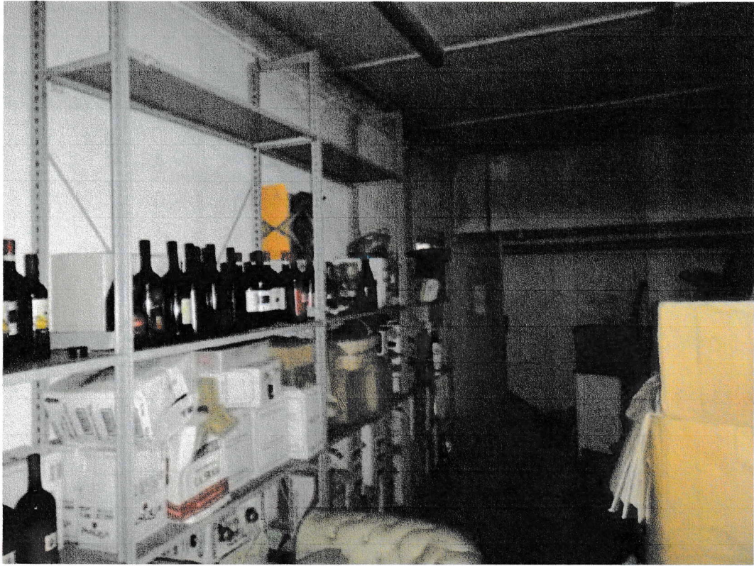
Vedute dell'interno del locale laboratorio