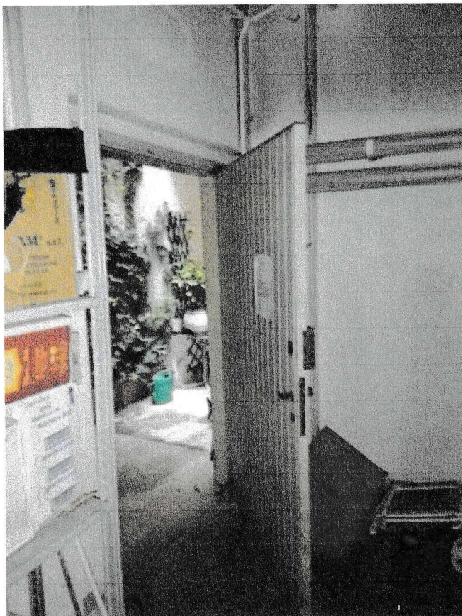
Laboratorio, porta di ingresso