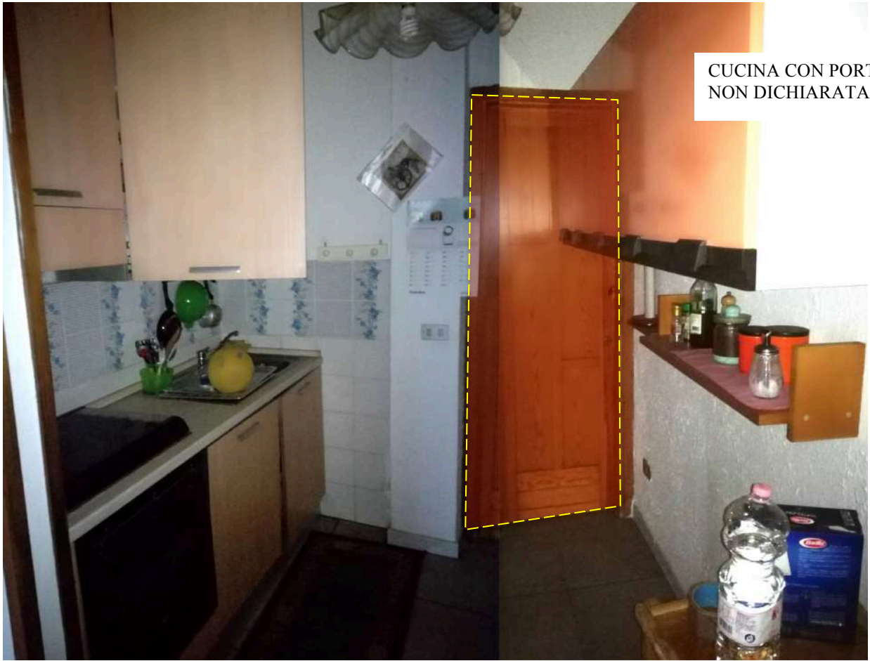
CUCINA CON PORTA NON DICHIARATA