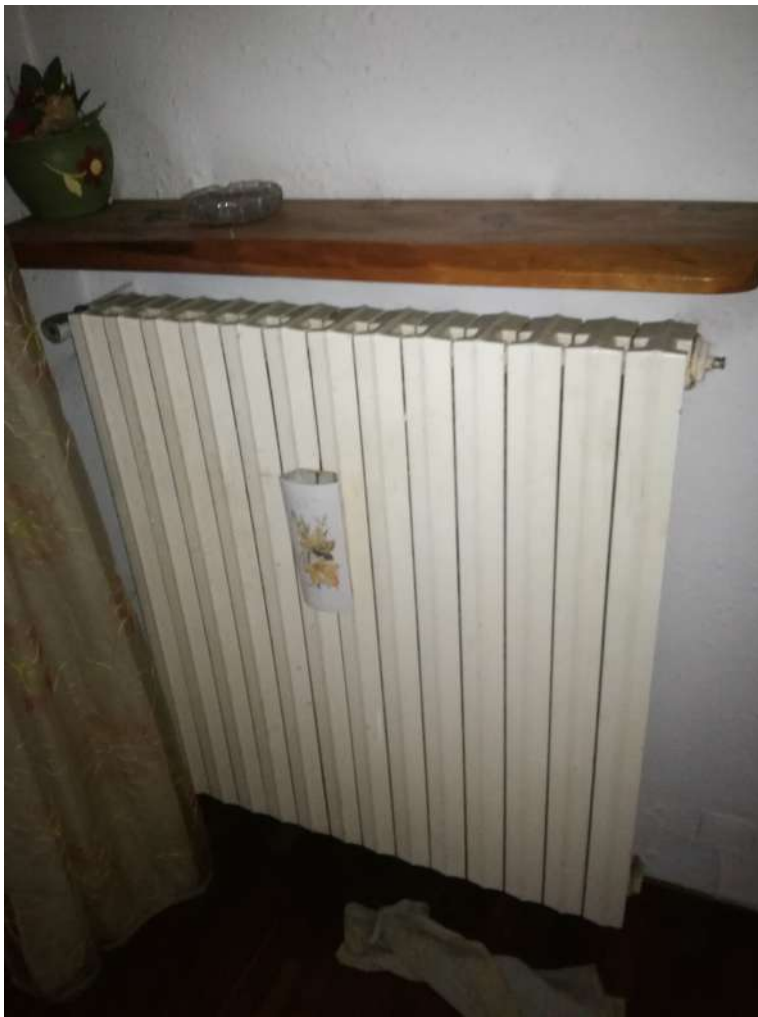
FOTO 15,16 - RADIATORI E SOPPALCO