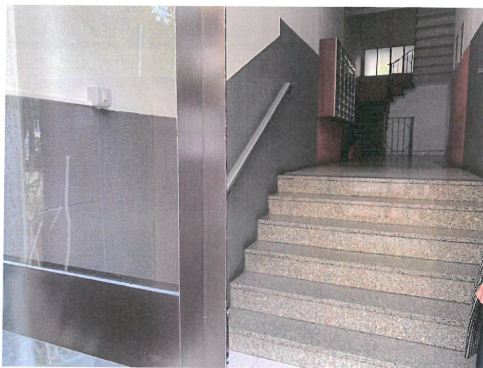
Fotografia n. 5 – Particolare della rampa di scale in corrispondenza del portone di accesso al Condominio, che conduce all'atrio, dove si trovano le cassette delle lettere ed il corpo scale