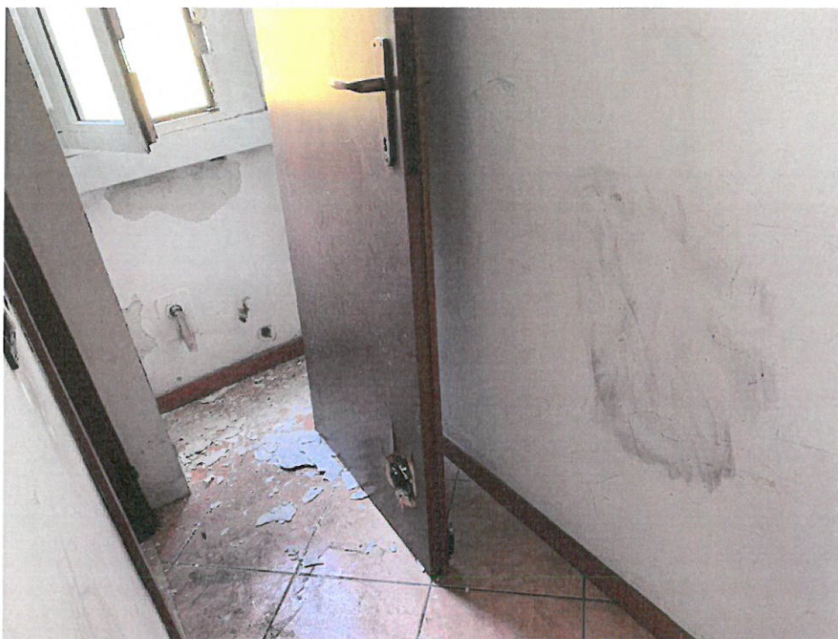
Fotografie n. 13/14 – Viste del corridoio aperto dotato di finestra e ribassato, dove sono presenti macchie di umidità, in assenza di percolamento di acqua, e dell'anta della finestra (sotto) che non si apre completamente