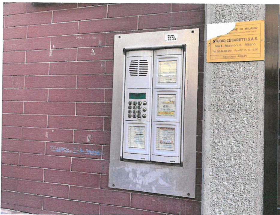
Fotografia n. 4 – Particolare del citofono in corrispondenza del portone di accesso al Condominio, dove compare il nome della proprietaria dell'unità immobiliare oggetto della procedura ( )