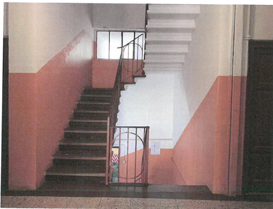
Fotografia n. 8 – Vista del corpo scale, privo di ascensore, che conduce all'unità immobiliare oggetto della procedura posta al piano terzo