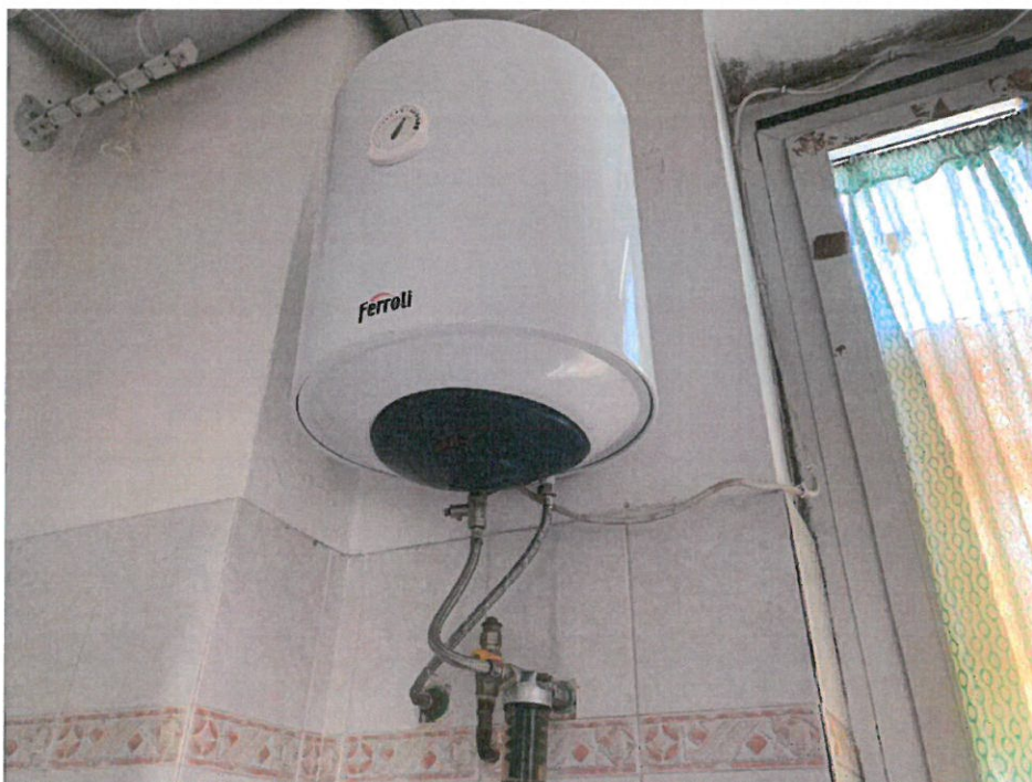
Fotografia n. 18 – Vista del locale bagno, con particolare del boiler elettrico