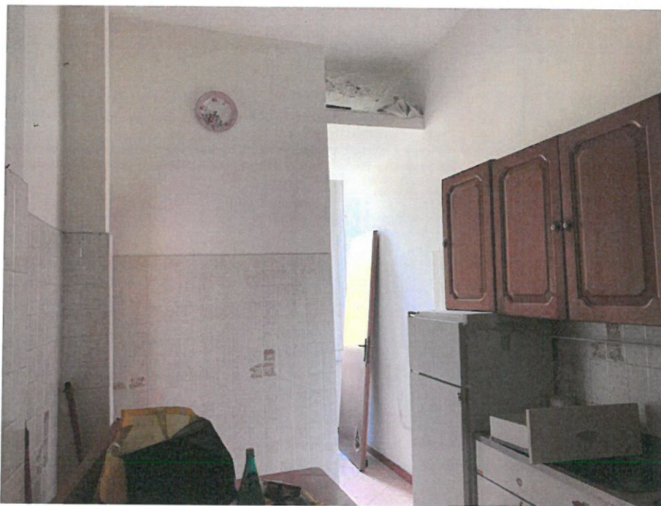
Fotografia n. 11 – Vista del locale ingresso, destinato a locale pranzo con angolo cottura, con particolare in fondo del corridoio aperto dotato di finestra e ribassato, sopra il quale sono presenti macchie di umidità, in assenza di percolamento di acqua, da cui si accede al locale bagno