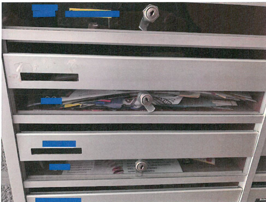
Fotografia n. 7 – Particolare delle cassette delle lettere presenti nell'atrio relativa all'unità immobiliare oggetto della procedura)