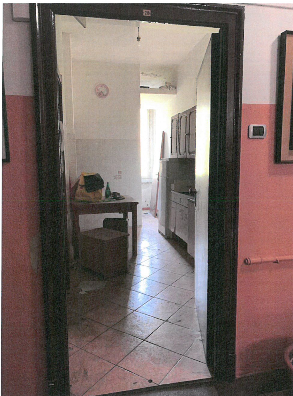
Fotografia n. 10 – Particolare della porta di accesso all'appartamento ad uso abitazione oggetto della procedura, con vista del locale ingresso con corridoio aperto dotato di finestra, destinato a locale pranzo con angolo cottura