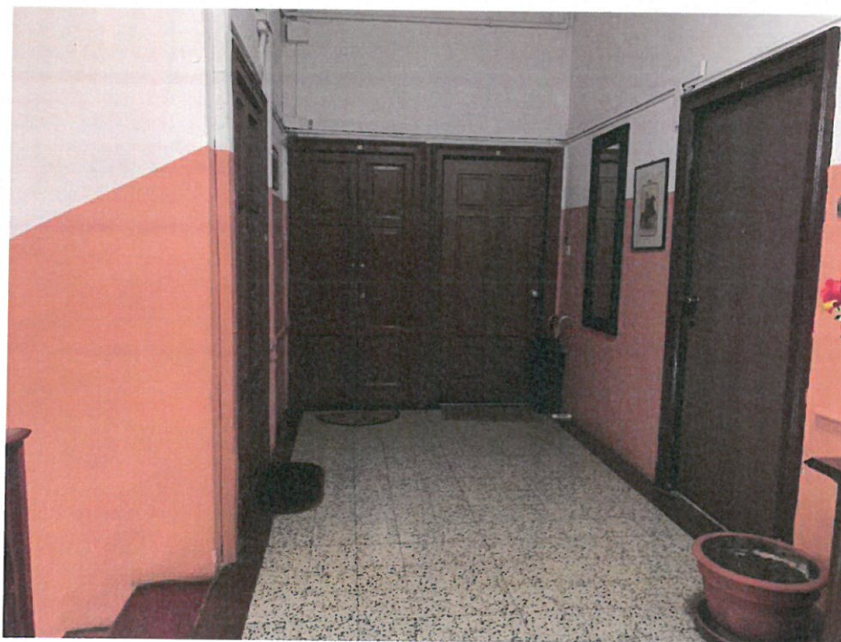
Fotografia n. 9 – Vista del pianerottolo del piano terzo, dove si trova l'unità immobiliare oggetto della procedura