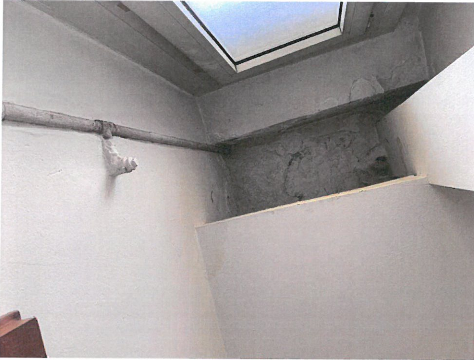
Fotografia n. 15 – Vista del soffitto del corridoio aperto dotato di finestra e ribassato, dove sono presenti macchie di umidità, in assenza di percolamento di acqua