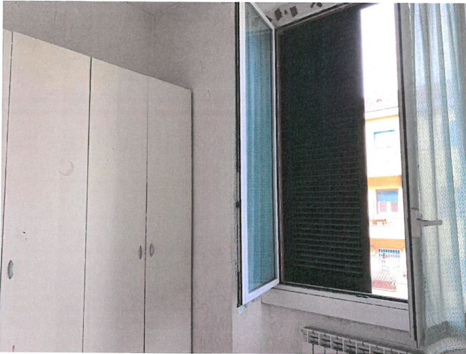
Fotografie n. 25/26 – Viste del locale camera da letto con finestra