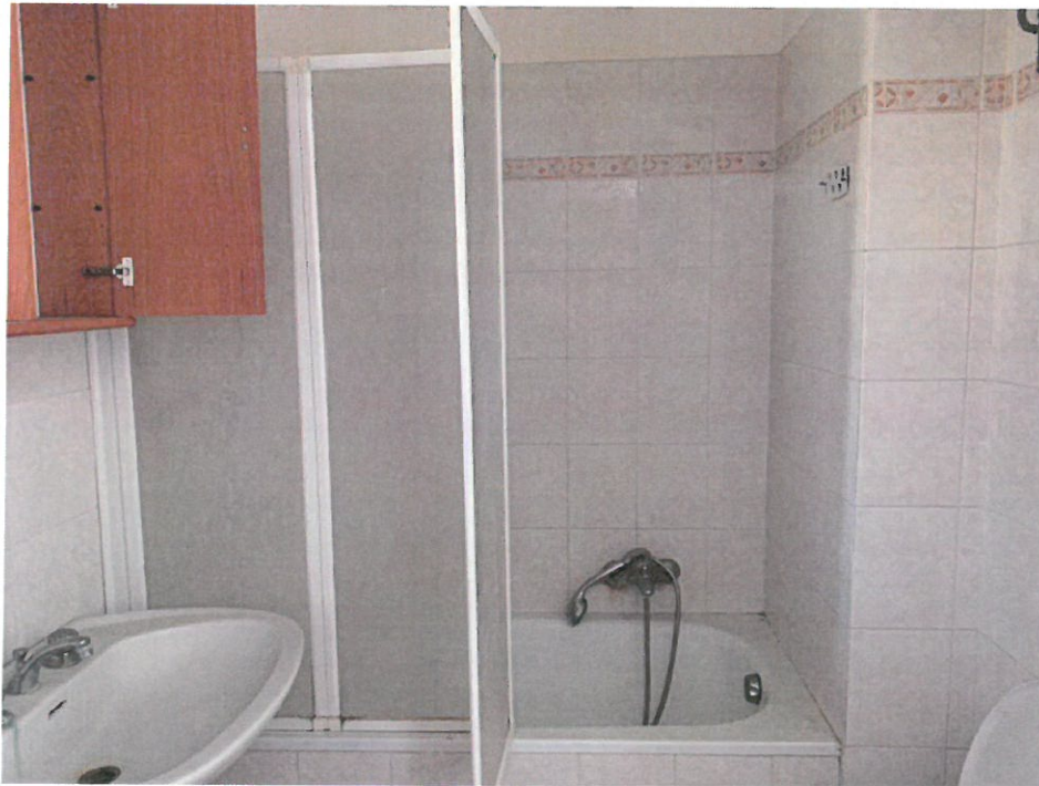
Fotografia n. 16 – Vista del locale bagno, con particolare dei sanitari