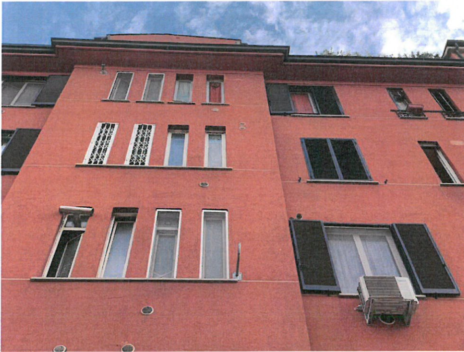
Fotografia n. 2 – Particolare dei serramenti dell'unità immobiliare oggetto della procedura al piano terzo (quarto fuori terra) sul prospetto principale della Via Privata San Martiniano