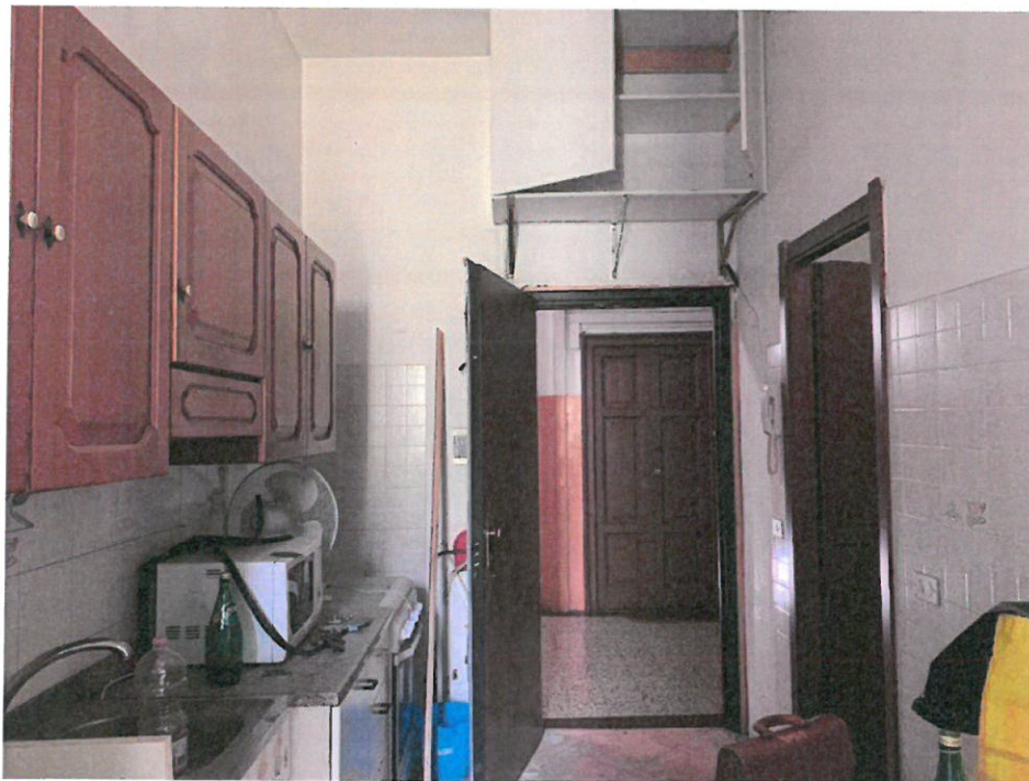
Fotografia n. 20 – Vista dal locale ingresso dell'accesso a destra al locale camera da letto, privo di apertura finestrata verso l'esterno