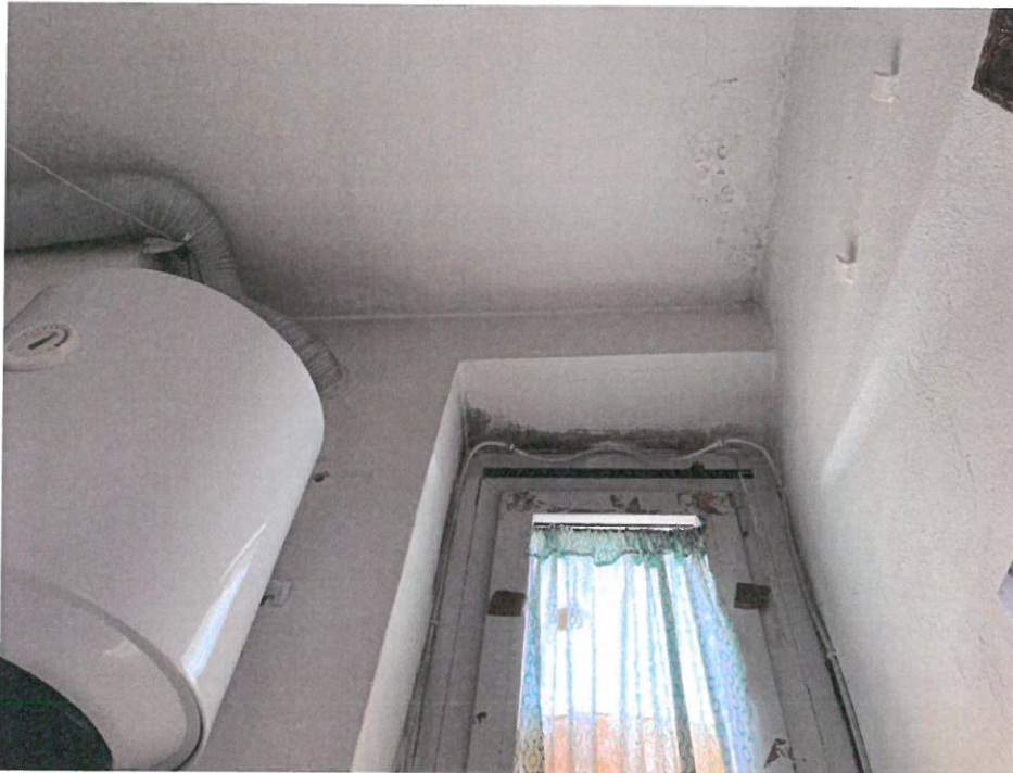
Fotografia n. 19 – Vista del locale bagno, con particolare del soffitto/parete dove sono presenti macchie di umidità, in assenza di percolamento di acqua, e muffe (solo in corrispondenza del serramento)