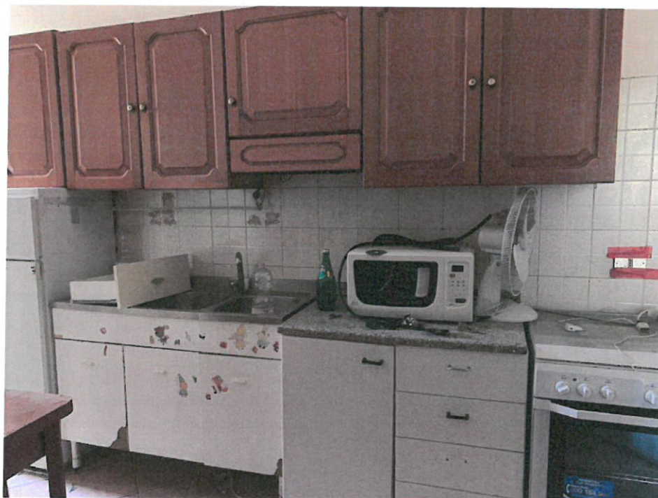
Fotografia n. 12 – Vista del locale ingresso, destinato a pranzo con angolo cottura, con particolare della parete attrezzata