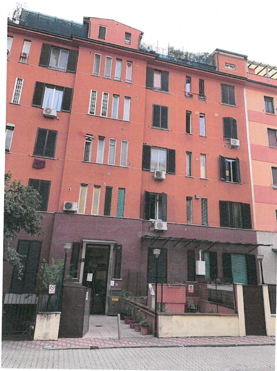
Fotografia n. 1 – Vista del prospetto principale del Condominio sito in Milano – Via Privata San Martiniano n. 2, dove al piano terzo si trova l'unità immobiliare oggetto della procedura