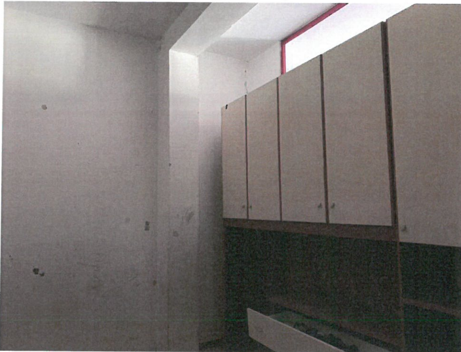
Fotografie n. 22/23 – Viste del locale camera da letto, privo di apertura finestrata verso l'esterno, ma dotato di un serramento fisso superiore verso il locale adiacente (camera da letto con finestra)