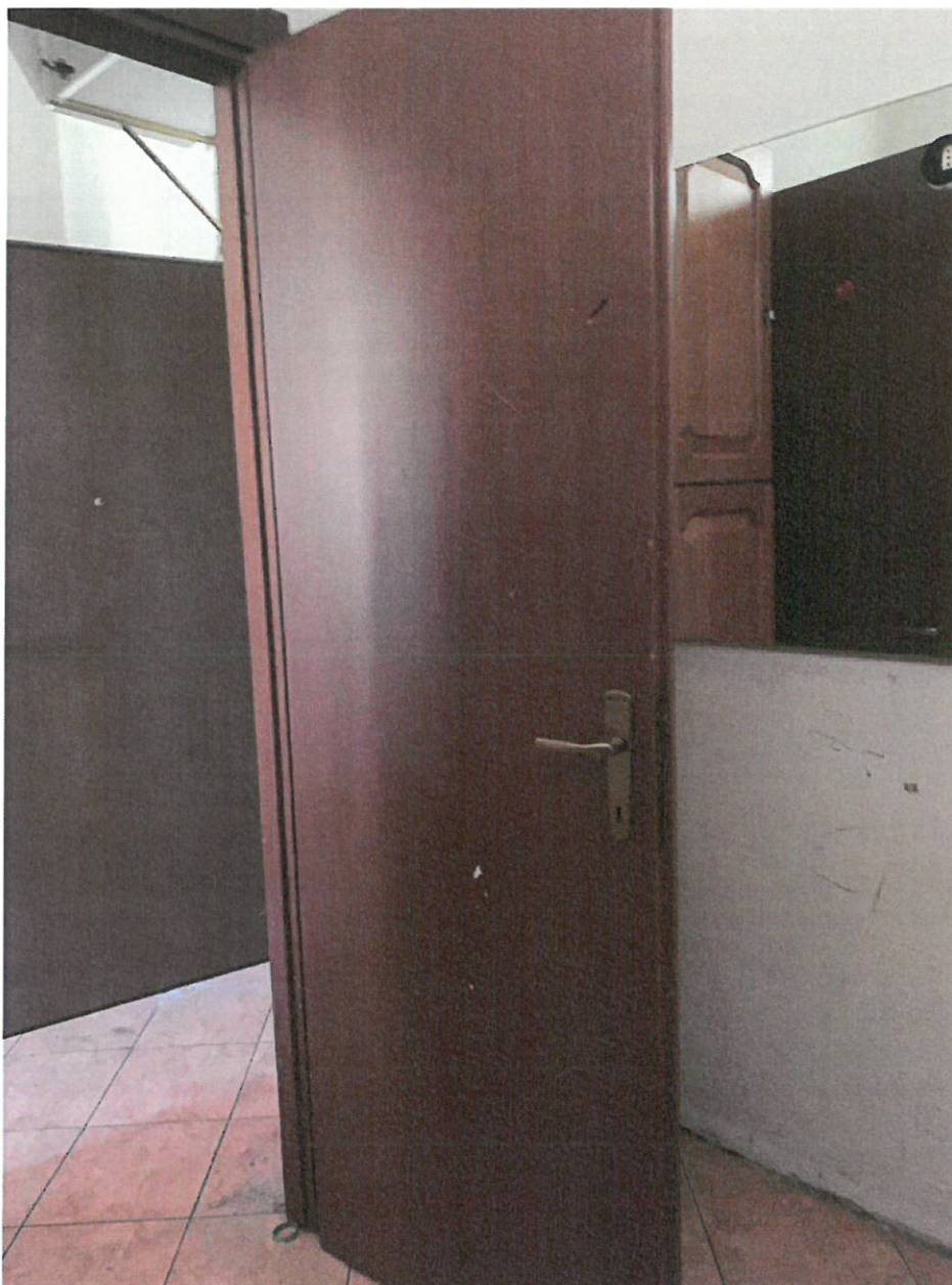
Fotografia n. 21 – Vista dell'ingresso al locale camera da letto, privo di apertura finestrata verso l'esterno