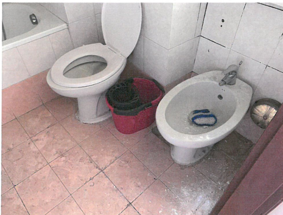
Fotografia n. 17 – Vista del locale bagno, con particolare dei sanitari