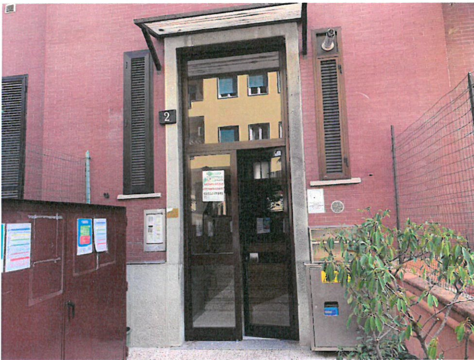
Fotografia n. 3 – Particolare del portone di accesso al Condominio dalla Via Privata San Martiniano n. 2