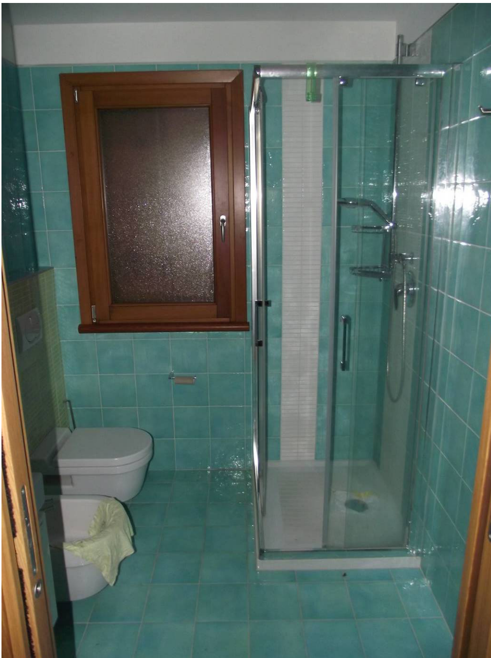
Foto 14 - bagno