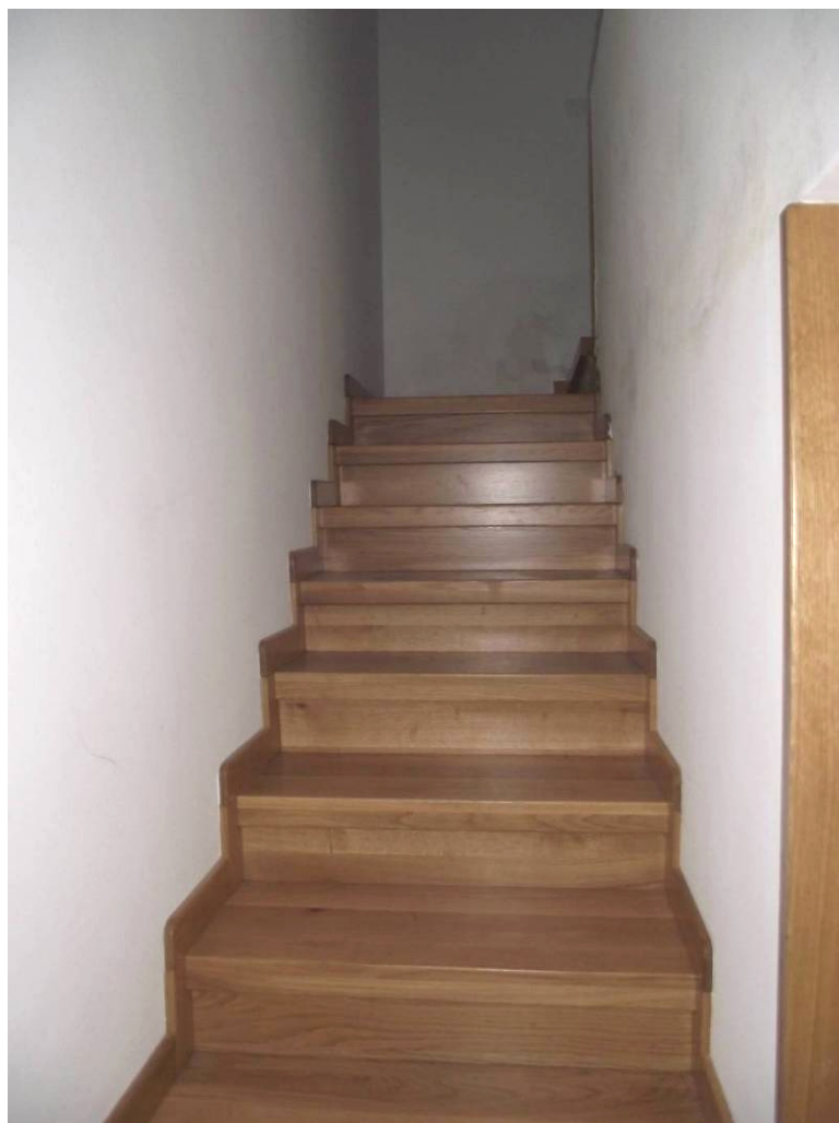
Foto 9 - scala