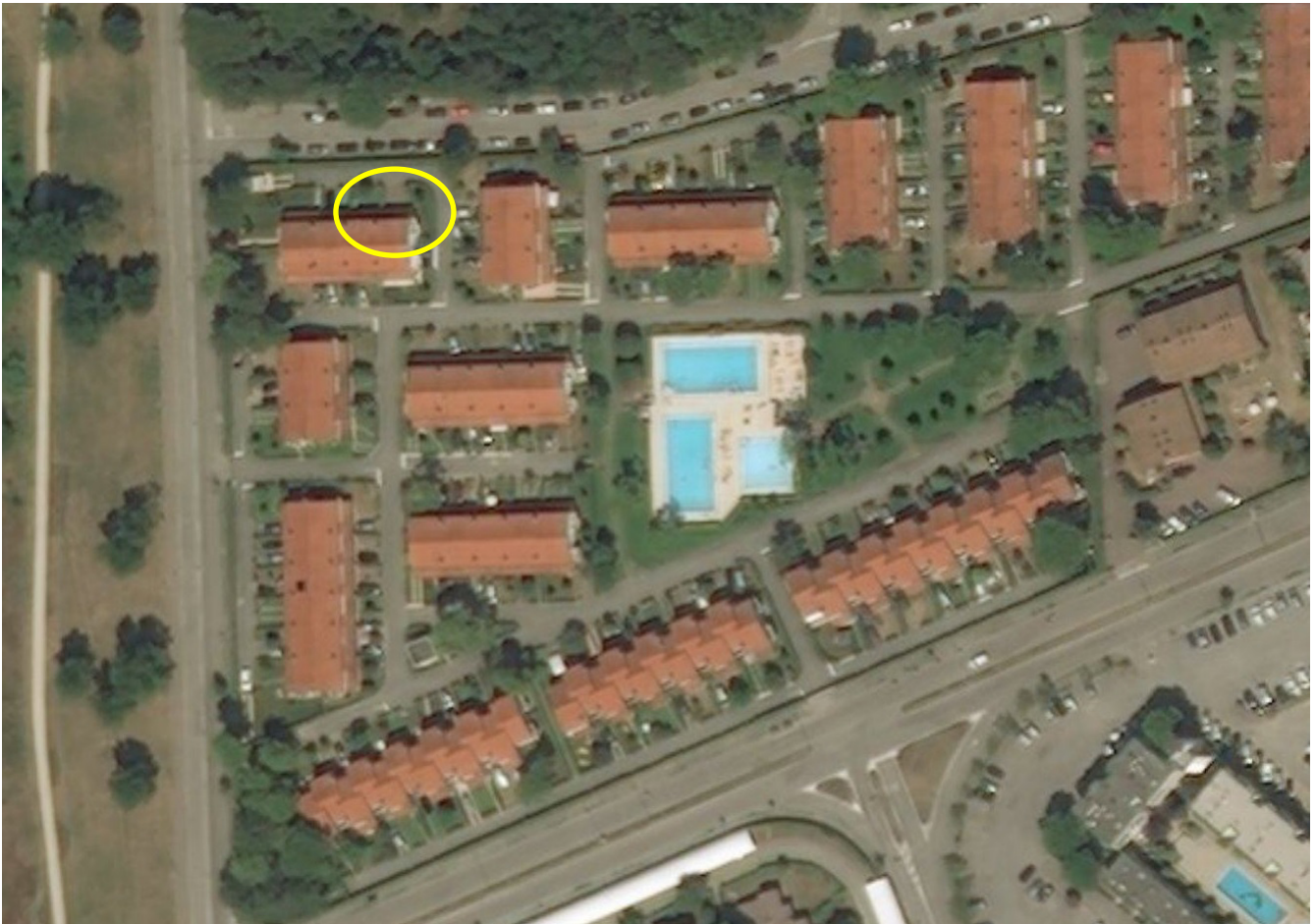
Foto 1 - Vista aerea