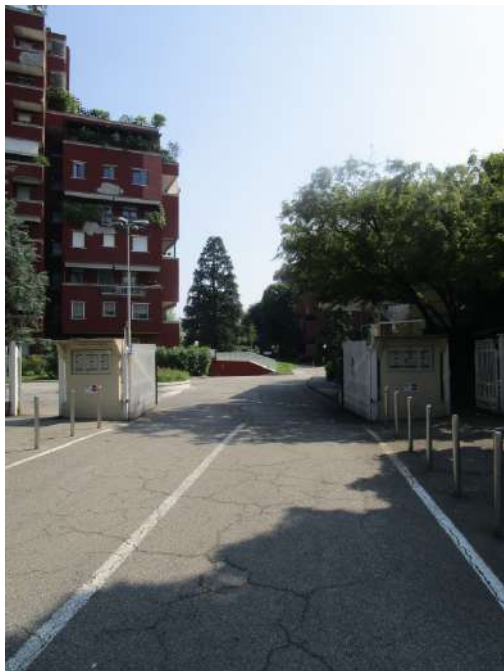
Accesso al complesso immobiliare