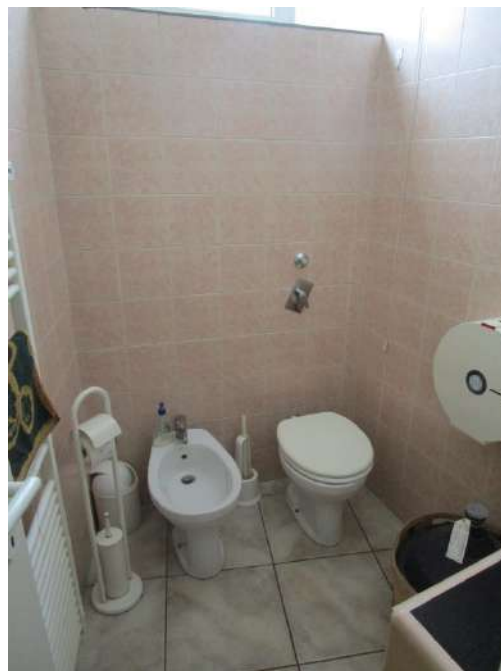
Primo servizio igienico