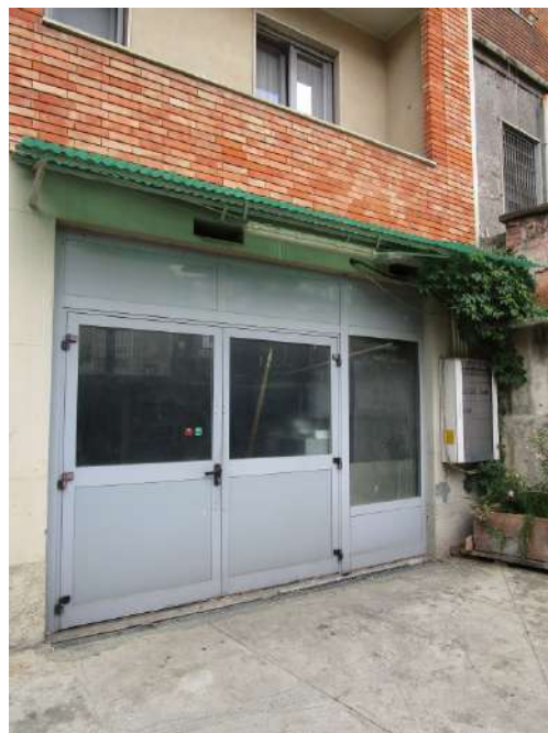
Accesso all'unità immobiliare