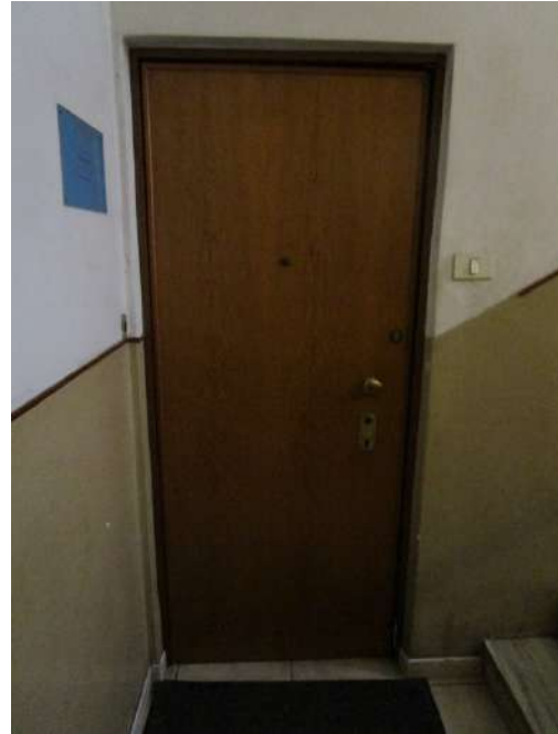
Porta di ingresso