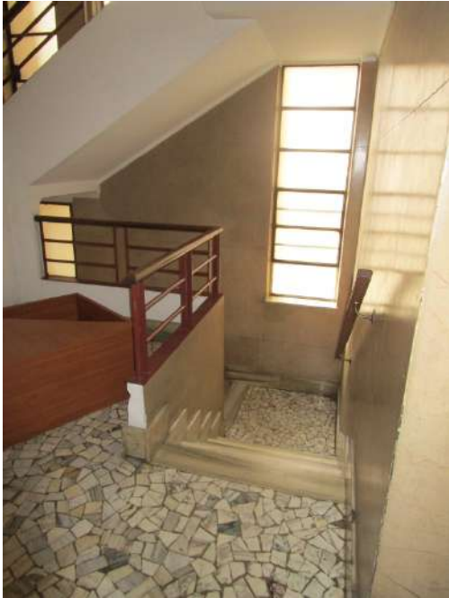
Accesso al piano