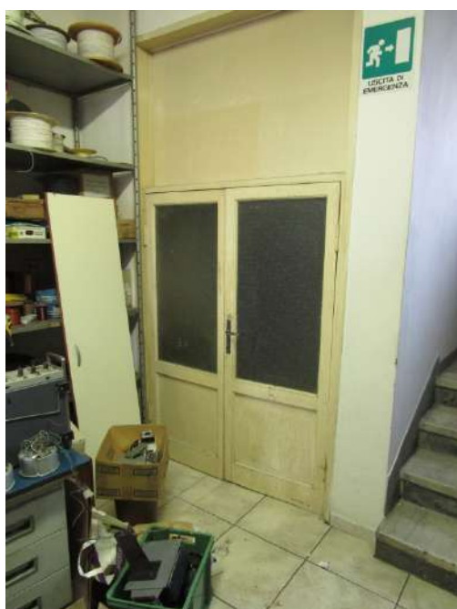
Ripostiglio annesso al magazzino