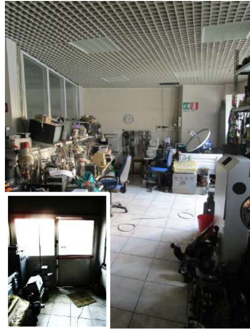
Area operativa provvista di separato locale e di accesso all'area cortile