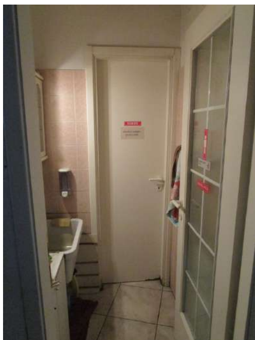
Secondo servizio igienico