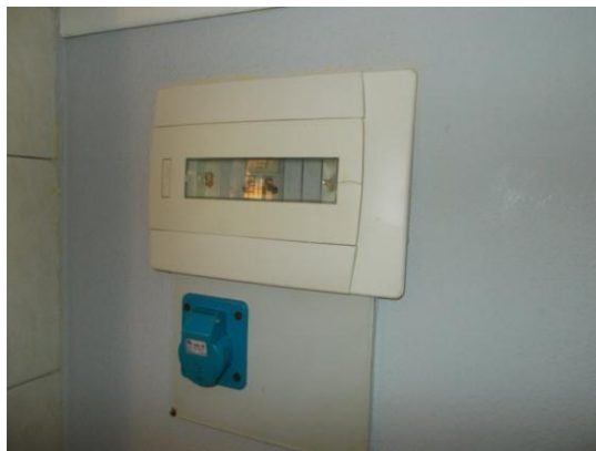
24. Quadro elettrico