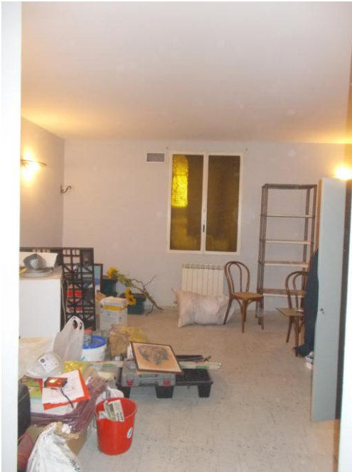
35. Sala ristorante