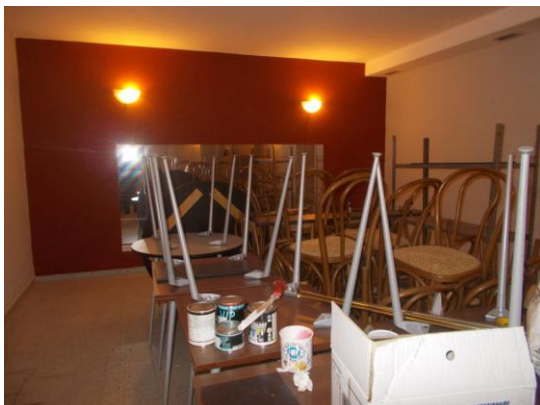
33. Sala ristorante