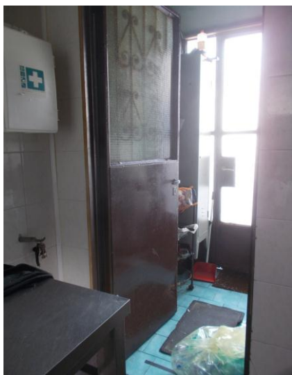
21. Passaggio al locale di servizio