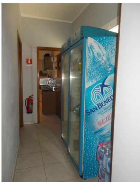
15. Corridoio della zona di servizio