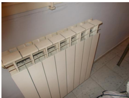
26. Dettaglio termosifone