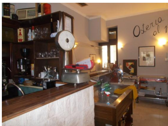
9. Zona bancone bar