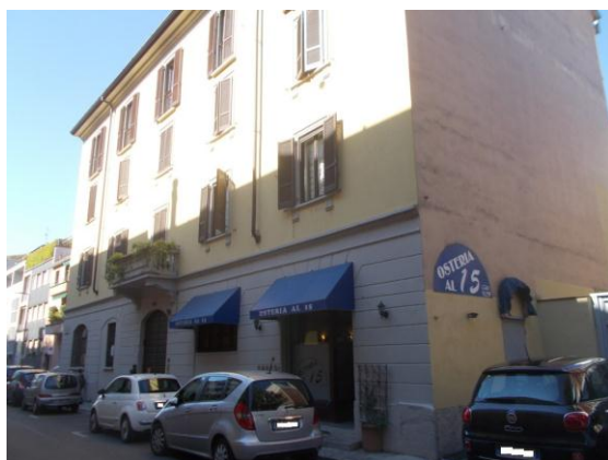
1. Facciata esterna palazzo di via Verro 15