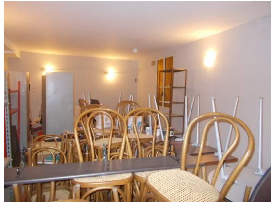
32. Sala ristorante