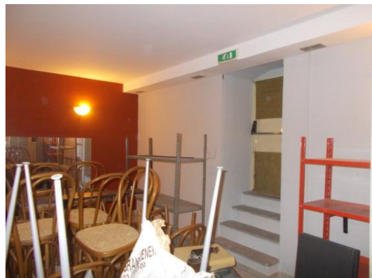
34. Sala ristorante