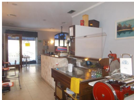
12. Vista verso l'ingresso