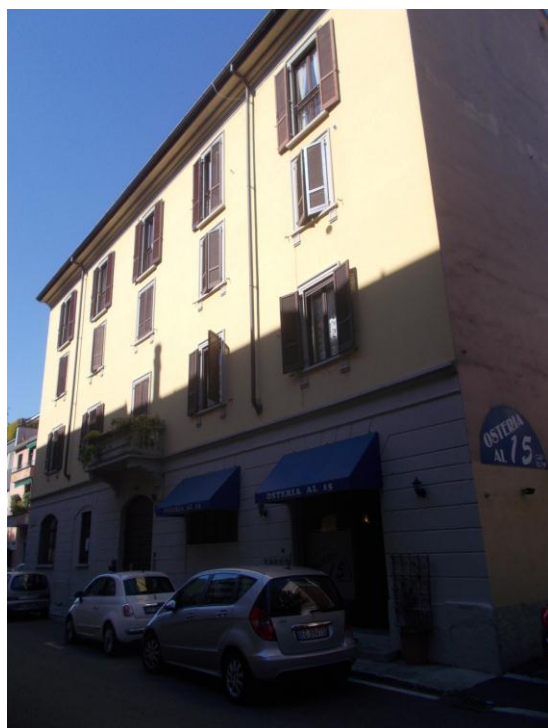
3. Facciata esterna