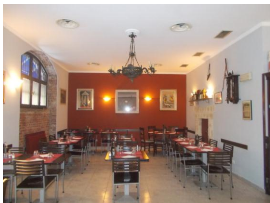
7. Sala principale