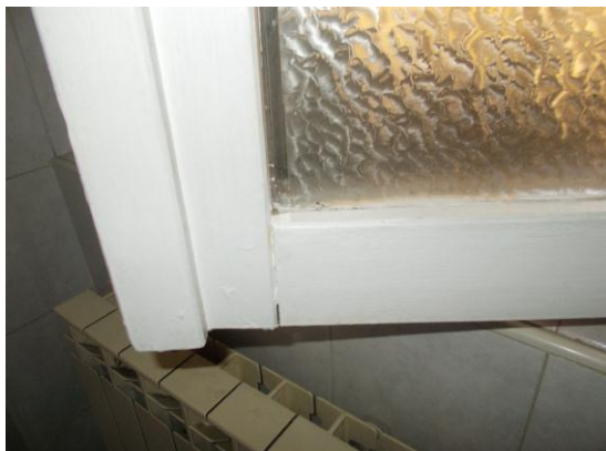
23. Dettaglio del serramento esterno