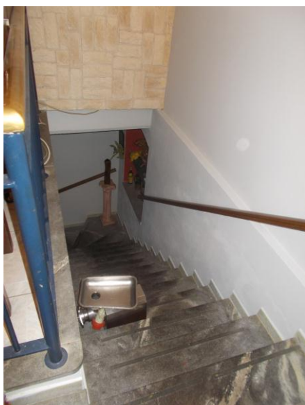
27. Scala per il piano interrato