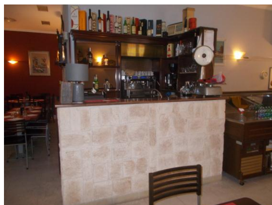
10. Zona bancone bar