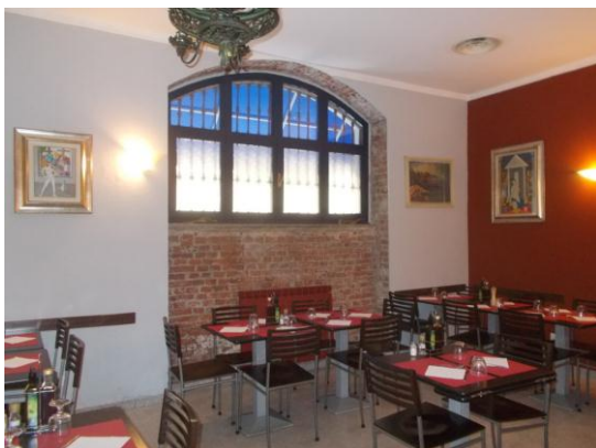
11. Sala principale