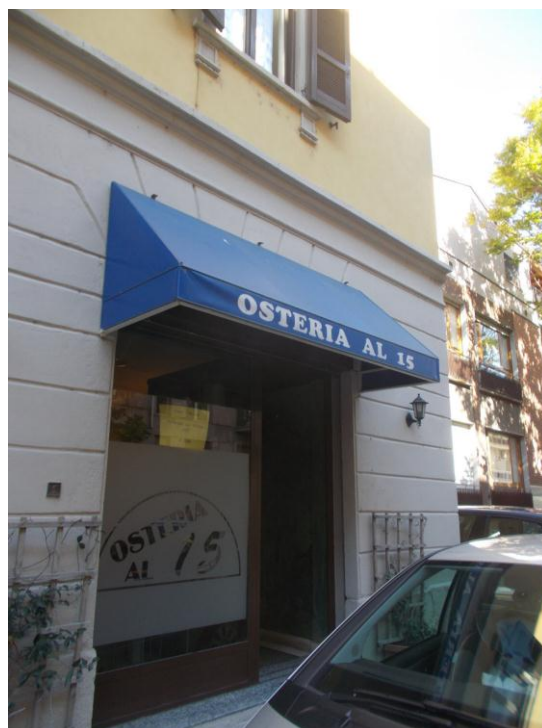
4. Immobile pignorato