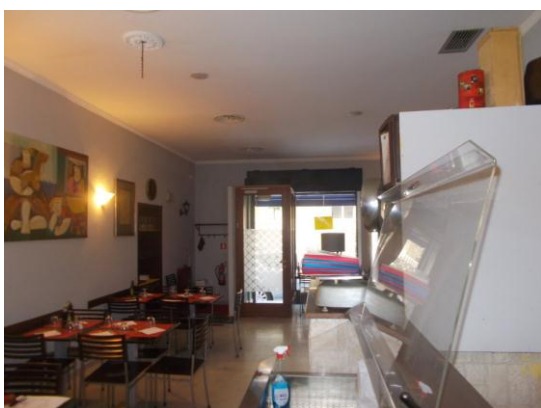
13. Sala principale: vista verso l'ingresso