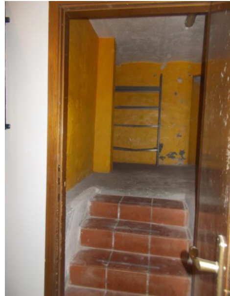
30. Ingresso al locale ripostiglio