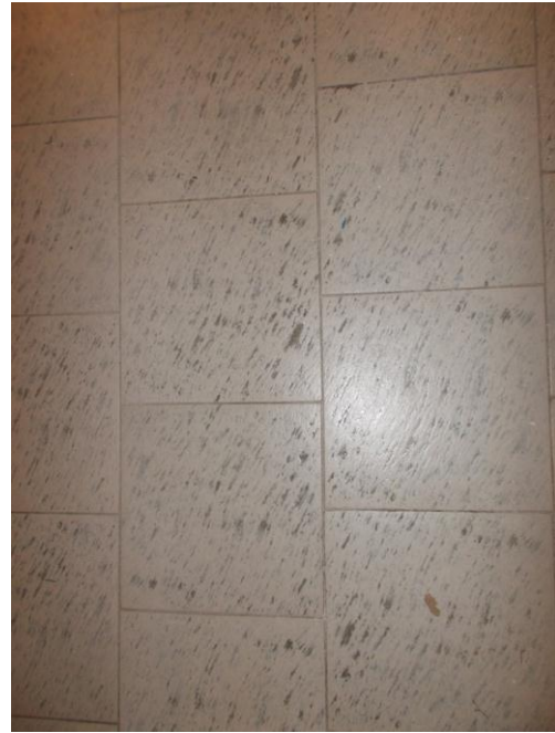
36. Dettaglio del pavimento della sala ristorante al piano interrato