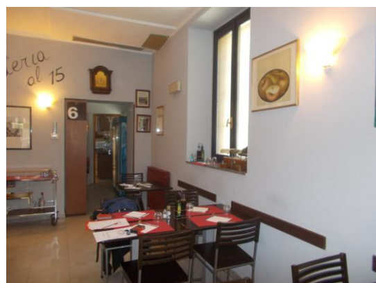
14. Vista verso la zona di servizio