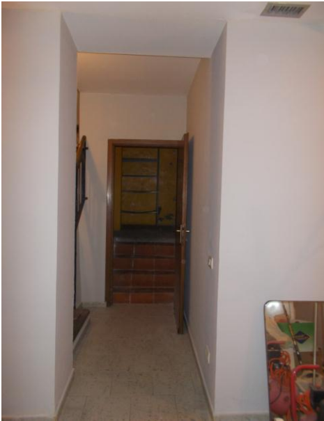
29. Disimpegno al piano interrato