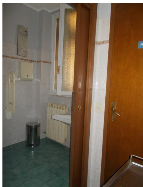
16. Disimpegno dei servizi igienici