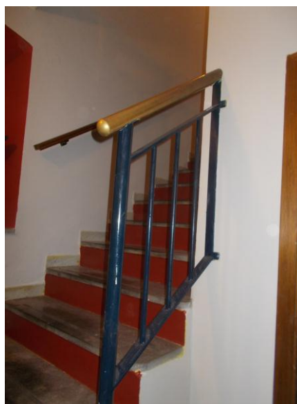
28. Arrivo della scala all'interrato