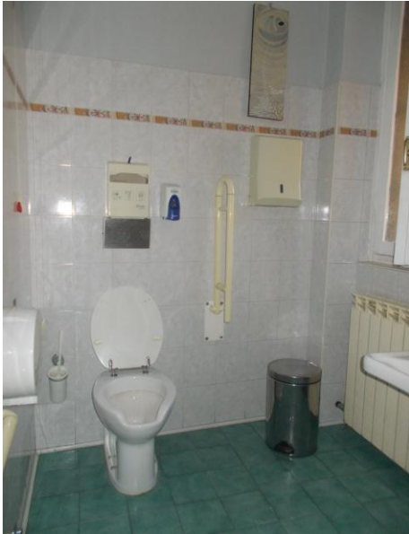
17. Bagno per handicap