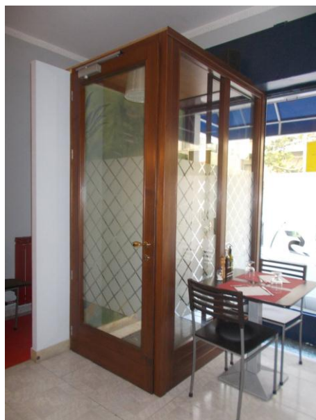
6. Bussola di ingresso (dall'interno)