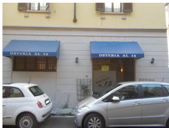
2. Facciata esterna