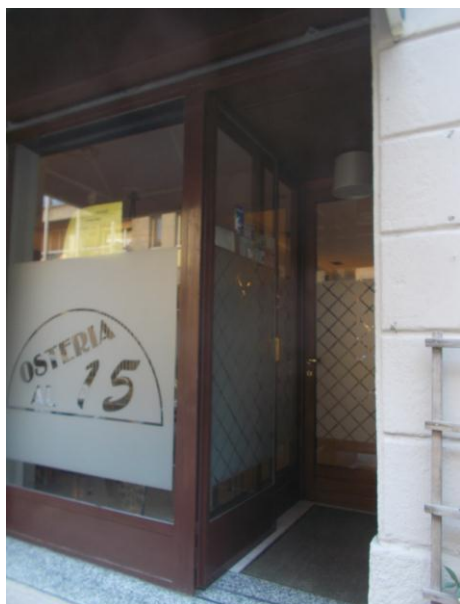
5. Immobile pignorato: ingresso dalla strada