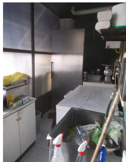
22. Interno del locale di servizio