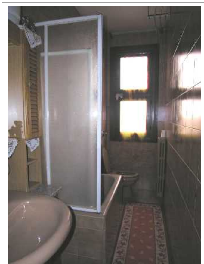
Viste del bagno .