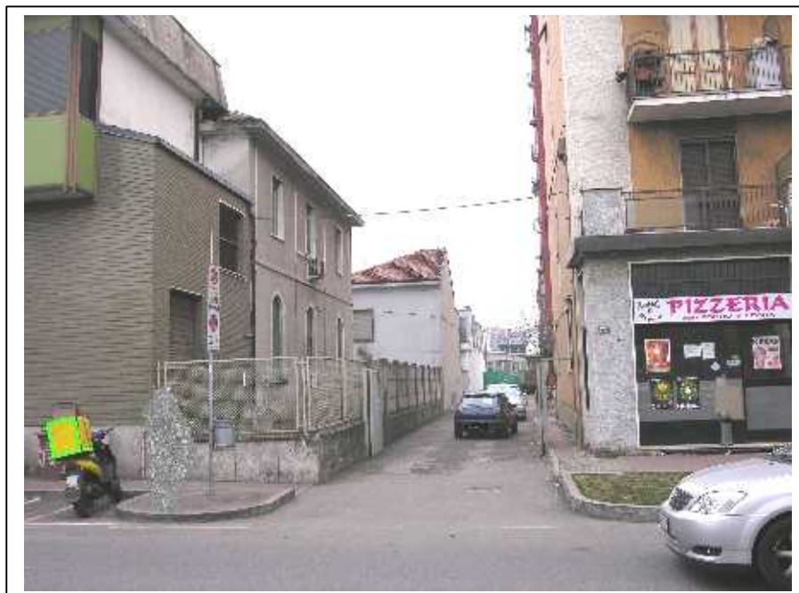
Vista dell' ingresso condominiale , pedonale e carrabile, alla palazzina in oggetto e vista degli spazi esterni condominiali .