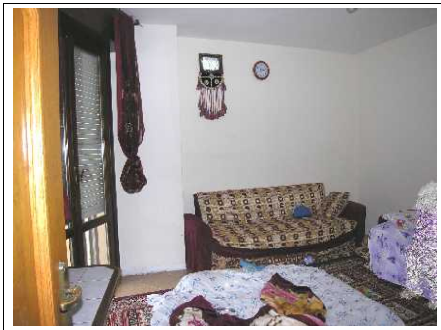
Viste di una delle n. 2 camere da letto dell'appartamento.