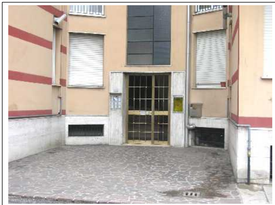
Vista dello spazio esterno prospettante l'ingresso all'interno della palazzina in oggetto e particolare del portone di accesso comune .