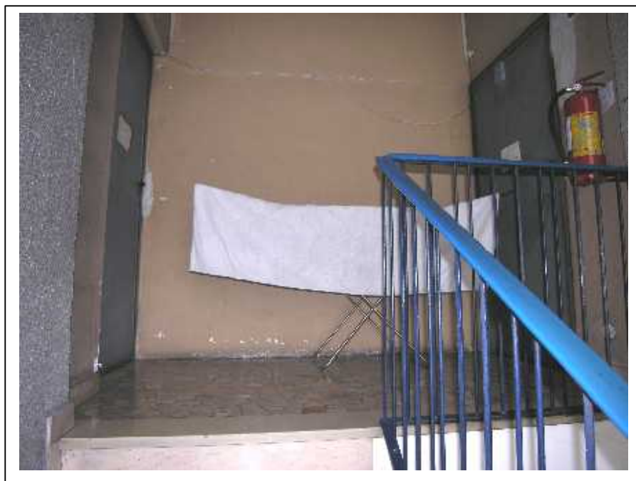
Vista del pianerottolo ove sono situati i vani di solaio e particolare del portoncino di accesso .