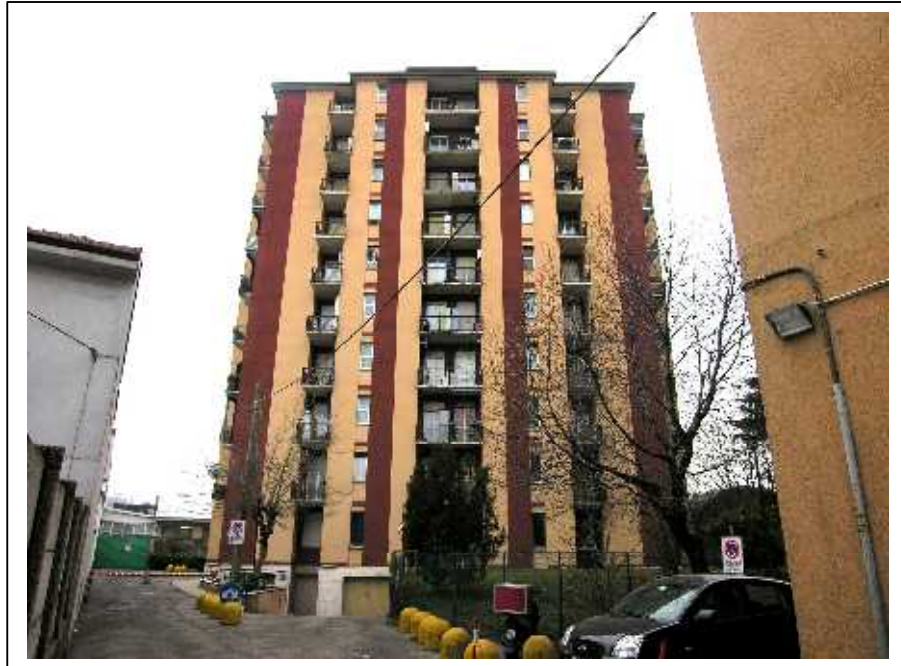
Viste della palazzina di via A. Gramsci n. 67 a Cormano.