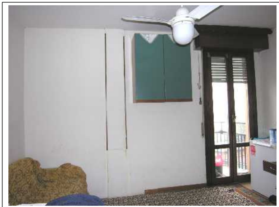
Viste del locale soggiorno/pranzo/cottura dell'appartamento.