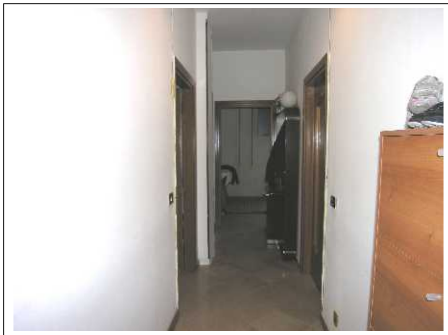
Viste del disimpegno .