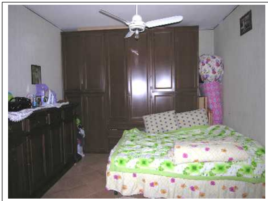
Viste della seconda camera da letto .