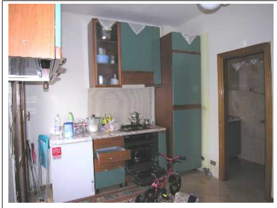
Vista della zona cottura del soggiorno e particolare del cucinotto attiguo.