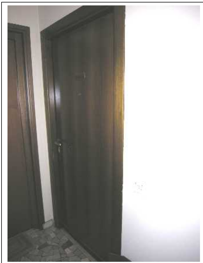
Viste, esterna ed interna, del portoncino di accesso all'appartamento in oggetto.