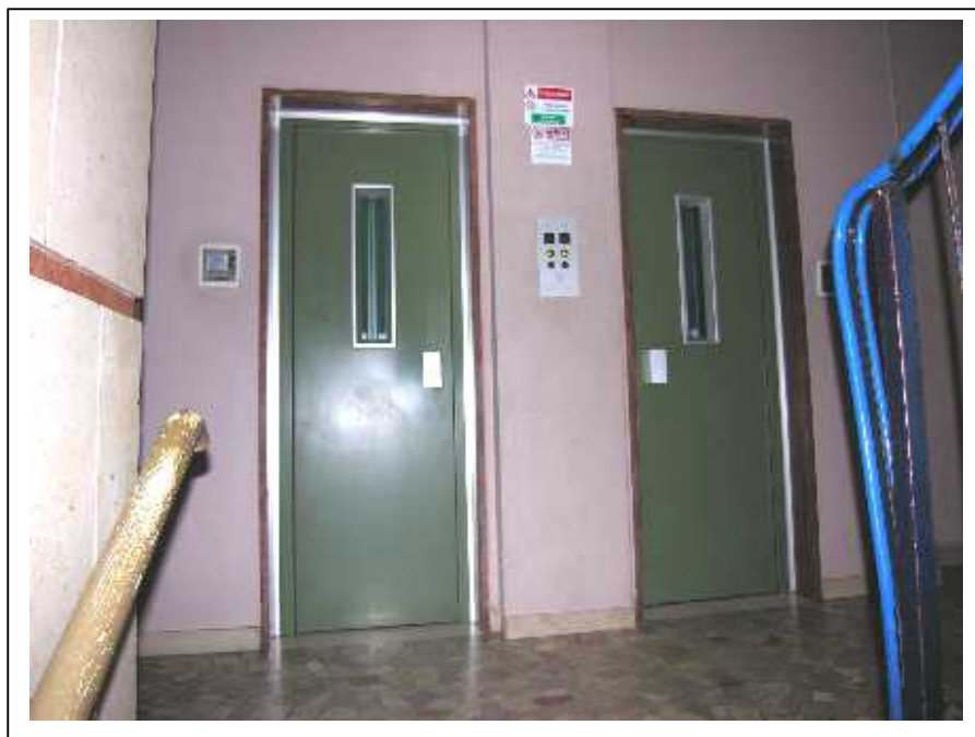
Viste, esterna ed interna, degli ascensori condominiali .