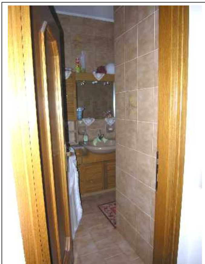
Altra vista del bagno e vista del balcone .