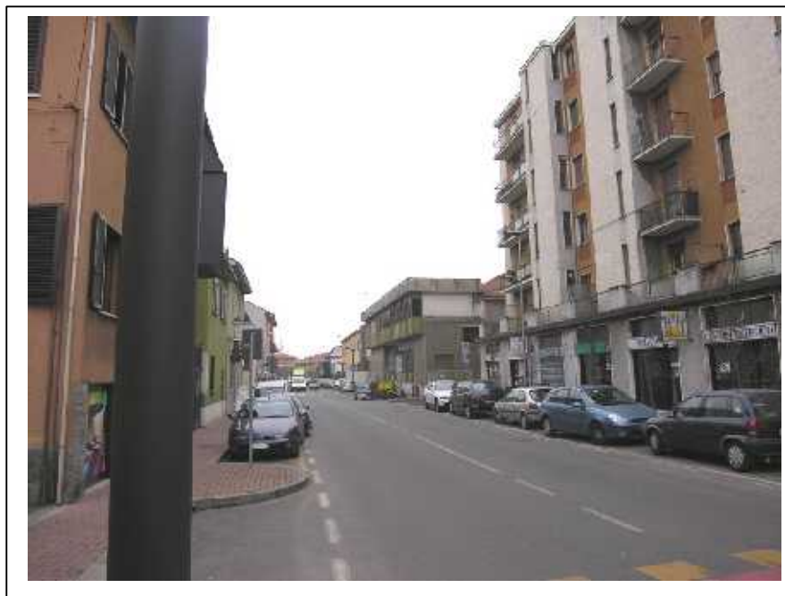
Viste del contesto: Via A. Gramsci.