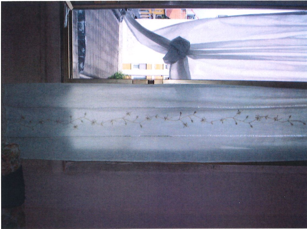
FINESTRA CON DOPPI VETRI