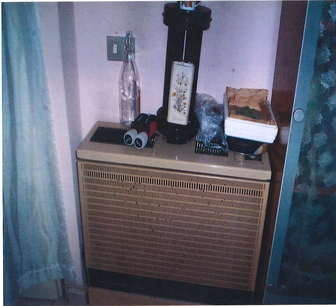
PARTICOLARE STUFA A GAS