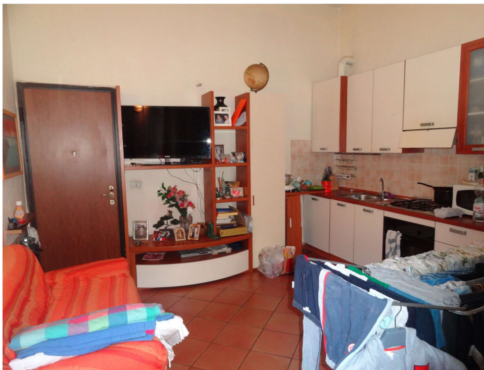
Foto interna - ingresso soggiorno pranzo

Viale Gian Galeazzo n. 17 20136 Milano (MI) Cell. +39.347.3129596 Tel. fax +39.02.36560692 P. IVA 03227970278 E – mail line_project@hotmail.it