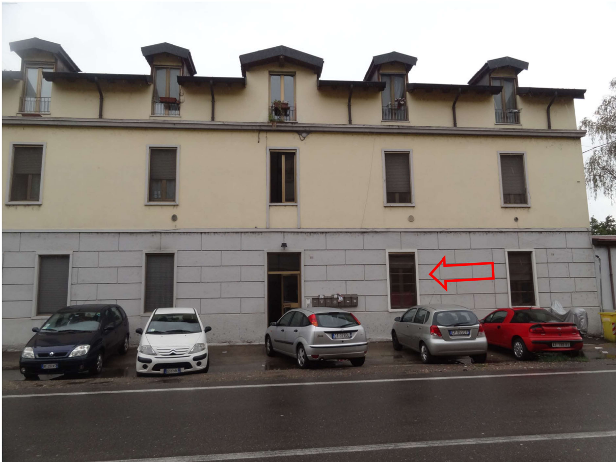
Foto esterna - cespite sul fronte strada

Viale Gian Galeazzo n. 17 20136 Milano (MI) Cell. +39.347.3129596 Tel. fax +39.02.36560692 P. IVA 03227970278 E – mail line_project@hotmail.it