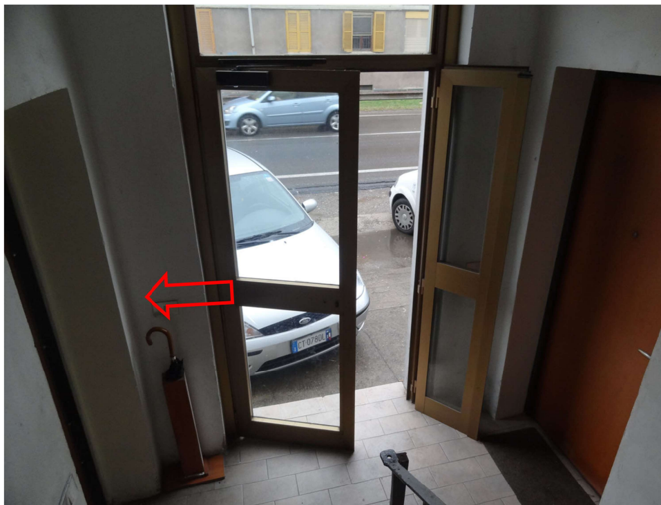
Foto interna - ingresso principale condominio lato interno

Viale Gian Galeazzo n. 17 20136 Milano (MI) Cell. +39.347.3129596 Tel. fax +39.02.36560692 P. IVA 03227970278 E – mail line_project@hotmail.it