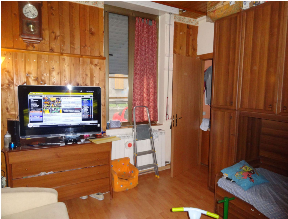
Foto interna - camera