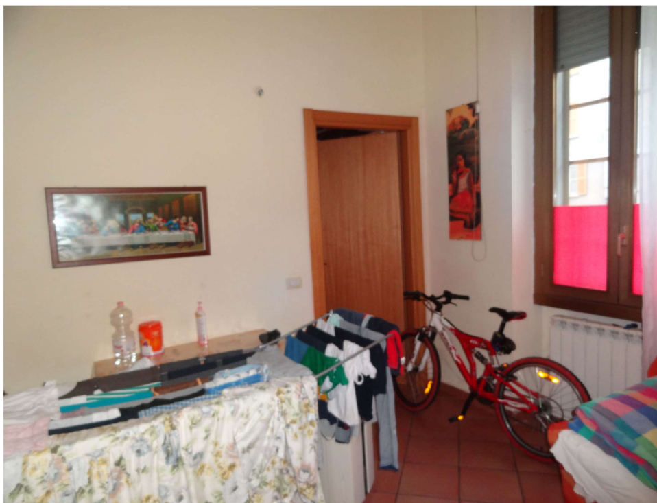
Foto interna - ingresso soggiorno pranzo