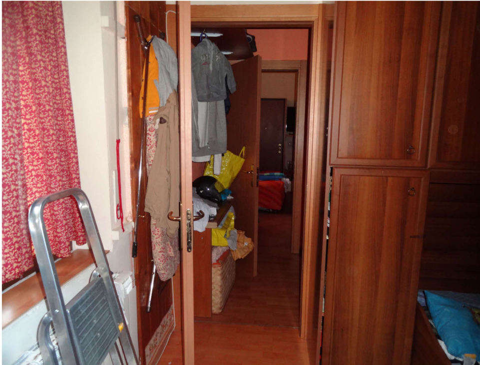
Foto interna - disimpegno

Viale Gian Galeazzo n. 17 20136 Milano (MI) Cell. +39.347.3129596 Tel. fax +39.02.36560692 P. IVA 03227970278 E – mail line_project@hotmail.it