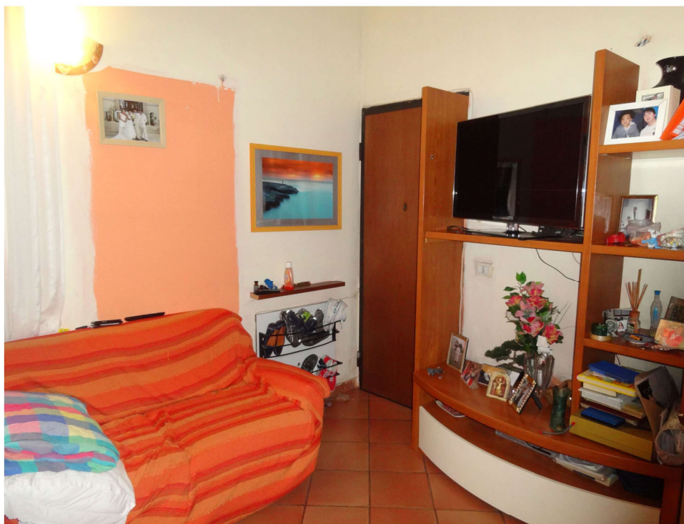
Foto interna - ingresso soggiorno pranzo