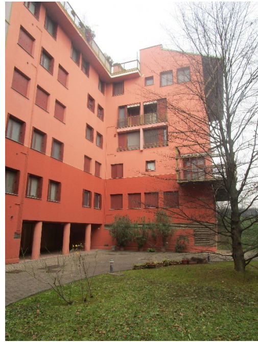
Edificio (prospetto sud est)