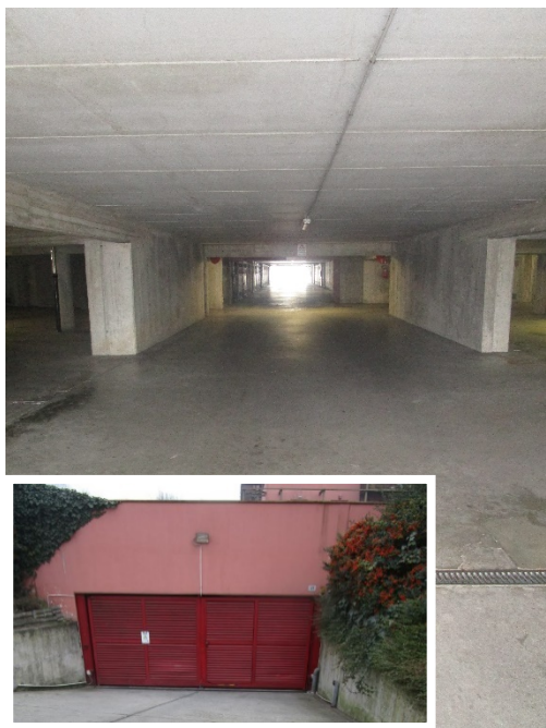
Passo carraio e aree di manovra