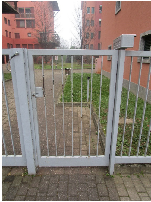
Accesso al Condominio