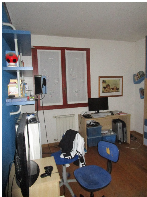
Prima camera da letto