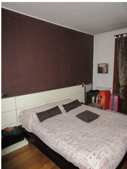
Seconda camera da letto