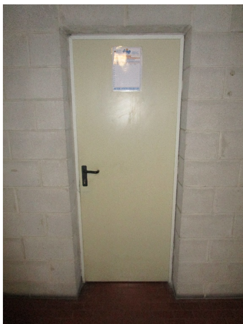
Accesso al piano (da scala o ascensore)