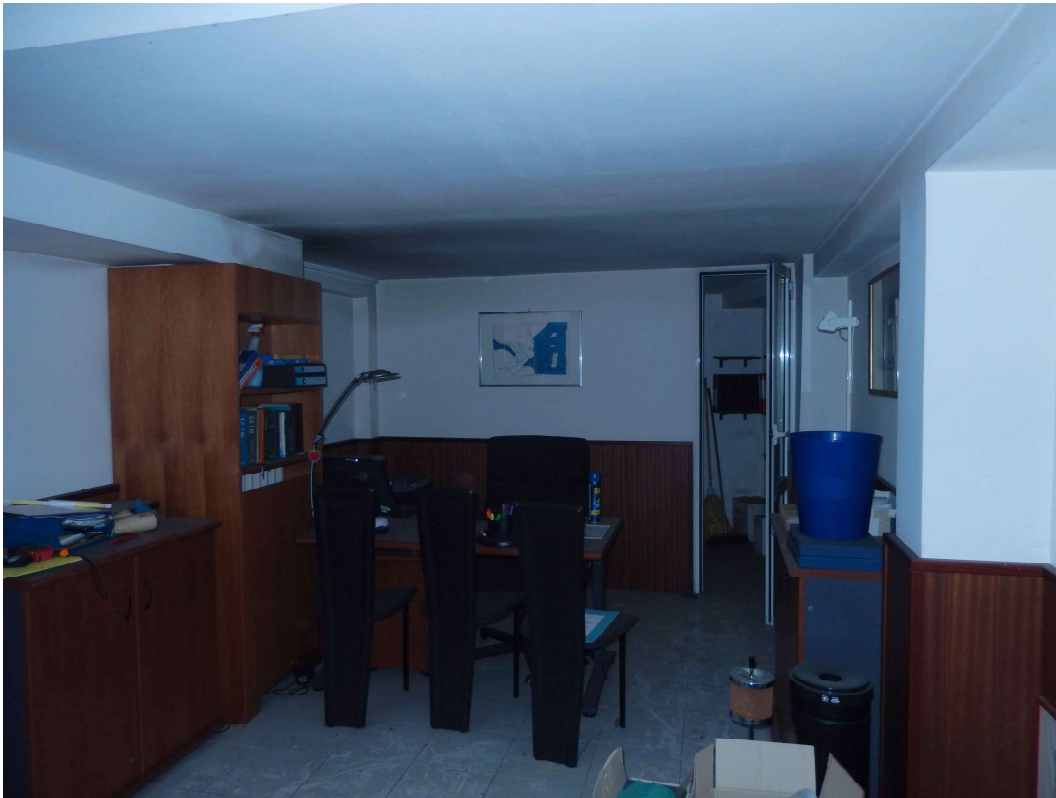
Foto 7 – Altra vista parziale del vano principale. Sullo sfondo il locale ripostiglio.