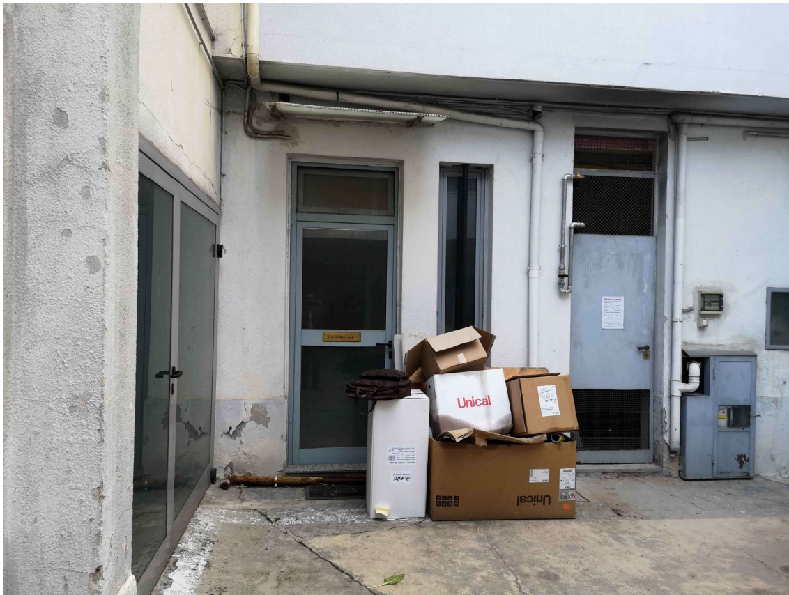
Foto 5 – Altra vista dell'ingresso con la finestra del bagno sulla destra.