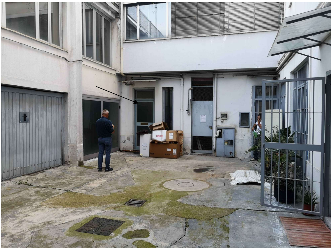
Foto 4 – Vista d'insieme del cortile. Indicato dalla freccia l'ingresso del laboratorio.