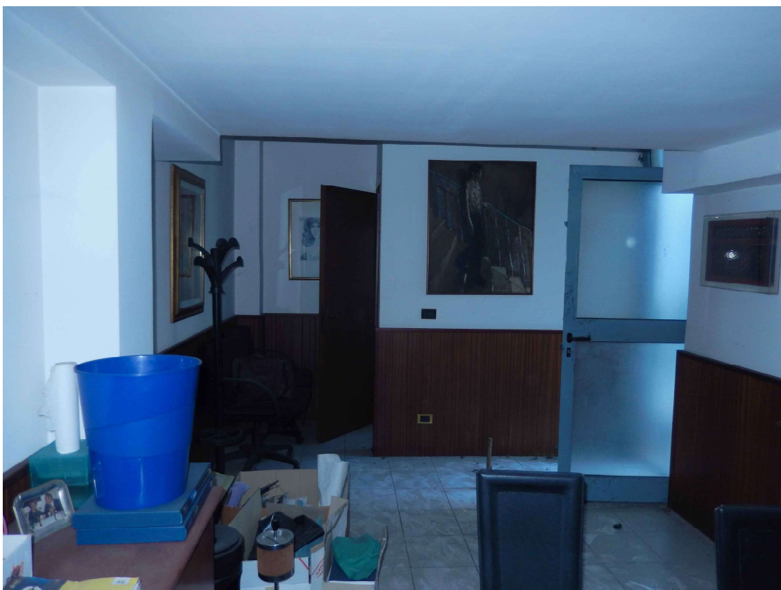
Foto 6 – Il vano principale del laboratorio con la porta del bagno sulla sinistra.