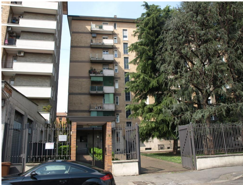
PIAZZA BRUZZANO n° 5 – INGRESSO EDIFICIO