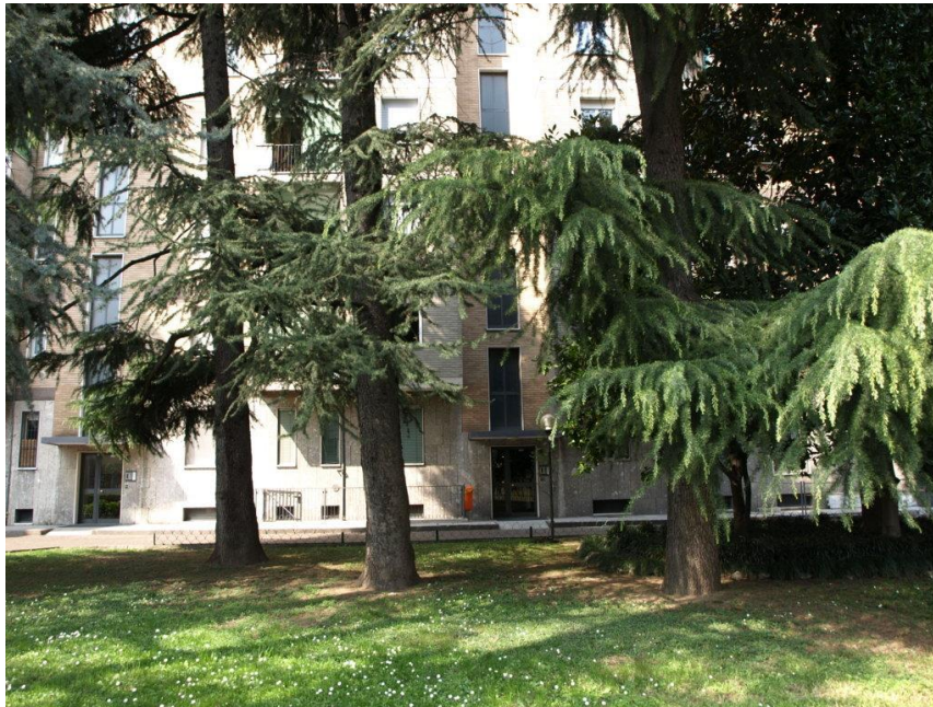
INGRESSO SCALA 5

R.G.E. n°1168/2016 MILANO Piazza Bruzzano n°5 Scala 5 Appartamento piano rialzato+S1