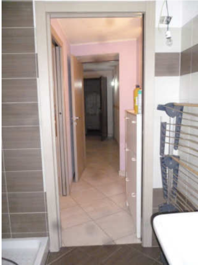
FOTO 17 – Box (!) Sub. 24 con attuale unico accesso da vano cantina Sub. 8