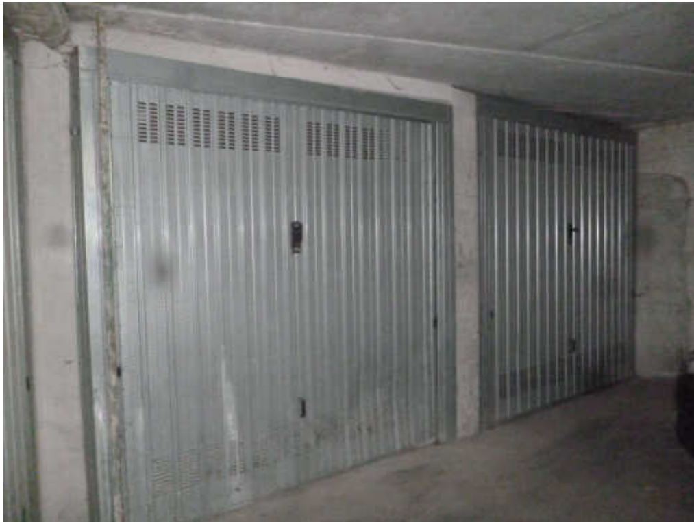
FOTO 16 – Box Sub. 24 a sinistra e Box Sub. 25 a destra. La basculante del Sub. 24 è bloccata dal tamponamento interno.