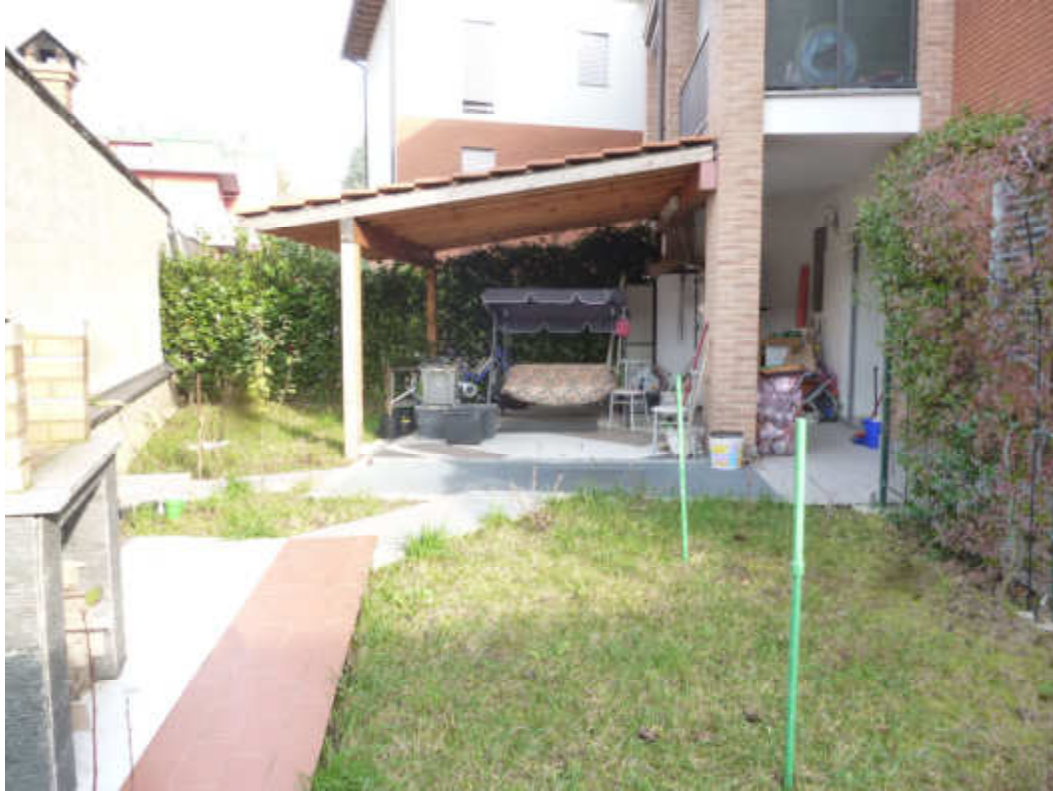
FOTO 13 – Tettoia realizzata su giardino di pertinenza lato porticato cucina