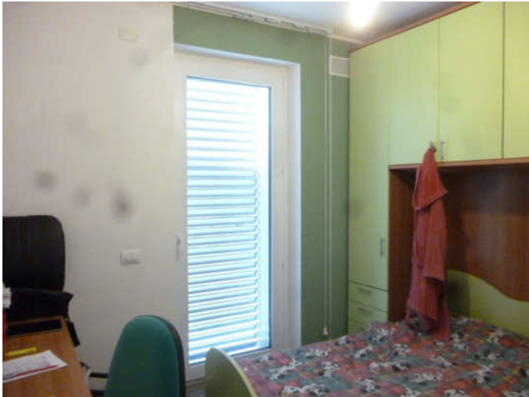
FOTO 9 – Ripostiglio, attualmente utilizzato come camera da letto