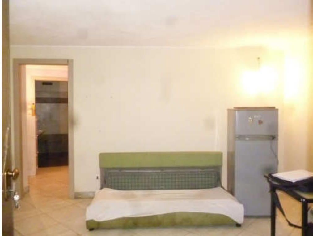
FOTO 15 – Vano cantina Sub. 8, in evidenza porta di collegamento al Sub. 24