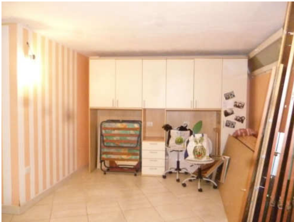
FOTO 18 – Box (!) Sub. 24. Al posto della basculante un tamponamento con finestrella