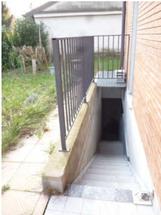
FOTO 12 – Scala di accesso al vano cantina dal giardino di pertinenza