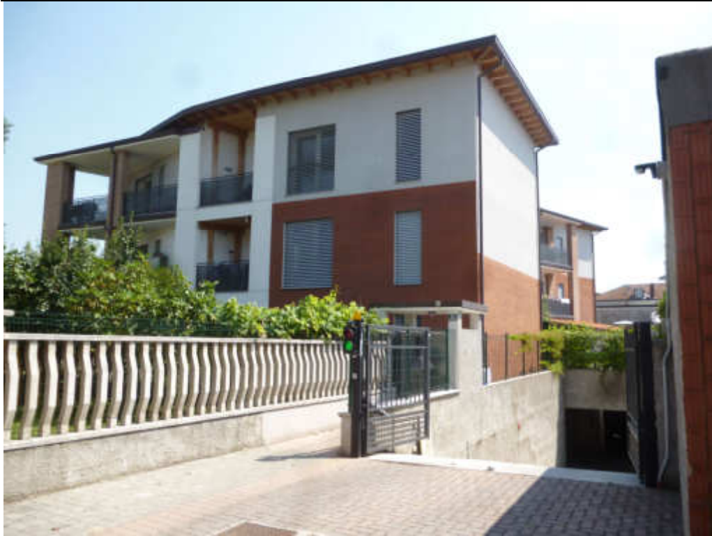
FOTO 1 – Ingresso carraio e pedonale da Via G. Verdi n° 58 in CESATE