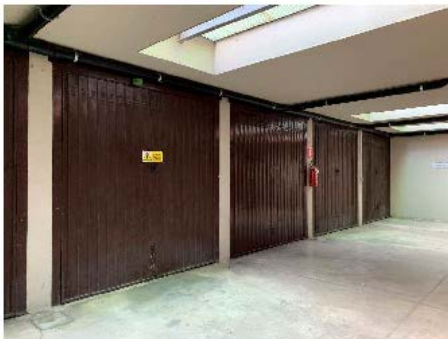
Fotografia n. 3485 - Vista dell'esterno e dell'interno del box autorimessa oggetto della procedura (quarto box dal fondo)