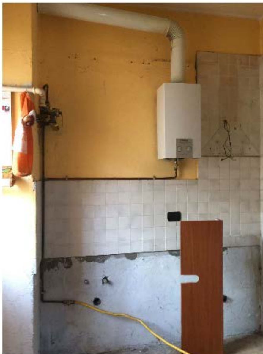
Foto n. 21 - Vista del locale cucina, con particolare dello scaldabagno a gas