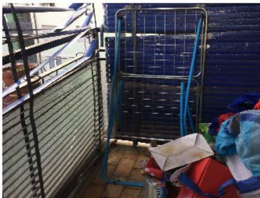
Fotografia n. 19 - Vista del balcone, su cui affaccia il locale soggiorno/pranzo