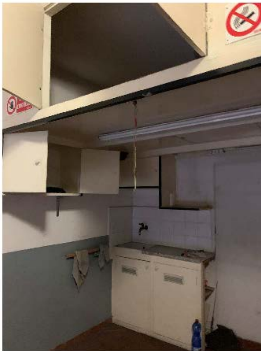
Fotografia n.37 – Particolare della struttura ribassata e sopralcanta presente sul fondo del box autoriscaldamento oggetto della procedura

P.C.E. n. 1622/2018 : UNICREDIT S.P.A. e per esso DOBANKS.P.A.