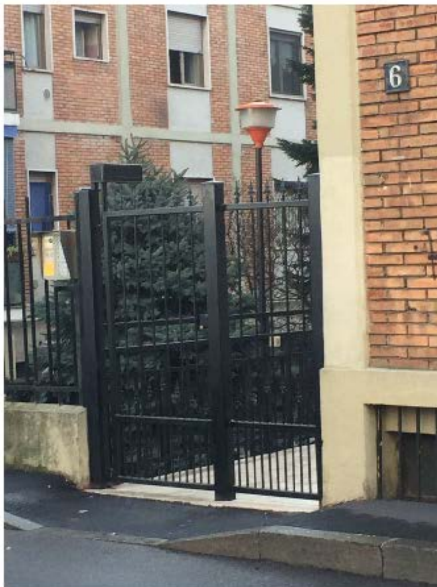
Fotografia n.3 - Particolare del cancello pedonale di ingresso alla "Palazzina 6" del Condominio "Calzini", sulla Via Privata Raffaele Calzini n. 6 - Milano