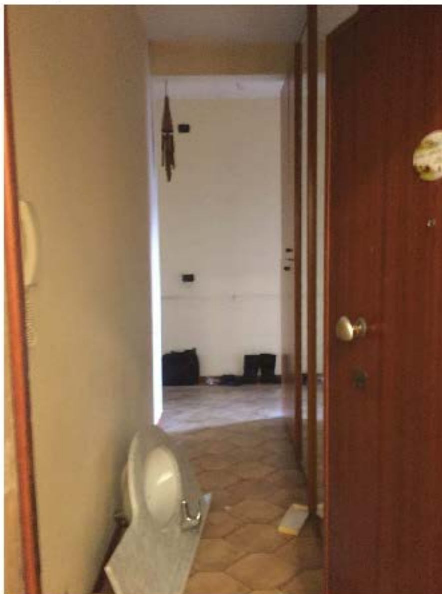
Fotografia n. 14 - Vista del locale ingresso/disimpegno dall'esterno dell'immobile

P.C.E. n. 3048/2014 : CONDOMINIO CASE DI VIA CAIZINI N. 4/6/8 1016 V.R. PASCARELLA N. 24J IN MILANO P.C.E. n. 3048/2014 : CONDOMINIO DI VIA SALLIA 30/32 - 20137 - MILANO (Intervento) P.C.E. n. 3048/2014 : UNICREDIT S.P.A. e per esso UNICREDIT CREDIT MANAGEMENT BANKS.P.A. (Intervento) P.C.E. n. 3048/2014 : CONDOMINIO CASE DI VIA CAIZINI N. 4/6/8 IN MILANO (Intervento) P.C.E. n. 1622/2018 : UNICREDIT S.P.A. e per esso DOBANCS.P.A.