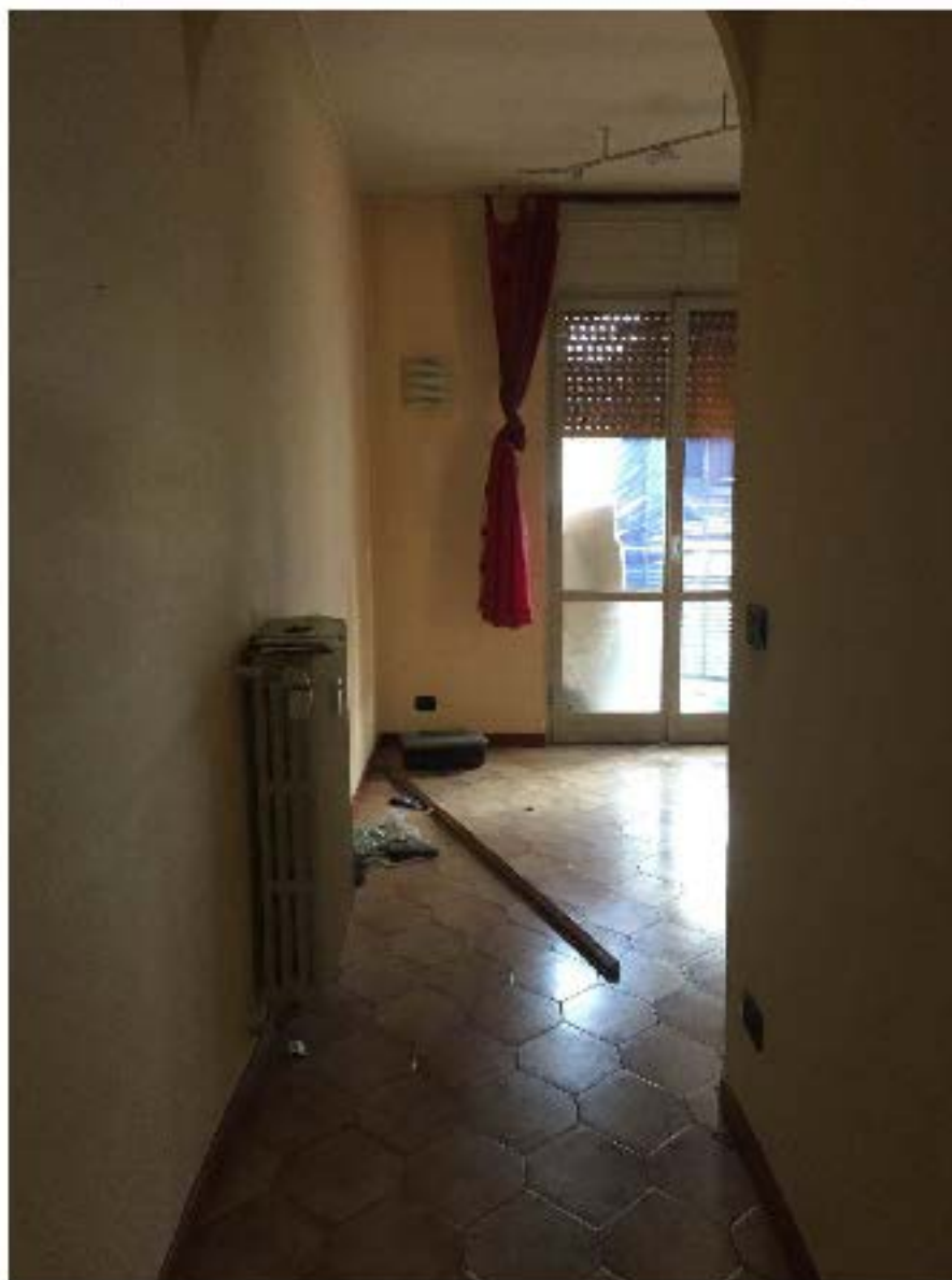
Fotografia n. 17 - Vista del locale soggiorno/pranzo dal locale di impegno