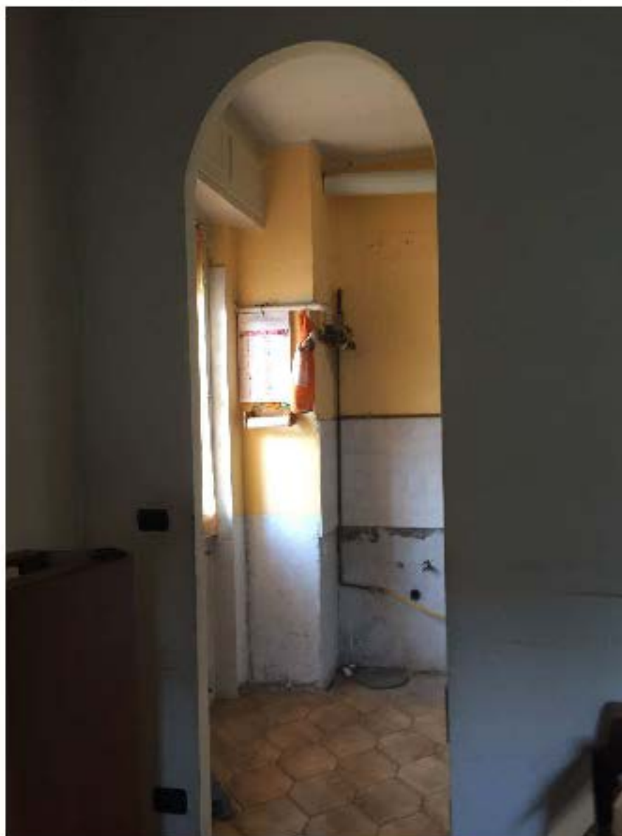
Foto n. 20 - Vista dell'arco di accesso al locale cucina, dal locale soggiorno/pranzo