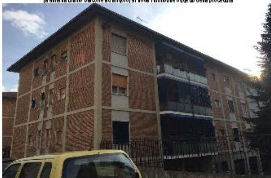
Fotografia n. 2 - "Palazzina 6" del Condominio "Calzini": prospetto secondario sulla Via Privata Raffaele Calzini n. 6 - Milano, dove al piano secondo - terzo fuori terra (a destra prima finestra) si trova l'immobile oggetto della procedura