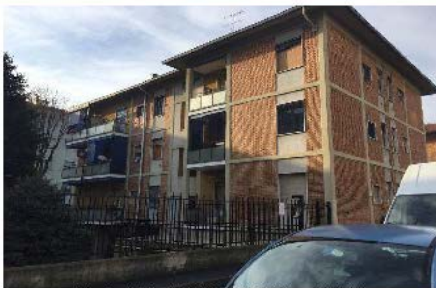
Fotografia n. 1 - "Palazzina 6" del Condominio "Calzini": prospetto principale sulla Via Privata Raffaele Calzini n. 6 - Milano, dove al piano secondo - terzo fuori terra (a sinistra ultimo balcone ad angolo) si trova l'immobile oggetto della procedura