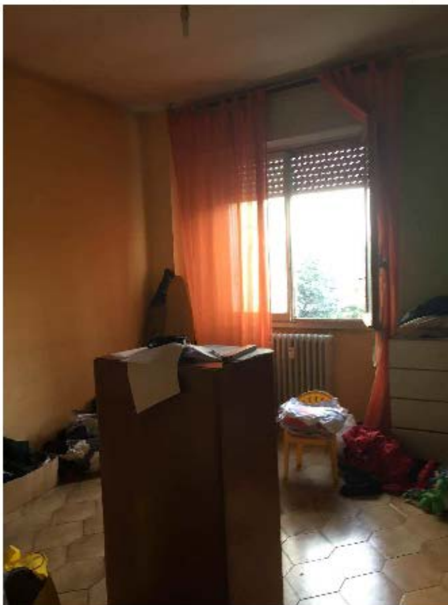
Fotografia n. 15 - Vista del locale camera da letto

P.C.E. n. 3048/2014 : CONDOMINIO CASE DI VIA CAIZINI N. 4/6/8 1016 V.R. PASCARELLA N. 24J IN MILANO P.C.E. n. 3048/2014 : CONDOMINIO DI VIA SALLA 30/32 - 20137 - MILANO (Intervento) P.C.E. n. 3048/2014 : UNICREDIT S.P.A. e per esso UNICREDIT CREDIT MANAGEMENT BANKS.P.A. (Intervento) P.C.E. n. 3048/2014 : CONDOMINIO CASE DI VIA CAIZINI N. 4/6/8 IN MILANO (Intervento) P.C.E. n. 1622/2018 : UNICREDIT S.P.A. e per esso DOBANKS.P.A. COMO