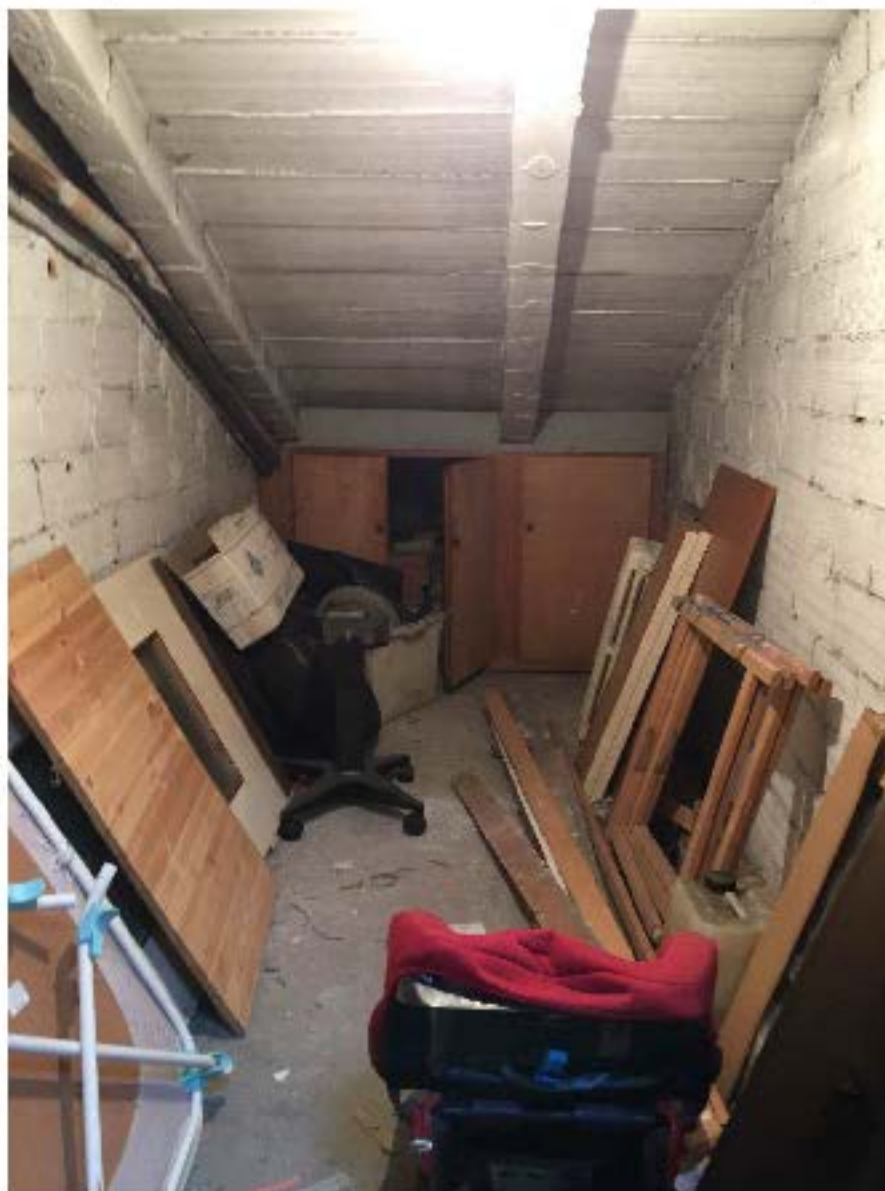
Fotografia n. 23 - Vista dell'interno del solco di proprietà degli esecutori

P.C.E. n. 3048/2014 : CONDOMINIO CASE DIVIA CAIZINI N. 4/6/8 1016 V.R. PASCARELLA N. 24J IN MILANO P.C.E. n. 3048/2014 : CONDOMINIO DIVIA SALLIA 30/32 - 20157 - MILANO (Intervento) P.C.E. n. 3048/2014 : UNICREDIT S.P.A. e per esso UNICREDIT CREDIT MANAGEMENT BANKS.P.A. (Intervento) P.C.E. n. 3048/2014 : CONDOMINIO CASE DIVIA CAIZINI N. 4/6/8 IN MILANO (Intervento) P.C.E. n. 1622/2018 : UNICREDIT S.P.A. e per esso DOBANCS.P.A.