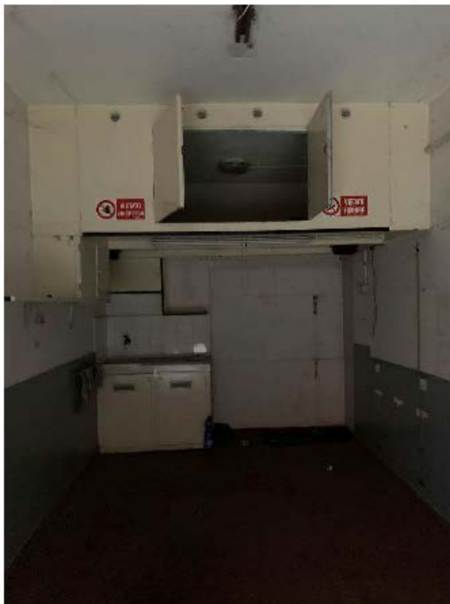
Fotografia n. 36 - Vista dell'interno del box autorimesse oggetto della procedura