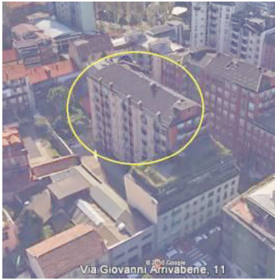
Vista aerea su Via Arrivabene