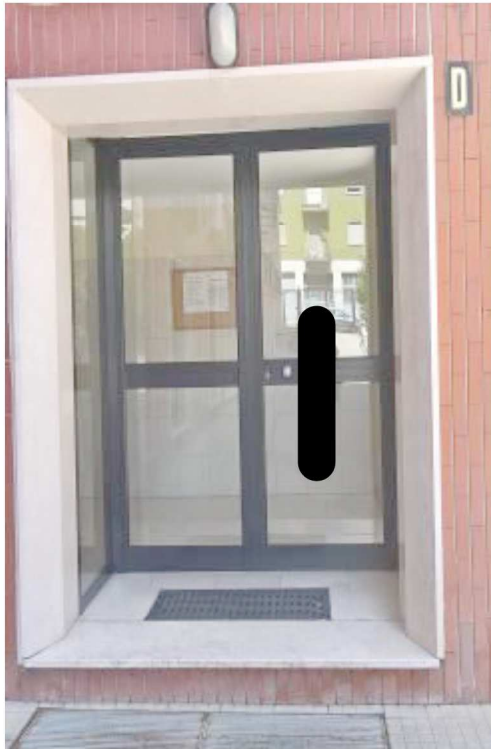
Ingresso alla scala D