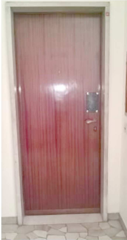
Porta di primo accesso