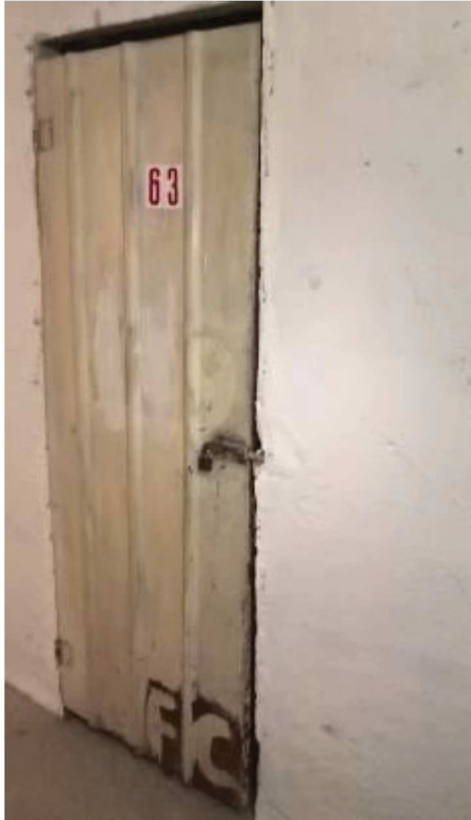
Porta di accesso al vano cantina