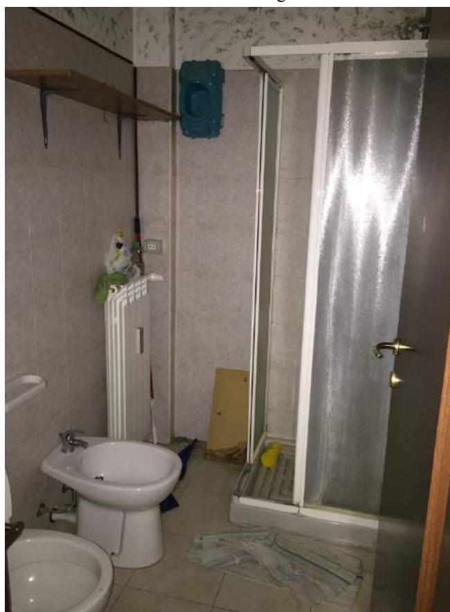
Foto 22 - Bagno