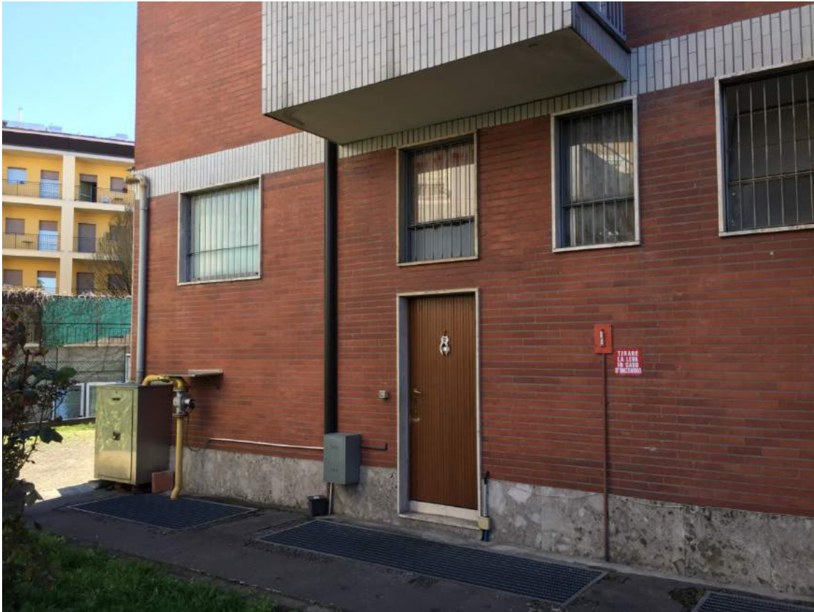
Foto 07 - Prospetto frontale dell'unità immobiliare sul cortile comune