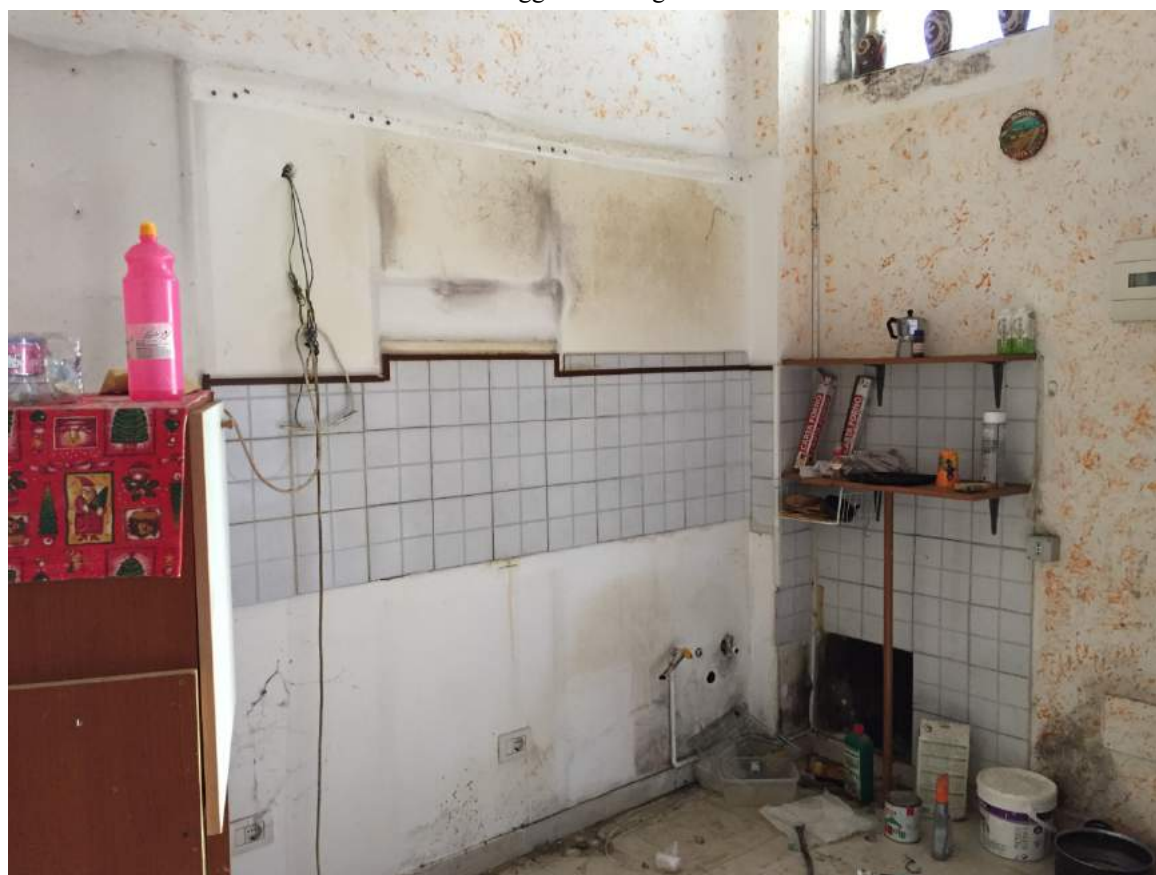
Foto 14 - Angolo cottura