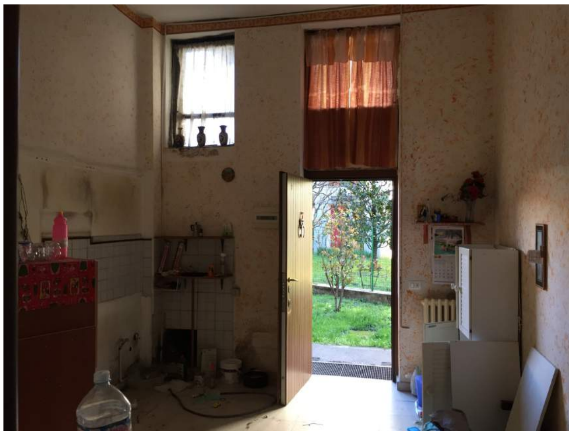
Foto 13 - Soggiorno e angolo cottura