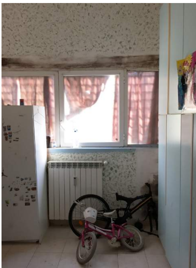
Foto 20 - Camera