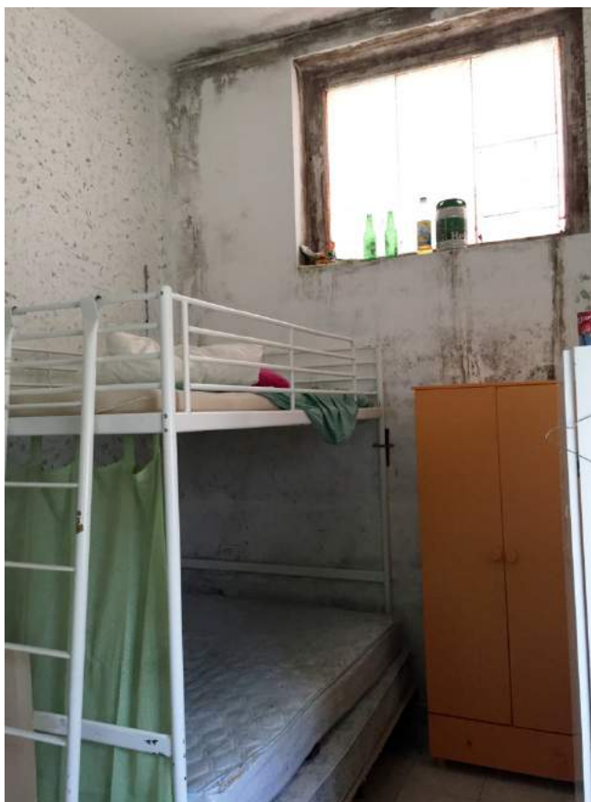
Foto 19 - Camera