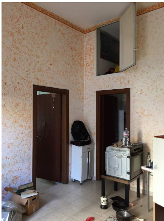
Foto 12 - Soggiorno