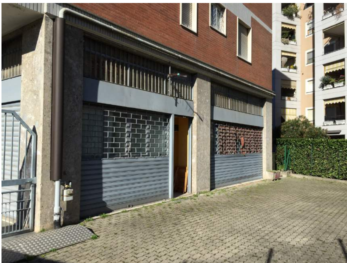
Foto 06 - Facciata laterale del fabbricato al piano terra e cortile comune