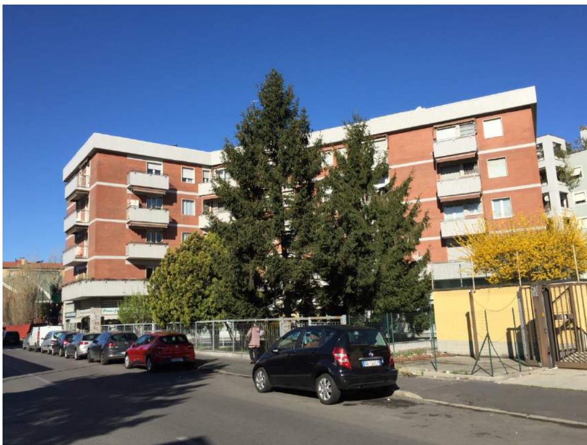
Foto 01 - Il fabbricato su via Trilussa