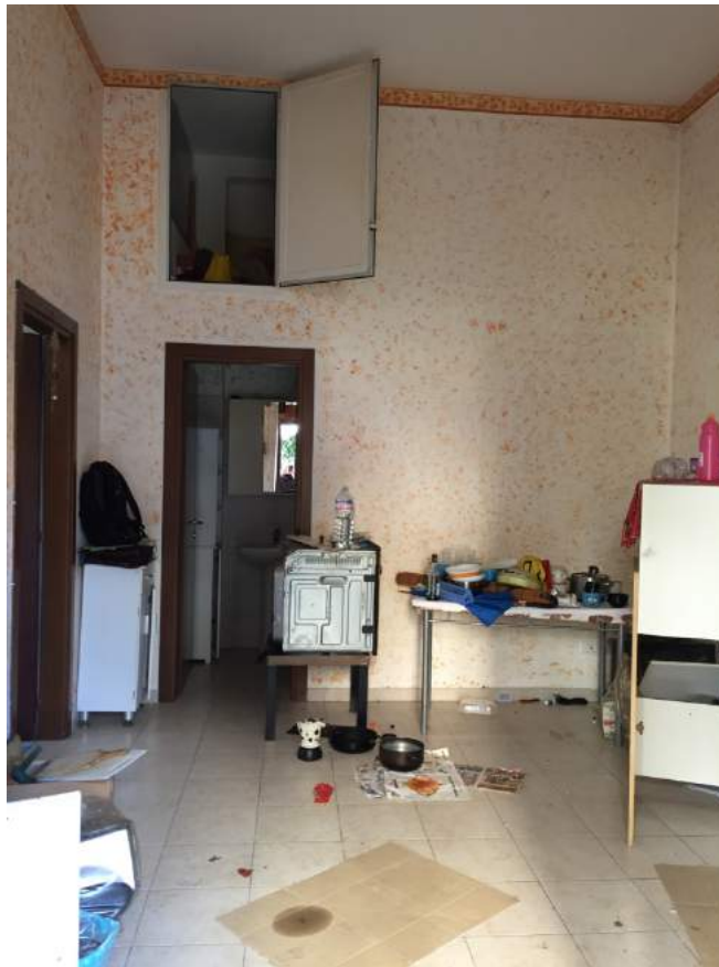
Foto 11 - Soggiorno