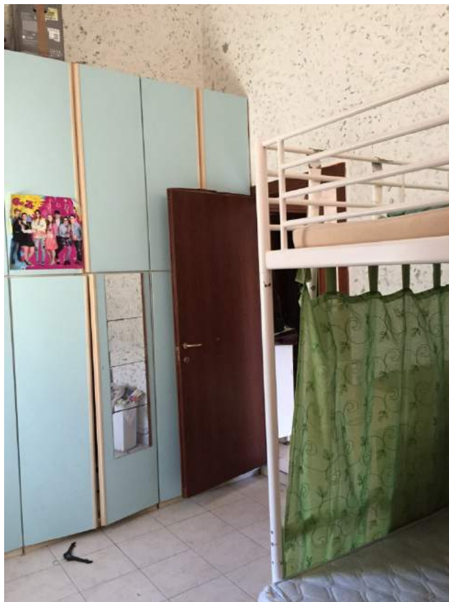
Foto 17 - Camera