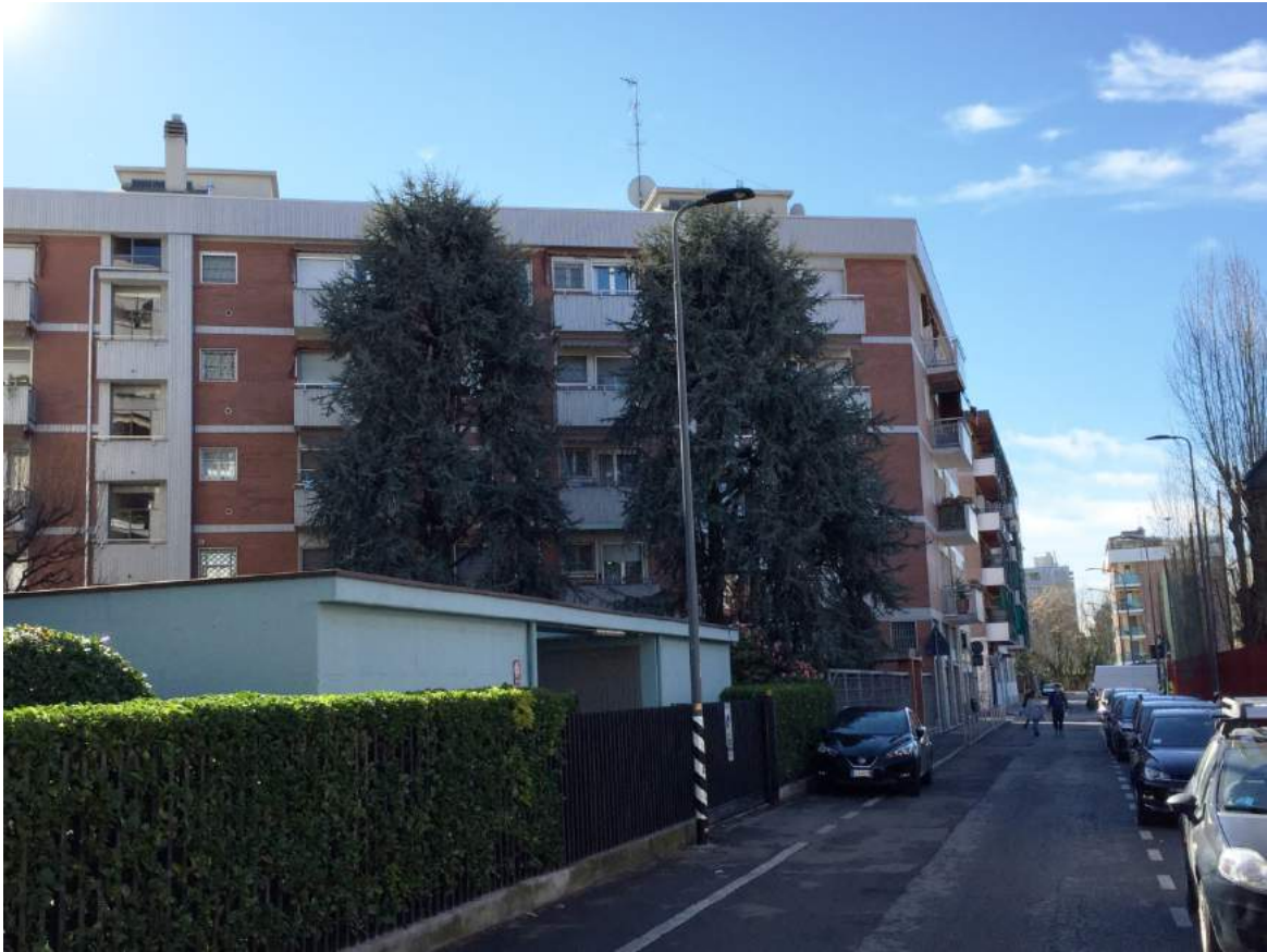
Foto 03 - Il fabbricato su via Ungaretti