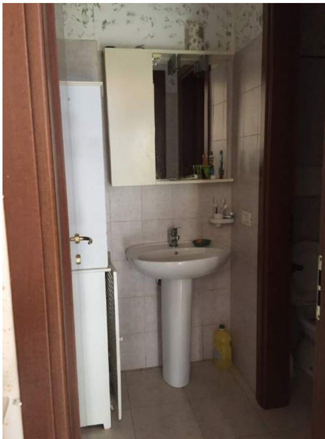
Foto 21 - Antibagno