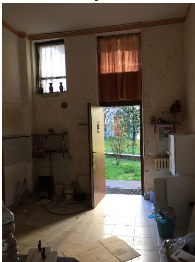
Foto 10 - Soggiorno con cucina a vista