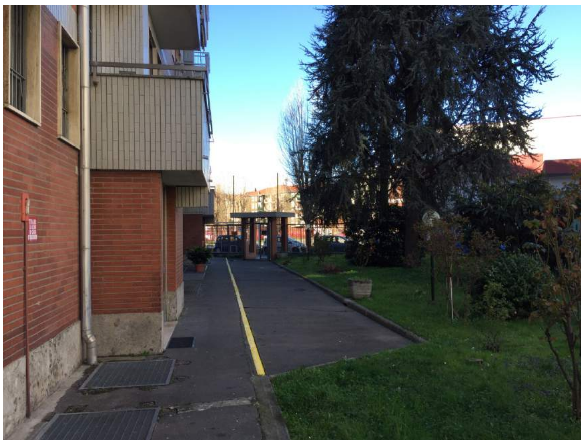
Foto 05 - Vialetto interno nel cortile comune del fabbricato