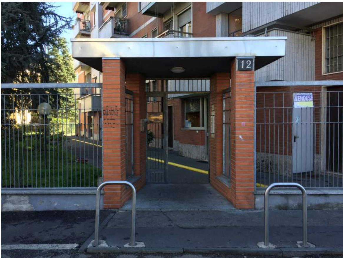
Foto 04 - Accesso al fabbricato al civico 12 di via Ungaretti