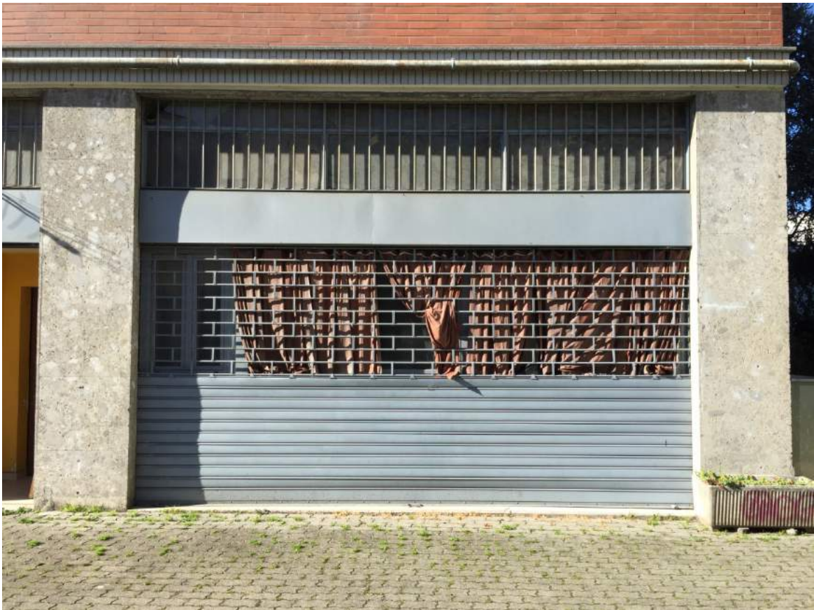
Foto 08 - Prospetto laterale dell'unità immobiliare sul cortile comune