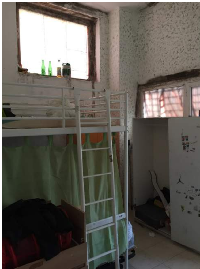
Foto 18 - Camera