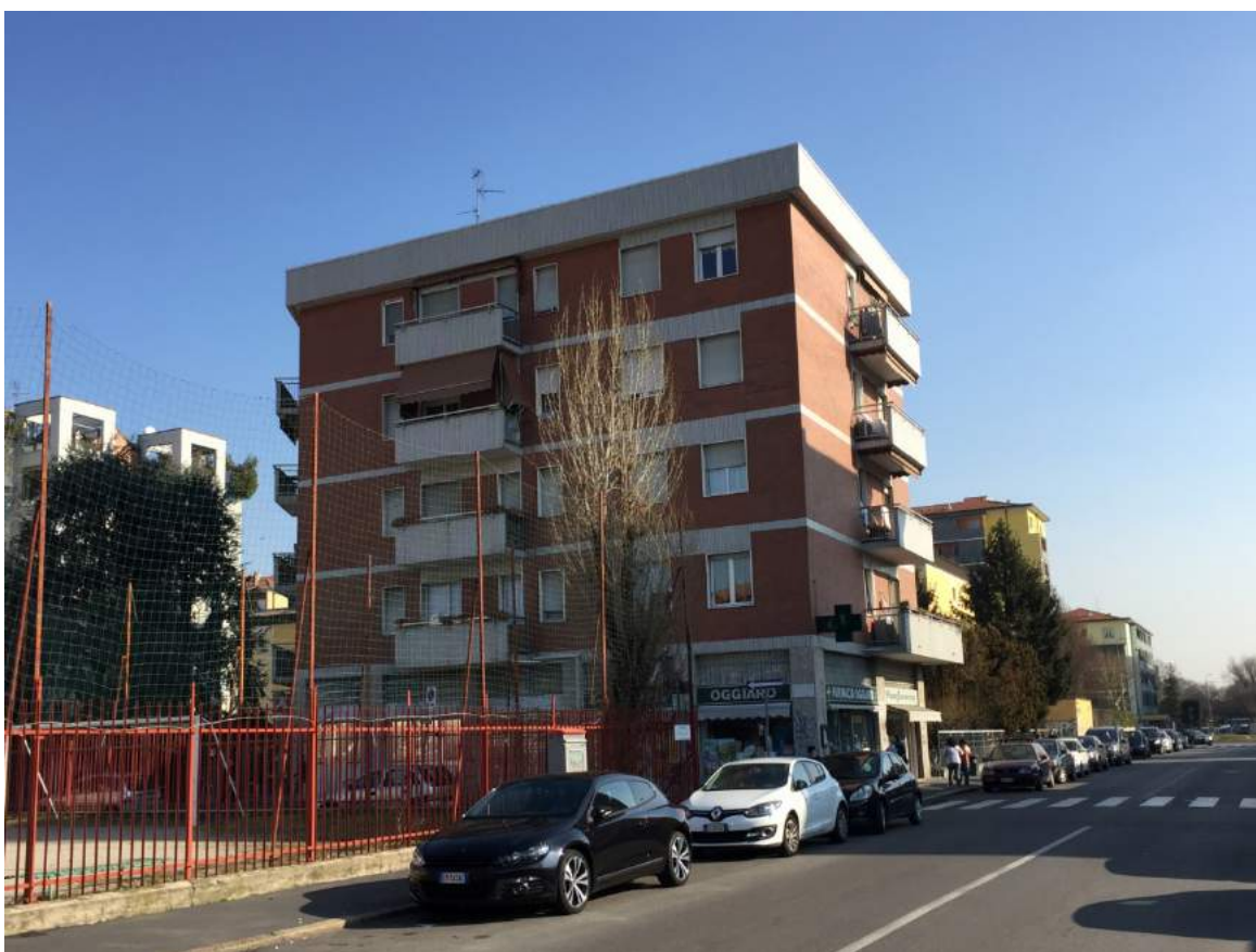
Foto 02 - Il fabbricato su via Trilussa