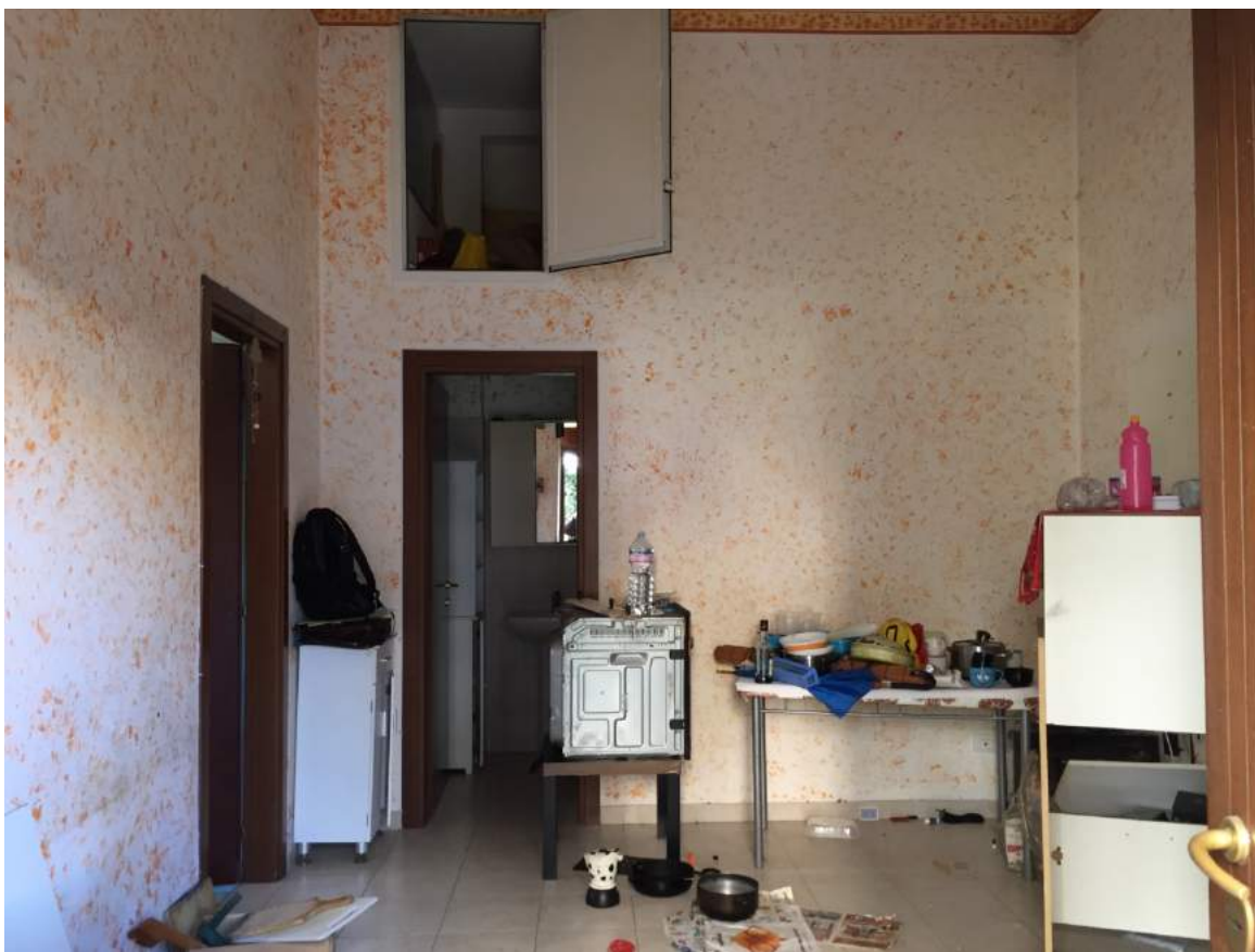
Foto 16 - Soggiorno