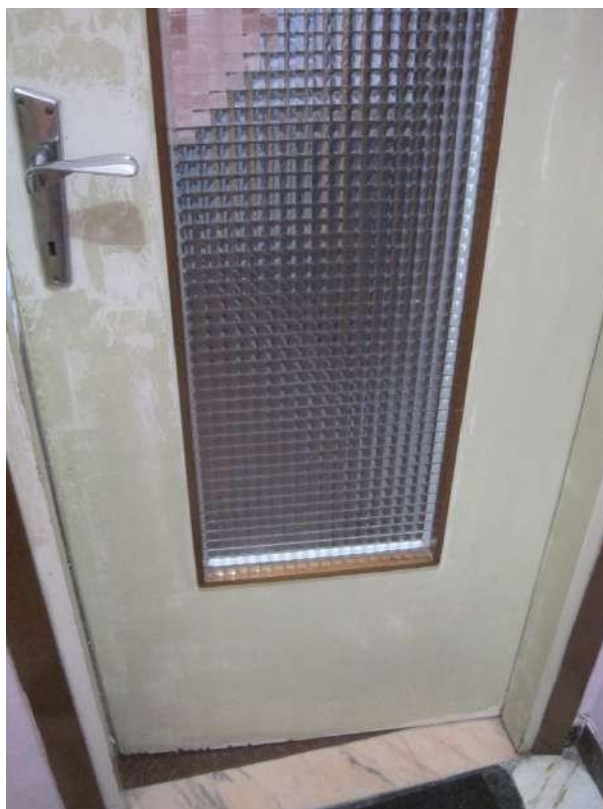
Dettagli □ Porta del bagno