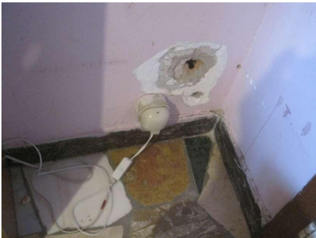
Dettagli □ Impianto elettrico e telefonico