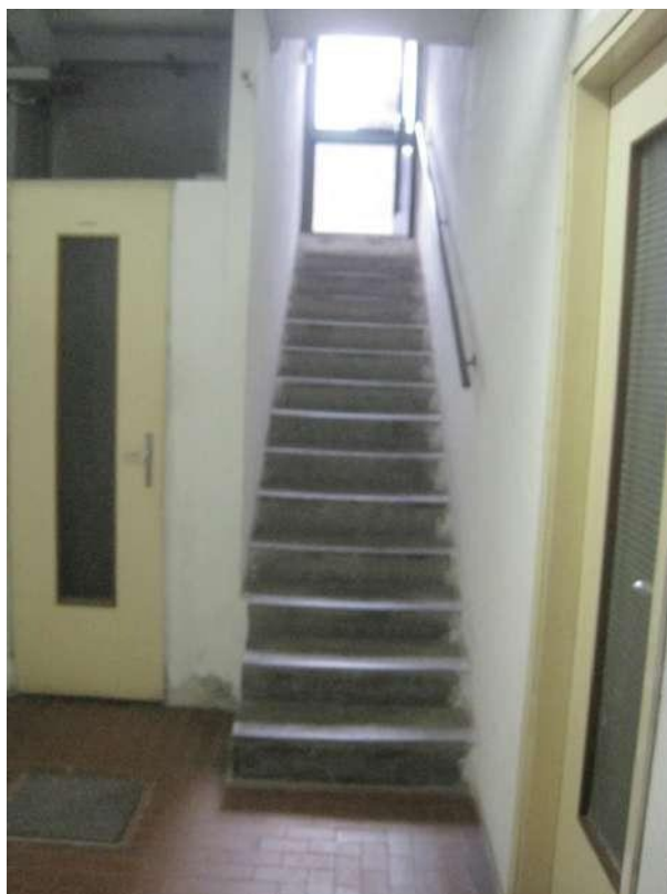
Scala di accesso al piano seminterrato