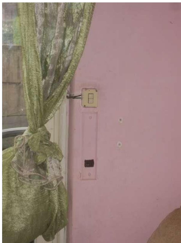
Dettagli □ Tapparella del soggiorno-pranzo