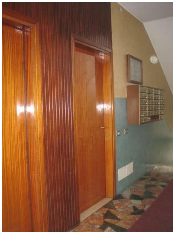
Porta di ingresso dell'unità immobiliare pignorata