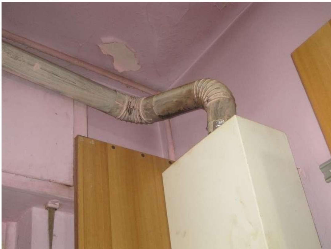
Dettagli □ Canna fumaria della caldaia