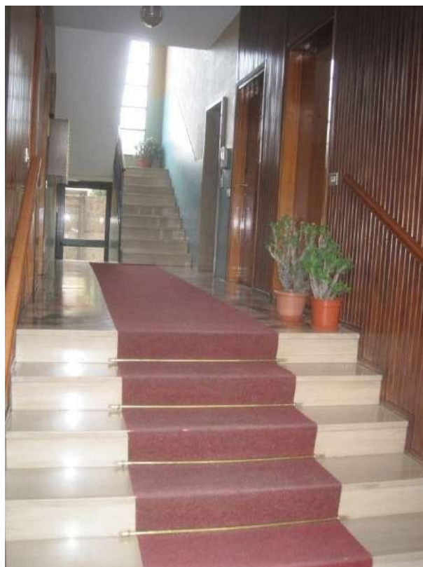
Atrio di ingresso dell'edificio