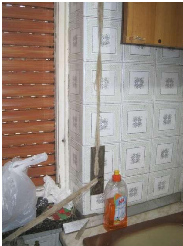
Dettagli □ Tapparella della cucina