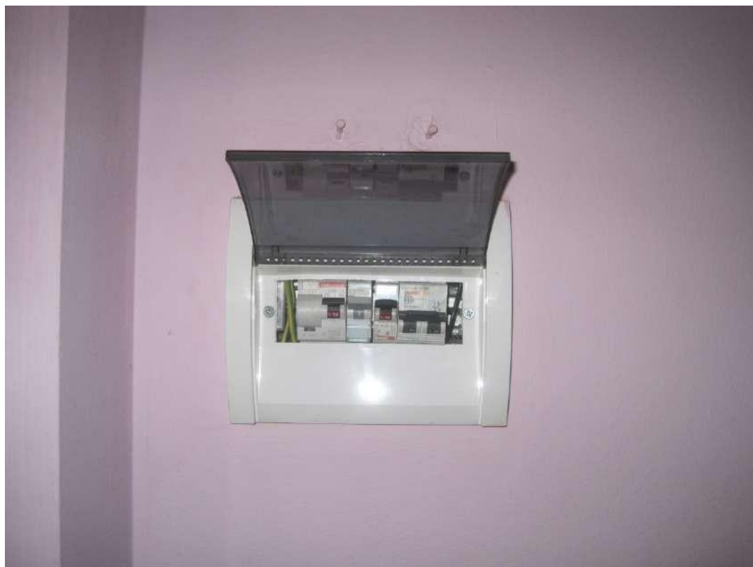
Dettagli □ Quadro elettrico generale