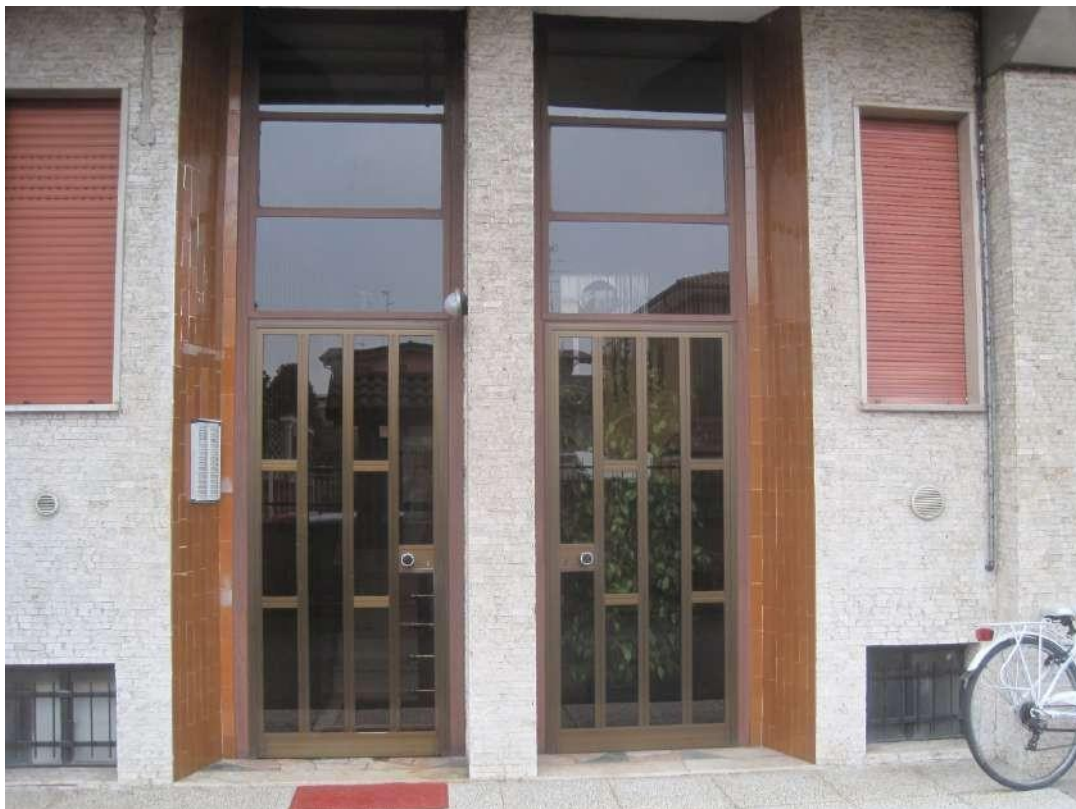
Portoni di ingresso dell'edificio