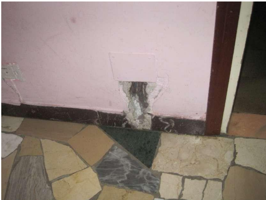
Dettagli □ Impianto elettrico