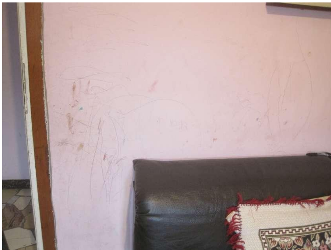
Dettagli □ Parete del soggiorno-pranzo