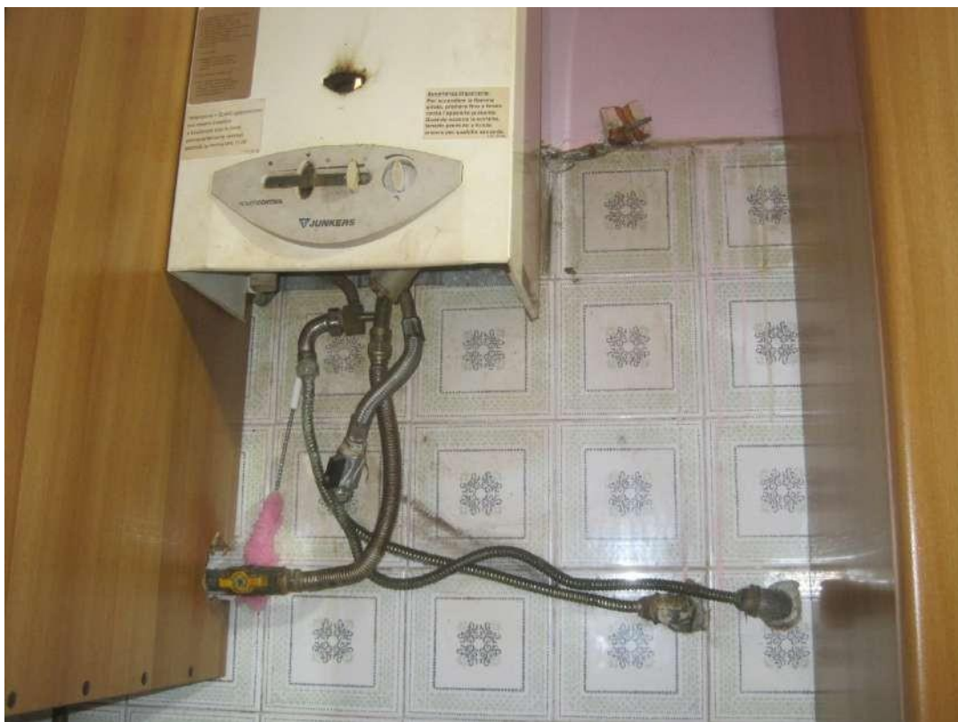
Dettagli □ Tubazioni gas/acqua della caldaia