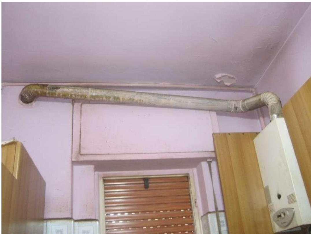
Caldaia per produzione acqua calda sanitaria e relativa canna fumaria