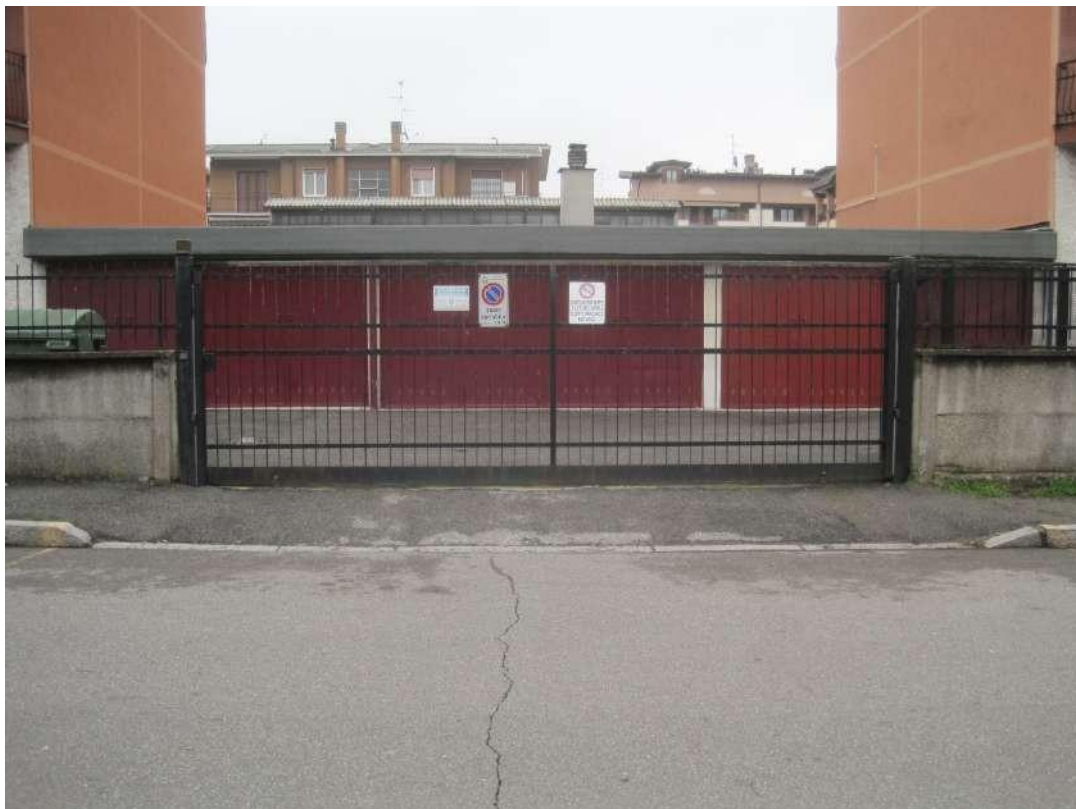
Cancello carraio dell'edificio