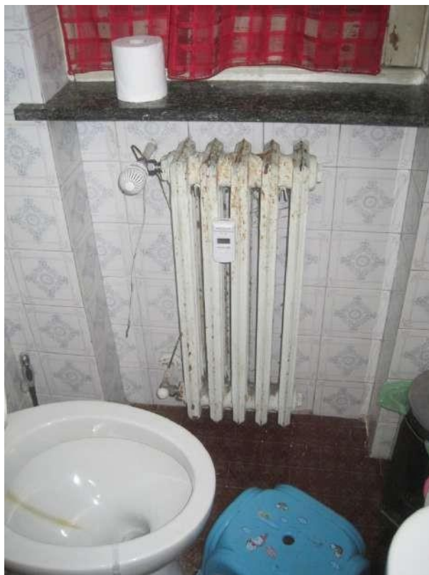
Dettagli □ Radiatore del bagno