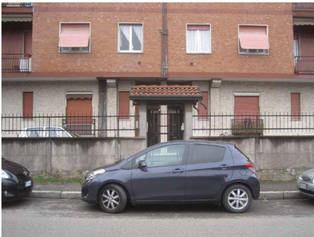
Cancello pedonale dell'edificio