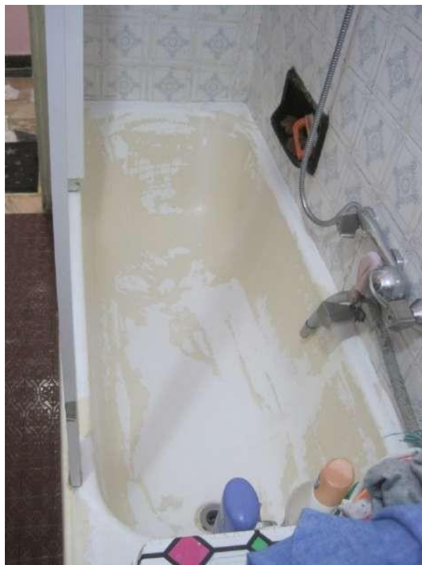
Dettagli □ Vasca da bagno