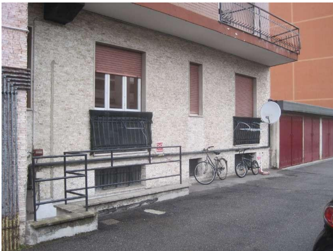
Fronte posteriore dell'edificio □ Finestre dell'unità immobiliare pignorata