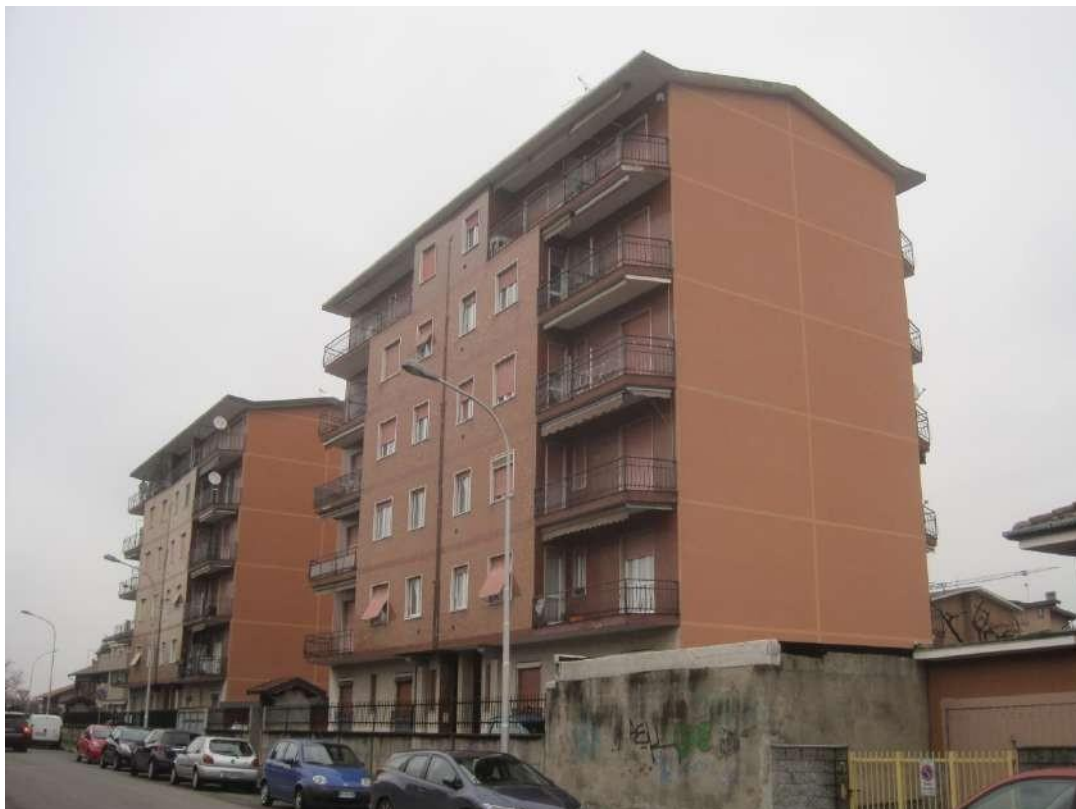
Fronte anteriore dell'edificio