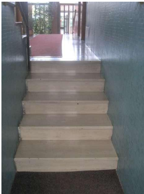
Scala di accesso al piano seminterrato