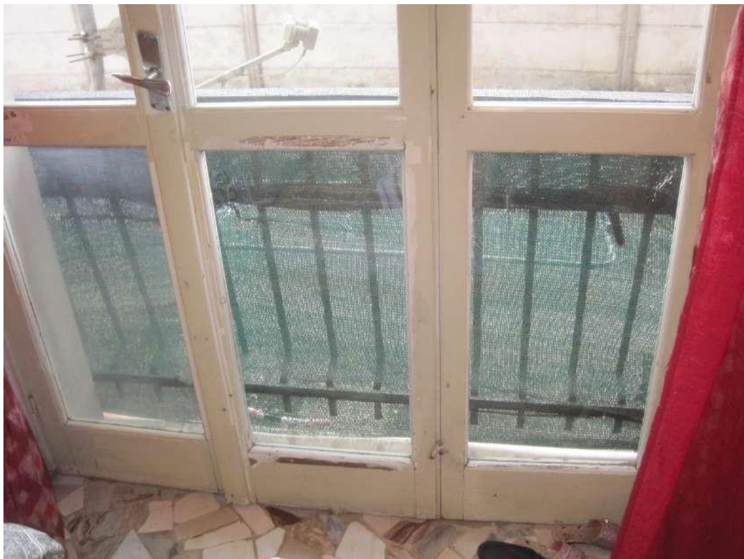
Dettagli □ Finestra della camera da letto