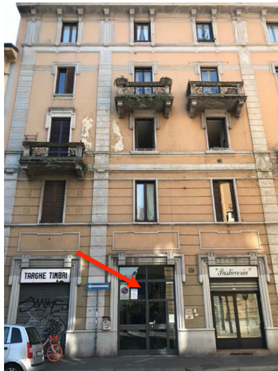
Prospetto principale - Foto _ 4

Abitazione _ Via Popoli Uniti, 17 _ Milano