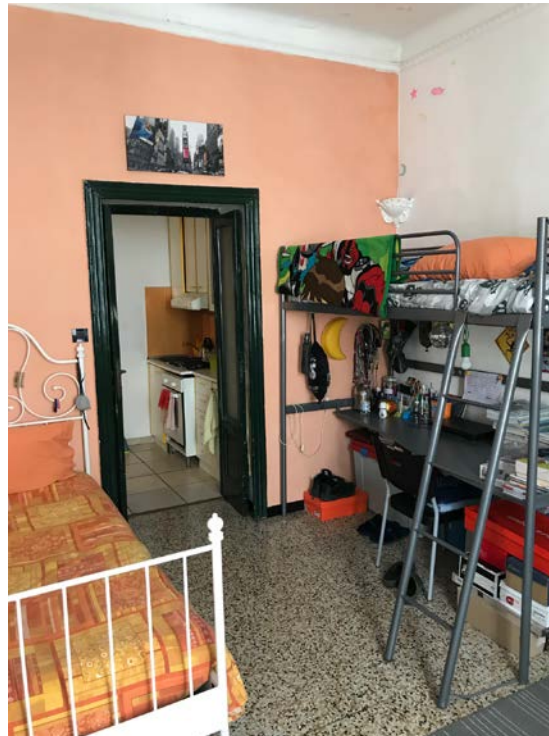
Camera da letto - Foto _ 13

Abitazione _ Via Popoli Uniti, 17 _ Milano