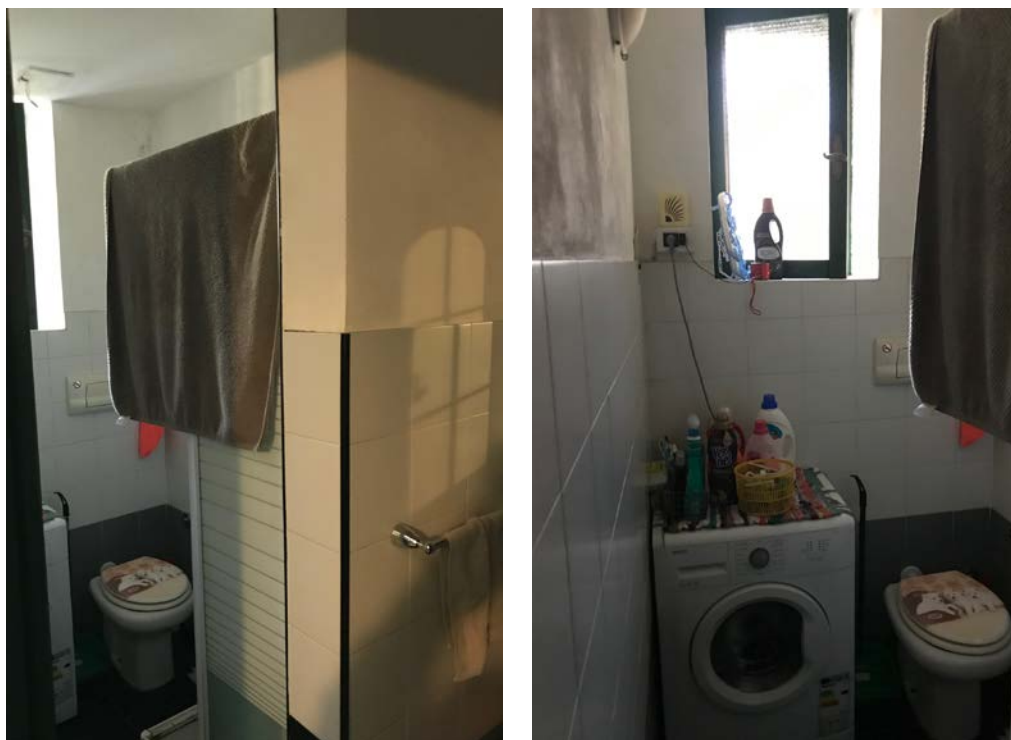
Antibagno – Bagno - Foto _ 15 -16

Abitazione _ Via Popoli Uniti, 17 _ Milano