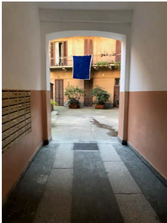
Androne d'ingresso - Foto _ 5

Arch. Giuseppe Barone _ Albo CTU n. 15129