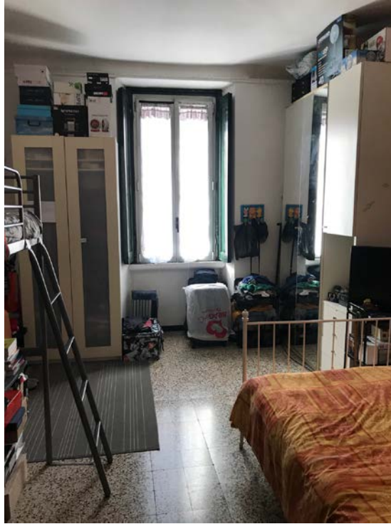
Camera da letto - Foto _ 12

Arch. Giuseppe Barone _ Albo CTU n. 15129