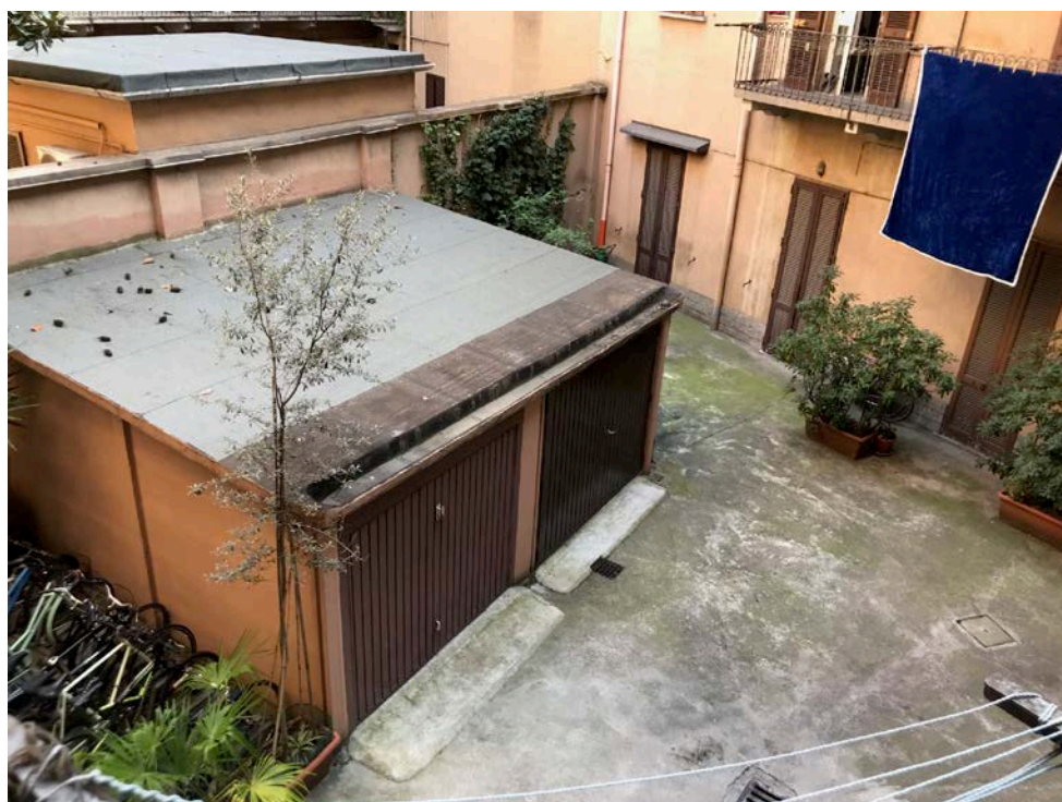
Cortile in comune - Foto _ 6

Abitazione _ Via Popoli Uniti, 17 _ Milano