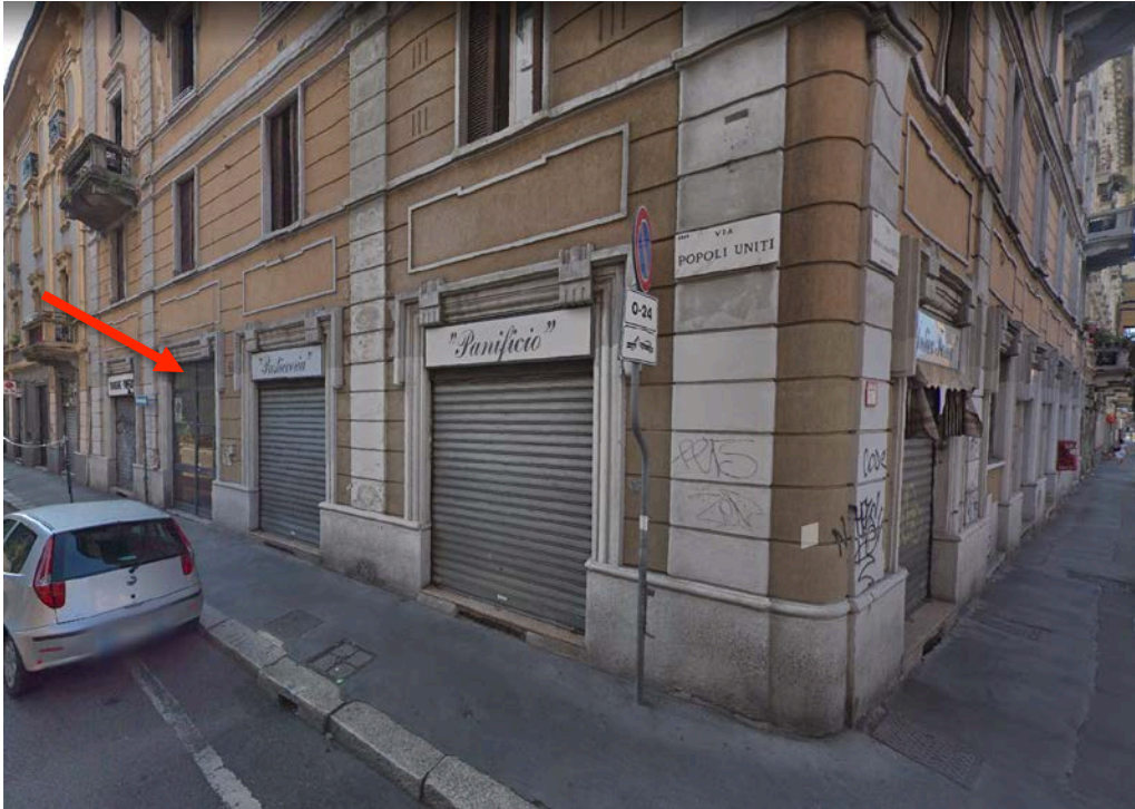
Angolo con la Via Venini - Foto _ 3

Arch. Giuseppe Barone _ Albo CTU n. 15129