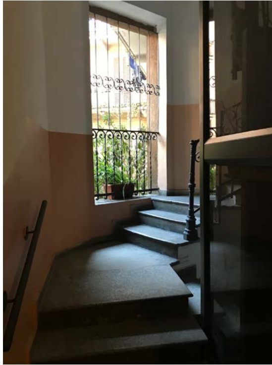
Scala di collegamento ai piani - Foto _ 7

Arch. Giuseppe Barone _ Albo CTU n. 15129