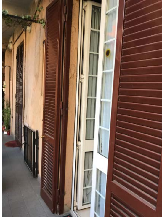
Ingresso dal ballatoio in comune - Foto _ 9

Arch. Giuseppe Barone _ Albo CTU n. 15129