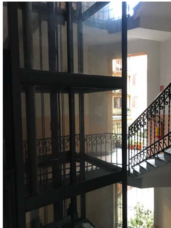
Scala di collegamento ai piani - Foto _ 8

Abitazione _ Via Popoli Uniti, 17 _ Milano