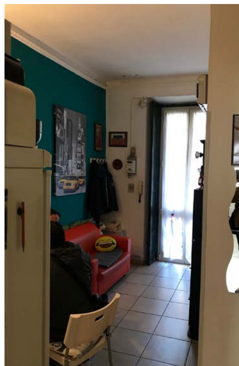
Cucina - Soggiorno - Foto _ 10 -11

Abitazione _ Via Popoli Uniti, 17 _ Milano